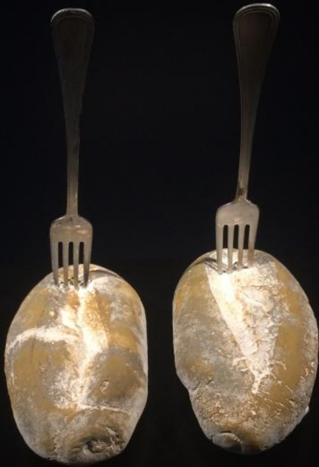
Two forks stuck into two large, round, golden-brown objects, possibly potatoes or bread, against a black background.