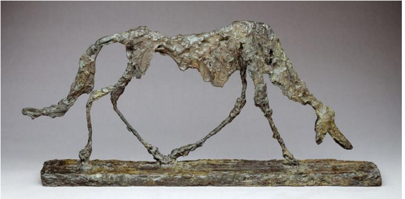
Alberto Giacometti, Cane.

dell'attore che vuole conoscere meglio se stesso. In bestie più evolute, come certi primati e volatili, possiamo persino constatare che essi imitano le nostre voci, o versi e movimenti di altri esseri animati, o fenomeni naturali come la pioggia, a volte anche al cospetto di un pubblico umano, forse persino per il desiderio gratuito di entrare in relazione con noi (si pensi al pappagallino che ripete il nostro nome, imitando il nostro linguaggio). Persino negli animali si potrebbe così parlare di “animalescenza”, poiché guardando i loro comportamenti inutili sprofondiamo in qualcosa che prima non ci era noto e che non ci aspettavamo da loro.