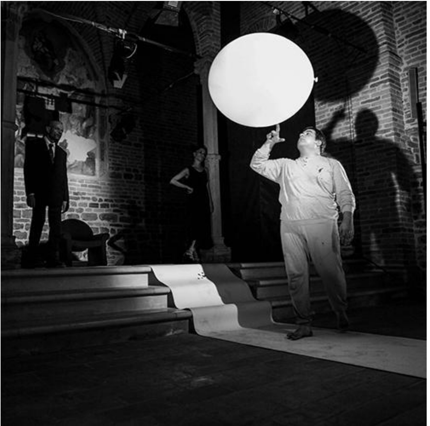
Teatro Rebis, Il papà di Dio.

Ciascuna di queste entità divine si caratterizza, poi, per l'esercizio di una disciplina peculiare. Il "papà-di-dio" è padrone dell'architettura. Egli parte da un progetto chiaro, preciso, ripetibile di "mondo" e di "individuo", pertanto non può mai fallire nel suo proposito. I suoi risultati saranno sempre impeccabili ed eccellenti. Lo "zio-di-dio" può forse essere detto il detentore della musica e della danza leggera o disimpegnate. Egli è un artista del piacere: sa come prolungare il godimento ed escludere ogni dolore, senza creare né distruggere qualcosa di altro da sé. Infine, dio e Satana praticano invece il teatro. Se del resto è solo nel nostro mondo imperfetto dominato dalla morte e dal dolore che l'arte teatrale trova spazio o senso, perché essa tenta in fondo di scongiurare la nostra paura di morire e le nostre sofferenze, allora solo divinità imperfette possono essere in un qualche modo all'origine di tale arte. Vi è di più, solo dio e Satana (e non il papà-di-dio, né lo zio-di-dio) risultano essere potenziali cercatori di teatro, intanto come registi del nostro cosmo, volendo anche come suoi attori. E se è così, anche loro provano a conoscere i lati più profondi della