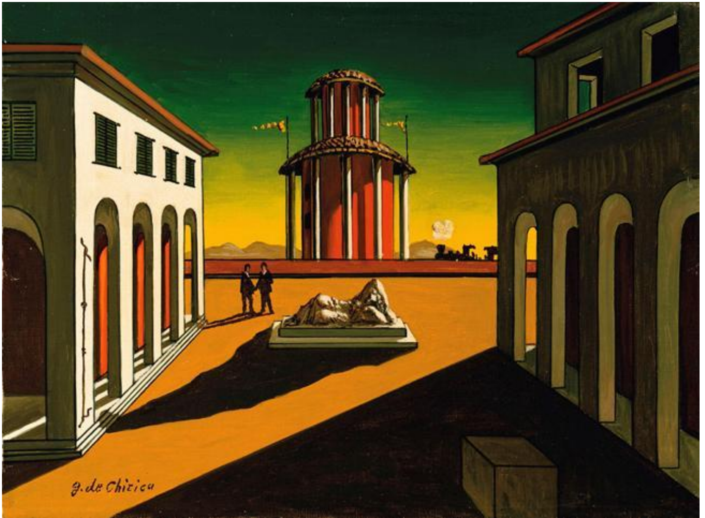
Giorgio De Chirico, Visioni urbane.

loro natura o essenza, andando oltre quanto già conoscono e tentando di creare qualcosa di diverso/innovativo. Come noi umani pratichiamo la «umanescenza», così dèi del genere praticano una sorta di “diviniscenza”.