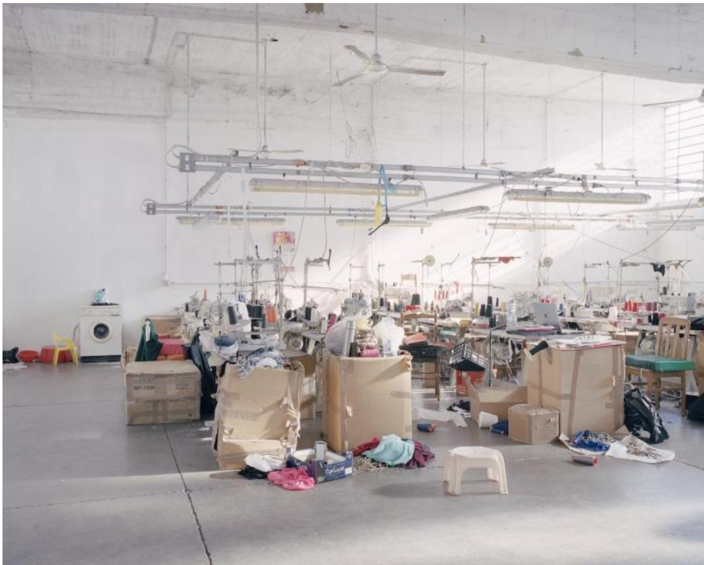
Michele Borzoni, Laboratorio tessile cinese posto sotto sequestro dalla polizia municipale © Michele Borzoni/Terraproject.

Cos'è oggi la "forza lavoro"? Rispondono le immagini: sono i 1550 candidati iscritti all'esame per l'assunzione di 40 storici dell'arte da parte del ministero per i beni e le attività culturali, i 1099 candidati per l'assunzione di un'infermiera presso l'ospedale di Cremona, le 830 persone che lavorano negli 86.000 mq dei capannoni di Amazon a Castel San Giovanni in provincia di Piacenza, con le sue merci disposte su milioni di chilometri di scaffalature, dove le consegne vengono effettuate al ritmo di una ogni quattro secondi. Si può aggiungere altro?