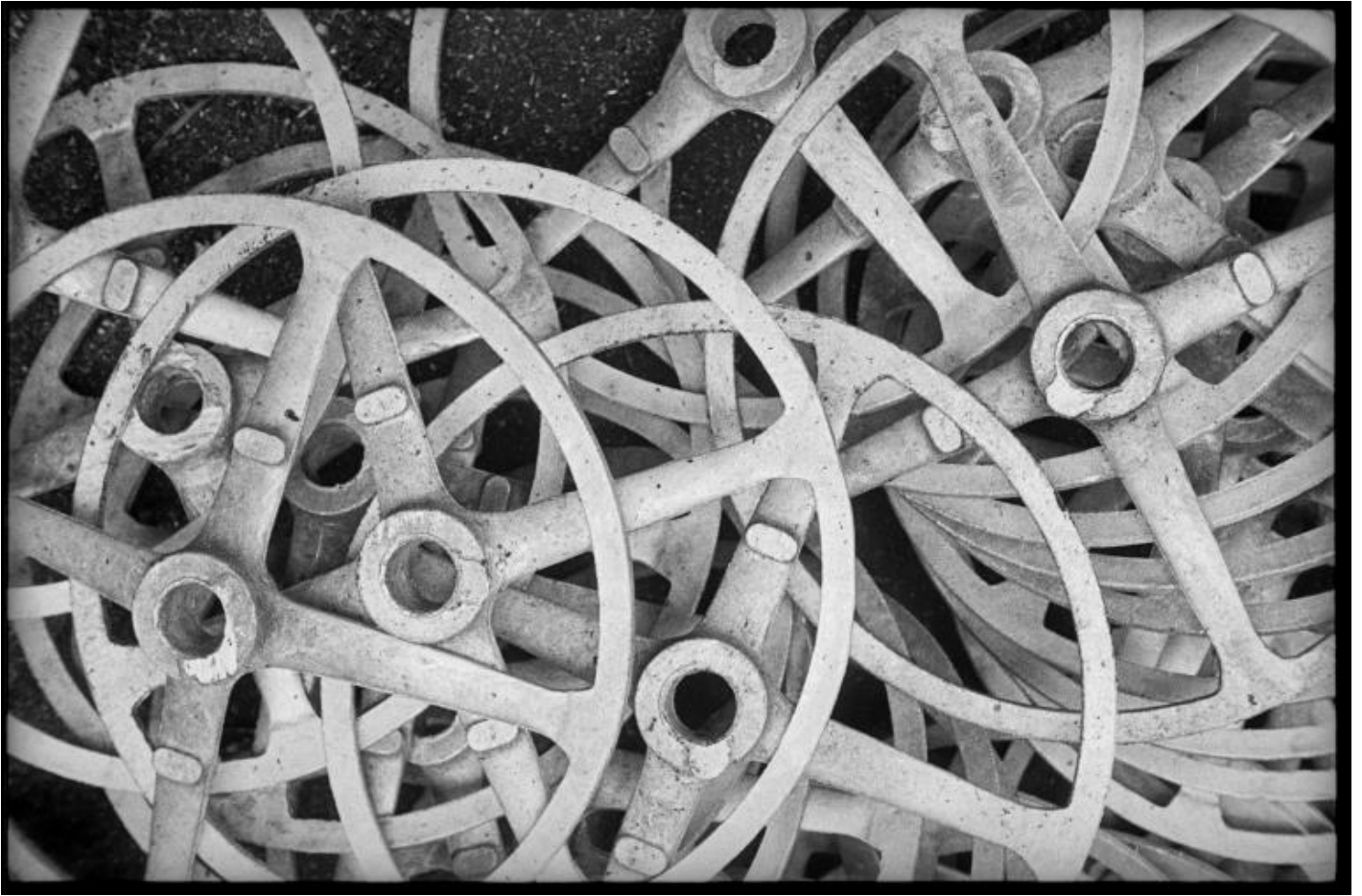
Alexander Rodchenko, Volanti, dalla serie "Stabilimenti automobilistici amo", Mosca, 1929 © Alexander Rodchenko by Siae 2017, Collection of multimedia art museum, Moscow / Moscow house of photography museum.