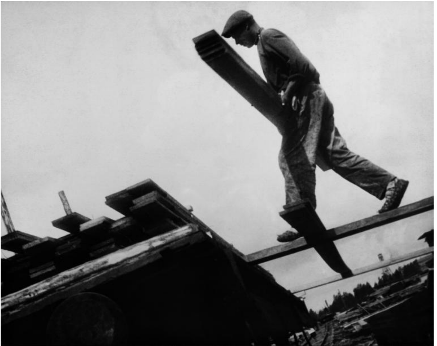
Alexander Rodchenko, Fabbrica di legname “vakhtan”, regione del Nijny Novgorod, 1930 © Alexander Rodchenko by Siae 2017, Collection of multimedia art museum, Moscow / Moscow house of photography museum.

Così, mentre le immagini del lavoro minorile scattate da Mimmo Jodice nei quartieri di Napoli si riflettono nei volti alienati dei lavoratori ritratti da Lee Friedlander nella serie “At work”, i paesaggi di Josef Koudelka , stampati in un formato maestoso, mostrano solo spazi deserti come miniere a cielo aperto, cave, camini che fumano all’orizzonte. L’assenza dell’uomo è compensata dalle tracce del suo passaggio, come tante ferite dopo un disastro. Le stesse cicatrici a cui ha dato forma Mitch Epstein con la serie “American Power” (e le immagini dell’area di Lynch nel Kentucky orientale scattate da un fotografo professionista prima e dopo la trasformazione industriale dal 1917 al 1920), nella quale dal 2003 indaga le conseguenze della produzione energetica in ventisei stati: dalle centrali nucleari alle dighe delle centrali idroelettriche, dai pannelli solari agli impianti eolici. O come fa John Myers con le sue foto scattate fra il 1981 e il 1988 nel “black country” inglese, le cittadine di Lye, Brierley Hill, Cradley Heath, cuore della rivoluzione industriale oggi riconvertita a zona di immagazzinamento e vendita al dettaglio di componenti prodotti all’estero.