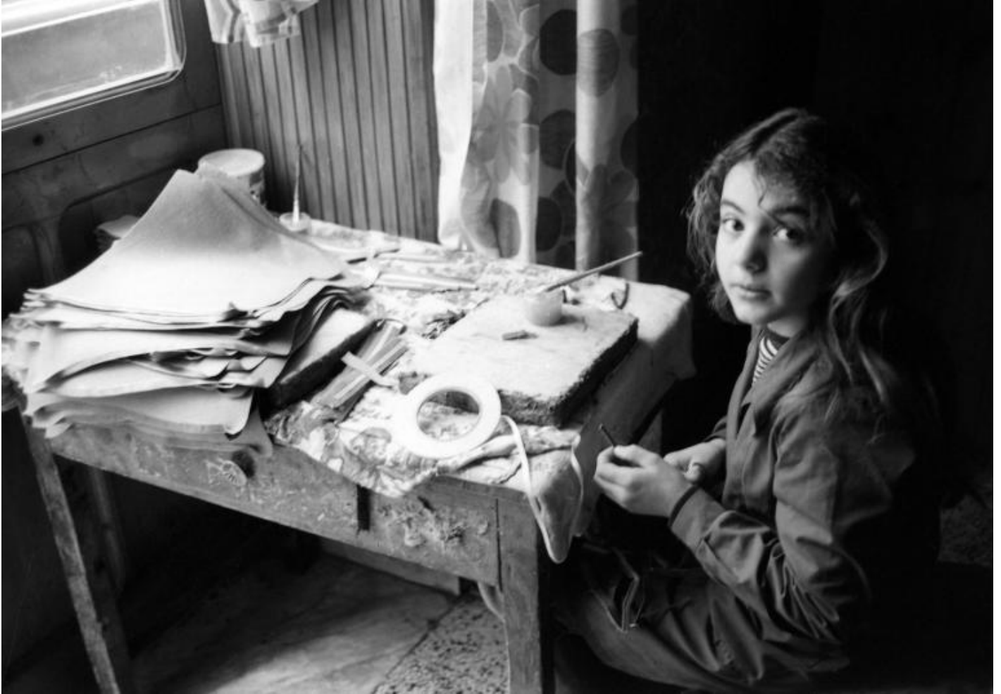
Mimmo Jodice, Napoli, 1973   Mimmo Jodice.

Watanabe. Sino a giungere al vuoto di senso evocato dalla vicenda dell'astronauta Ivan Isto?nikov, riproposta da Joan Fontcuberta , che mette in scena con ironia il rapporto tra la presunta veridicit  dell'immagine fotografica e la sua capacit  di generare inganni. Il 25 ottobre del 1968, dalla base spaziale di Baikonur, venne lanciata in orbita il Soyuz 2. Il cosmonauta scomparve durante la missione e il governo sovietico non volle ammettere di aver perso un uomo nello spazio. Secondo la versione ufficiale, il Soyuz 2 era un'astronave completamente automatizzata, senza equipaggio a bordo.