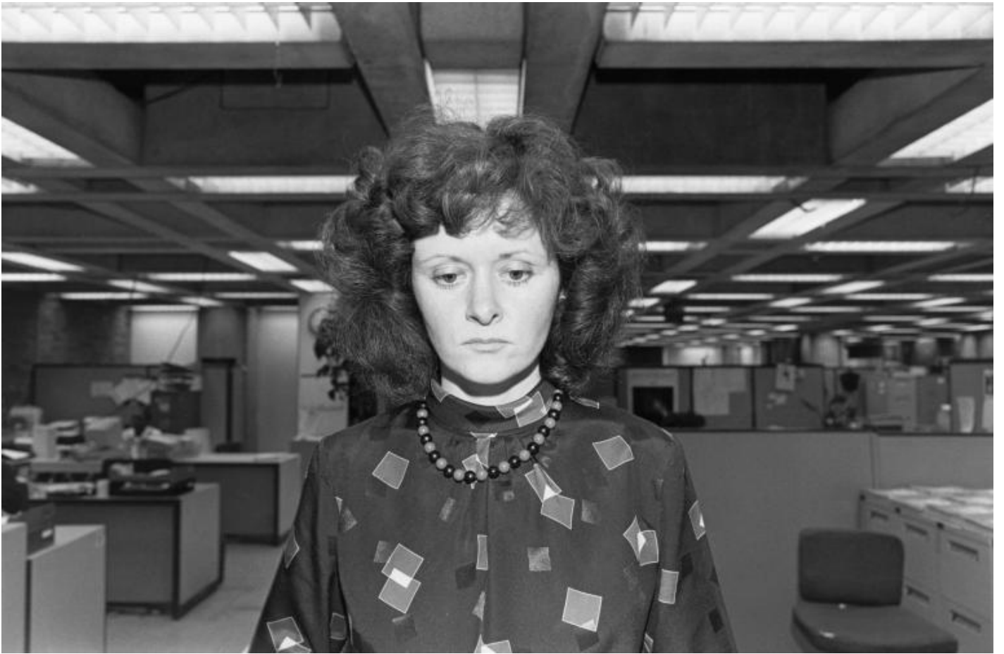
Lee Friedlander, Boston, 1986