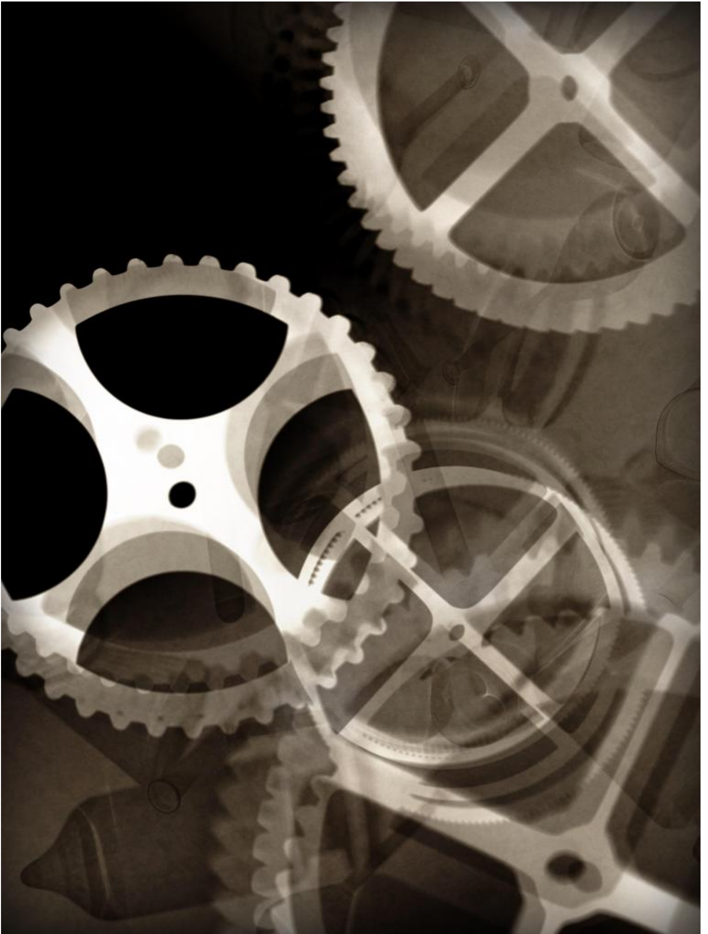
Thomas Ruff, PHG.09_II, 2014 dalla serie "Fotogrammi"