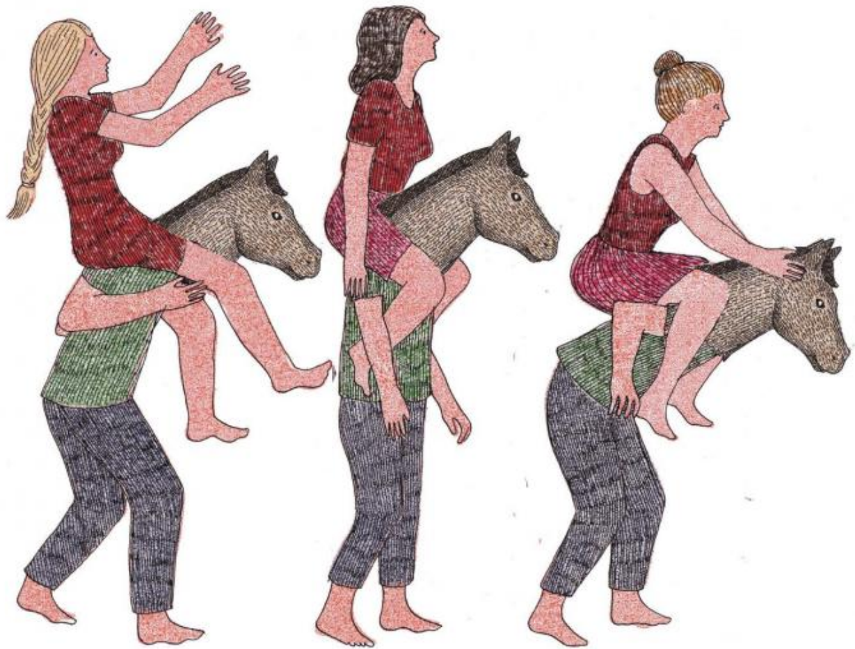
Illustrazione di Marion Fayolle.

“To non vedo perché dovrei sentirmi in dovere di sembrare più giovane di quello che sono. La mia faccia mi piace così com'è, con gli anni scritti sopra; sono i miei anni e ne sono orgogliosa. Ne ho passate tante e sono sopravvissuta, se sembra una reduce non mi dispiace. E nemmeno mi dispiace di essere non magra . Il mio corpo funziona benissimo, e mi sembra che il desiderio di cambiarne dei pezzi, di farsi le labbra più piene, le tette più grosse e quelle strane guance da scoiattolo con la noce in bocca equivalga ad accettare una sorta di schiavitù. Come dire «sono una merce»”