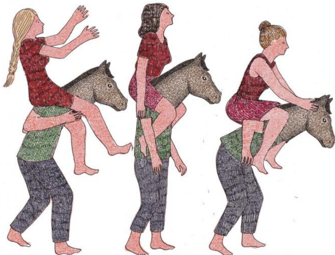
Illustrazione di Marion Fayolle.

Quando un coetaneo conosciuto sul sito le fa notare che le donne della sua età sono viste dagli uomini come trascurate e arrabbiate Stella risponde: