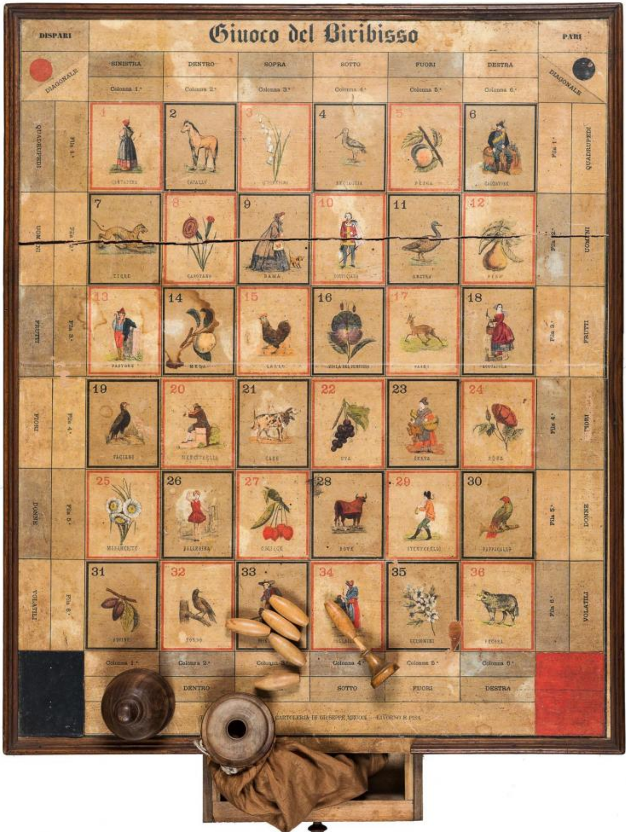
Gioco del Biribisso. Tavoliere su tavolino in legno con 4 piedini e cassetto, prodotto dalla Tipografia Litografia e Cartoleria di Giuseppe Meucci, Livorno-Pisa,