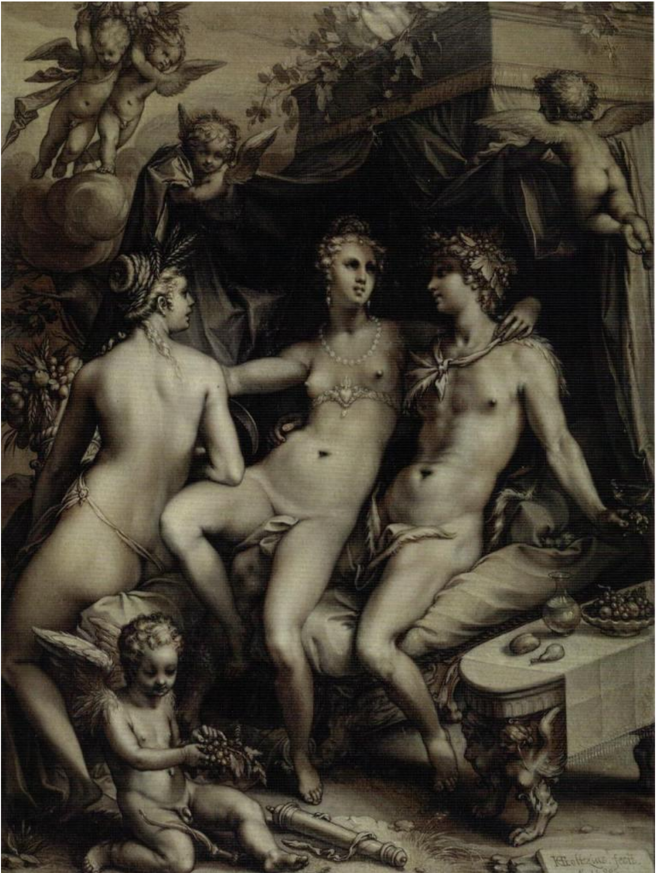
Hendrik Goltzius, Without Ceres and Bacchus Venus would Freeze (Sine Cerere et Baccho Friget Venus), 1599, gesso, inchiostro e olio su carta, The British Museum, Londra