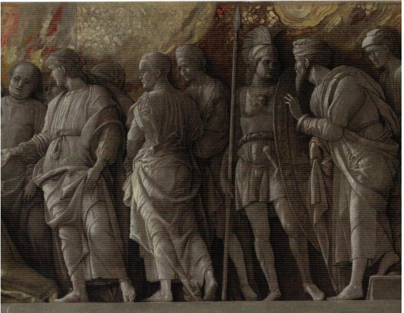
Andrea Mantegna, L'introduzione del culto di Cibele a Roma , 1505-6, tempera a colla su tela, The National Gallery, Londra (particolare).

Molto interessante è anche lo studio dell'interazione tra l'invenzione della stampa e la pittura, sia perché la stampa può riprodurre e diffondere le opere degli artisti – talora sono gli stessi artisti a preparare un monocromo che poi viene trasferito in un'incisione –, sia per gli effetti di trompe l'oeil di alcune incisioni. La ricerca di un effetto simile alla stampa viene riproposto in un dipinto della fine del Settecento del pittore francese Boilly, che ritrae una ragazza alla finestra e inserisce nel quadro alcuni strumenti ottici – un piccolo monocolo e due telescopi – e la riproduzione di un bassorilievo, rendendo tema della composizione la visione, lo sguardo.