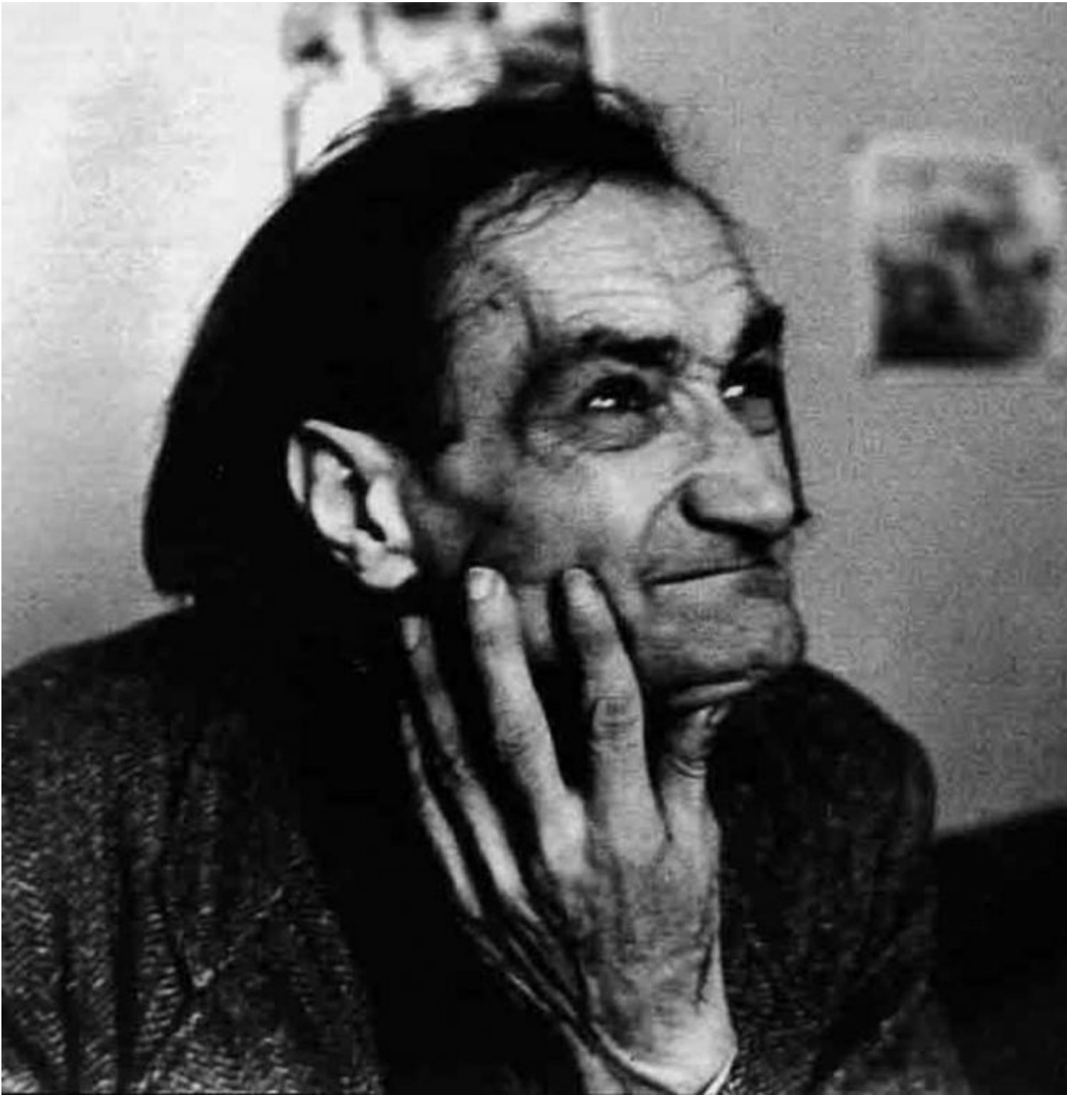
Artaud nel manicomio di Rodez.