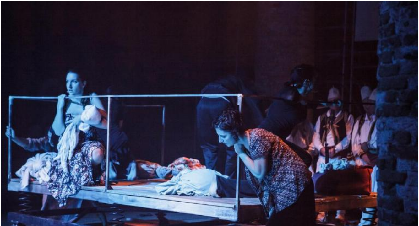
Il naufragio, di Leogrande-Shkurtaç-Tramacere, Biennale Musica 2014, ph. Akiko Miyake.