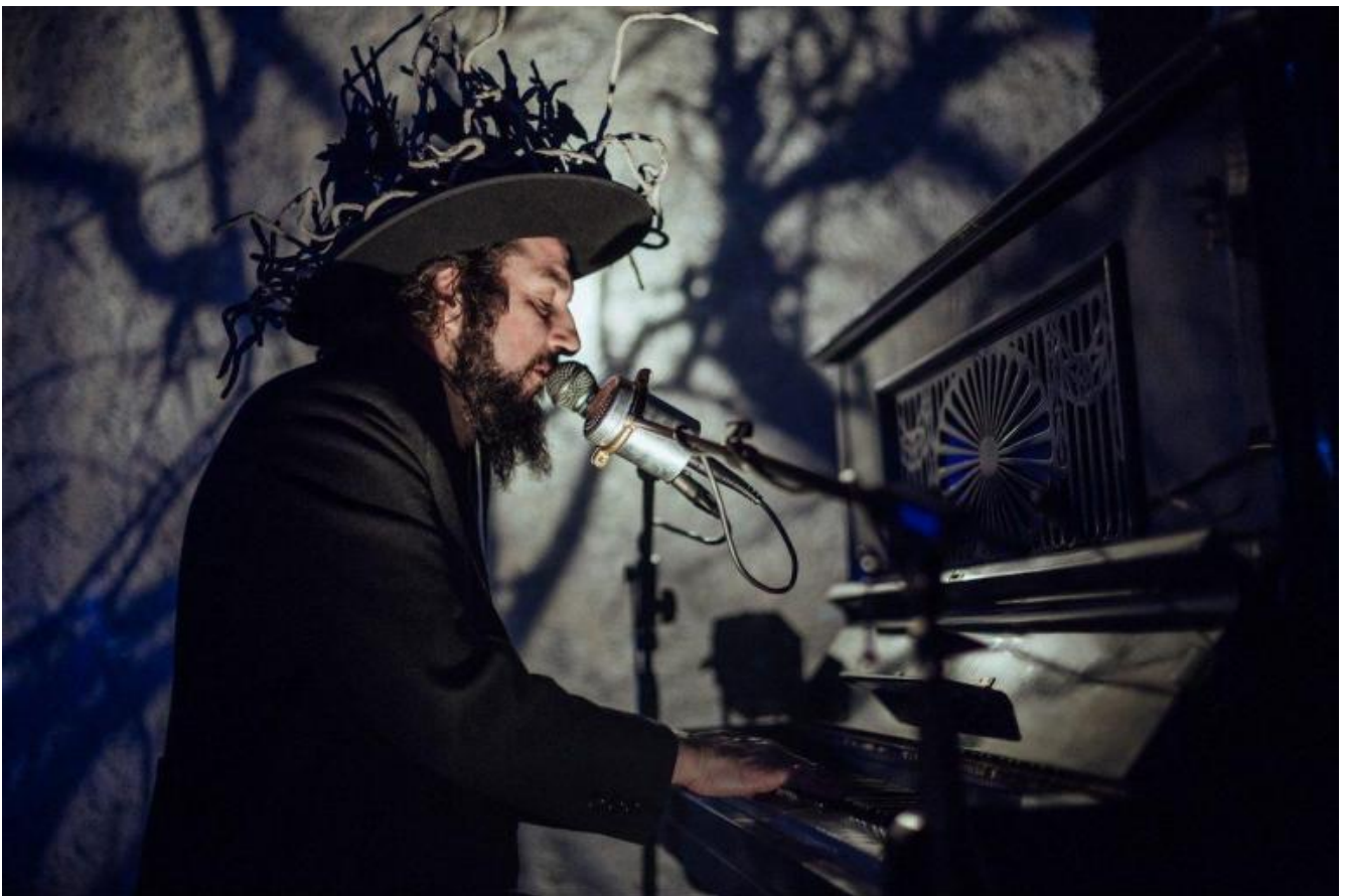
Ombre nell'inverno di Vinicio Capossela, ph. Chico De Luigi.

La drammaturgia italiana, di colpo, si vede proiettata in un possibile confronto – prima lasciato alla volontà dei singoli – che sicuramente segnerà le sue prossime evoluzioni. Oggi il nostro teatro è portatore di una lingua che non si conforma né a quella sorta di koinè che certo teatro contemporaneo europeo sta sviluppando, né all'orizzonte americano orientato allo storytelling. È una scrittura che ha reagito a una storica disattenzione al contemporaneo e ha trasformato questo suo elemento corrosivo in virtuosismo, con punte di genialità creativa che rendono oggi i drammaturghi italiani degli oggetti strani, difficilmente identificabili, ma di sicuro interesse. Non resta che continuare a scrutare l'orizzonte, anche grazie a questa rete di premi e progetti.