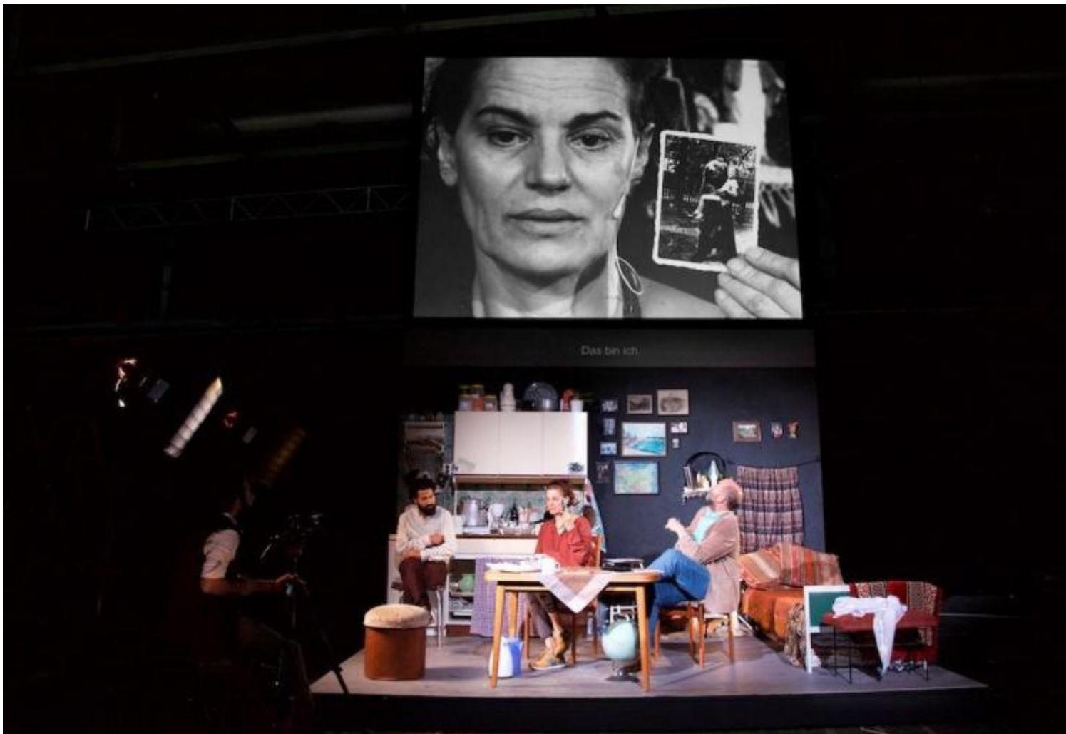
Empire, di Milo Rau, ph. Marc Stephan.