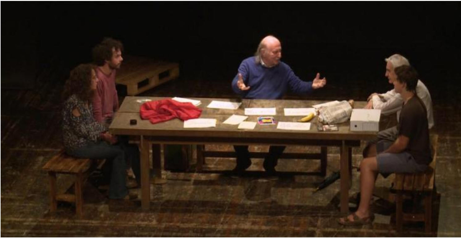
Lettera a una professoressa, di Chille de la Balanza.