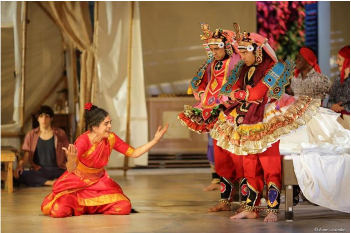
Une chambre in Inde, Théâtre du Soleil, ph. Anne Lacombe.