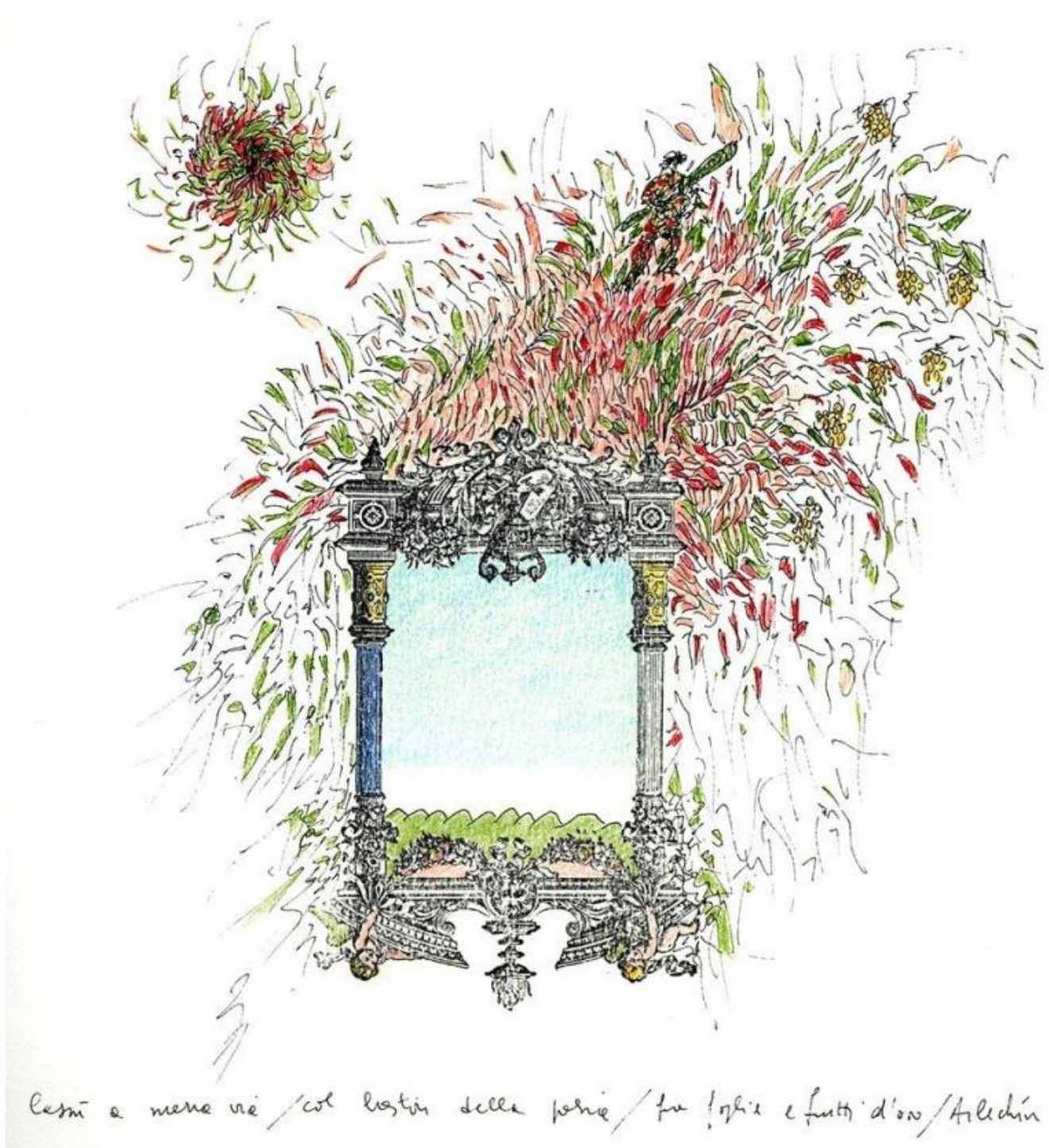
Il Poeta Albero, disegno di Giuliano Scabia.