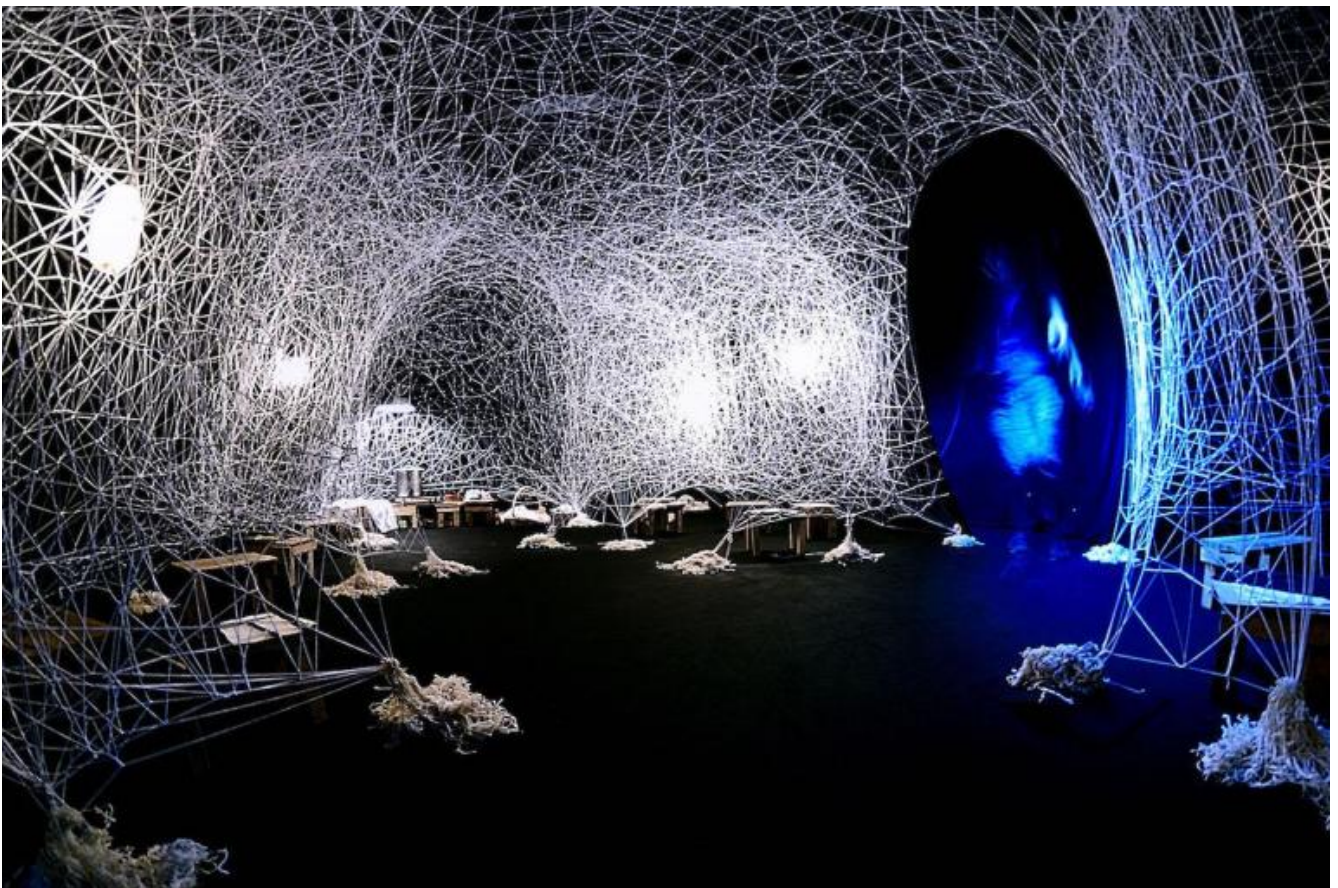
Il filo di Arianna, di Enrique Vargas, ph. Stefano Di Cecio.

Vargas: un teatro che cura (Lorenzo Donati)