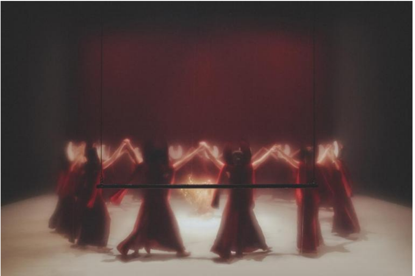
Democracy in America di Romeo Castellucci, ph. Guido Mencari.