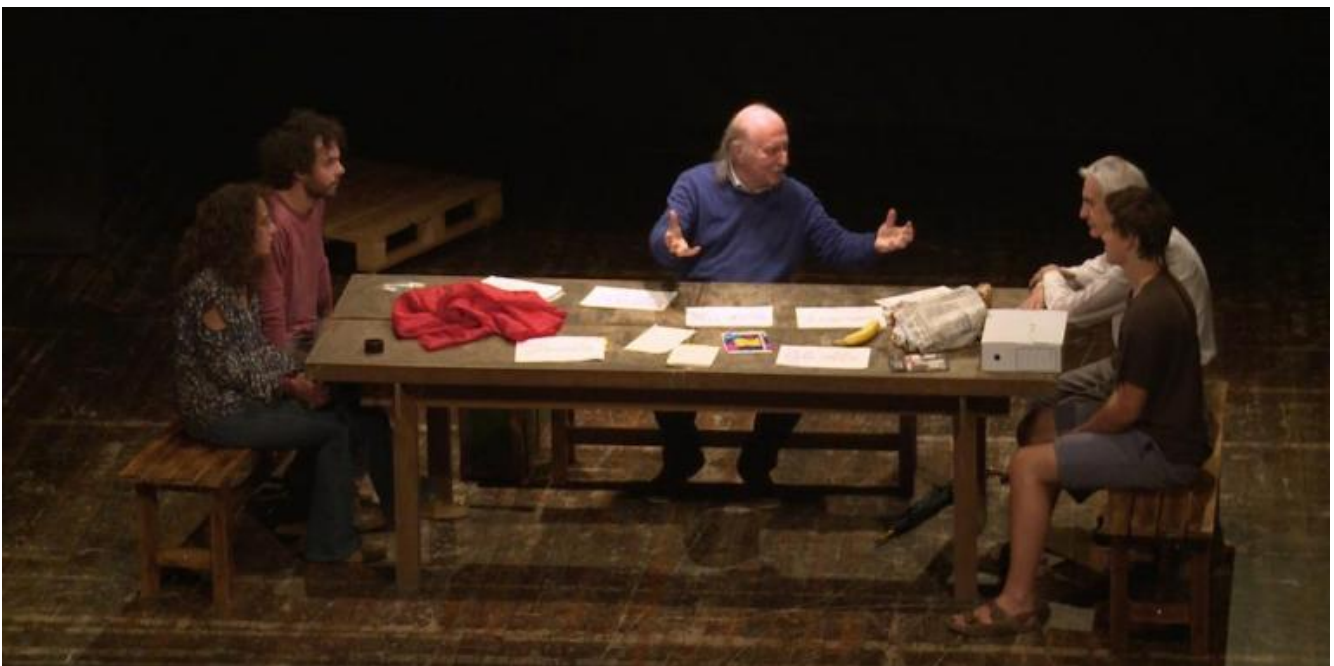
Lettera a una professoressa, di Chille de la Balanza, ph. Paolo Lauri.

Attorno al cartone di Costruire è facile? e al legno di Lettera a una professoressa . dopo che alle cose, mettiamo mano a noi stessi. Una sorprendente esperienza di riscoperta che il cambiamento è di tutti per tutti. Non uno di meno.