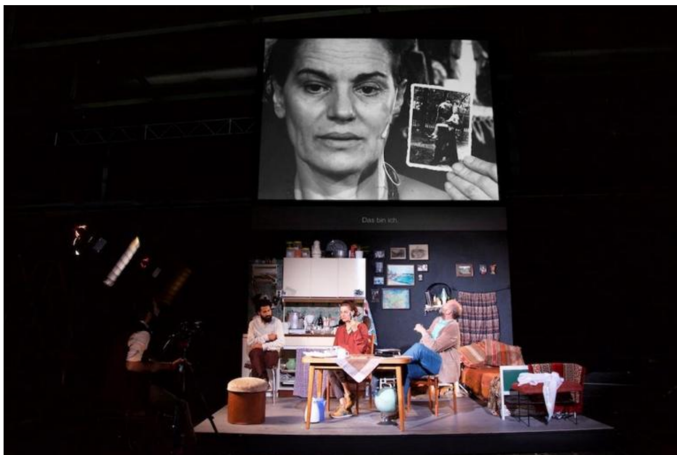
Empire, di Milo Rau, ph. Marc Stephan.