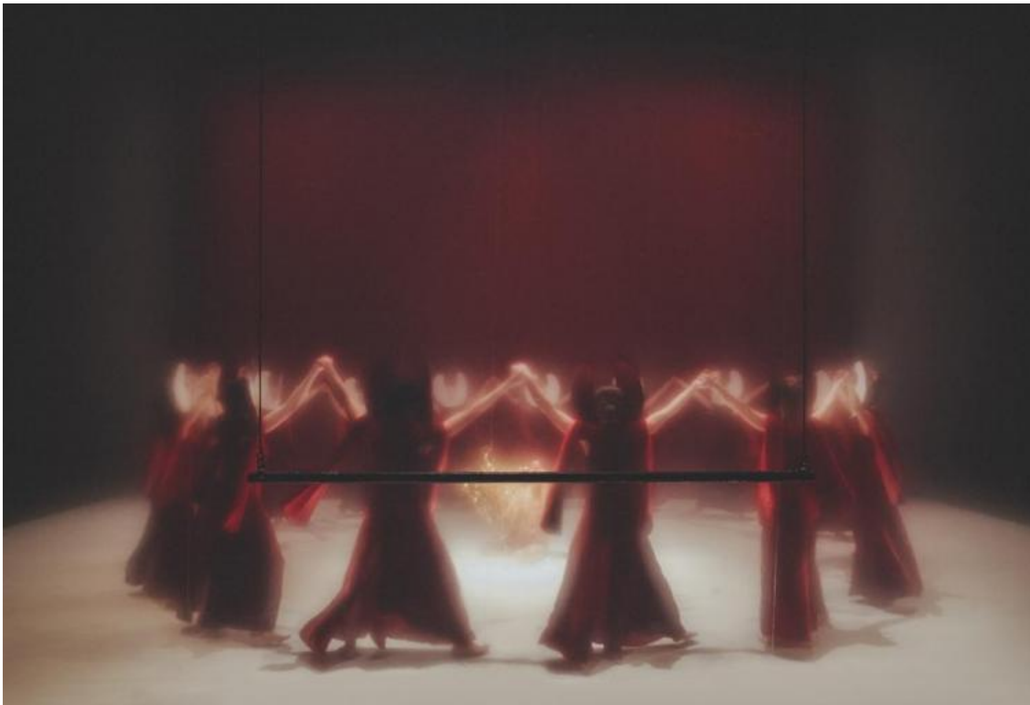
Democracy in America di Romeo Castellucci, ph. Guido Mencari.

Il cambio della guardia è avvenuto, senza uno squillo di tromba: qualcosa deve pur voler dire.