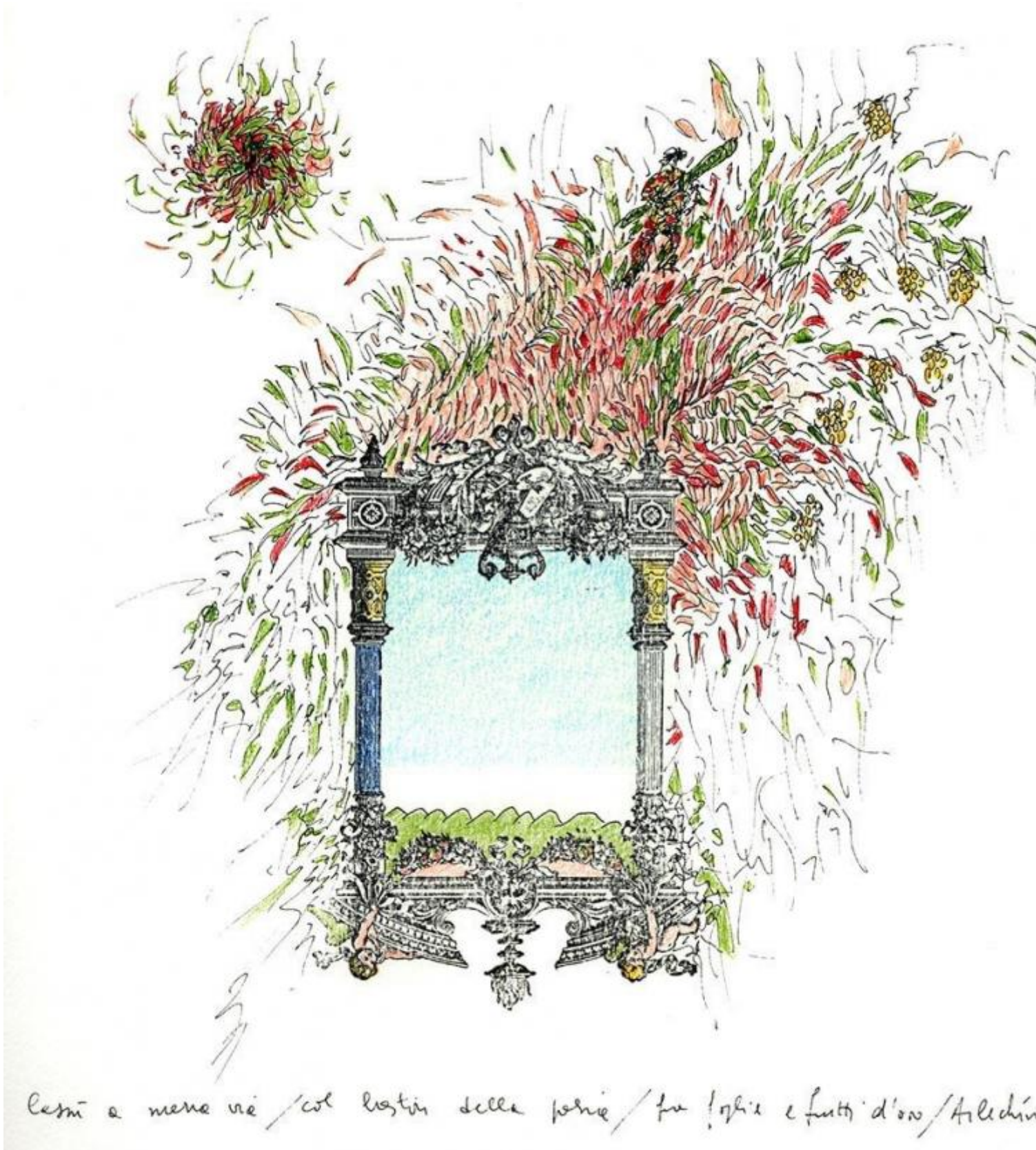
Il Poeta Albero, disegno di Giuliano Scabia.