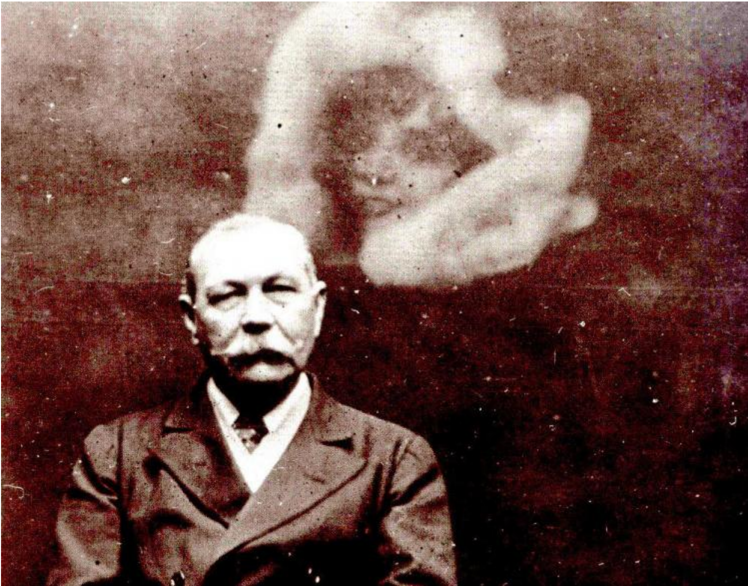
Sir Arthur Conan Doyle in compagnia di uno spirito.

Il sarcasmo e l'abile penna di Conan Doyle sono affabili, il disegno retorico che esse mettono in scena lo è molto meno. La tesi che egli usa ai danni di Houdini è che anche questi fosse un medium e che non volesse rivelarlo per approfittare economicamente dei propri poteri senza intimorire il pubblico. L'idea fu proposta in occasione di alcune note sui fratelli Davenport, entrambi medium di New York, ideatori di un Gabinetto degli spiriti nel quale si facevano rinchiudere con strumenti musicali che, una volta fatto buio, cominciavano a suonare "da soli". «Non c'è dubbio – scrive Conan Doyle –, per nessuno che pesi con cura i fatti, che Ira Davenport fosse un medium autentico. Al di là della testimonianza di migliaia di persone, è evidente in sé che egli potesse in qualsiasi momento ottenere fama e fortuna mondiali dichiarando di essere, insieme a suo fratello, un illusionista e di realizzare le proprie performance grazie a dei trucchi. Sarebbe stata una cosa spaventosa però dal punto di vista di un buon spiritualista e i Davenport andarono avanti, oltre il possibile limite, lasciando che fosse il pubblico a determinare la fonte dei loro poteri».