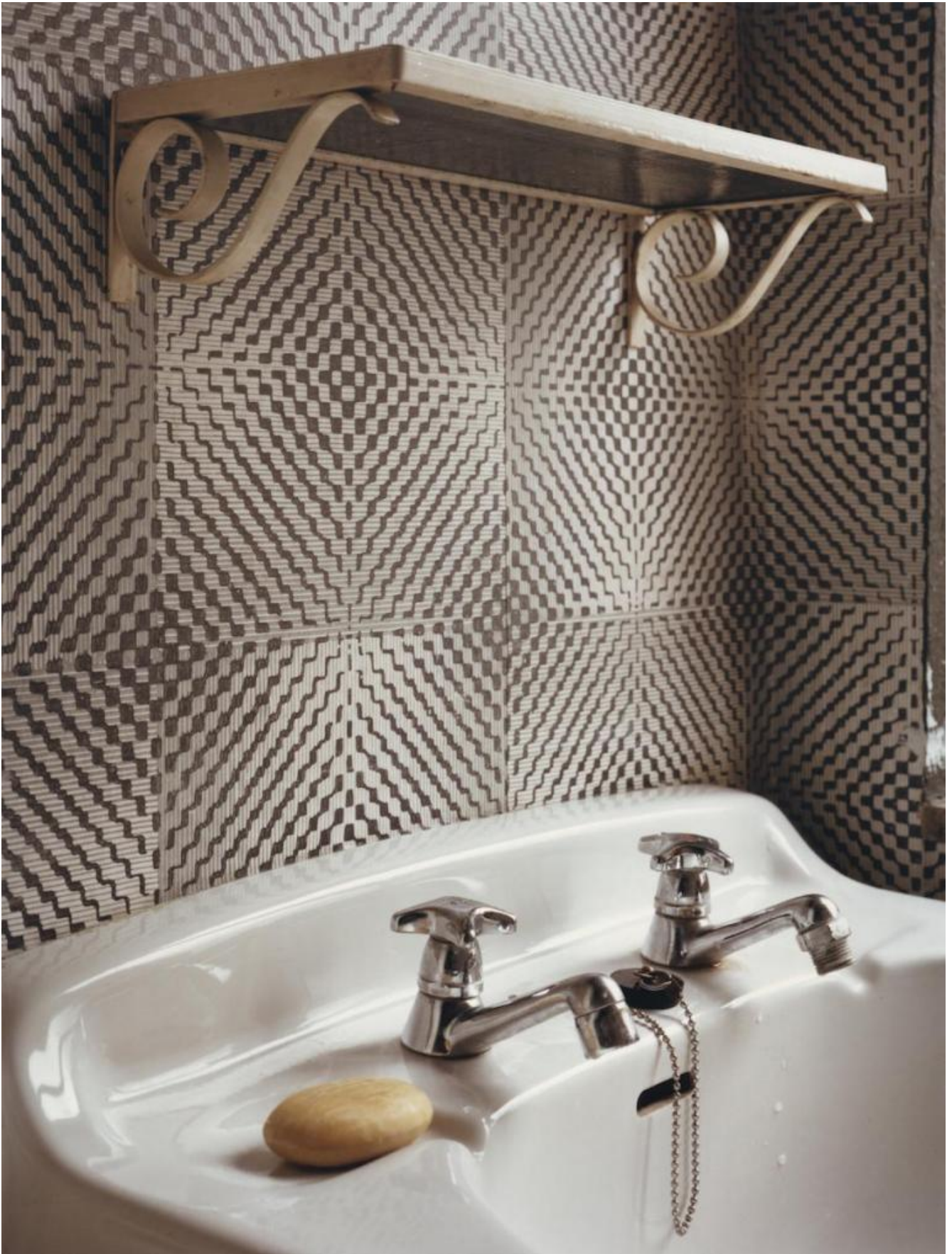
Interieur 1A (Interior 1A) 1979 C-print 27.5 × 20.5 cm.