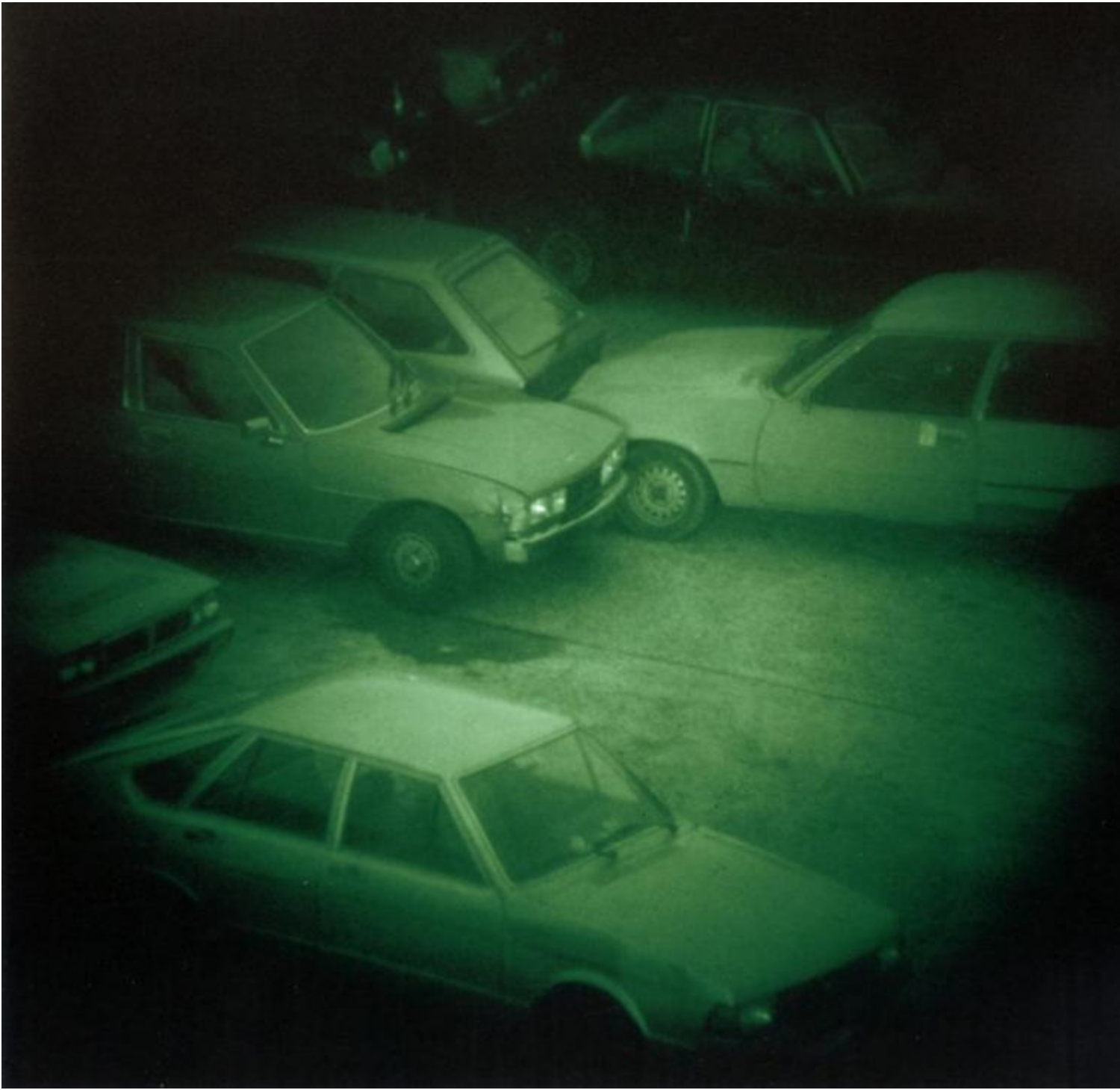
Nacht 9 II (Night 9 II) 1992 C-print 20 × 21 cm © Thomas Ruff.

Tuttavia, a interessare Ruff, è anche il modo in cui la fotografia rispecchia il ritmo veloce della società, della politica, della tecnologia, della cultura, o quello lento dei fenomeni cosmici. In sintesi, egli non agisce “ con la fotografia ” bensì “ sulla fotografia ”, “ non prende immagini, ma lavora con loro ”; non più mera meccanica traduzione di un medium strutturato in regole e convenzioni (fotografia ottenuta attraverso lo scatto calcolato dell’apparecchio fotografico), bensì un medium utilizzato in qualità di linguaggio da rinnovare, un supporto per incursioni e travalicamenti, per sperimentarne tutte le potenzialità in esso racchiuse. La storia della fotografia diventa, così, un grande archivio, una banca dati, da cui attingere a piene mani, per ripensare le rappresentazioni e ri-attivare un originale rapporto con lo spettatore, anche attraverso “ il fascino del comune ” (Andrew M. Goldstein).