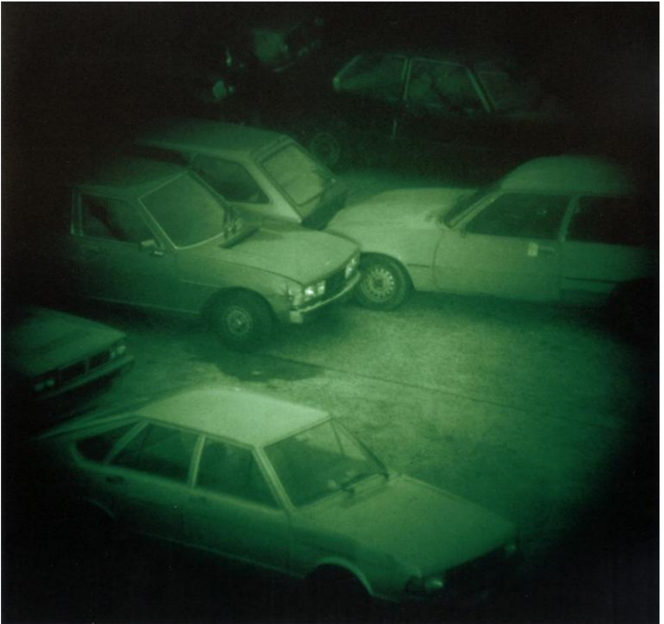
Nacht 9 II (Night 9 II) 1992 C-print 20 × 21 cm © Thomas Ruff.

Tuttavia, a interessare Ruff, è anche il modo in cui la fotografia rispecchia il ritmo veloce della società, della politica, della tecnologia, della cultura, o quello lento dei fenomeni cosmici. In sintesi, egli non agisce “con la fotografia” bensì “sulla fotografia” , “non prende immagini, ma lavora con loro” ; non più mera meccanica traduzione di un medium strutturato in regole e convenzioni (fotografia ottenuta attraverso lo scatto calcolato dell'apparecchio fotografico), bensì un medium utilizzato in qualità di linguaggio da rinnovare, un supporto per incursioni e travalicamenti, per sperimentarne tutte le potenzialità in esso racchiuse. La storia della fotografia diventa, così, un grande archivio, una banca dati, da cui attingere a piene mani, per ripensare le rappresentazioni e ri-attivare un originale rapporto