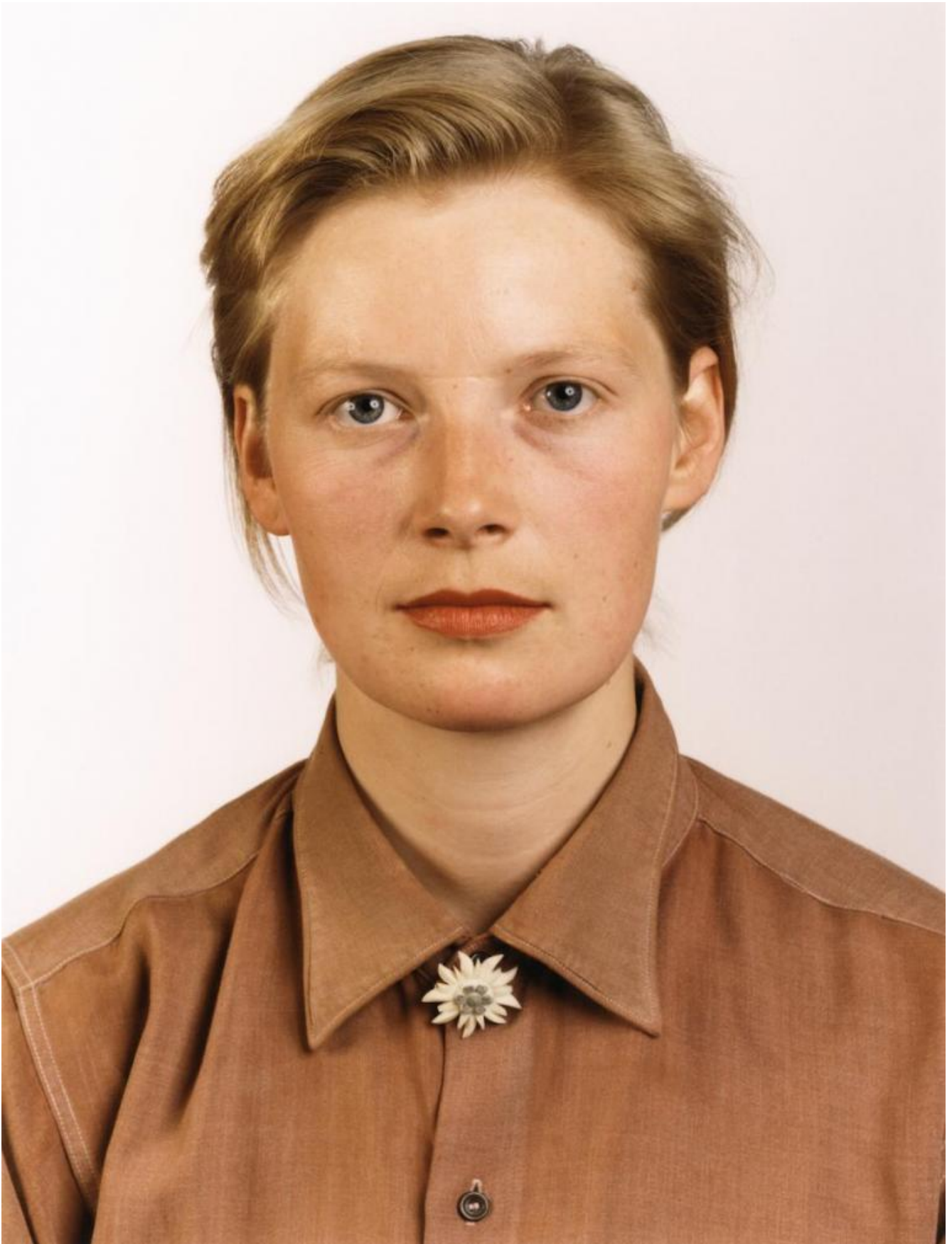
Portrait (P Stadtbäumer) 1988 C-print 210 × 165 cm © Thomas Ruff.