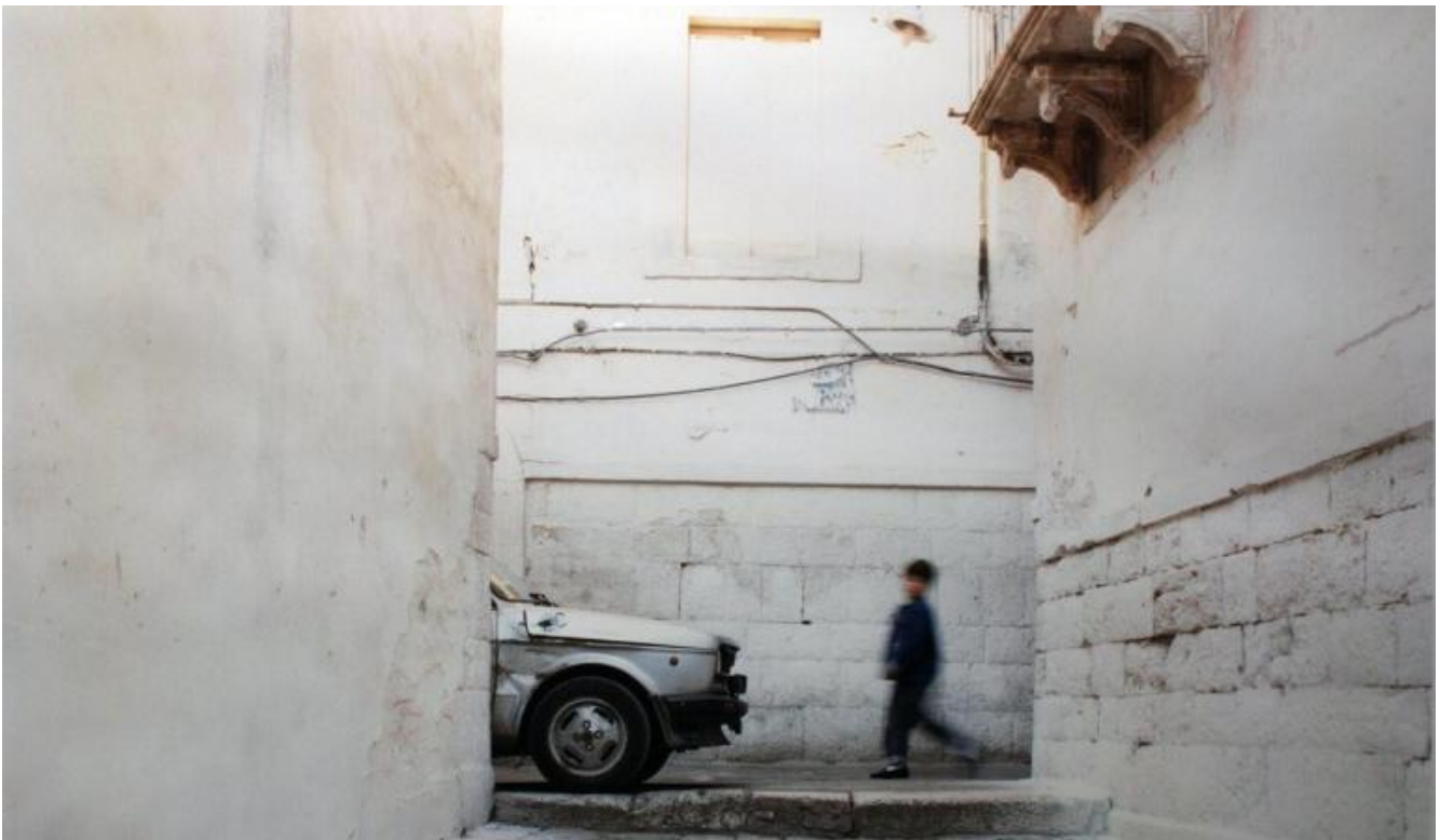
Ph Luigi Ghirri.

Il volume di Taramelli ha il merito di ripartire dal circolo di artisti modenesi che sono stati per Ghirri un momento fondamentale della sua formazione, da cui ha appreso alcuni stilemi della neoavanguardia di quegli anni, ma volgendoli verso un aspetto più sentimentale ed empatico di quanto lo stile ideologico e artistico dell'epoca sembra suggerire, se non proprio imporre. In Parmiggiani e Della Casa, artisti assai diversi tra loro, c'è un atteggiamento concettuale simile, che tuttavia li ha portati a esiti differenti: l'ironia mozartiana tutta leggerezza in Della Casa e la ricerca di un sacro laicizzato, isola dell'Assoluto, in Parmiggiani. L'impronta è però comune, e questa, anche attraverso l'ironico Guerzoni, si è trasmessa al fotografo emiliano.