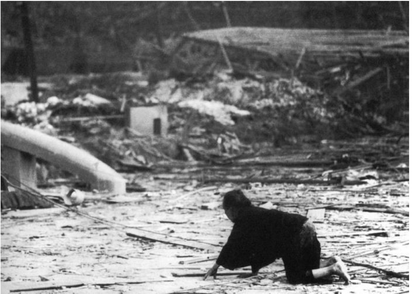
ph. Yosuke Yamahata

Penso che queste immagini andrebbero esposte in un'altra mostra che dovrebbe attraversare l'Europa e raggiungere poi gli Stati Uniti d'America. Ora che, secondo quanto riportato dai giornali, gli Stati Uniti di Donald Trump si appresterebbero a dare il via alla realizzazione di miniordigni nucleari. Non più le bombe-fine-del-mondo, per dirla con il dottor Stranamore di Kubrick, altro film che andrebbe proiettato di nuovo, ma bombe per conflitti limitati, pronte ad essere sganciate su paesi dell'Asia, ad esempio, in caso di necessità. Una prospettiva che si fa sempre più realistica e che è all'origine dell'atto di Papa Francesco di donare la foto. Il suo è stato un semplice gesto che ci ha ricordato la possibilità di altre stragi come a Hiroshima e a Nagasaki. Ha usato una fotografia, perché questa invenzione umana possiede senza dubbio un potere straordinario. "Vale più un'immagine che cento discorsi", si dice. In questo caso, e in quello di Yamahata, è assolutamente vero.