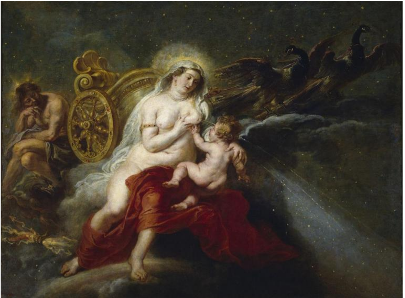
Pieter Paul Rubens, L'origine della Via Lattea, 1635-1638. Olio su tela. Madrid, Museo Nacional del Prado.

Opere d'arte antiche, moderne e contemporanee sono accostate a documenti e strumenti scientifici, tra i quali il compasso geometrico militare con il quale Galileo si guadagnò il pane, per dimostrare come i modelli scientifici sulla forma e la configurazione dell'universo abbiano alimentato l'immaginazione artistica e, viceversa, come le visioni derivate da una pratica artistica abbiano alimentato ipotesi scientifiche. Il riferimento sono gli studi di Panofsky che nel saggio citato in precedenza scrive: "Se si ritiene che l'atteggiamento scientifico di Galileo abbia influenzato il suo atteggiamento estetico, allo stesso modo si può ugualmente ritenere che il suo atteggiamento estetico abbia influenzato le sue convinzioni scientifiche" (p.52).