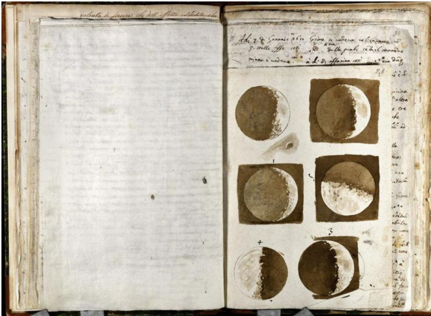
Opere di Galileo Galilei, Parte Terza, Tomo 3. Astronomia. Osservazioni delle fasi lunari, novembre-dicembre 1609. Manoscritto cartaceo autografo con disegni in acquerello su carta. Firenze, Biblioteca Nazionale Centrale.

Galileo non solo “vede” i corpi celesti ma anche la letteratura attraverso i codici delle arti visive. Riferendosi allo stile con il quale il Tasso elabora i suoi concetti “spezzati e senza dipendenza e connessione tra loro” usa il verbo “intarsiare”. L’Ariosto invece “sfuma e colora” ( Opere , IX, p.122). In breve, le arti del disegno forniscono a Galileo uno strumento per indagare in campo letterario oltre che scientifico.