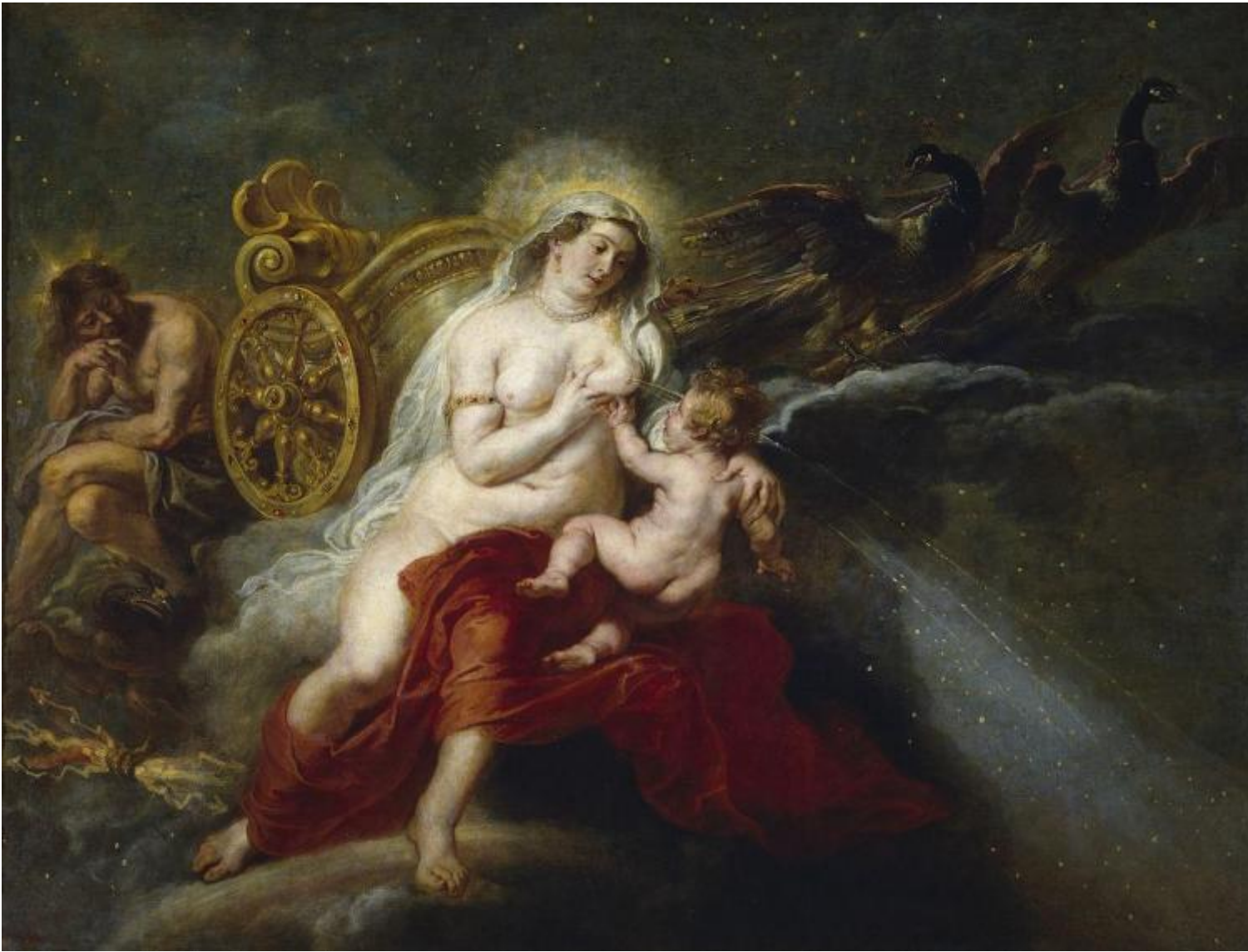
Pieter Paul Rubens, L'origine della Via Lattea , 1635-1638. Olio su tela. Madrid, Museo Nacional del Prado.

Opere d'arte antiche, moderne e contemporanee sono accostate a documenti e strumenti scientifici, tra i quali il compasso geometrico militare con il quale Galileo si guadagnò il pane, per dimostrare come i modelli scientifici sulla forma e la configurazione dell'universo abbiano alimentato l'immaginazione artistica e, viceversa, come le visioni derivate da una pratica artistica abbiano alimentato ipotesi scientifiche. Il riferimento sono gli studi di Panofsky che nel saggio citato in precedenza scrive: "Se si ritiene che l'atteggiamento scientifico di Galileo abbia influenzato il suo atteggiamento estetico, allo stesso modo si può ugualmente ritenere che il suo atteggiamento estetico abbia influenzato le sue convinzioni scientifiche" (p.52).