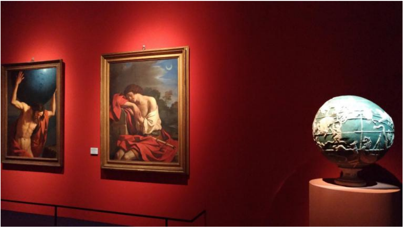
Visione parziale della sala V - Dall'astrologia all'astronomia con l'olio su tela Endimione, dipinto nel 1647 da Giovanni Francesco Barbieri detto Guercino, Roma, Galleria Dora Pamphilj.

Meditando sulla luce che illumina Endimione raggiungo la sala XI dove la Verità dipinta nel 1847 da Luigi Mussini regge una torcia segnando la consacrazione ottocentesca di Galileo come figura emblematica del mito positivista, della fede nel progresso scientifico e tecnologico. Su un altro lato della sala una gigantesca opera di Thomas Ruff ( jpg icbm03 , 2007) incombe sui visitatori. L'immagine digitale del lancio di un razzo prelevata da Internet e ingrandita si sfalda in tanti pixel. Per contrasto a questa rarefazione dell'immagine mi torna alla mente il fossile di Hoploparia gammaroides disegnato da Joseph Dinkel con tale effetto di densità, compattezza e mistero da far rabbrivire. Il disegno mi porta nelle viscere della Terra dove le pietre sognano l'origine materna del mondo. Come sostiene Garbin, in queste immagini c'è ancora molto da vedere: costituiscono una riserva inesauribile di senso e per questa ragione, pur essendo illustrazioni scientifiche, scatenano l'immaginazione.