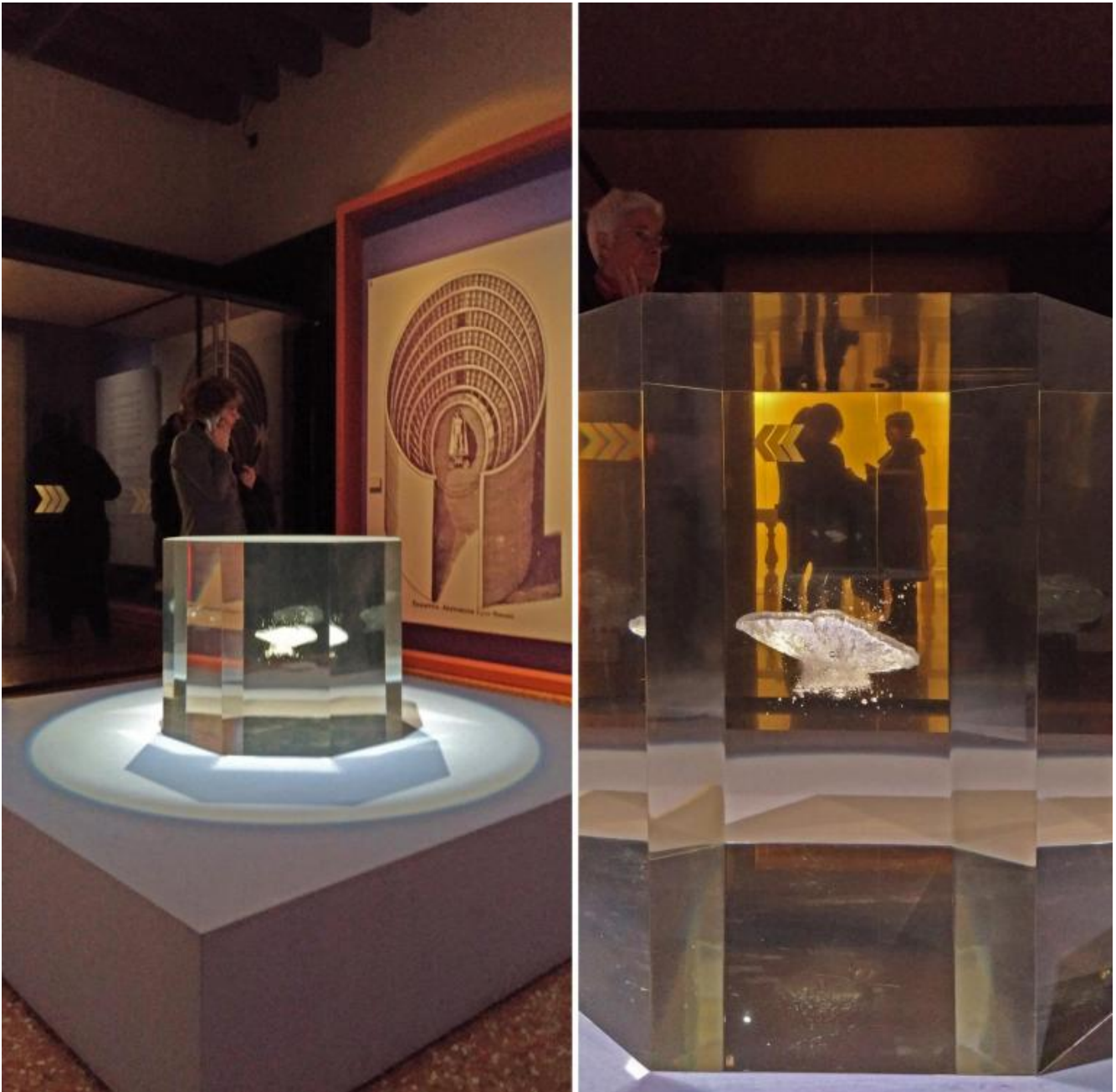
Anish Kapoor, Untitled, 2017. Acrilico. Proprietà dell'artista.

Passo nella sala successiva dedicata alla formazione di Galileo “maturato in un ambiente umanistico e artistico più che scientifico”, come scrive Erwin Panofsky in Galileo critico delle arti (Milano 2008, p.21), e da lì raggiungo la terza sala // Il cielo prima di Galileo per ammirare L'origine della Via Lattea dipinta da Rubens.