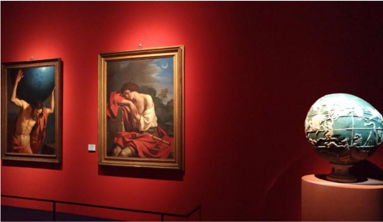
Visione parziale della sala V – Dall'astrologia all'astronomia con l'olio su tela Endimione, dipinto nel 1647 da Giovanni Francesco Barbieri detto Guercino, Roma, Galleria Dora Pamphilj.

Meditando sulla luce che illumina Endimione raggiungo la sala XI dove la Verità dipinta nel 1847 da Luigi Mussini regge una torcia segnando la consacrazione ottocentesca di Galileo come figura emblematica del mito positivista, della fede nel progresso scientifico e tecnologico. Su un altro lato della sala una gigantesca opera di Thomas Ruff ( jpg icbm03 , 2007) incombe sui visitatori. L'immagine digitale del lancio di un razzo prelevata da Internet e ingrandita si sfalda in tanti pixel. Per contrasto a questa rarefazione dell'immagine mi torna alla mente il fossile di Hoploparia gammaroides disegnato da Joseph Dinkel con tale effetto di densità, compattezza e mistero da far rabbrivire. Il disegno mi porta nelle viscere della Terra dove le pietre sognano l'origine materna del mondo. Come sostiene Garbin, in queste immagini c'è ancora molto da vedere: costituiscono una riserva inesauribile di senso e per questa ragione, pur essendo illustrazioni scientifiche, scatenano l'immaginazione.