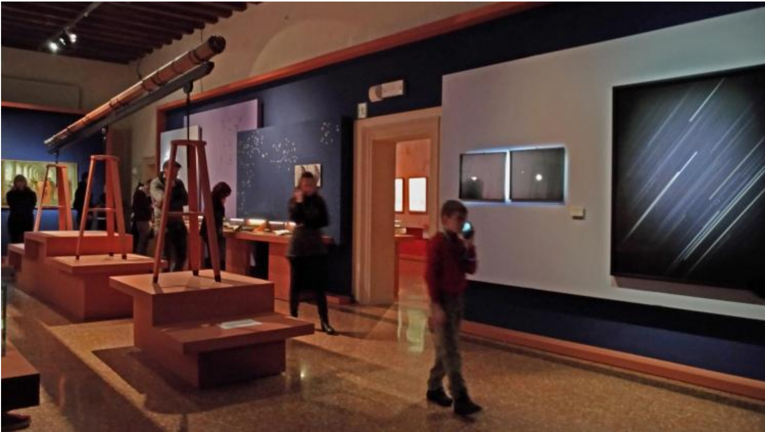
Visione d'insieme della sala IV – Il cielo di Galileo con il cannocchiale in legno e cartone realizzato da Giuseppe Campani nel 1682 e l'opera PAN (Unknown; USA-207), 2010-2011, C- Print, dell'artista Trevor Paglen.

Un cannocchiale in legno e cartone realizzato da Giuseppe Campani nel 1682 domina con i suoi sette metri di lunghezza la sala IV – Il cielo di Galileo per ricordarci il ruolo decisivo che lo strumento ebbe in questa scoperta e in quella dei satelliti di Giove. Galileo scoprì i monti e le valli della superficie lunare con l'aiuto del cannocchiale ma anche con l'aiuto della teoria delle ombre. In una lettera indirizzata al suo amico pittore Lodovico Cigoli scrive: “Conosciamo dunque la profondità, non come oggetto della vista, per sé et assolutamente, ma per accidente rispetto al chiaro e allo scuro” ( Opere , XI, pp.340-343). Peccato, mi dico, non poter vedere oggi stesso l'affresco di Cigoli con l' Assunzione della Vergine (si trova a Roma nella chiesa di Santa Maria Maggiore), ai piedi della quale l'artista ha dipinto la Luna con le sporgenze e le cavità scoperte da Galileo perfettamente chiaroscurate.