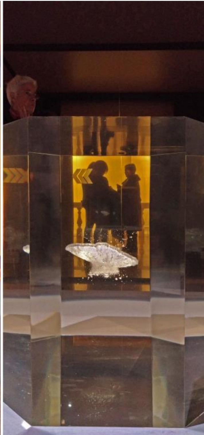
Anish Kapoor, Untitled, 2017. Acrilico. Proprietà dell'artista.

Passo nella sala successiva dedicata alla formazione di Galileo “maturato in un ambiente umanistico e artistico più che scientifico”, come scrive Erwin Panofsky in Galileo critico delle arti (Milano 2008, p.21), e da lì raggiunge la terza sala Il cielo prima di Galileo per ammirare L'origine della Via Lattea dipinta da Rubens.