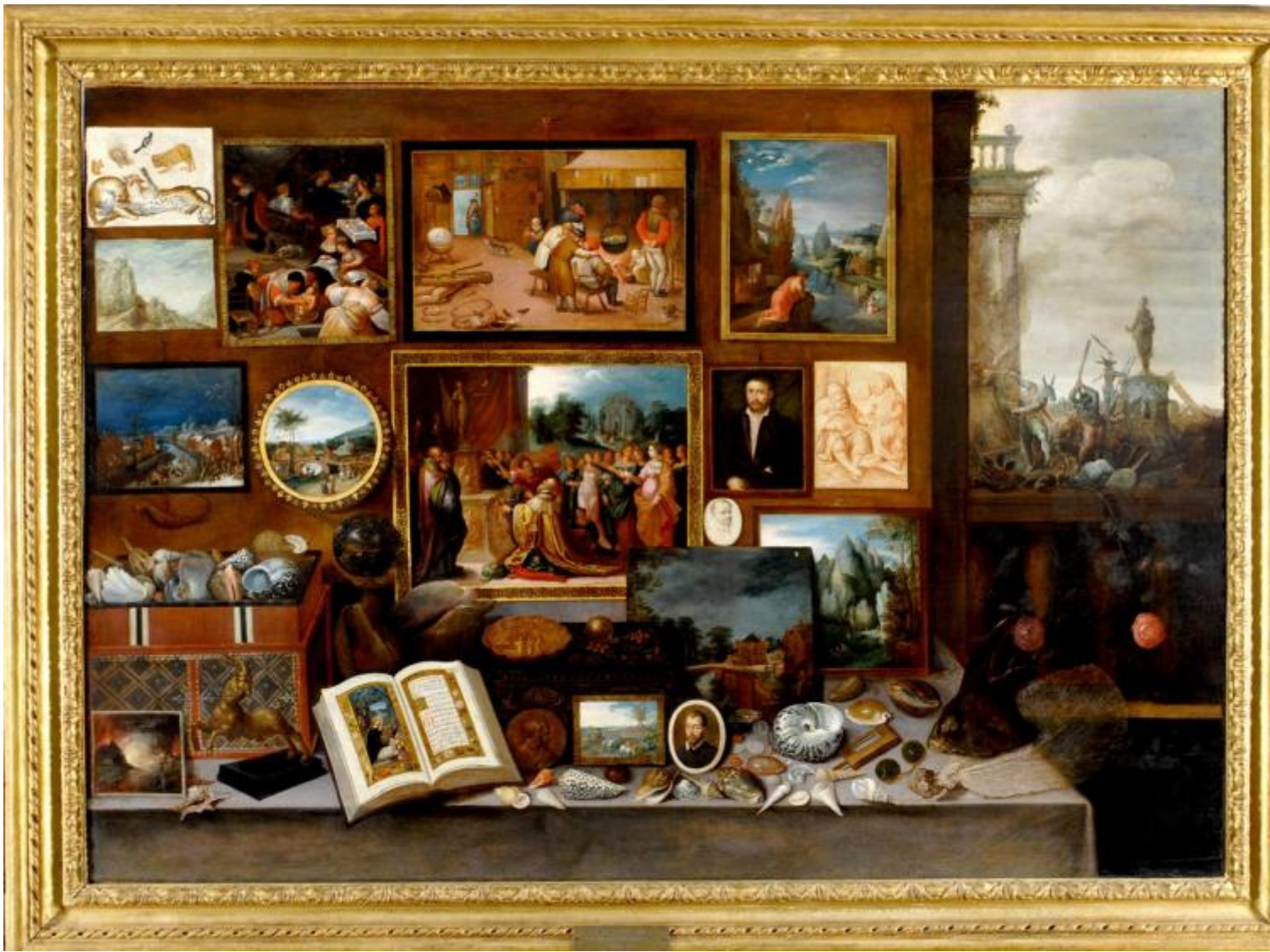
Frans Francken II, Gabinetto di un amatore con asini iconoclasti, secondo decennio del Seicento. Olio su tavola. Chiavari, Società economica di Chiavari.

L'opera di Francken II muove la memoria e il pensiero in più direzioni sfuggendo alla presa narrativa del progetto espositivo: un "racconto per opere sostenuto da un allestimento di grande impatto emotivo, fortemente scenografico", come si legge nella Nota del curatore .