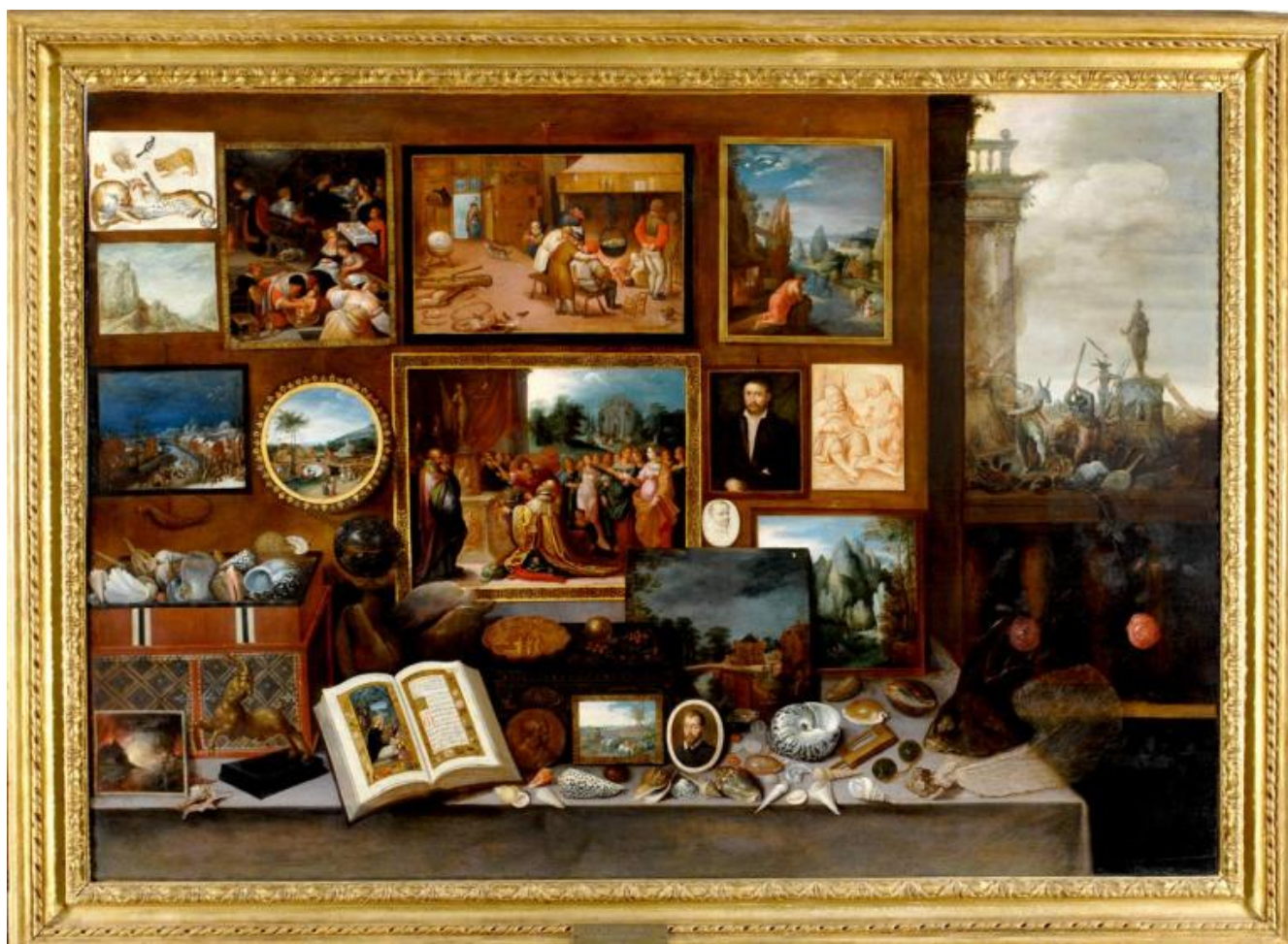
Frans Francken II, Gabinetto di un amatore con asini iconoclasti, secondo decennio del Seicento. Olio su tavola. Chiavari, Società economica di Chiavari.

L'opera di Francken II muove la memoria e il pensiero in più direzioni sfuggendo alla presa narrativa del progetto espositivo: un "racconto per opere sostenuto da un allestimento di grande impatto emotivo, fortemente scenografico", come si legge nella Nota del curatore .