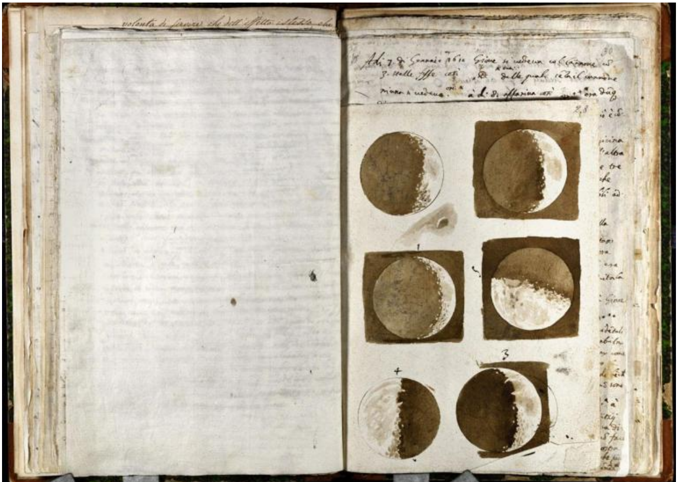
Opere di Galileo Galilei, Parte Terza, Tomo 3. Astronomia. Osservazioni delle fasi lunari, novembre-dicembre 1609. Manoscritto cartaceo autografo con disegni in acquerello su carta. Firenze, Biblioteca Nazionale Centrale.

Vincenzo Viviani nel Racconto storico della vita di Galileo ( Opere , XIX, p.602). Nella sala IV - Il cielo di Galileo si possono ammirare i bellissimi acquerelli su carta dipinti da Galileo nel corso delle osservazioni delle fasi lunari compiute tra il mese di novembre e dicembre 1609. Da questi sono tratti i disegni che illustrano il famoso Sidereus Nuncius . Anche Leonardo da Vinci vedeva (e pensava) attraverso il disegno, ma nel foglio 310 recto del Codice Atlantico esposto nella sala precedente, III - Il cielo prima di Galileo , la Luna ha ancora un volto con tanto di occhi, naso e bocca.