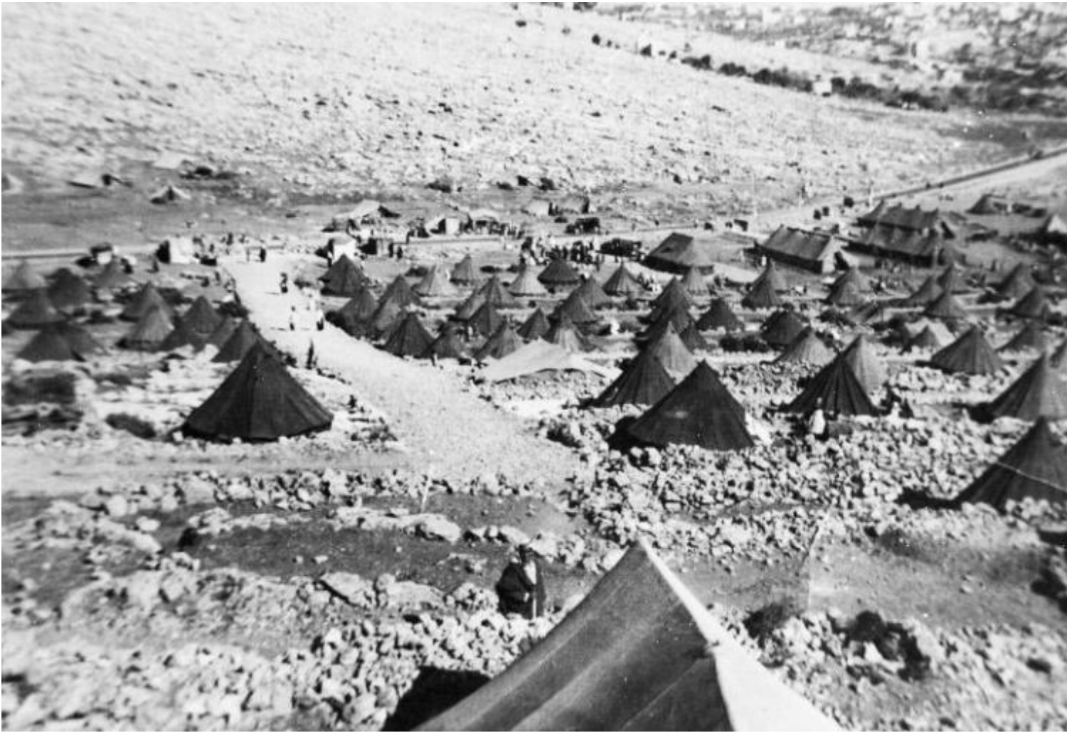
Campo profughi di Dheisheh fotografato nel 1948.

Nessuno lo ha fatto. I soldi sono stati spesi in benzina e in cibo per i pranzi collettivi che organizzavamo dopo ogni lezione. Abbiamo girato tutto con i cellulari perché non era permesso portare macchine fotografiche o telecamere all'interno di Holot. Quella era l'unica attrezzatura di cui avevamo bisogno: telefoni cellulari. Tutti i miei film sono molto economici comunque. È una decisione ideologica.