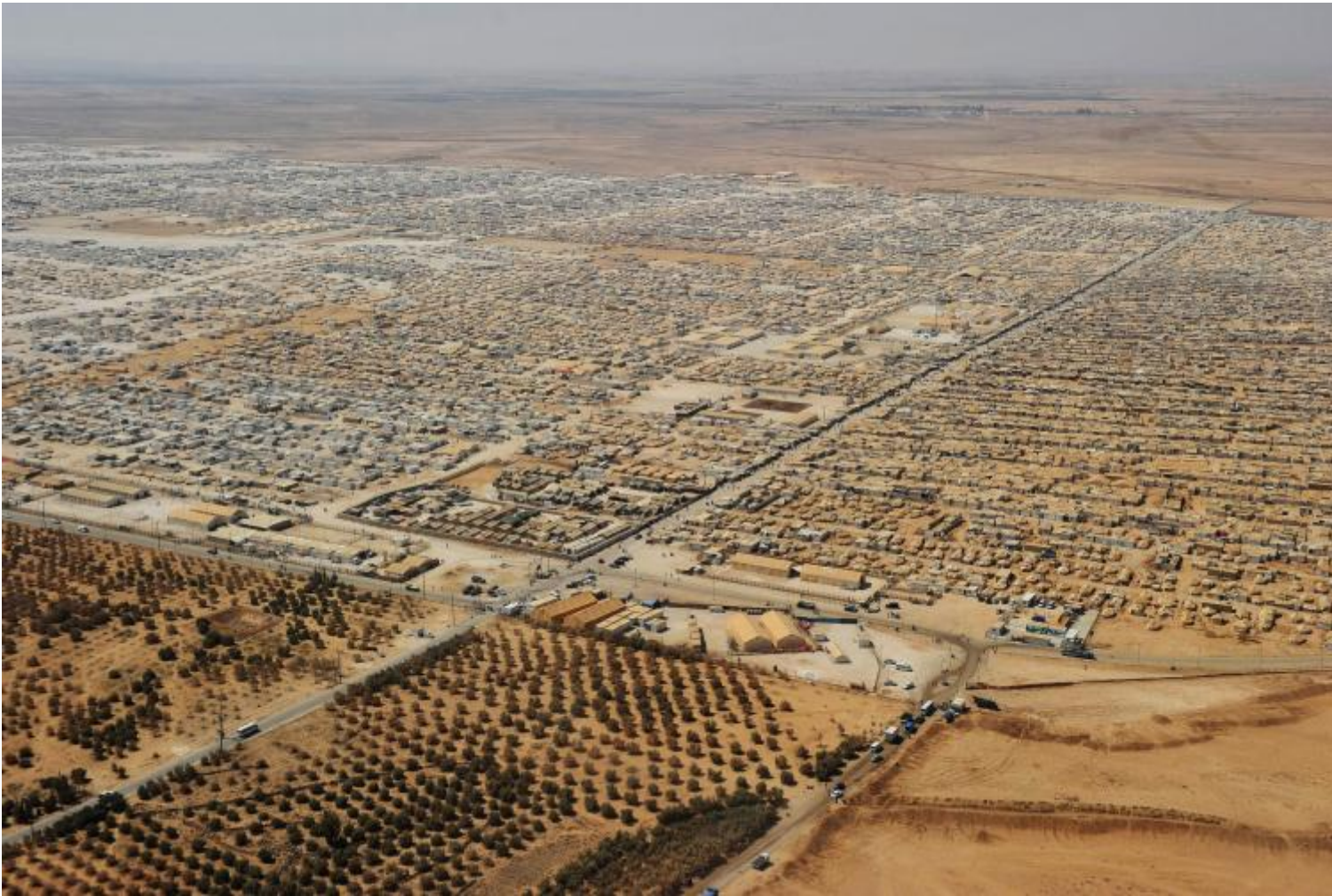
Campo profughi di Al Zaatari in Giordania noto come “The Dust Tent City”.

Escape Artists è girato nel centro di detenzione per richiedenti asilo Sudanesi e Eritrei a Holot, nel deserto del Negev. Holot è un limbo legale per persone illegali che “non possono essere mandate a casa” perché Israele è un firmatario della Convenzione delle Nazioni Unite sullo Stato dei Rifugiati. Allo stesso tempo, Israele non riconosce queste persone come rifugiati politici. Non possono lavorare né hanno diritto a un’assistenza sanitaria. Perché un corso di cinema?