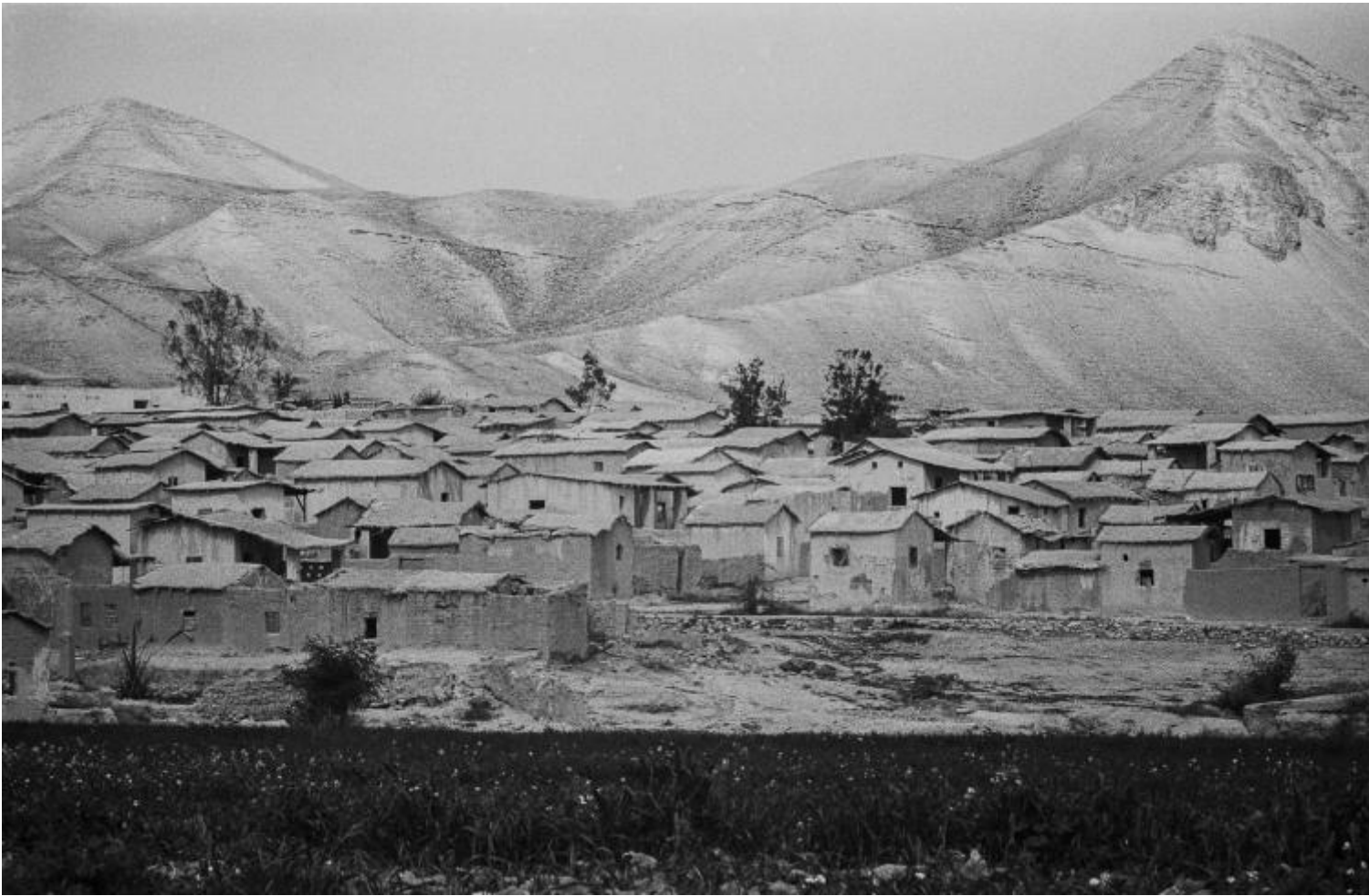
Campo profughi di Jericho nel 1974.

Per me, questa è una scelta fondamentale. O evito qualsiasi abuso o utilizzo sbagliato del mezzo e scatto solo autoritratti, o giro la camera verso l'esterno e rischio tutto questo. Nel momento in cui ti rivolgi all'esterno ti ritrovi aggroviato in questioni morali. Non c'è nessun passaggio rigido da Wild Boy a Escape Artists . In entrambi i casi mi sono trovato in una situazione specifica. È solo successo, come accade normalmente nella vita. Niente di tutto quello era una ricerca pianificata. L'approccio standard dei miei primi film, incluso Wild Boy , era quello di creare una recita dentro una recita, dove talvolta la verità si travestisse da bugia, dove ciò che era vero dovesse essere messo in scena per potersi rivelare. Credo che in questo stia un approccio simile, seppur rovesciato, a quello di Flaherty.