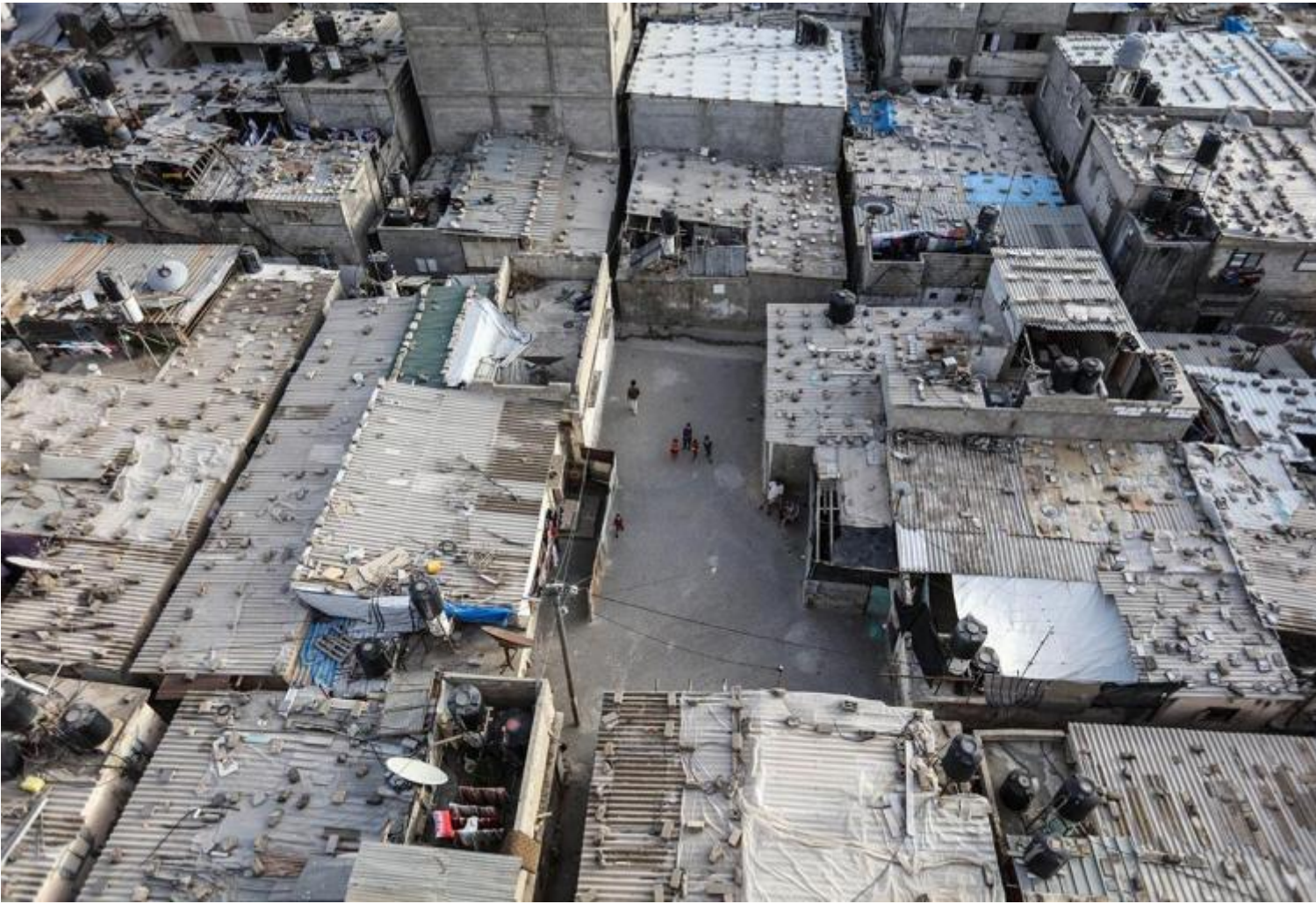
Campo profughi di Jabalia a Gaza.

Nanook of the North è il primo film a fornire documentazioni di una popolazione “esotica” girate sul posto. Il girato di Flaherty, anche se riprende la realtà, utilizza numerosi “trucchetti”. Invece di prove scientifiche, le sue immagini sono la sua interpretazione della realtà. Il documentario indica cose e persone in situazioni reali a cui il regista aggiunge la propria personale interpretazione. Cosa ha spinto la tua ricerca a muoversi da Wild Boy ai rifugiati? Qual è la differenza tra primitivo ed esotico?