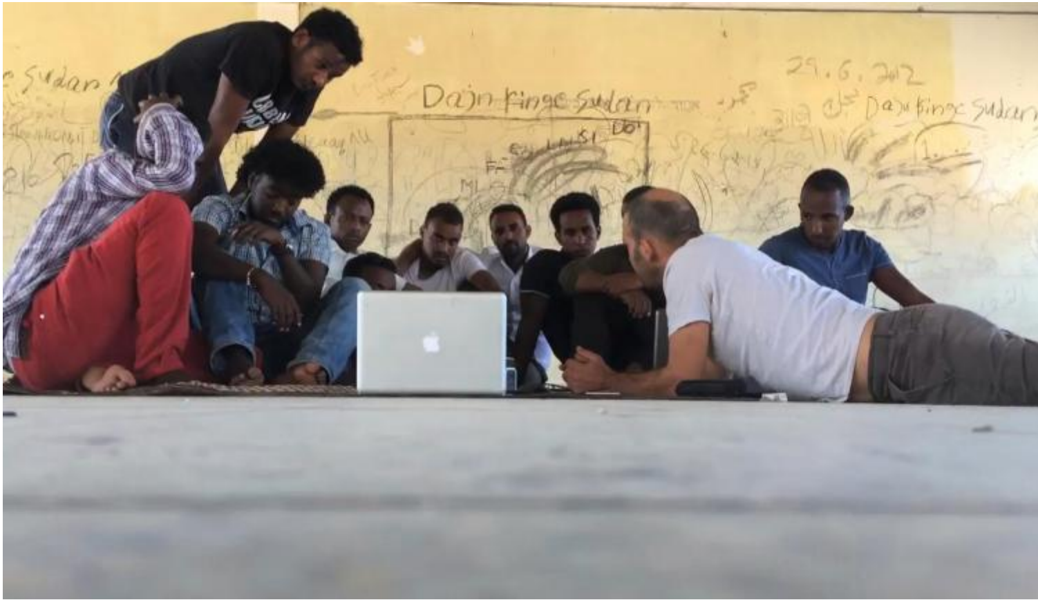
Guy Ben-Ner, Escape Artists.

Non lavoravo esattamente nella prigione. Non mi era permesso entrare. Li incontravo fuori e cercavamo un posto libero nel deserto dove fare lezione. Dovevamo essere silenziosi così da non finire nei guai con le autorità.