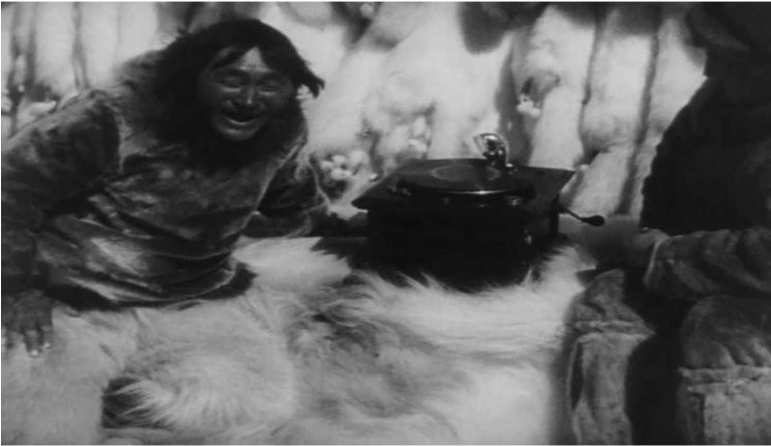
Guy Ben-Ner, Escape Artists.

Holot si trova nel deserto del Negev, a pochi chilometri da Gaza. Con i bus si può raggiungere la vicina Ashkelon. Trasgredire alle tre chiamate giornaliere significa essere riportati in prigione. È possibile per richiedenti asilo Eritrei e Sudanesi essere deportati in un terzo Paese dell'Africa, come il Rwanda o il Ghana?