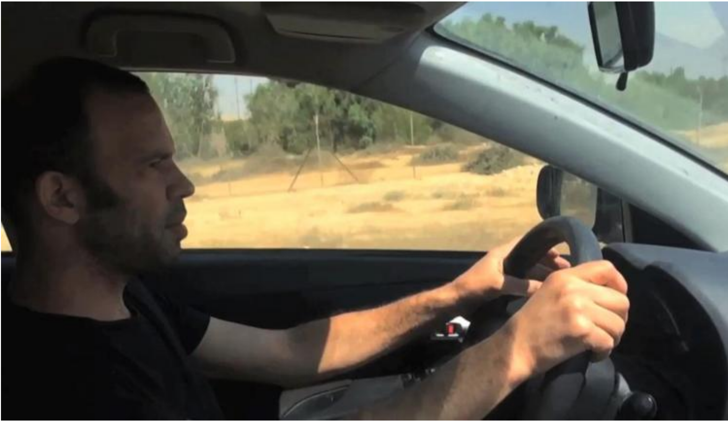
Guy Ben-Ner, Escape Artists (Courtesy Pinksummer Gallery).

In Escape Artists, invece che occuparti del viaggio dei richiedenti asilo, analizzi le loro condizioni di vita all'interno di un centro di detenzione. Come arrivano a Holot?