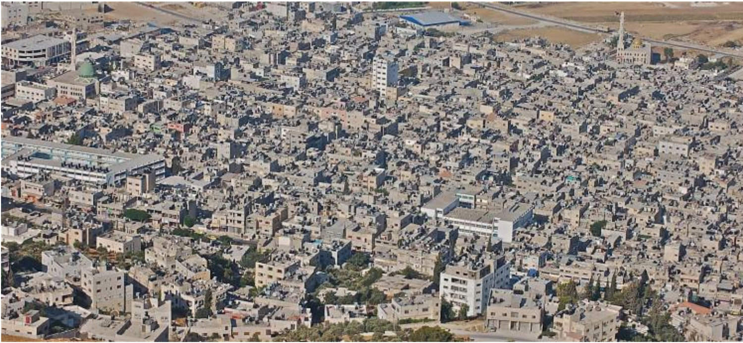
Campo profughi di Balata in Nablus – Cisgiordania.

Escape Artists analizza il film Nanook of the North (1922). Robert J. Flaherty , finanziato dalla compagnia produttrice di pellicce Revillon Frères di Parigi, aveva organizzato un progetto che lo vedeva a fianco degli Inuit per diversi mesi, sviluppando un processo di fiducia e collaborazione. Chi ha finanziato il tuo lavoro?