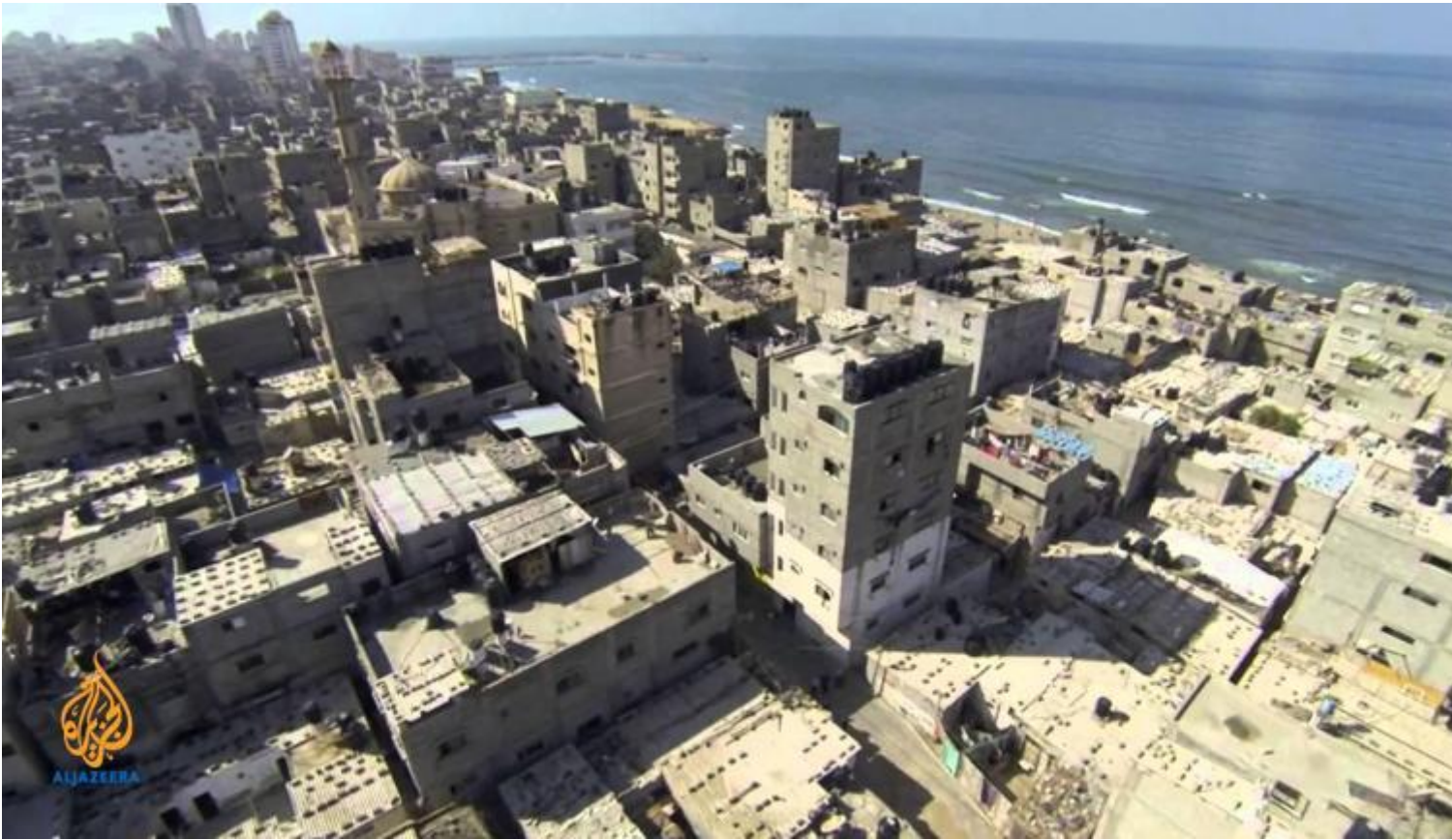
Campo profughi di Al-Shati' a Gaza.

È un limbo. Il governo non può detenere queste persone perché si rifiuta di determinare i loro casi (se sono rifugiati o immigrati per lavoro), così ha istituito una struttura aperta. Ma poiché Holot si trova nel deserto, le persone non possono davvero andarsene: per questo, nonostante sia una prigione aperta, i muri ci sono. Muri invisibili, come quelli creati dai mimi facendo gesti con le mani. In ogni caso la domanda può essere rovesciata. Non più perché insegnare loro il cinema, ma perché farne un film. In realtà, tutto è iniziato come un corso pratico. Per un anno ho insegnato solamente a utilizzare i mezzi del cinema e dell'editing, l'intento era quello di dar loro gli strumenti per poter raccontare la propria storia. Sentivo di non avere nessun modo e nessun diritto di raccontarla da me. Per questo, durante il primo anno, non ho girato nulla da solo. Ero solo un istruttore. Più avanti ho capito che avrei potuto raccontare la storia delle lezioni, e lasciare che la situazione dei rifugiati scivolasse nella narrazione, quasi involontariamente. Questo è ciò che è successo nei due anni successivi.