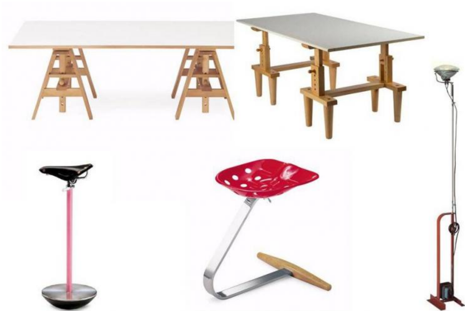
In alto: Tavolo Leonardo e tavolo Bramante, 1950. In basso: sgabello Sella e sgabello Mezzadro, 1957; lampada Toio, 1962.

È da questa inusuale raccolta di oggetti anonimi che il maestro ha tratto spunto per realizzare, in coppia con il fratello Pier Giacomo, maggiore di lui e prematuramente scomparso, alcuni dei suoi pezzi di design più famosi, come i tavoli Leonardo e Bramante (1950), che reinterpretano il tema del cavalletto e del banco da lavoro da falegname; o ancora lo sgabello Mezzadro (1957), che ingloba il sedile di un trattore agricolo d'inizio Novecento, fabbricato in lamiera stampata e verniciata; e poi Sella (1957), la seduta da tenere di fronte al telefono (ovviamente ai vecchi apparecchi telefonici a muro) volutamente scomoda per scoraggiare le lunghe conversazioni; e la lampada Toio (1962), la cui fonte illuminante è costituita da un vero faro d'automobile da 300 watt, sorretto da uno stelo ricavato da una canna da pesca, a sua volta inserita in una base di lamiera d'acciaio ripiegata in cui è racchiuso un pesante trasformatore che le conferisce stabilità.