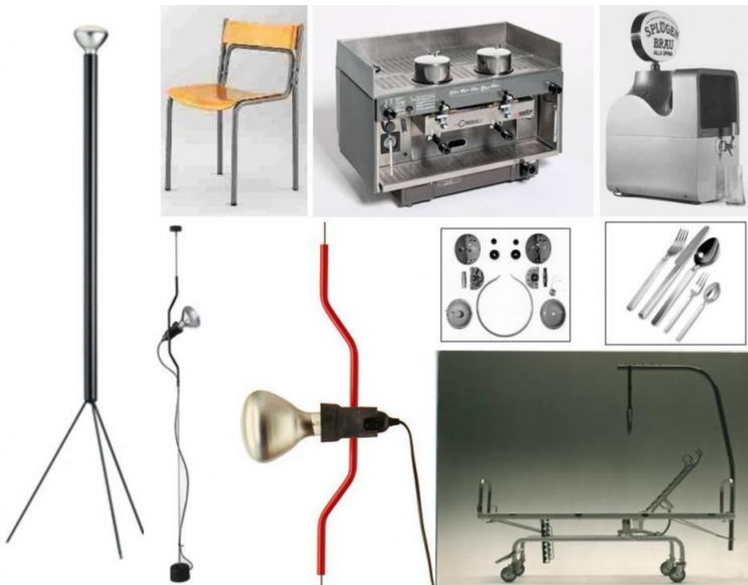
Gli 8 Compassi d'oro dei Castiglioni: lampada Luminator, 1955; sedia per la scuola T12 (con Caccia Dominioni), 1960; macchina da caffè Pitagora, 1962; spillatore di birra Spinamatic, 1964; cuffia per traduzioni simultanee, 1967; lampada Parentesi (con Pio Manzù), 1979; letto d'ospedale Omsa, 1979; servizio di posate Dry, 1984.