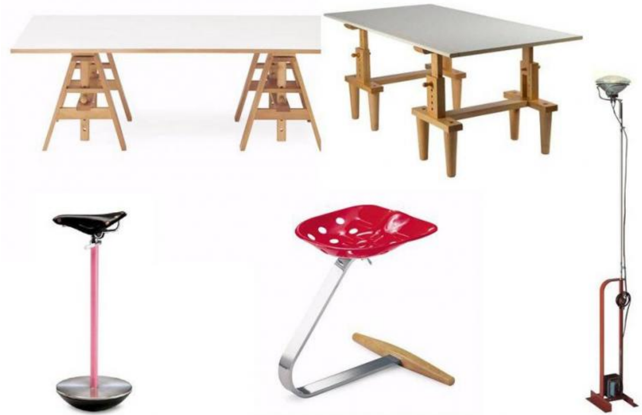
In alto: Tavolo Leonardo e tavolo Bramante, 1950. In basso: sgabello Sella e sgabello Mezzadro, 1957; lampada Toio, 1962.

all'università e invitava gli studenti a ragionarci su. Intere lezioni su un bicchiere portatile da caccia e pesca. Su pupazzi meccanici. O su bottiglie da gassosa con pallina di vetro incorporata. Un microcosmo che oggi i visitatori dello studio-museo, dove non esiste il cartello 'si prega di non toccare', possono ancora ammirare esposto nelle vetrine della sala riunioni."