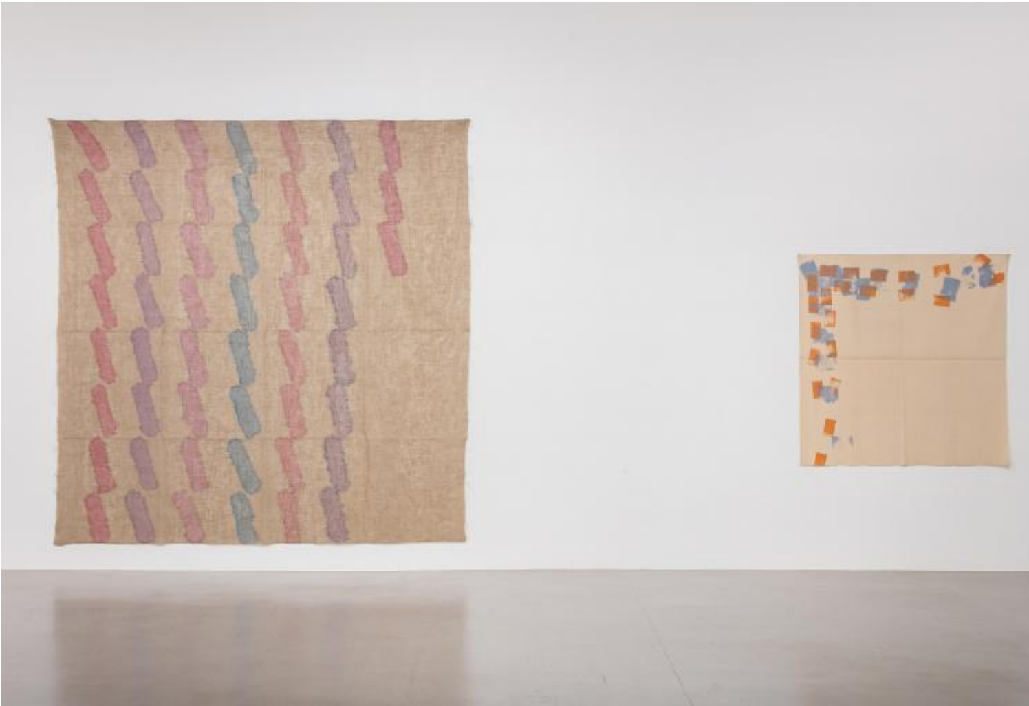
Giorgio Griffa. A Continuous Becoming , Veduta della mostra, Camden Arts Centre, Londra.

Il colore entra nelle fibre della tela e si fonde con essa in un unico oggetto che conserva migliaia di anni di memoria. La pittura si confronta con la storia dell'umanità e della poesia, simbolo della creazione artistica, il cui fondamento mitologico avviene quando Apollo consegna la lira a Orfeo.