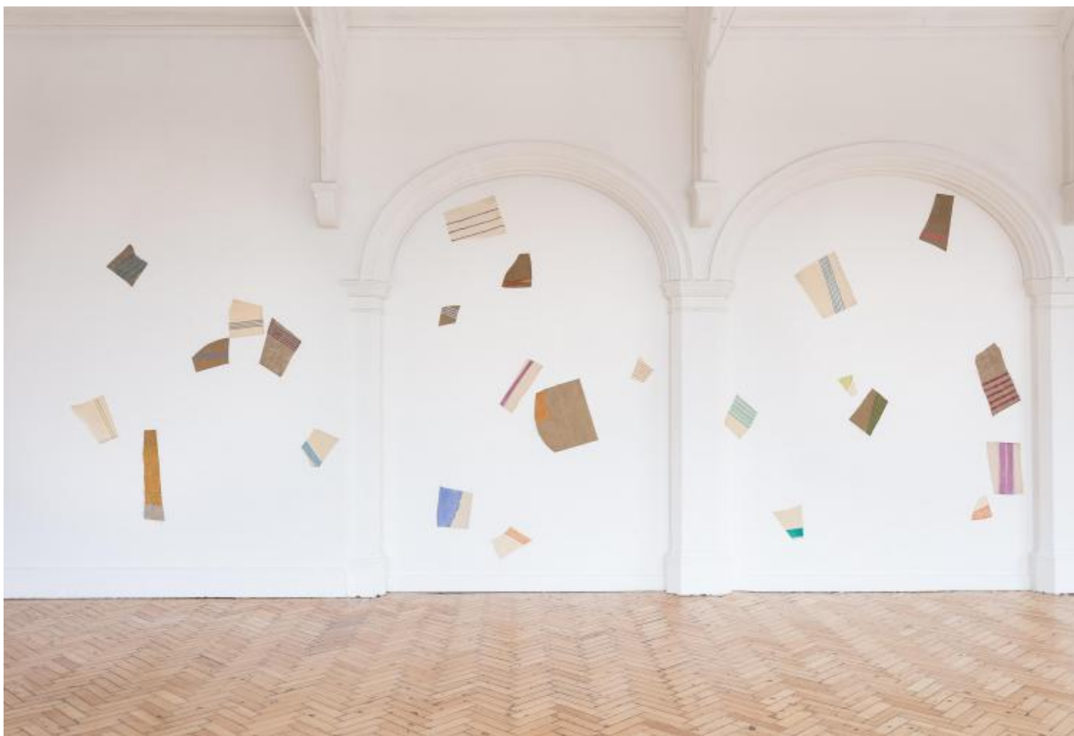
Giorgio Griffa. A Continuous Becoming, Veduta della mostra, Camden Arts Centre, Londra.

(IN)VISIBILE (2007), prende il titolo da un'opera dell'amico Giovanni Anselmo che si riferisce alla possibilità di esprimere attraverso l'arte forze ed energie fisiche intrinseche alla realtà.