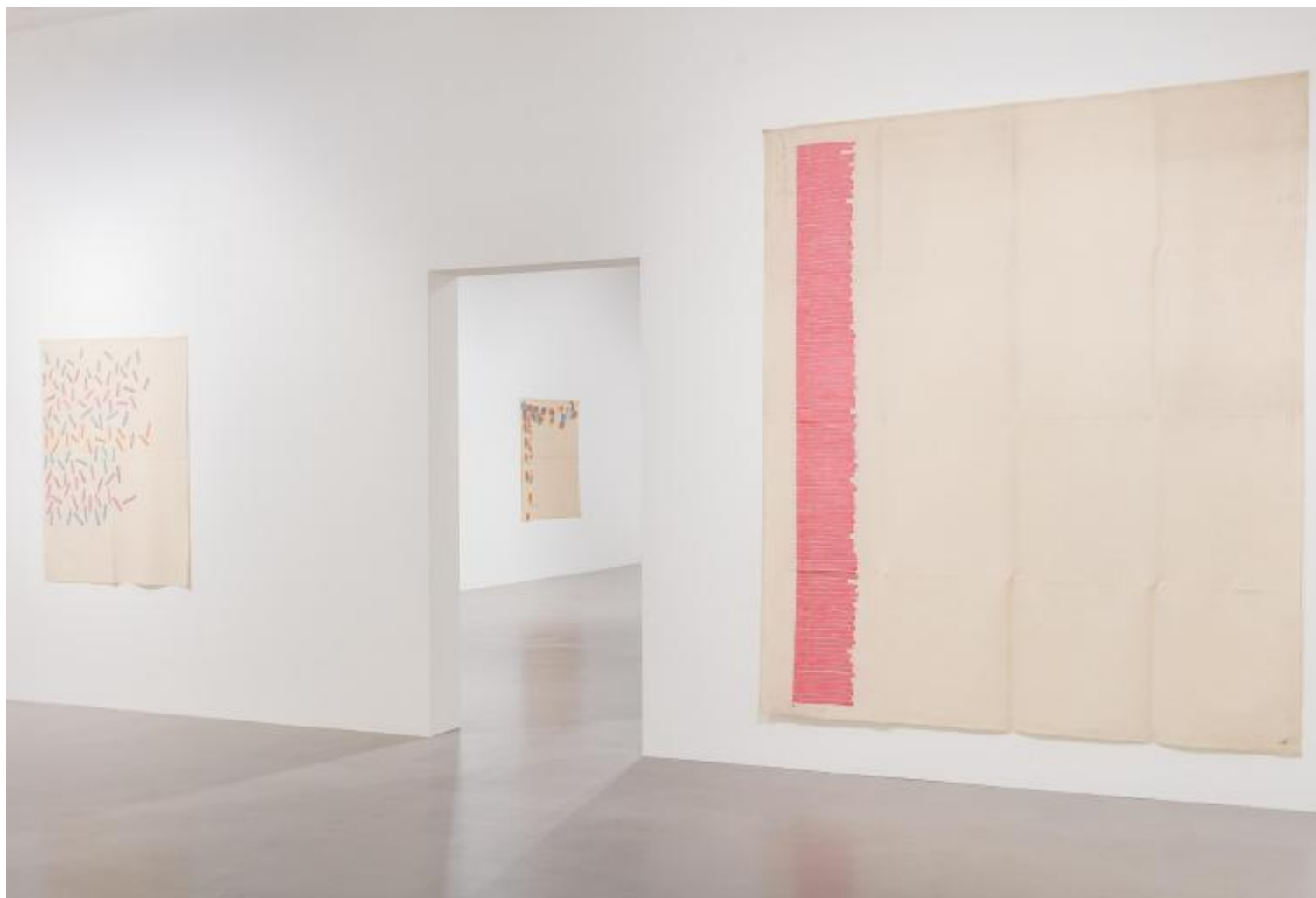
Giorgio Griffa. A Continuous Becoming, Veduta della mostra, Camden Arts Centre, Londra.

Molteplici riferimenti a diversi ambiti del sapere trovano espressione organica nella poesia visiva del vocabolario pittorico e nei testi scritti di Giorgio Griffa (Torino, 1936). Dopo aver conseguito la laurea in legge nel 1958, Griffa decide di dedicarsi completamente all'arte e intorno al 1968 giunge alla formulazione del suo linguaggio specifico che si sofferma sugli elementi essenziali della pittura, eliminando qualsiasi figurazione. "Io non rappresento nulla, io dipingo", afferma per la prima volta in occasione della mostra tenutasi presso la galleria Godei di Roma nel 1972. E in continuità con quest'affermazione, lo scorso 25 gennaio 2018, in conversazione con Martin Clark, direttore del Camden Arts Centre, spiega: "Se la pittura rappresenta se stessa, allora il pittore può rappresentare la musica e la poesia."