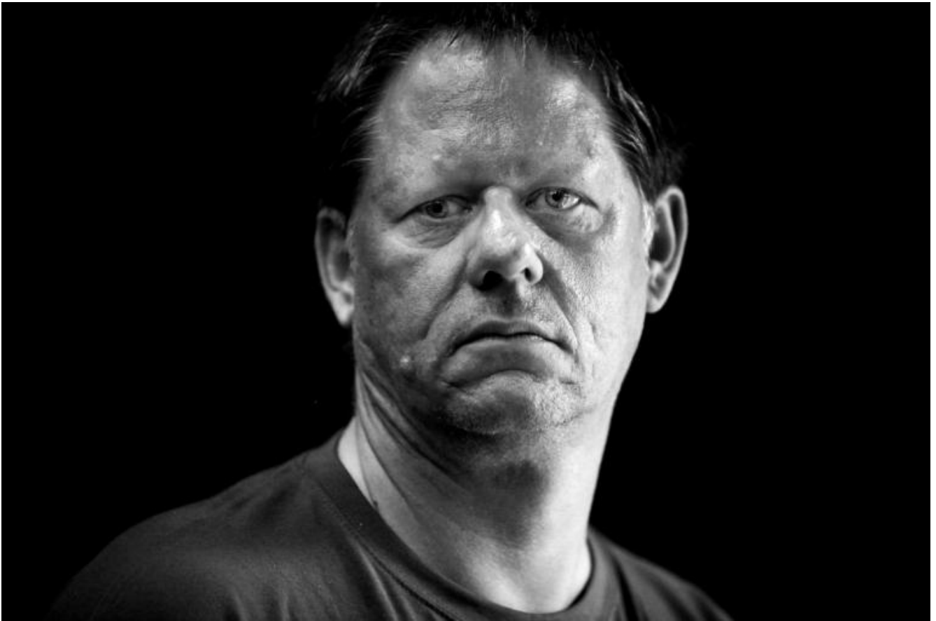
William T. Vollmann.