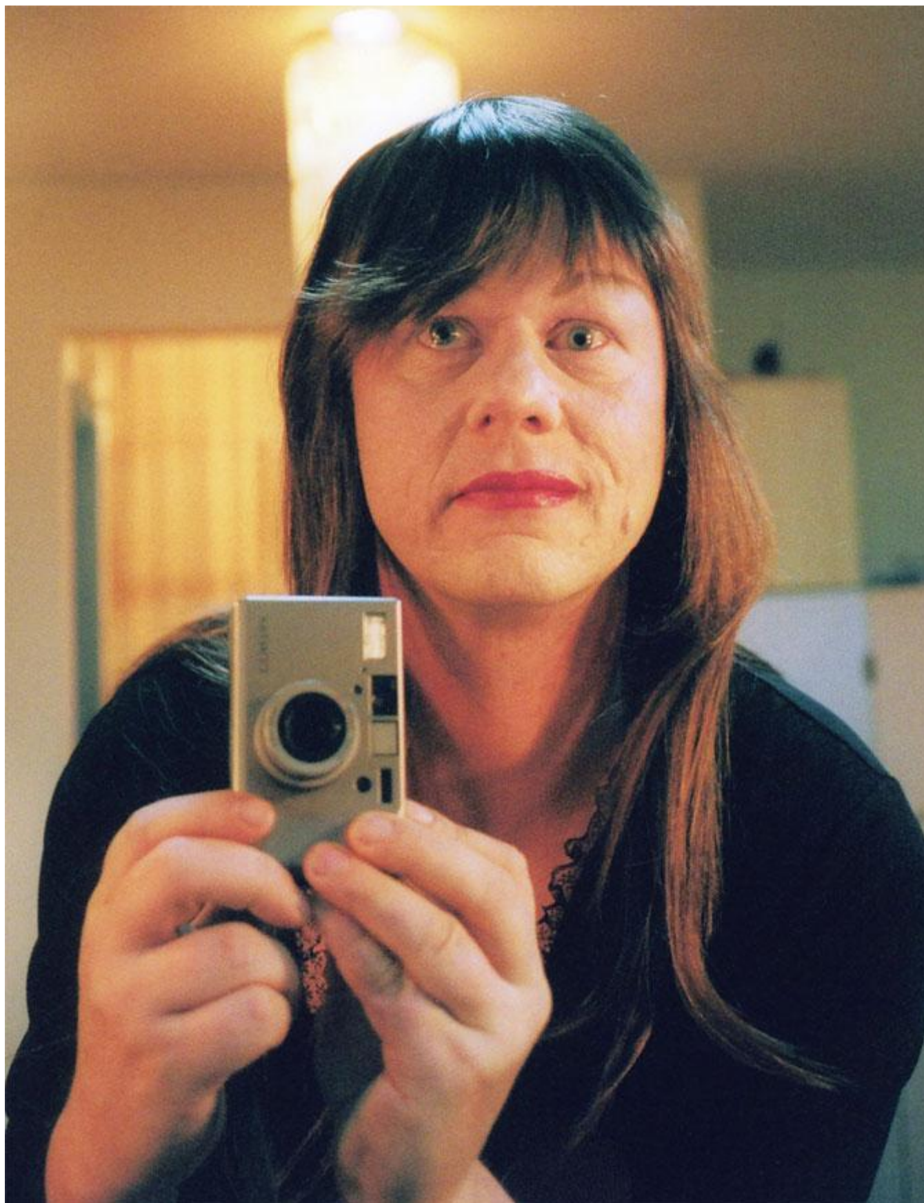
William T. Vollmann nei panni di Dolores.

Ecco, il lettore che volesse ovviare a questa mancanza potrebbe cominciare da The Atlas (New York: Viking, 1996), che (inspiegabilmente, data la sua natura di antologia) non è ancora stato tradotto in italiano, e