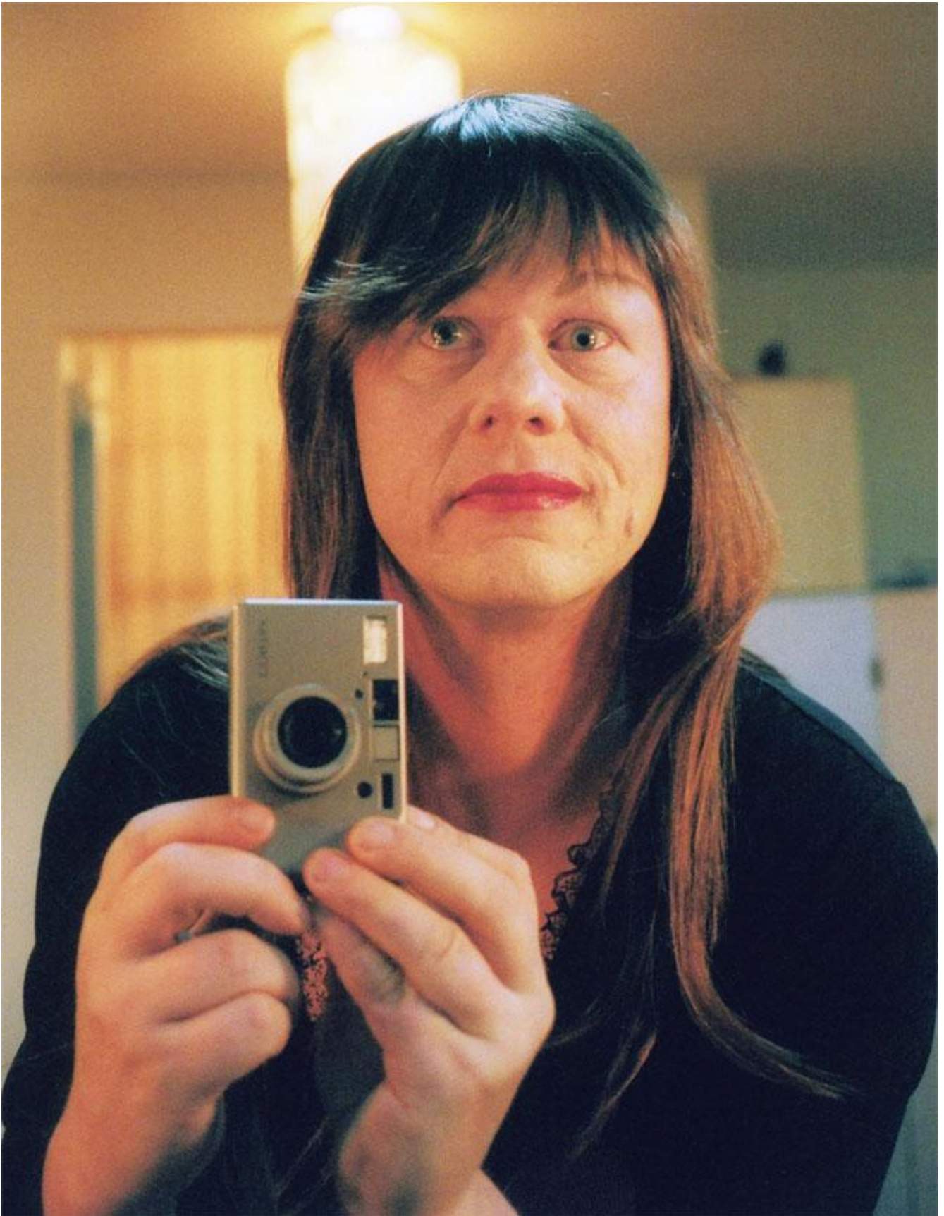
William T. Vollmann nei panni di Dolores.