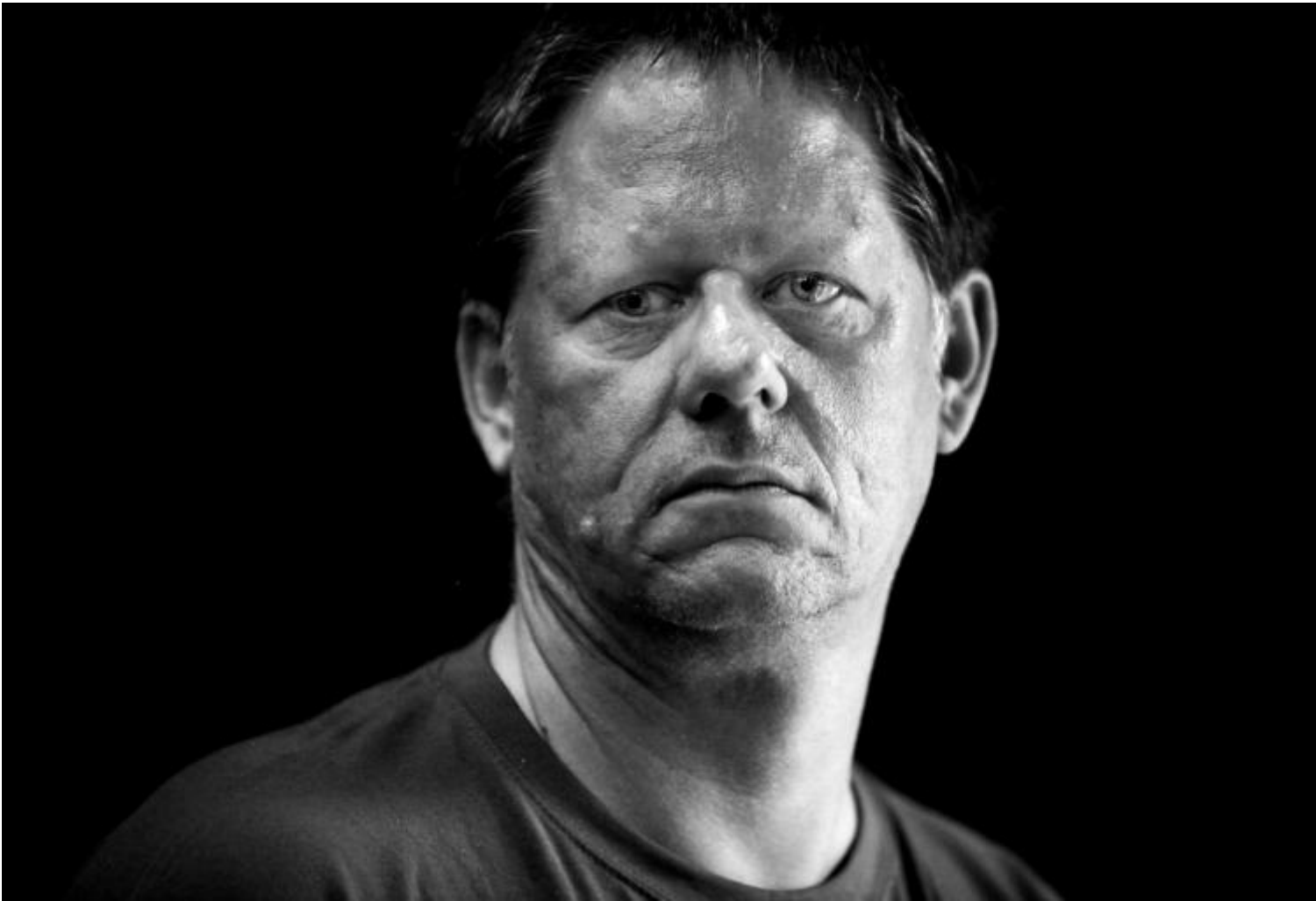
William T. Vollmann.