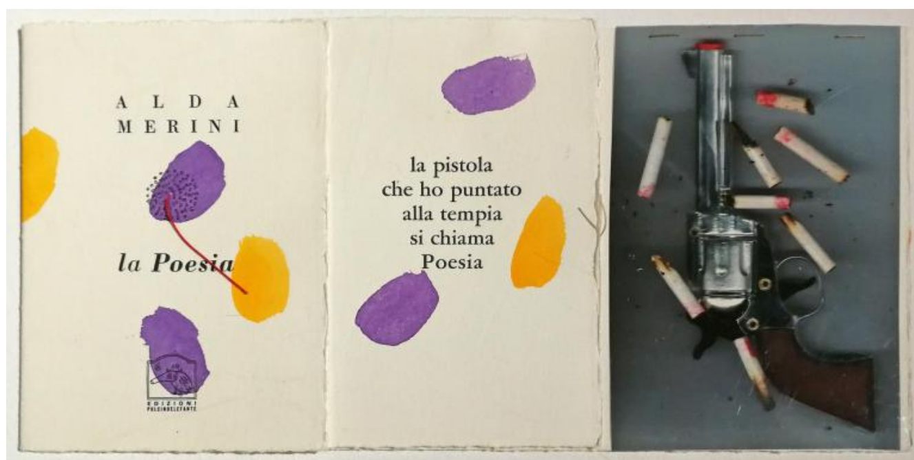
Alda Merini, La Poesia . Osnago, Marzo 2004. Edizione di 33 copie.