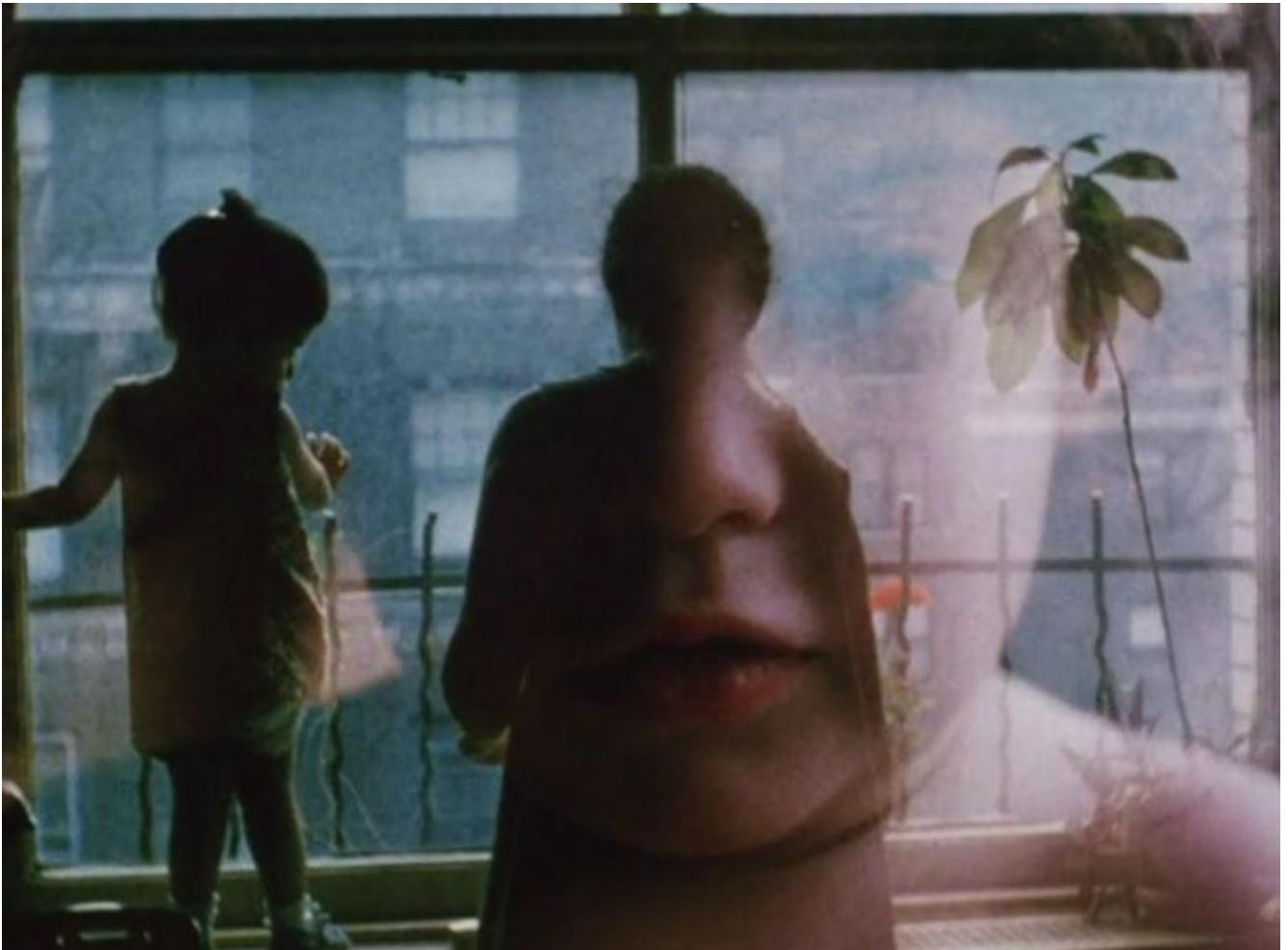
Jonas Mekas, Diaries, notes and sketches, 1969.

Continuamente a darsi il cambio in stretta vicinanza. In un montaggio che ama anche la presenza del caso o dell'incontro fortuito o per stacco, dal biancore della neve ai colori accesi dei fiori primaverili, della natura in città. Dalle giornate di sole alle riprese azzurrognole dei pomeriggi piovosi. All'interno di questo flusso vi sono anche riferimenti precisi, come il 24 maggio 1983, l'anniversario del ponte di Brooklyn, o l'ultima passeggiata con Jerome Hill il 7 luglio 1972, e scene che ritraggono attimi di vita di alcuni dei celebri amici di Mekas, come ad esempio Andy Warhol, Antonia Brico e Carl Theodor Dreyer.