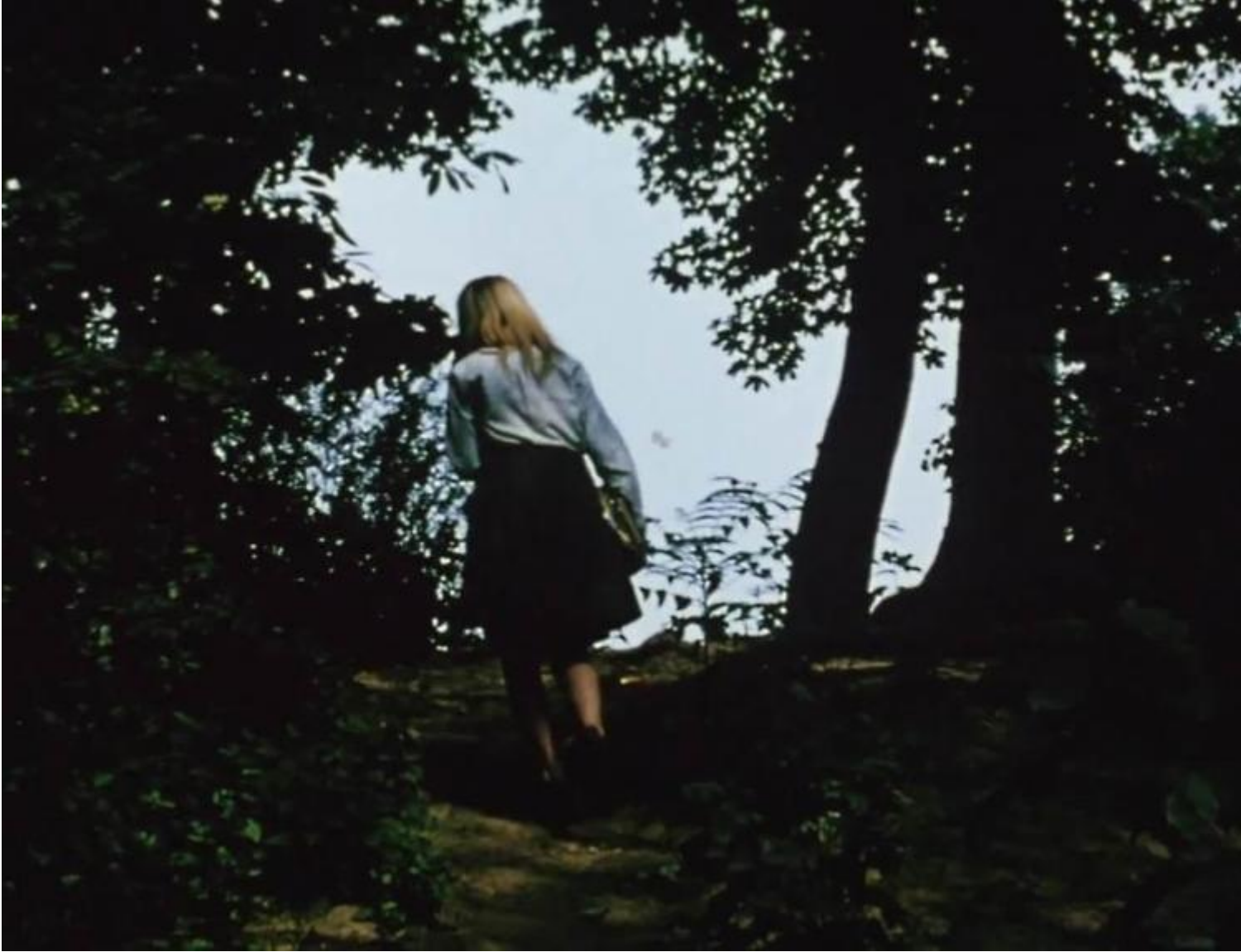
Jonas Mekas, The seasons, 2017.

Nella mostra allestita a Bergamo, nel Palazzo della Ragione, The Seasons (2017) è una doppia proiezione di immagini fisse e in movimento, senza sonoro, che racconta le stagioni a New York, città adottiva del regista lituano dal 1949. In alcuni momenti della narrazione le immagini tremano, oppure i movimenti sono accelerati, o le riprese si soffermano per pochi istanti prima di tremare o di accelerare di nuovo il passaggio delle persone. I filmati degli anni Settanta scorrono in innumerevoli modi, testimoniano un flusso vivace, il formicolare della gente che esiste e scorre nella vita quotidiana della città.