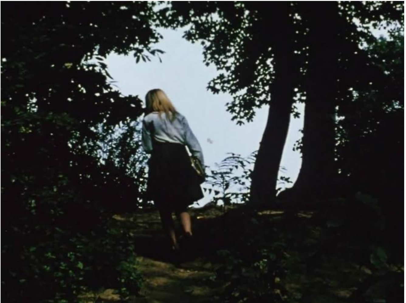
Jonas Mekas, The seasons, 2017.

Nella mostra allestita a Bergamo, nel Palazzo della Ragione, The Seasons (2017) è una doppia proiezione di immagini fisse e in movimento, senza sonoro, che racconta le stagioni a New York, città adottiva del regista lituano dal 1949. In alcuni momenti della narrazione le immagini tremano, oppure i movimenti sono accelerati, o le riprese si soffermano per pochi istanti prima di tremare o di accelerare di nuovo il passaggio delle persone. I filmati degli anni Settanta scorrono in innumerevoli modi, testimoniano un flusso vivace, il formicolare della gente che esiste e scorre nella vita quotidiana della città.