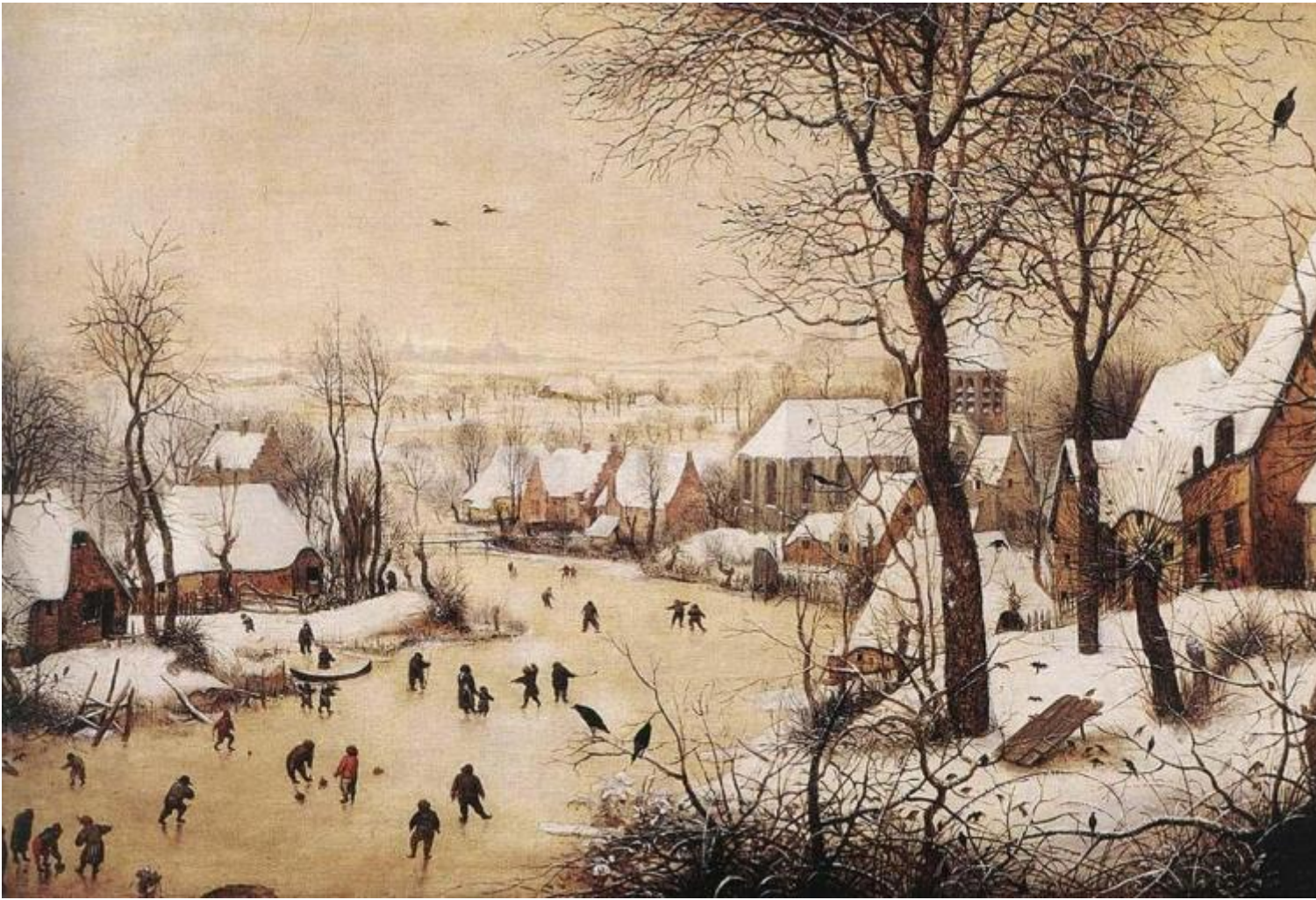
Pieter Bruegel il Vecchio, Paesaggio invernale con pattinatori e trappola per uccelli (1565), Bruxelles, Museo reale delle belle arti del Belgio.

Poi, per qualche momento, irrompono i fiori della primavera, e le persone che toccano e annusano le loro corolle. Ma tornano di nuovo immagini invernali, la gente sul ghiaccio, riprese in bianco e nero. Poi ancora qualche frame primaverile a colori e subito dopo di nuovo filmati invernali in bianco e nero. E poi un acquazzone ripreso dai finestrini di un'auto in viaggio sulle strade e sui lunghi ponti di New York, in epoca più recente. E di nuovo il freddo periodo invernale, nella morsa della neve, negli anni Settanta. Scampagnata di famiglia nel parco, in una giornata di sole, primaverile, con moglie e figlia. Ancora riprese di un incendio, con i pompieri al lavoro. Primavera, nel parco. Autunno. Inverno. Continuamente a darsi il cambio in stretta vicinanza. In un montaggio che ama anche la presenza del caso o dell'incontro fortuito o per stacco, dal biancore della neve ai colori accesi dei fiori primaverili, della natura in città. Dalle giornate di sole alle riprese azzurrognole dei pomeriggi piovosi. All'interno di questo flusso vi sono anche riferimenti precisi, come il 24 maggio 1983, l'anniversario del ponte di Brooklyn, o l'ultima passeggiata con Jerome Hill il 7 luglio 1972, e scene che ritraggono attimi di vita di alcuni dei celebri amici di Mekas, come ad esempio Andy Warhol, Antonia Brico e Carl Theodor Dreyer.