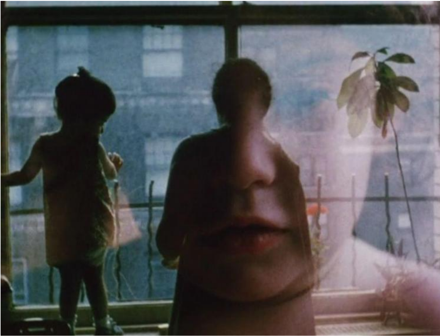
Jonas Mekas, Diaries, notes and sketches, 1969.