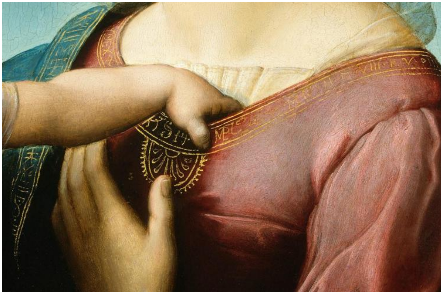
Raffaello Sanzio, Grande Madonna Cowper (o Madonna Niccolini) 1511, dettaglio, National Gallery of Art di Washington.

Nella mostra Raffaello, l'eco del mito sono presenti scritture segrete, in forma di ornamentazioni epigrafiche, anche sulle vesti delle Madonne e dei santi dipinti dai maestri guardati da Raffaello, quando era dodicenne: nella Madonna con il Bambino in trono tra i santi Giovanni evangelista e Agostino (1494) di Perugino, nella Madonna della Pace (1495 circa) di Pintoricchio.