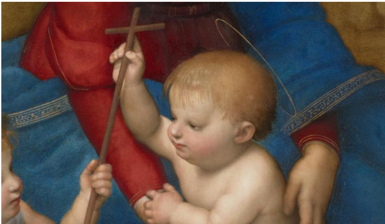
Raffaello, Madonna del prato (1506), particolare con l'alfabeto cifrato sul manto, Vienna, Kunsthistorisches Museum.

Nei tempi arcaici cominciarono anche a catasterizzare, ovvero ad attribuire il nome di una divinità, di un eroe, di un personaggio mitologico o di un animale a una costellazione. Gli artisti, nella loro immaginazione, hanno cercato anche di mettere in atto un'operazione inversa.