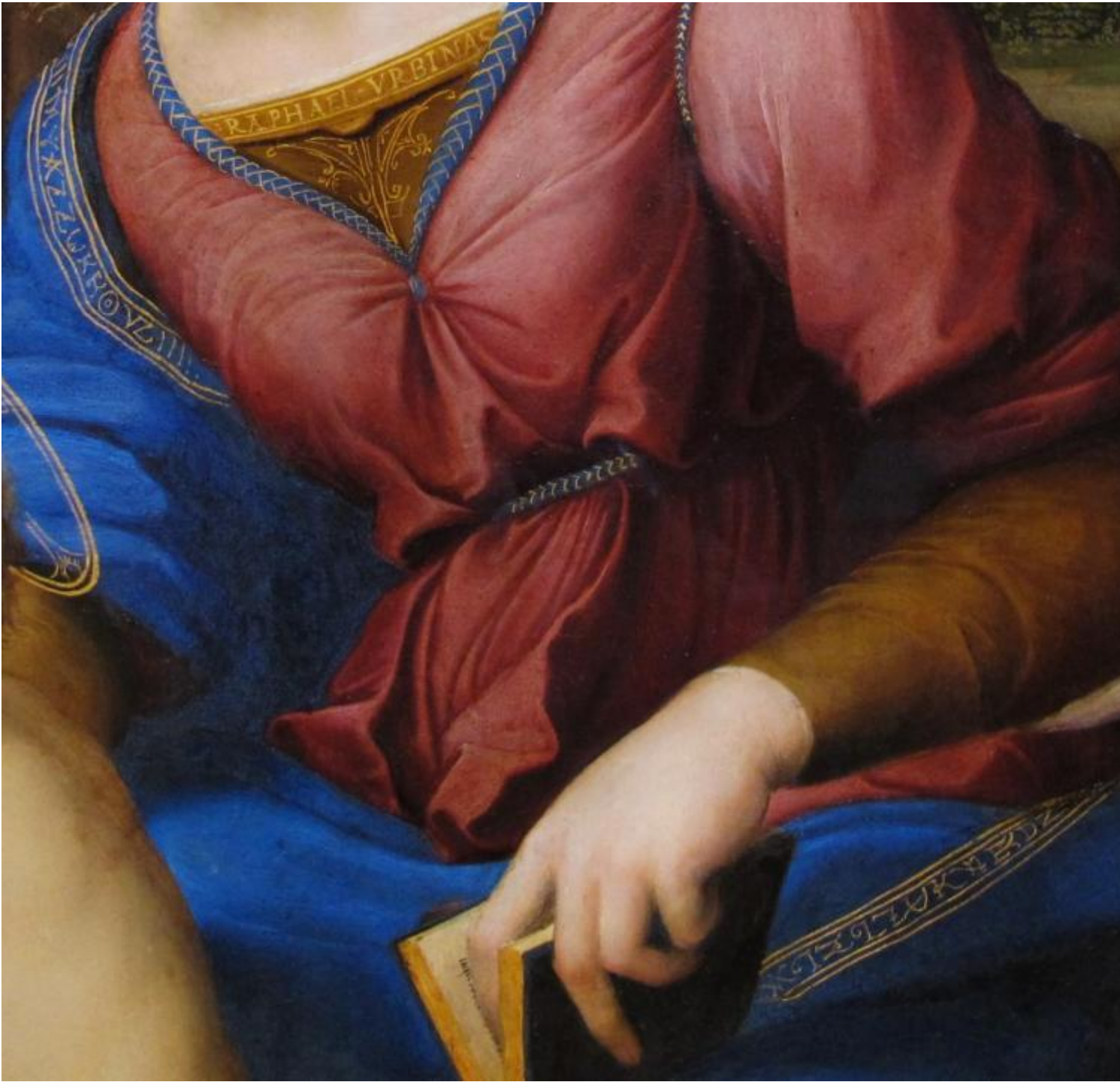
Raffaello, Sacra Famiglia Canigiani (1507-1508), dettaglio con l'alfabeto preadamitico, Monaco, Alte Pinakothek.

Nel corso dei millenni gli alfabeti si moltiplicarono, esponenzialmente fino al mito di Babele e ancora oltre. Vi furono alfabeti condivisi dal popolo e altri che furono utilizzati solo da sacerdoti, da élite, da gruppi di potere, da iniziati. Gli artisti del Medioevo e del Rinascimento si sono rivolti a questa tradizione per immaginare il volo degli angeli, le migrazioni degli esseri celesti, i messaggi degli dei pagani o del Dio dei tre monoteismi?