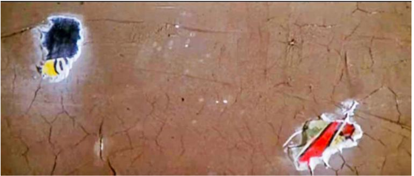
Dario Argento, fotogramma tratto dal film Profondo rosso del 1975.

Come Carlo, anche Miró è un innocente venuto a contatto con l'orrore che disegna e dipinge. Nelle opere degli anni Trenta, su cui incombono la guerra civile spagnola e il successivo conflitto mondiale, prende forma un universo di creature mostruose che gesticolano nel vuoto. La mostruosità si rivela anche attraverso le forze scatenate dall'artista con una sperimentazione aggressiva dei materiali, al fine di violentare e assassinare i metodi convenzionali della pittura. La violenza che Miró infligge alla figurazione è presente anche nelle opere realizzate negli anni Settanta tagliando, colorando e bruciando le famose cinque tele esposte nella grande retrospettiva allestita al Gran Palais di Parigi nel 1974.