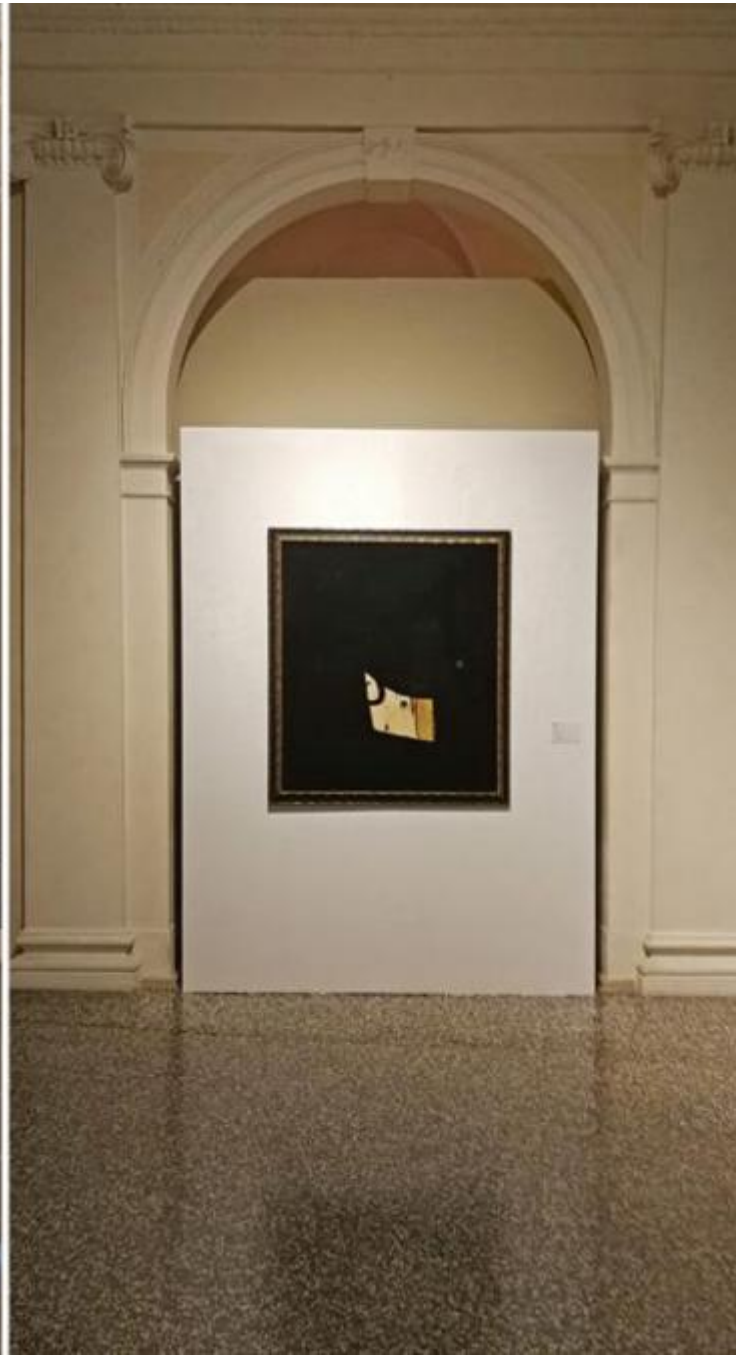
Doppia vista dell'ingresso alla mostra Joan Miró. Materialità e Metamorfosi allestita a Palazzo Zabarella, con veduta dell'opera Tête, 1973. Olio e collage su tela. Direção Geral do Património Cultural, Portogallo.