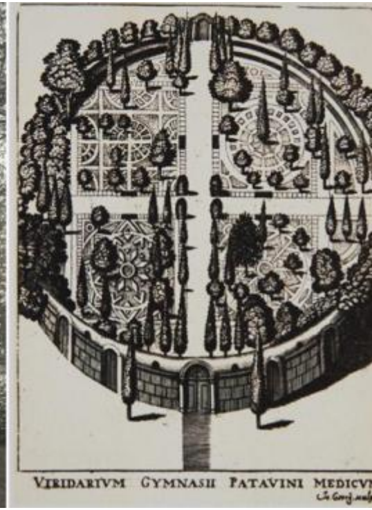
Piante medicinali nell'Orto botanico di Padova – Fotografia ottocentesca dell'Orto botanico di Padova - Viridarium Gymnasii Patavini Medicum. Incisione che rappresenta l'Orto botanico di Padova nel volume Jacobi Philippi Tomasini, Gymnasium Patavinum. Udine 1654.

Poco lontano da Palazzo Zabarella si trova l'Orto botanico universitario di Padova istituito nel 1545 per la coltivazione dei simplici (medicamenti naturali). Un giardino dove in primavera inoltrata si possono ammirare i colori dei fiori sbocciati sui rami di piante medicinali velenose, come quelle che fioriscono nei dipinti di Miró. Una visita all'Orto botanico, prima o dopo quella alla mostra, potrebbe rivelarsi utile per comprendere il pericolo e l'orrore combinato all'innocenza nelle opere dell'artista.