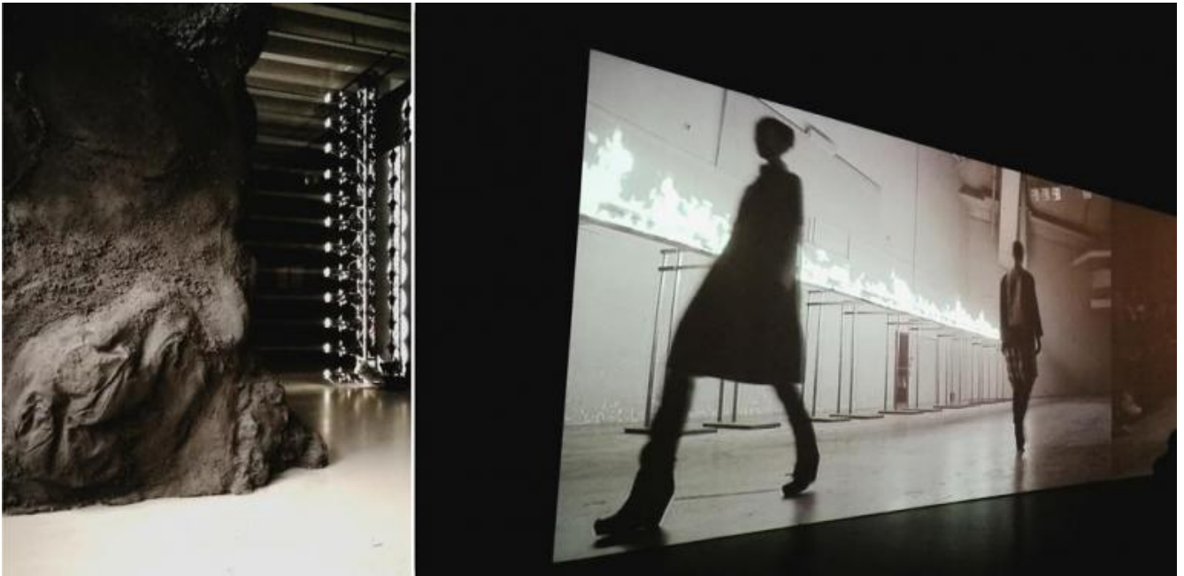
Rick Owens, Subhuman Inhuman Superhuman, vedute della mostra alla Triennale di Milano che ha avuto luogo dal 15 dicembre 2017 al 25 marzo 2018.