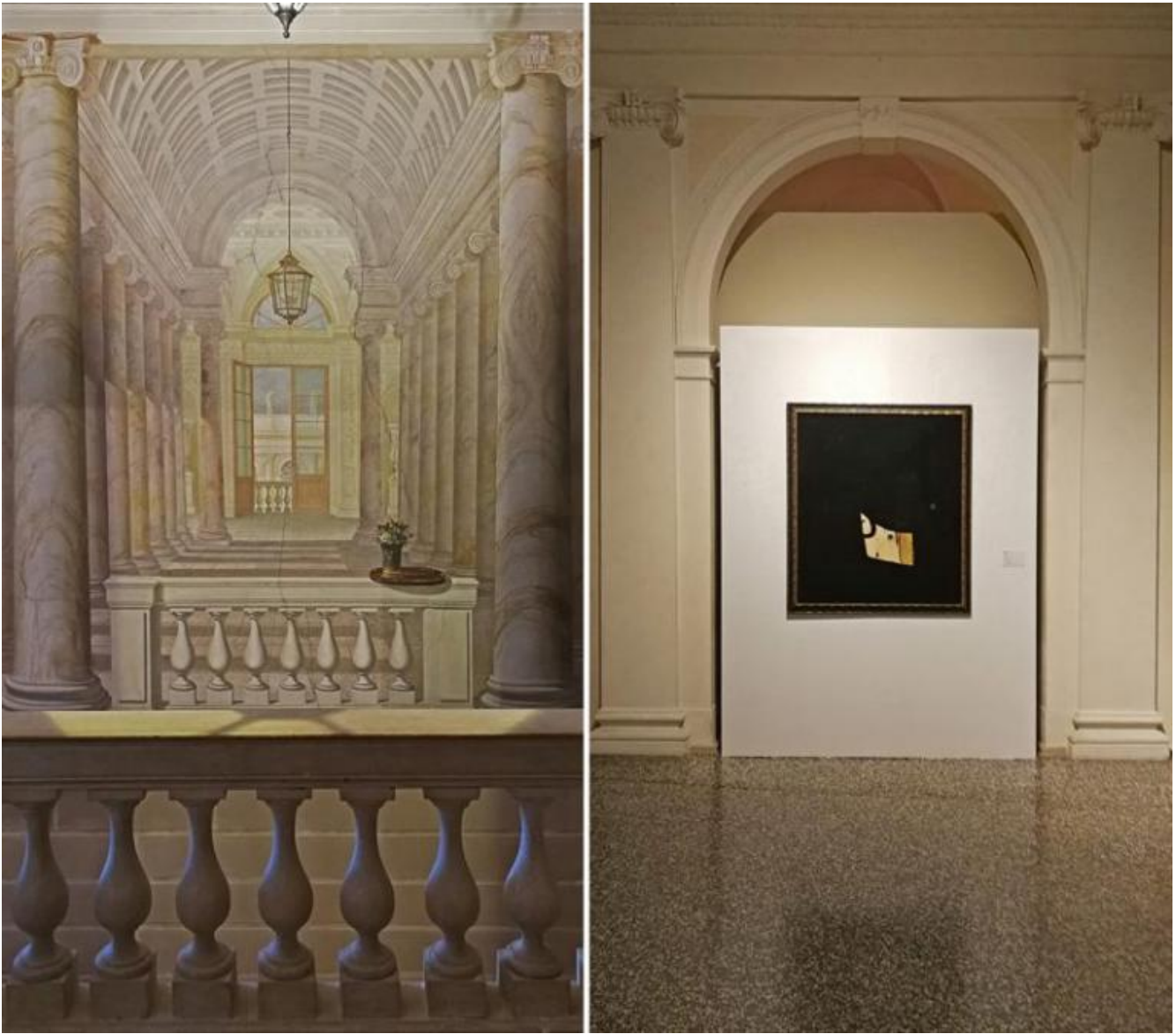
Doppia vista dell'ingresso alla mostra Joan Miró. Materialità e Metamorfosi allestita a Palazzo Zabarella, con veduta dell'opera Tête, 1973. Olio e collage su tela. Direção Geral do Património Cultural, Portogallo.