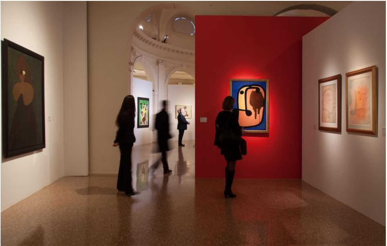
Veduta dell'allestimento della terza sala.

L'opera di Miró ha un rapporto con il mondo dell'infanzia anche per altre ragioni.