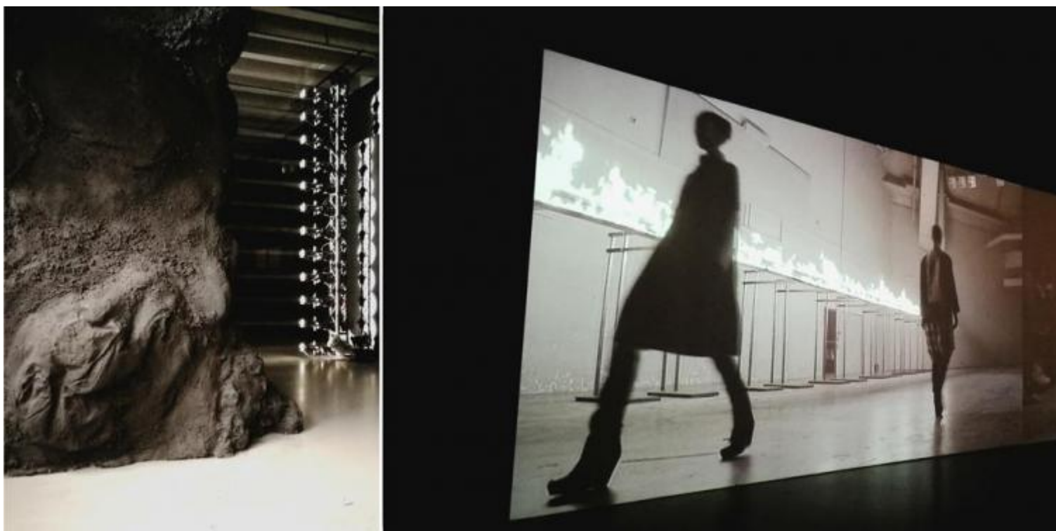
Rick Owens, Subhuman Inhuman Superhuman, vedute della mostra alla Triennale di Milano che ha avuto luogo dal 15 dicembre 2017 al 25 marzo 2018.