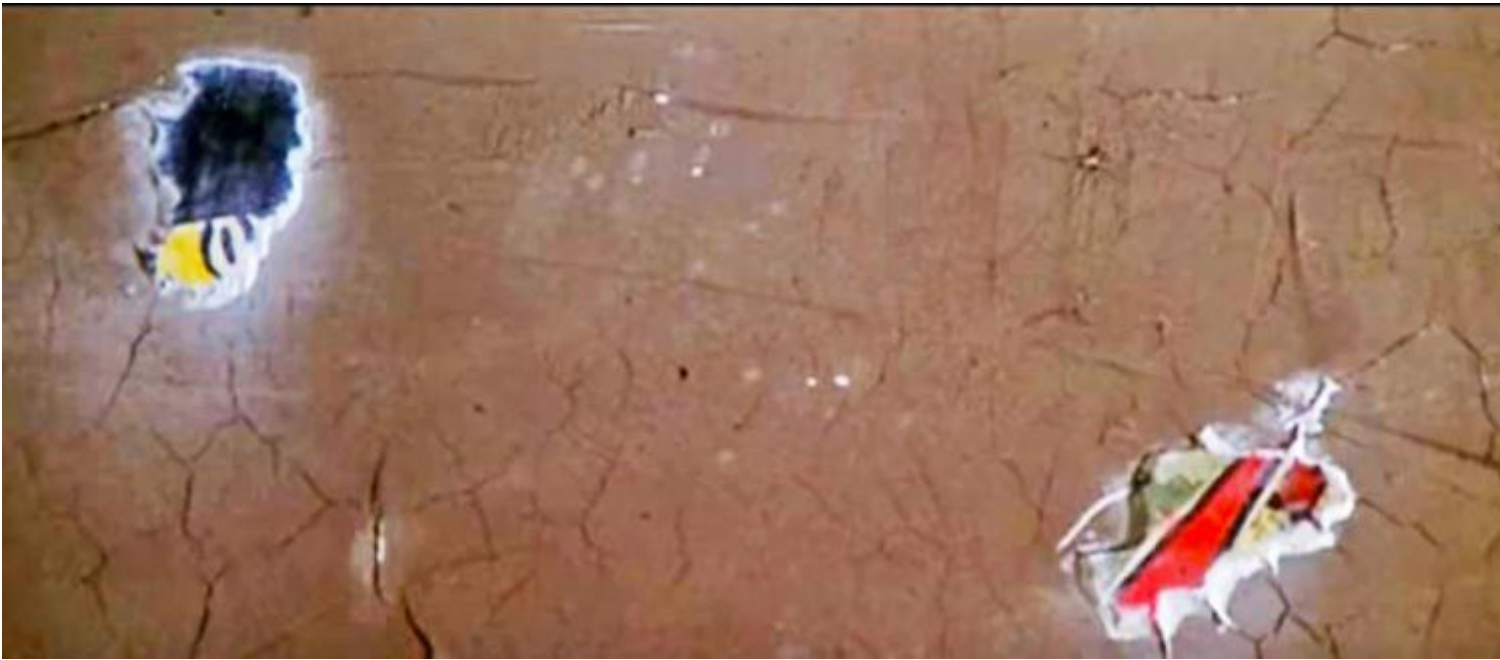
Dario Argento, fotogramma tratto dal film Profondo rosso del 1975.

Come Carlo, anche Miró è un innocente venuto a contatto con l'orrore che disegna e dipinge. Nelle opere degli anni Trenta, su cui incombono la guerra civile spagnola e il successivo conflitto mondiale, prende forma un universo di creature mostruose che gesticolano nel vuoto. La mostruosità si rivela anche attraverso le forze scatenate dall'artista con una sperimentazione aggressiva dei materiali, al fine di violentare e assassinare i metodi convenzionali della pittura. La violenza che Miró infligge alla figurazione è presente anche nelle opere realizzate negli anni Settanta tagliando, colorando e bruciando le famose cinque tele esposte nella grande retrospettiva allestita al Gran Palais di Parigi nel 1974.