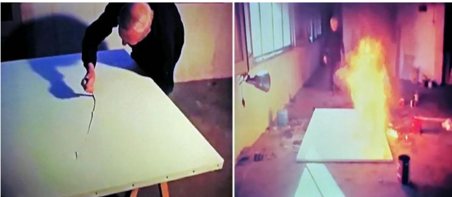
Català Roca, film su Joan Miró girato nel 1973 e prodotto dalla galleria Maeght. Fotogrammi tratti dal film.

Come Carlo, anche Miró è un innocente venuto a contatto con l'orrore che disegna e dipinge. Nelle opere degli anni Trenta, su cui incombono la guerra civile spagnola e il successivo conflitto mondiale, prende forma un universo di creature mostruose che gesticolano nel vuoto. La mostruosità si rivela anche attraverso le forze scatenate dall'artista con una sperimentazione aggressiva dei materiali, al fine di violentare e assassinare i metodi convenzionali della pittura. La violenza che Miró infligge alla figurazione è presente anche nelle opere realizzate negli anni Settanta tagliando, colorando e bruciando le famose cinque tele esposte nella grande retrospettiva allestita al Gran Palais di Parigi nel 1974.