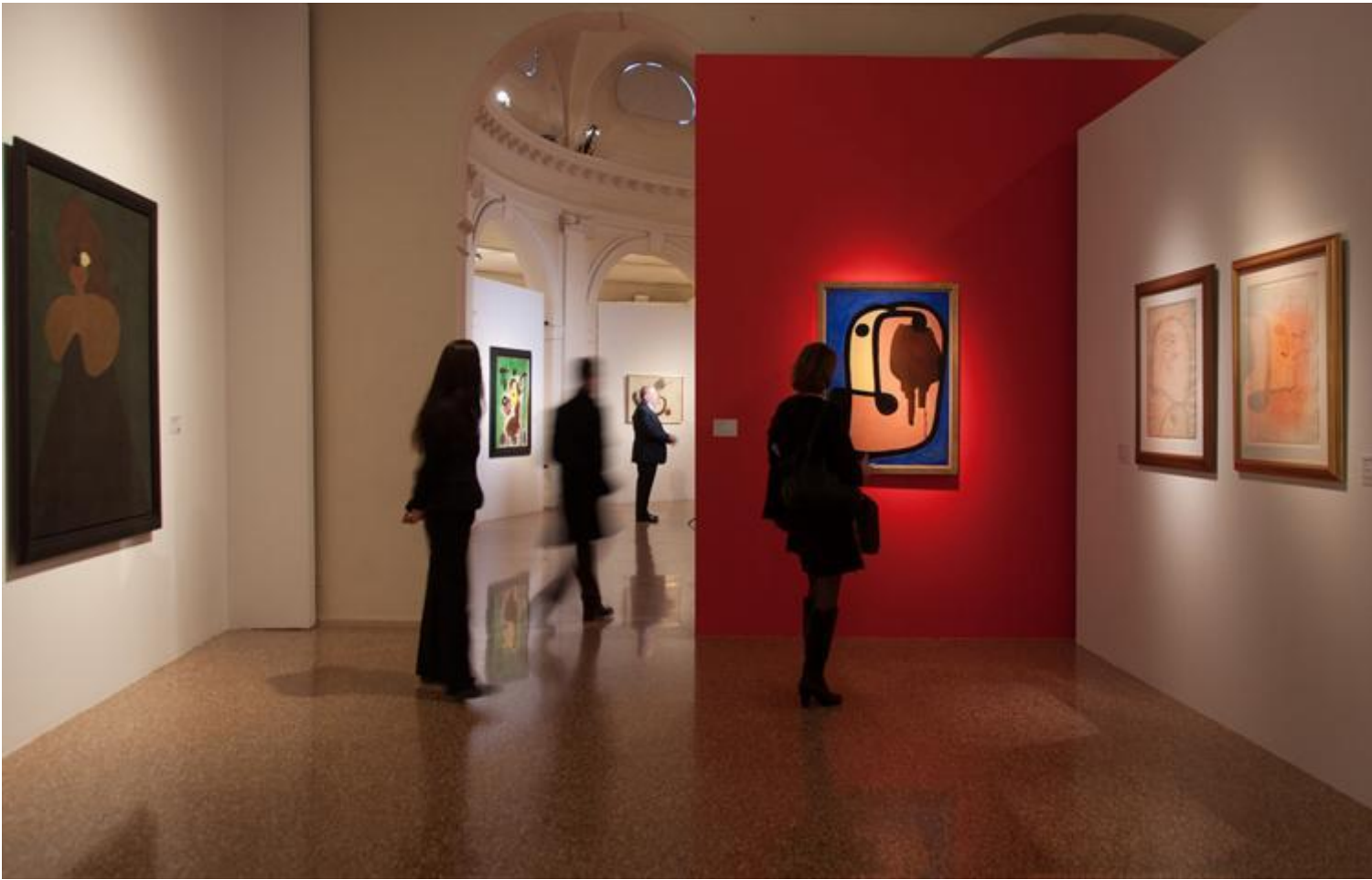
Veduta dell'allestimento della terza sala.

L'opera di Miró ha un rapporto con il mondo dell'infanzia anche per altre ragioni.