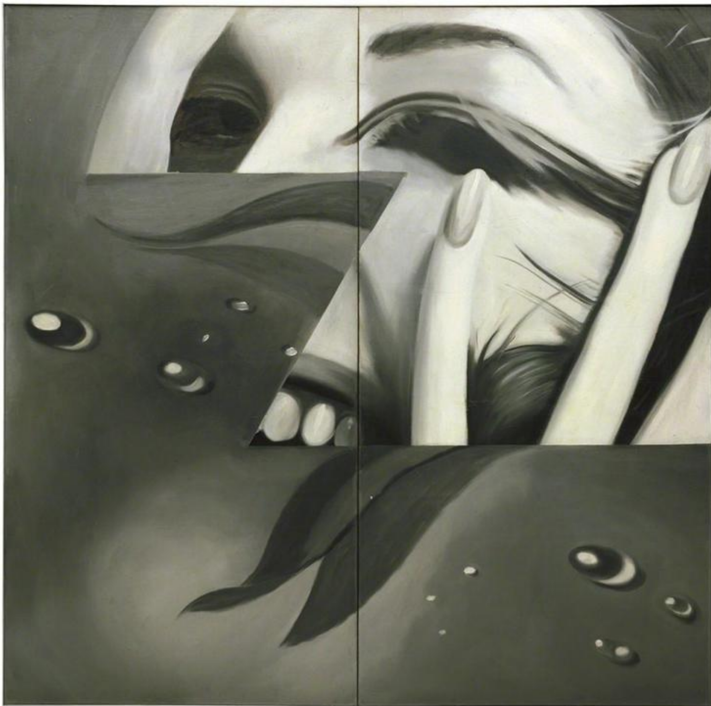
Rosenquist Dust, 1960.

La tonalità monocroma e grigia rende difficile decifrarlo al primo sguardo. Si riconoscono un volto femminile sorridente, lo sguardo obliterato, e la pelle di un pomodoro. Due elementi che coesistono sulla tela di grandi dimensioni (240 x 245 cm) nonostante la differenza di scala: il pomodoro è grande quanto il volto. Zone è articolato in due parti dentellate, a zigzag, nettamente divise, inconciliabili ma intimamente connesse. La ciocca di capelli della donna si confonde con le foglioline del peduncolo di pomodoro; i denti bianchi con i riflessi di luce sulle gocce di rugiada; l'arcata delle sopracciglia con la piega delle foglioline vegetali. Le dita della mano sbucano dal nulla, come se non appartenessero allo stesso corpo del volto.