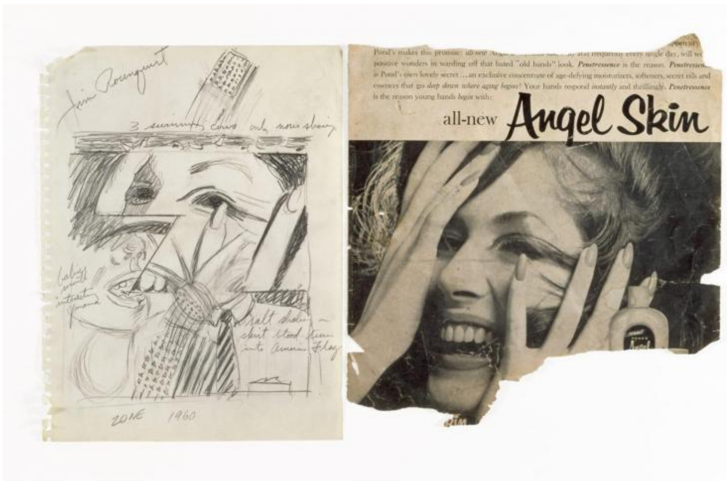
Rosenquist Dust, 1960.

La loro filosofia di vita – che riassume così: “Nothing means nothing means nothing” – lo affascina. Vede Kerouac alla televisione partecipare al “The Steve Allen Show”: “Ci dica Jack, cosa è la Beat generation?”. E lui, scarruffato come se uscisse da un romanzo di Dostoevskij, ribatte: “Nothing”, si alza e se ne va.