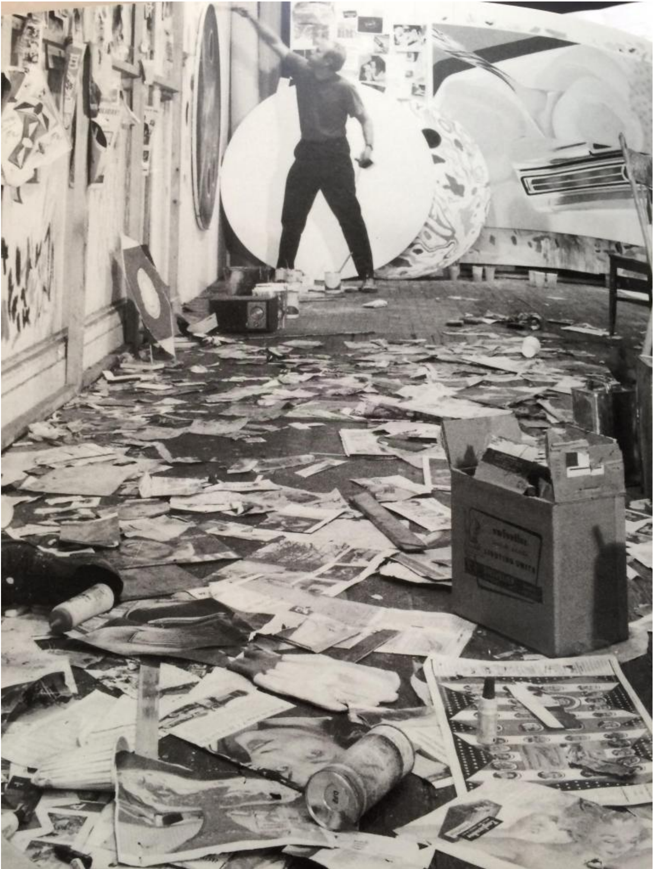
1964, ph Ugo Mulas.