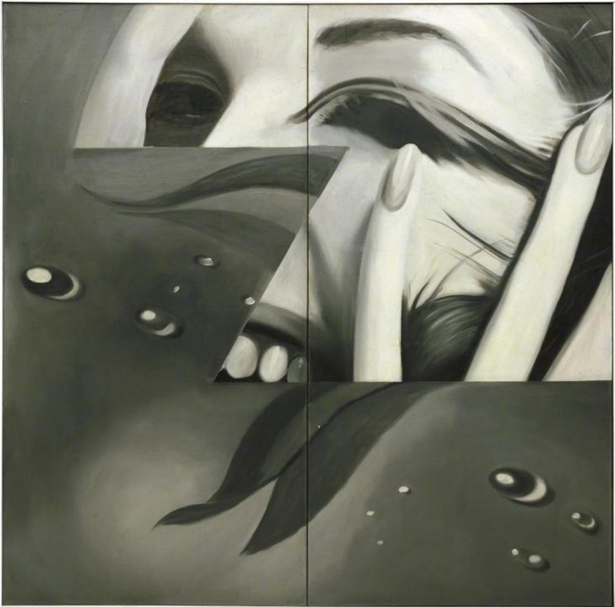
Rosenquist Dust, 1960.

La sezione destra di Zone viene dalla pubblicità di una lozione per la pelle che trova su "Life". Nulla si sa della sezione sinistra, si dice sia un pomodoro ed è tutto.