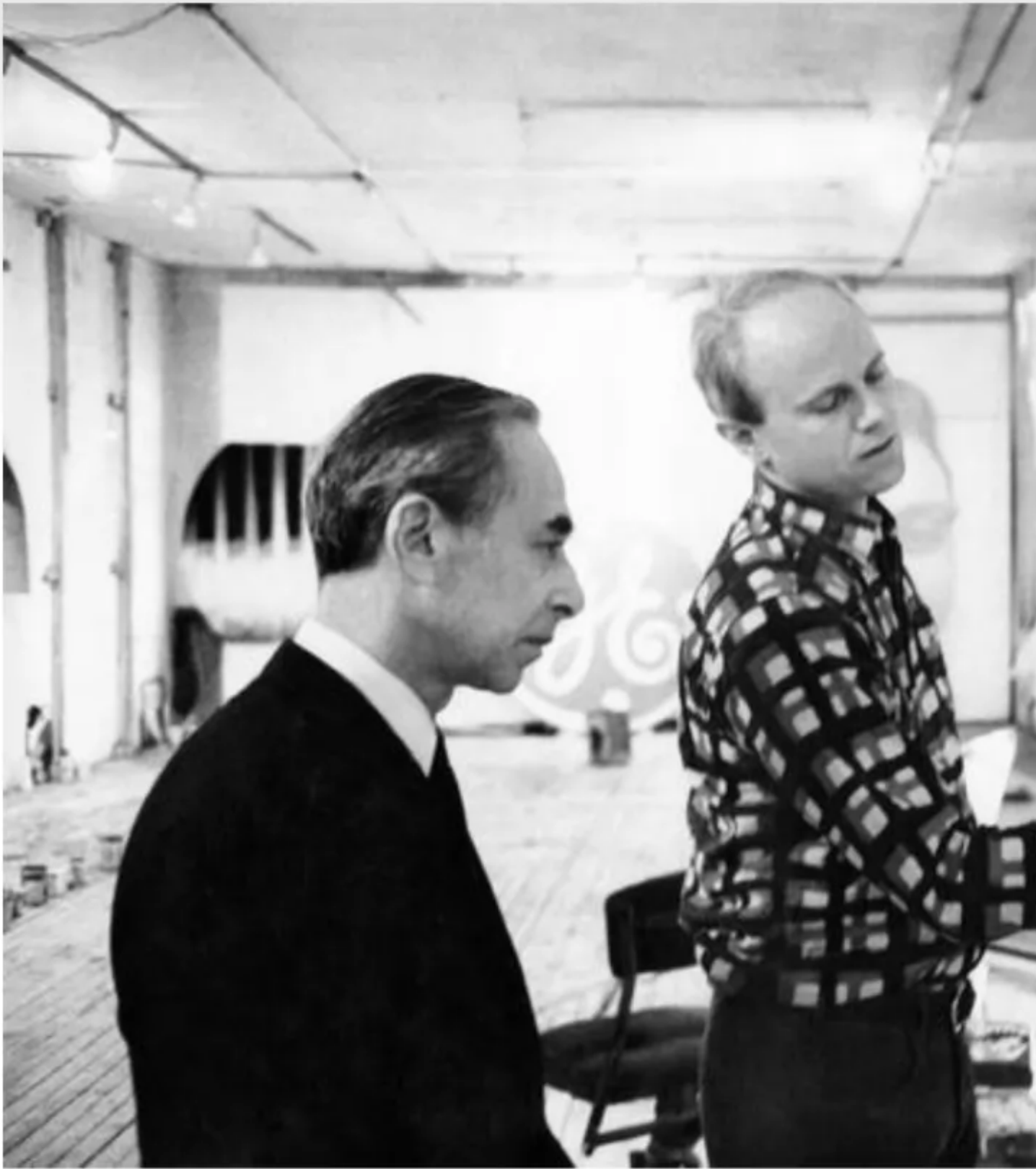
Leo Castelli and Rosenquist, Broome Street studio, New York, 1966. Works partially visible in background, left to right: Waco, Texas ; Circles of Confusion and Lite in progress; and Big Bo ; all 1966