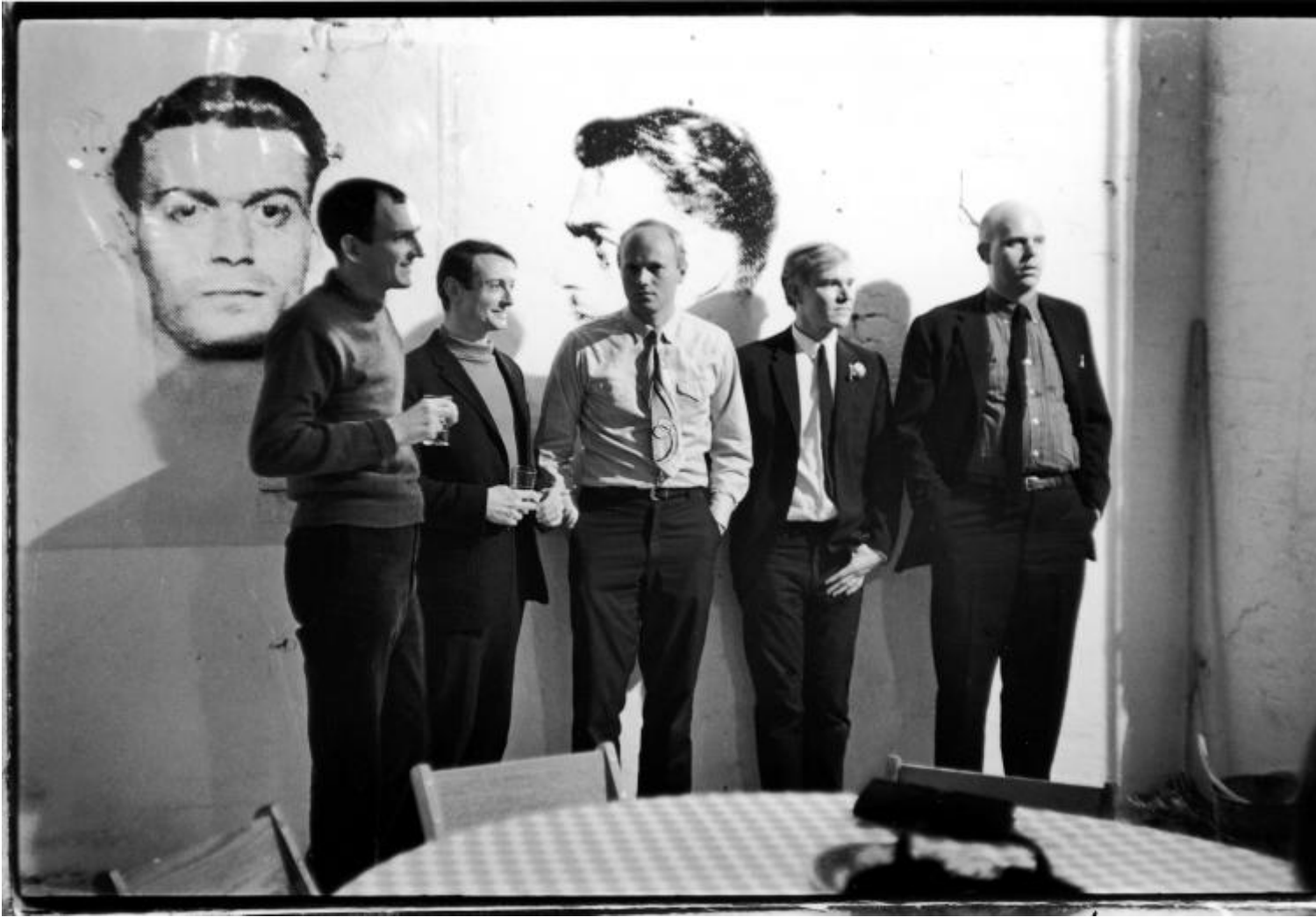
1964 con Wesselman, Lichtenstein, Warhol e Oldenburg nel loft di Warhol.

Una sera invita a casa sua il curatore Henry Geldzahler e Warhol. Terminata la cena, verso le dieci, Warhol chiede: