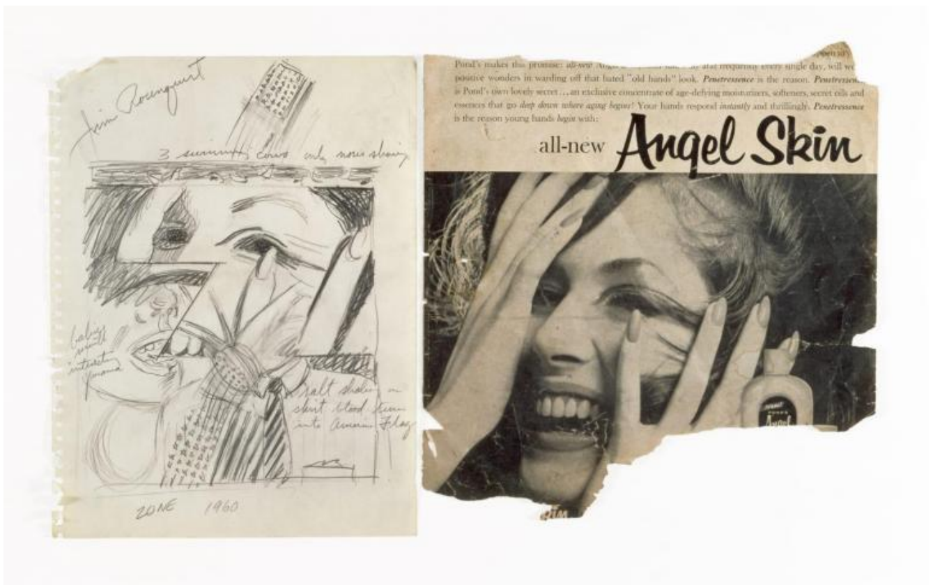
Rosenquist Dust, 1960.

Prima di venire a New York non aveva mai sentito parlare di beat e di underground, di Jack Kerouac, William Burroughs e Allen Ginsberg.