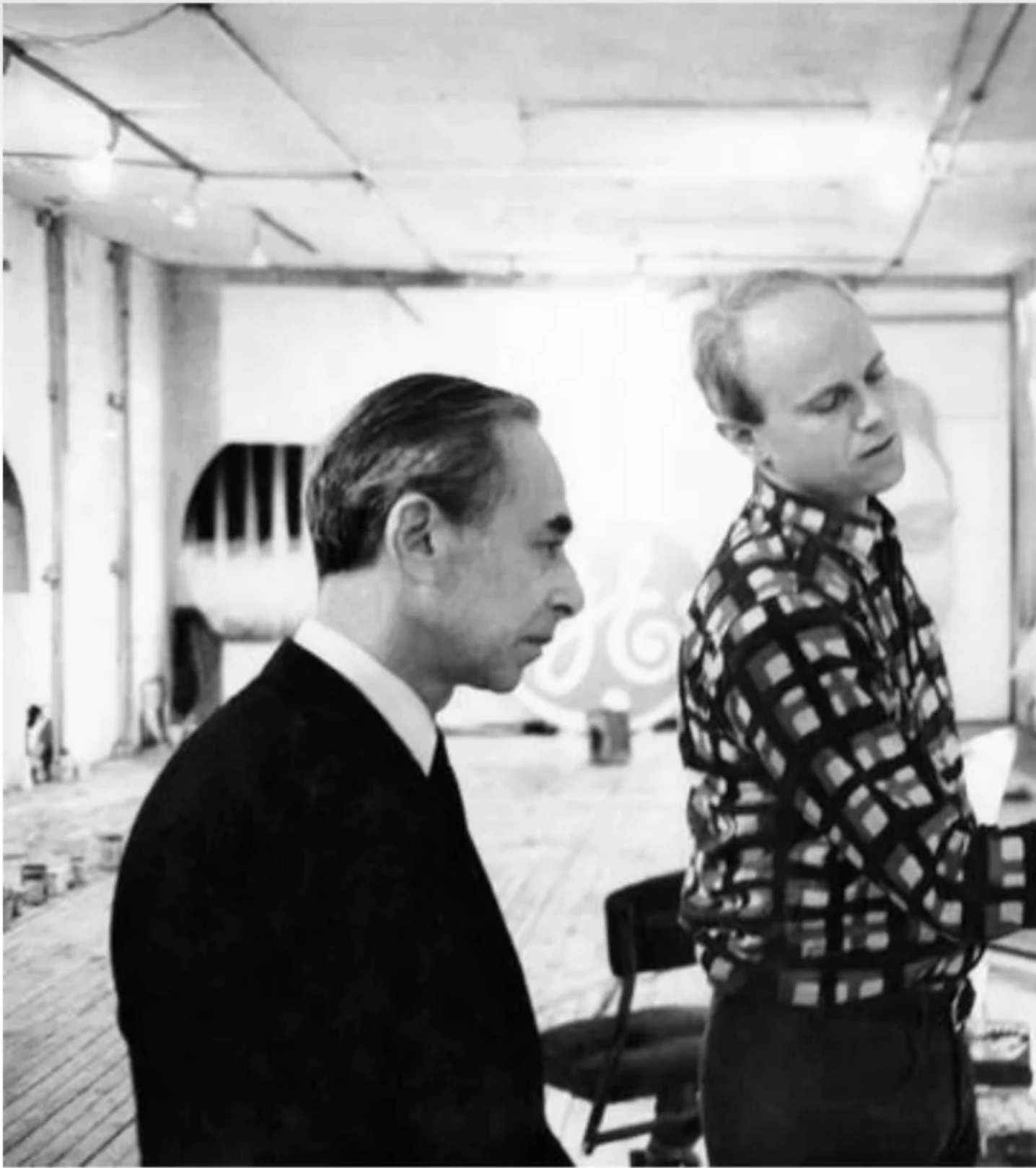
Leo Castelli and Rosenquist, Broome Street studio, New York, 1966. Works partially visible in background, left to right: Waco, Texas ; Circles of Confusion and Lite in progress; and Big Bo ; all 1966