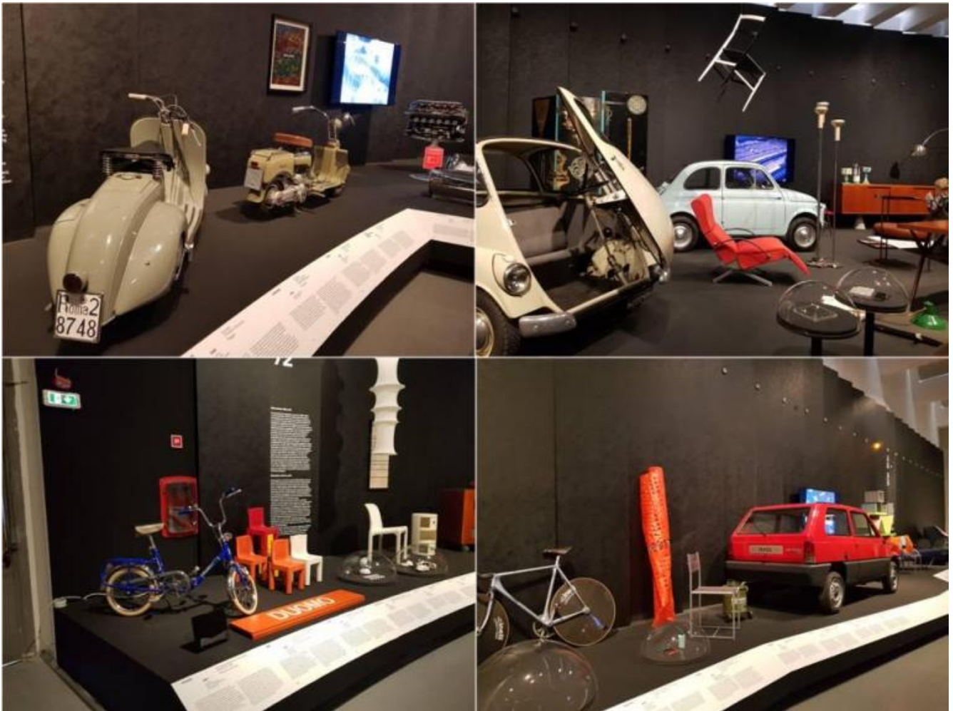
Alcuni scorci del percorso espositivo.

di quelli urbani per davvero . E non è un handicap neppure la loro collocazione nello spazio: appoggiati, sospesi, appesi, ritti, sdraiati, frontali, di scorcio, di profilo, esattamente come accade a quelli che si incontrano on the road . Inoltre, che la Superleggera 699 (di Gio Ponti per Cassina, 1957) galleggi nell'aria a tre metri dal suolo sopra la 500, della quale è coetanea, non ci disturba affatto, non dopo centocinque anni dalla Ruota di bicicletta di Duchamp. Anzi, quella collocazione stigmatizza il suo essere divenuta icona del design, in dialogo, lassù, nell'aria, con un'altra poltrona leggera perché d'aria è trionfalmente rigonfia, la Blow (di De Pas, D'Urbino, Lomazzi per Zanotta, 1967), anch'essa una vera star.