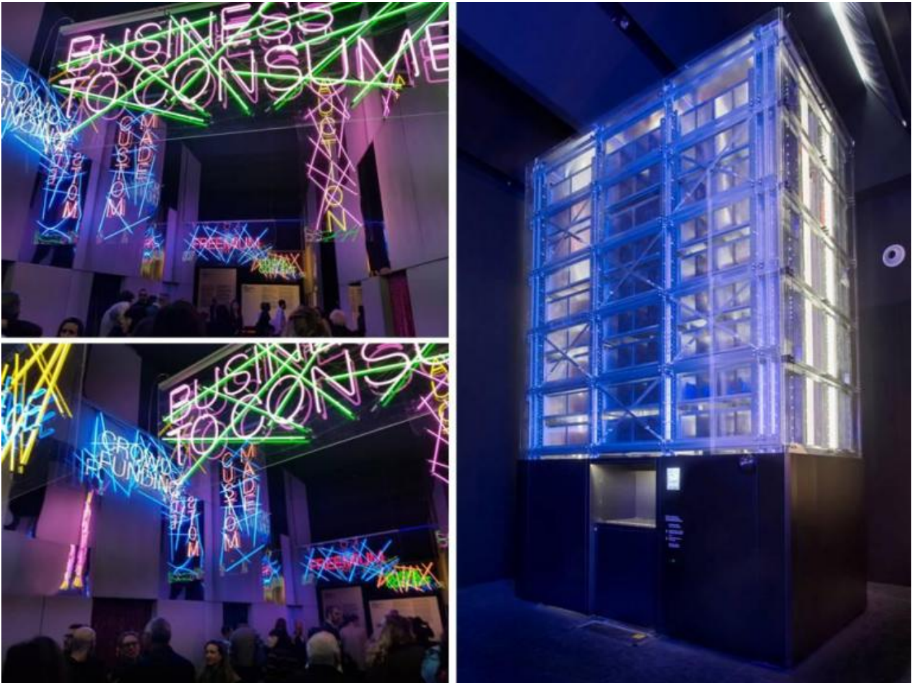
Milano. XI Triennale Design Museum, Storie. Il design italiano. (ph. MLG).

Quasi fossero emergenze architettoniche, case e non cose, tra auto parcheggiate, dalla 202 Coupé (di Giovanni Savonuzzi e Pinin Farina per Cisitalia, 1947), alla Ferrari 125S (di Gioacchino Colombo per Enzo Ferrari, 1947), dall' Isetta (di Ermenegildo Preti per Iso Rivolta, 1953), alla mitica 500 (di Dante Giacosa per Fiat, 1957), alla Panda (di Giorgetto Giugiaro per Fiat, 1980); biciclette, dalla Graziella (di Rinaldo Donzelli per Teodoro Cinelli, 1964), alla Laser (di Antonio Colombo, Paolo Erzegovesi, Gianni Gabella per Cinelli, 1980); moto e motorini, dalla Vespa (di Corradino d'Ascanio per Piaggio, 1946), alla Lambretta (di Pier Luigi Torre e Giacomo Pallavicino per Innocenti, 1947), dal Ciao (di Bruno Gaddi per Piaggio, 1967), fino al Monster 900 (di Miguel Galluzzi per Ducati, 1993), che chiude il percorso, i pezzi si susseguono con un andamento cronologico; emergono, ma anche si celano, l'uno dietro all'altro, per lasciarsi scoprire, farsi riconoscere, tetragoni e al contempo lievi nella loro conclamata iconicità.