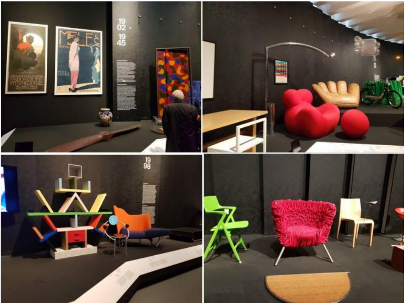
Scorci espositivi di Storie.