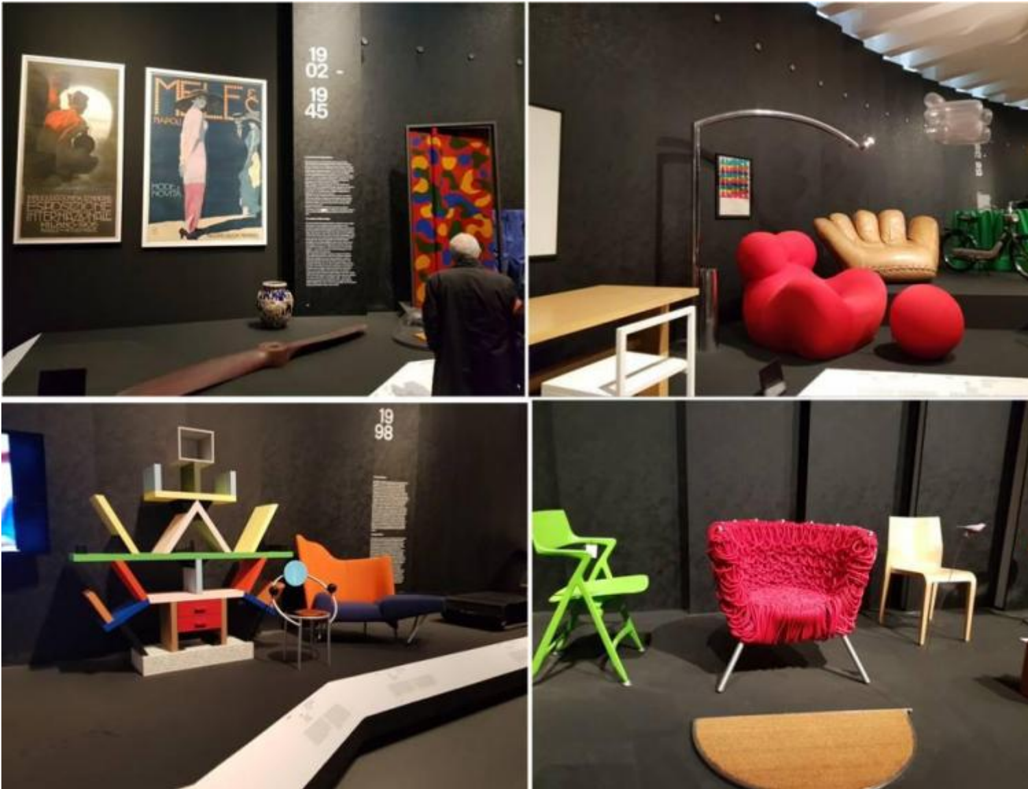
Scorci espositivi di Storie.

che vanno affrontati con logiche differenti rispetto a quelle adottate per il novecento.