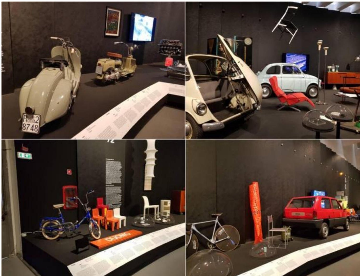
Alcuni scorci del percorso espositivo.

stigmatizza il suo essere divenuta icona del design, in dialogo, lassù, nell'aria, con un'altra poltrona leggera perché d'aria è trionfalmente rigonfia, la Blow (di De Pas, D'Urbino, Lomazzi per Zanotta, 1967), anch'essa una vera star.