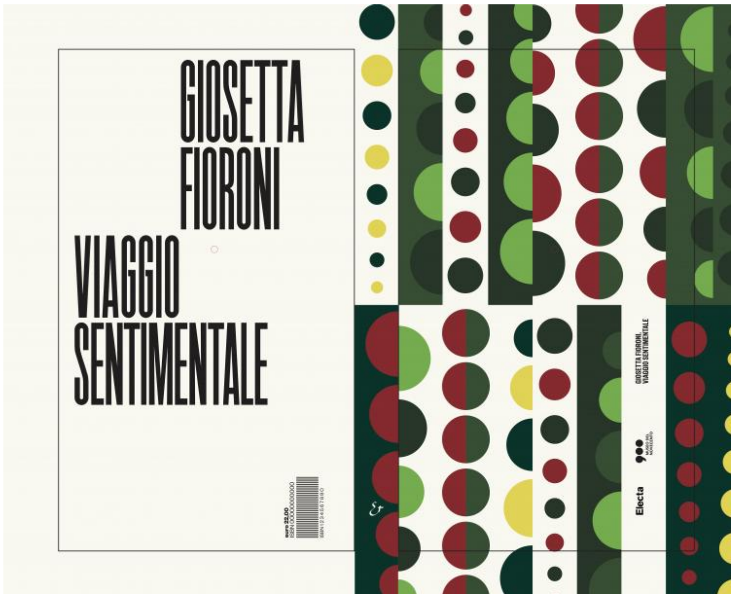
Giosetta Fioroni, Viaggio sentimentale, Electa 2018 (progetto grafico di Leonardo Sonnoli)

book che è il catalogo: le cui pagine sono, a loro volta, tutte attraversate da un buco traguardabile.