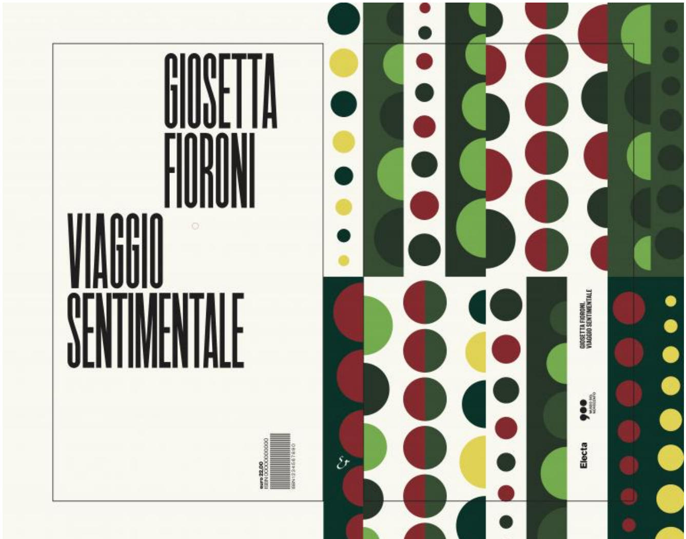
Giosetta Fioroni, Viaggio sentimentale, Electa 2018 (progetto grafico di Leonardo Sonnoli)

morfologico della spia era già (osserva acutamente Obrist) nei costumi Optical realizzati per l'altrettanto mitica, fischiatissima Carmen "strutturalista" messa in scena l'anno precedente, a Bologna, da Alberto Arbasino con la consulenza di Roland Barthes: una cui grande foto è in fondo alla sala (un po' sacrificata, a lato del corpo principale dell'esposizione) dove c'è appunto la ricostruzione della Spia ottica (purtroppo, però, senza attrice dentro). E torna adesso, mercé la grafica di Leonardo Sonnoli, nel concept-book che è il catalogo: le cui pagine sono, a loro volta, tutte attraversate da un buco traguardabile.