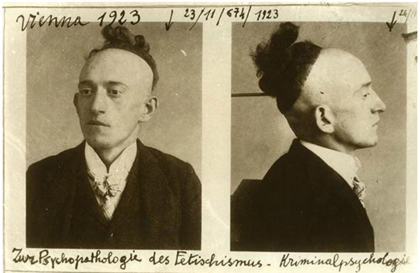
Giosetta Fioroni, da "Atlante di medicina legale", 1976.

due si pongono a capo di tradizioni narrative contrapposte. In comune hanno senz'altro, però, l'occhio micidiale col quale scrutano quelli che Giosetta chiama «particolari, attualità caratteriali, deformazioni, “tic” e fisionomie dei personaggi». È la stessa attrazione kafkiana che Goffredo Parise aveva per le piccole malformazioni, i microimbarazzi fisici dei suoi contemporanei: dettagli rivelatori di dissimulate debolezze che era capace di ingrandire, se voleva, con spasso malizioso e crudele. Quello stesso che a Giosetta, oggi, fa collezionare «fisionomie rospace», «gambette troppo magre» o «gambe feroci», «bambini brutti» e «tipi buffi e disarmonici», «arcigni [...] assai ciccioni e deformi», «donnine-pesce» e «avvenenti nane» (mi ha sempre colpito come, nei ricordi delle sue frequentazioni parigine '58-62, le sia rimasto ossessivamente impresso, di uno scrittore pur ammirato come Beckett, il dettaglio delle «caviglie blu»: causa il freddo ma, soprattutto, l'ostinazione di non voler mai indossare calze).