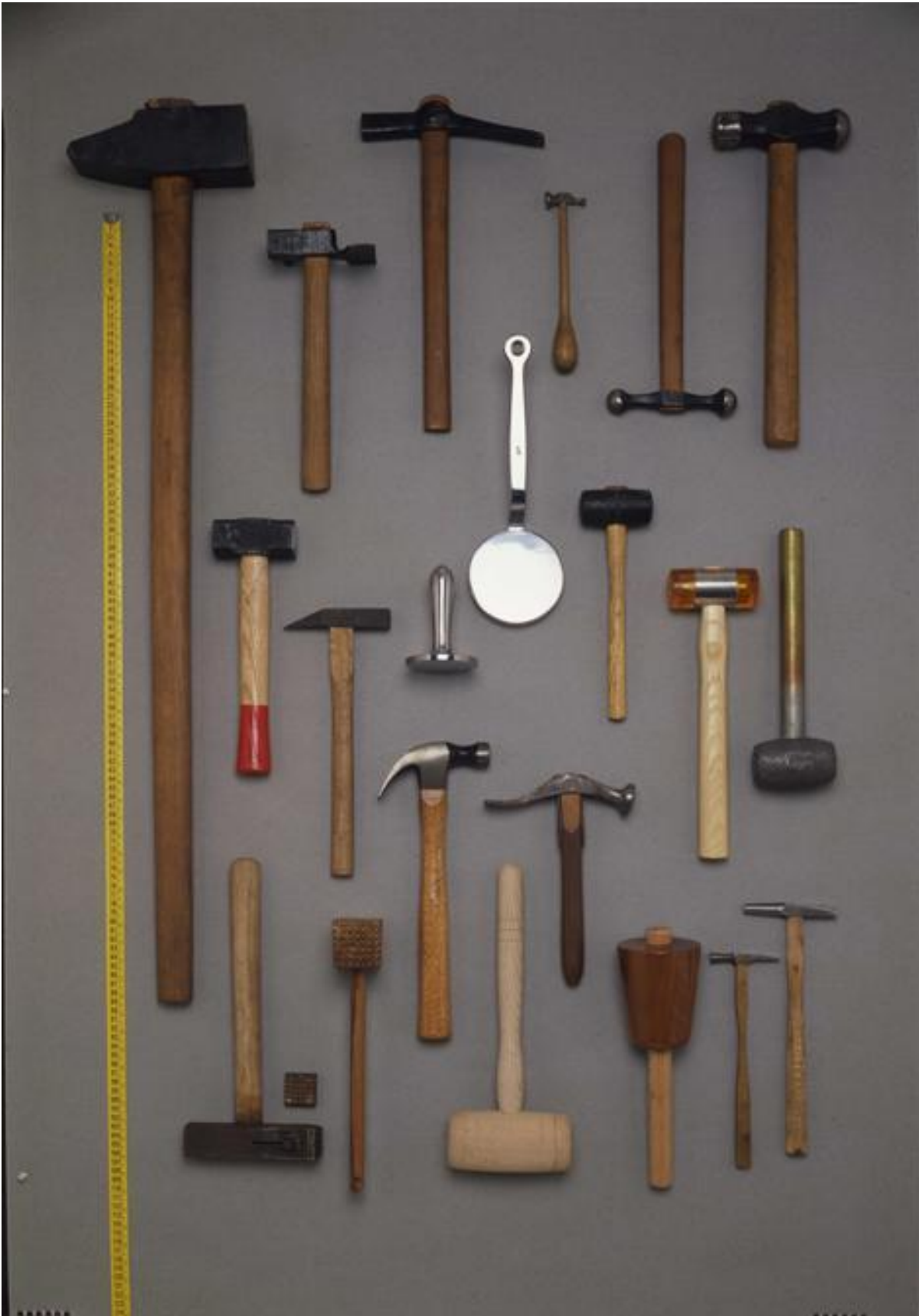
Collezione di oggetti anonimi (vari tipi di martelli) di Achille Castiglioni. La forma, la dimensione, il peso e il materiale di ogni martello hanno strettamente a che fare con la sua funzione.