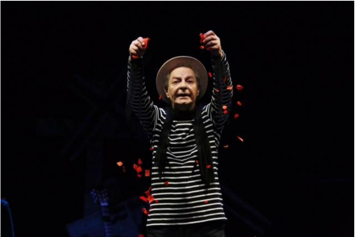
Enzo Moscato in Raccogliere & Bruciare.

Mi è capitato nell'ultimo mese di vedere tre spettacoli dell'artista napoletano che Francesca Saturnino ha intervistato qualche settimana fa per doppiozero ( leggi qui ). Essi coprono un arco di tempo che va dagli anni ottanta a oggi; l'ho visto in scena da solo, con pochi compagni o con un gruppo nutritissimo di quella tribù di amatori e professionisti che è riuscito a riunire con il suo carisma nell'ultimo Raccogliere & Bruciare ( Ingresso a Spentaluce ), lavoro pompeiano. Ho letto la sceneggiatura per un film mai girato, Ritornanti , ispirato alla pièce teatrale Spiritilli , pubblicata da Cronopio, una folla sullo schermo, prima quella dei giornalieri viaggiatori della nuova metropolitana di Napoli, poi due giovani sposi poveri in cerca di casa: tutti circondati da spiriti, spiritelli, folletti, anime dei defunti, munacielli, quella fitta nebulosa di ectoplasmici, a volte beffardi, a volte benevoli, a volte traditori, che popolano da sempre la sua terra, anche la modernissima Neapolis continuamente affollata di figure che provengono da altri luoghi, altri strati, da altre voci, proiezioni di un Aldilà o forse di molti aldilà o aldiquà, che con il qui e ora si intrecciano, interagiscono, influenzano, riempiono, lasciando, questi fantasmi , un enorme appartamento vuoto senza neppure un millimetro di spazio, come in un incubo a lieto fine dell'essere, dell'essere stati, del poter essere.