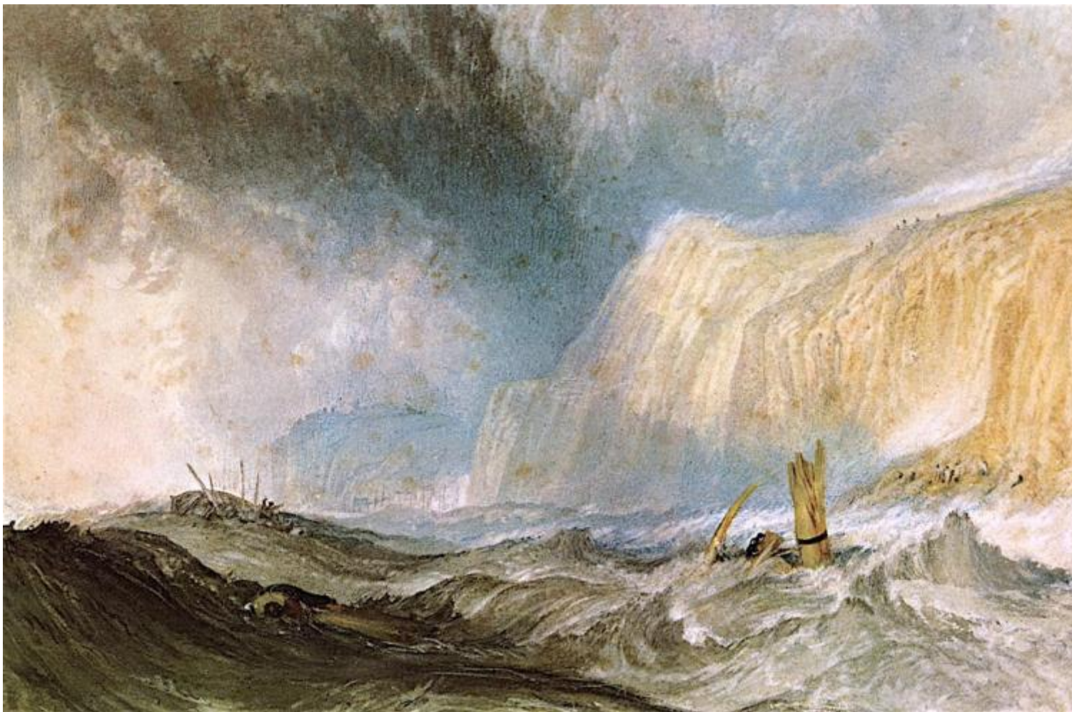
A Shipwreck off Hastings, di William Turner.

Non si tratta di un'argomentazione dal carattere distruttivo. La sua intenzione è solo quella di invitare a usare le parole con maggiore cautela, meglio a evitare quelle che sembrano spiegare che cosa sia il teatro, quando in realtà ne offuscano in parte la natura. Ciò non vale solo per i termini "sociale" e "d'arte". Anche altri aggettivi ben scelti quali "povero", "ipnotico", "crudele", "epico", "umano" incorrono nel medesimo rischio di dire quello che è già noto (= che il teatro è un fatto artistico) e di isolare un unico aspetto, a discapito di tutti gli altri. Essi infatti negano, ad esempio, che il teatro possa essere in un altro senso "ricco", perché regala allo spettatore dei beni che perfezionano le loro capacità, o "disumano" in senso positivo, qualora cercasse di eliminare dalla nostra natura tutto ciò che è superfluo, vano, idiota. Il teatro è forse un puro neutro, che può diventare tutte queste cose perché non è in sé né povero né ricco, né umano né disumano, né sociale né asociale, e così via – forse all'infinito. Non c'è probabilmente parola umana che riesca a condensare tutte le sue enormi potenzialità vitali e cognitive, che in larga parte potrebbero anzi risultare ancora inesplorate e impensate.