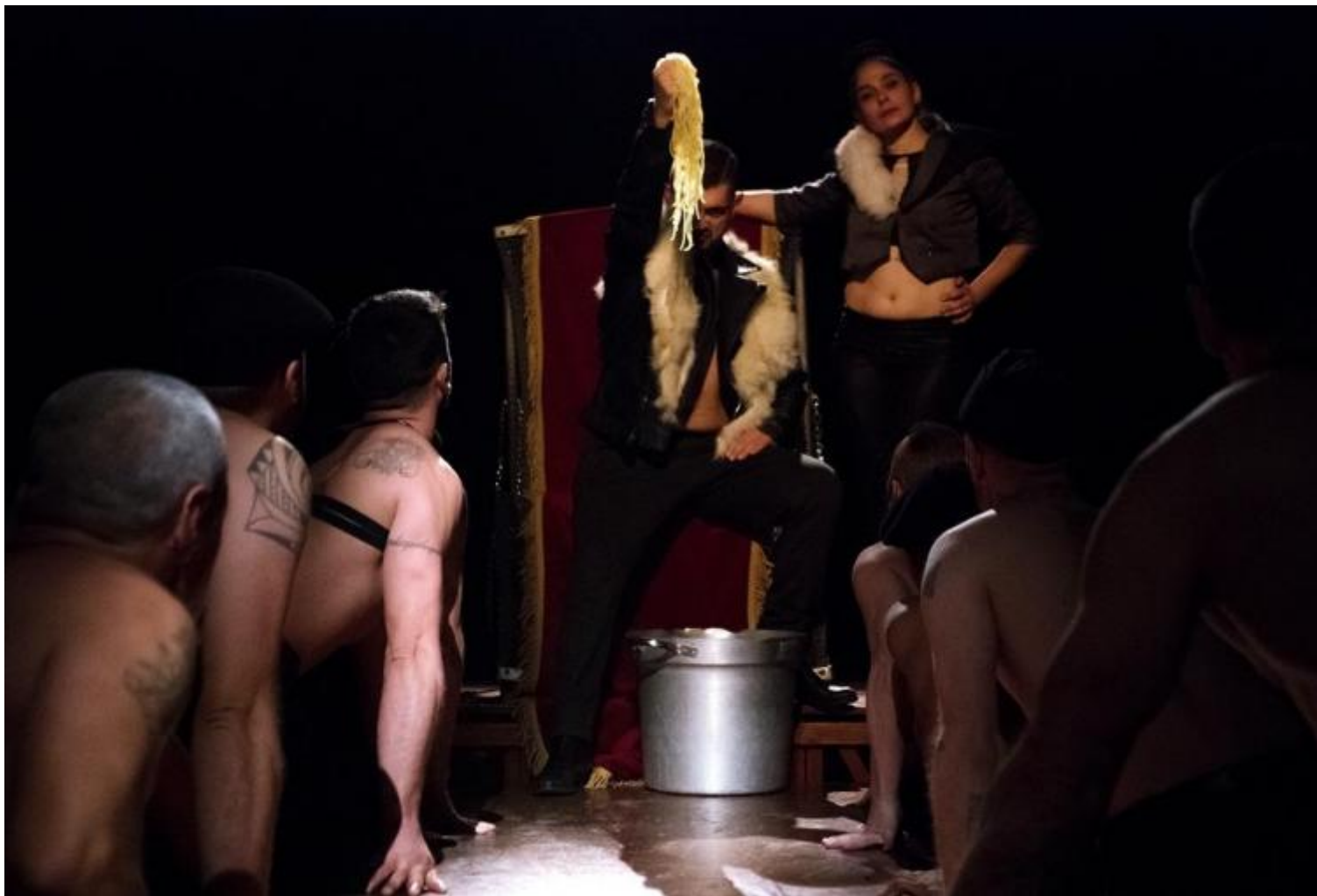
Teatro dei Venti, Ubu re, ph. Chiara Ferrin.

parlare in termini di «evasione», sarà un aspetto da precisare in seguito.