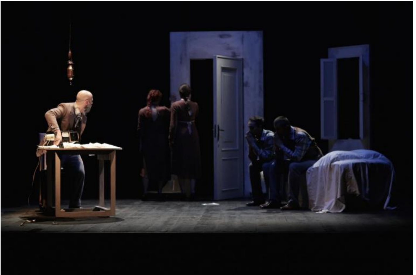
Desidera, Il teatro nel baule.

Evidentemente si tratta di una risposta alla crisi del teatro, al fatto che a un aumento delle produzioni e della creatività, manifestata con spettacoli di diverso tenore e stile, non corrisponde una possibilità di circuitazione adeguata. Potremmo dire che l'offerta supera la domanda, in un sistema teatrale che almeno fino non molto tempo fa sembrava saldamente arroccato in modi produttivi tradizionali o esclusivi, che lasciavano solo le briciole a quelli che vi arrivavano per vie non accreditate. La situazione sembra oggi più mobile grazie ai circuiti regionali, ai centri di produzione e al nuovo accento, perfino eccessivo in certi casi, posto sulla creazione di nuove opere, a detrimento spesso della garanzia di poter far girare prodotti "rischiosi". Eppure le programmazioni non riescono a far fronte alla massa di compagnie, piccole e grandi, di gruppi e singoli che cercano nel teatro la strada per esprimere una propria visione del mondo, o semplicemente per riversare un'aspirazione, la volontà di sperimentarsi in un lavoro inventivo, non servo. Un eccesso di produzione forse insostenibile, testimoniato dai cinquecento video arrivati.