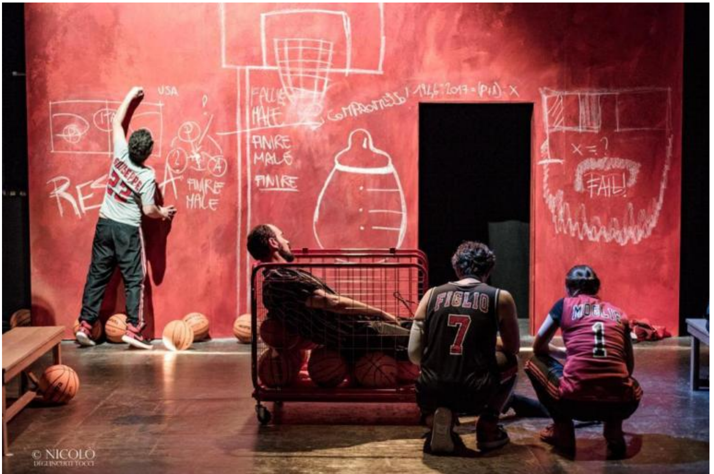
Nessuna pietà per l'arbitro, Centro teatrale MaMiMò.