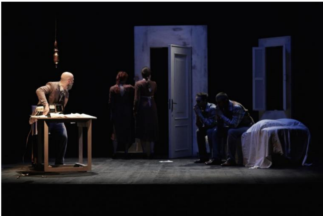
Desidera, Il teatro nel baule.

successive, finché i titoli prescelti (sei) vanno in scena dal vivo in due teatri di Siena in un fine settimana di maggio. A quel punto gli aderenti alla rete votano comprando uno spettacolo a testa per struttura: chi somma più recite vendute per la stagione successiva, vince.