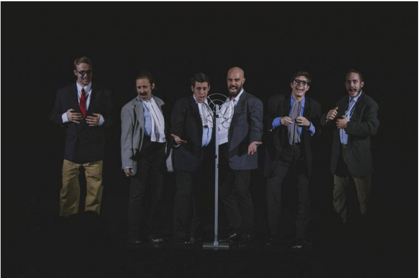
Phoebuskartell, Il ServoMuto Teatro.

Qui si pone un altro problema, vecchio in verità: come si può giudicare uno spettacolo, che vive di relazione, di spazi, prospettive e momenti particolari, dalla fissazione in un video, che privilegia un solo punto di vista, che sarà riduttivo nel caso di riprese non troppo sofisticate tecnicamente, o all'opposto eccessivamente artefatto, troppo ben costruito come video, tanto da abbellire, agghindare , e quindi anche in questo caso tradire, la performance originale. Insomma, il video è traditore e la sensazione per alcuni spettacoli visti a In-Box dal vivo, sezione adulti, è che la scelta sia stata male orientata da video troppo suggestivi, per spettacoli che in presenza esaurivano presto le proprie risorse.