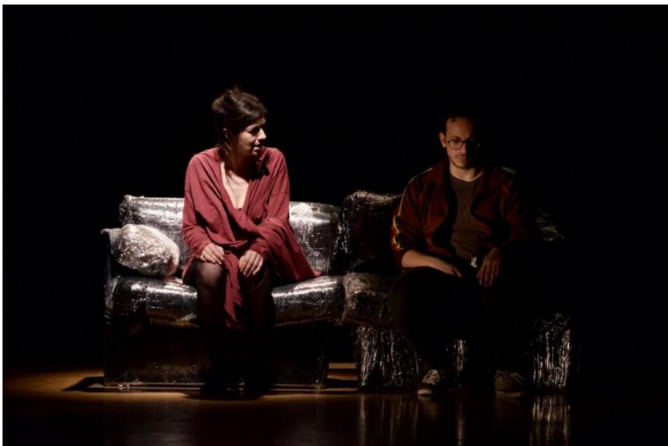
Lo soffia il cielo. Un atto d'amore, TrentoSpettacoli, ph. Umberto Terruso.

del lavoro che accompagna di solito la programmazione. E pure in qualche modo lo inventa, presuppone come soddisfarlo e moltiplicarlo sulla base di linee riconoscibili.