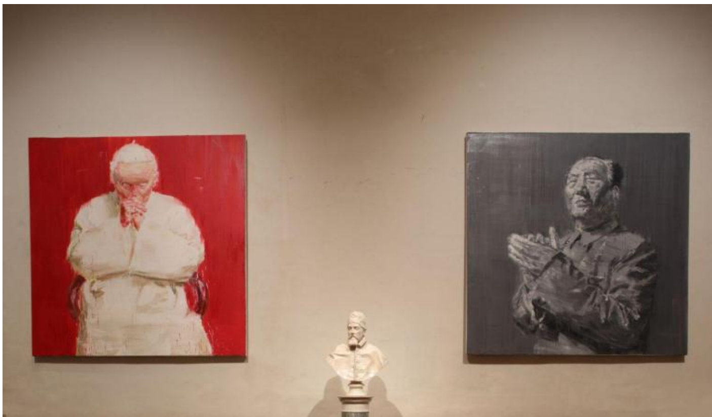
Ph Alberto Novelli, preview.

La storia dell'arte dei manuali ci insegna che, dal Cinquecento, ritratto e autoritratto si arricchiscono di aspetti interiori e che il secolo che affina l'osservazione della psiche è il Novecento. Cosa accade allora se oggi si guardano ritratti e autoritratti dal Cinquecento ai nostri giorni in un contesto forte e connotato come quello di Palazzo Barberini? Accade che si aprano suggestioni inaspettate. L'immagine è ovunque. Non solo, come normalmente dovrebbe essere, nelle sale di un museo, in una mostra, in un palazzo nobile di rappresentanza, ma di più. Di sala in sala si riflette sul funzionamento dell'immagine, sul vedere e sul rappresentare. Risulta evidente, ad esempio, nell'accostamento tra Il Nudo femminile di schiena di Pierre Subleyras e i nudi SBQR , netnud , etc. di Stefano Arienti, lo slittamento percettivo tra l'immagine della nudità e dell'intimità dal privato al pubblico, oppure ci si sorprende di fronte alla 'concettualità' della Fornarina di Raffaello che, mostrando la donna, riesce a mostrare – in absentia – l'uomo, il pittore, unendo ritratto e autoritratto.