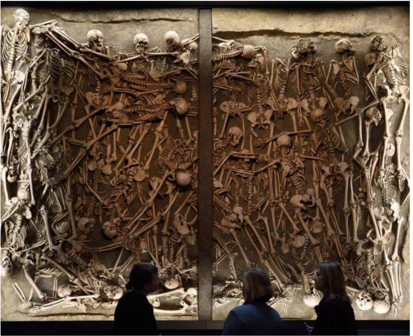
Fossa comune nei pressi della battaglia di Lützen (1632).