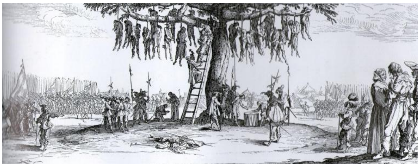
Jacques Callot “ L'albero degli impiccati”.

Questo ‘noi narrante’ che, infrangendo la misura della distanza storica, rivendica la sua presenza nell’età dei viventi è il primo indice di una chiara intenzione di Kehlmann: scrivere un romanzo storico sulla guerra, ma