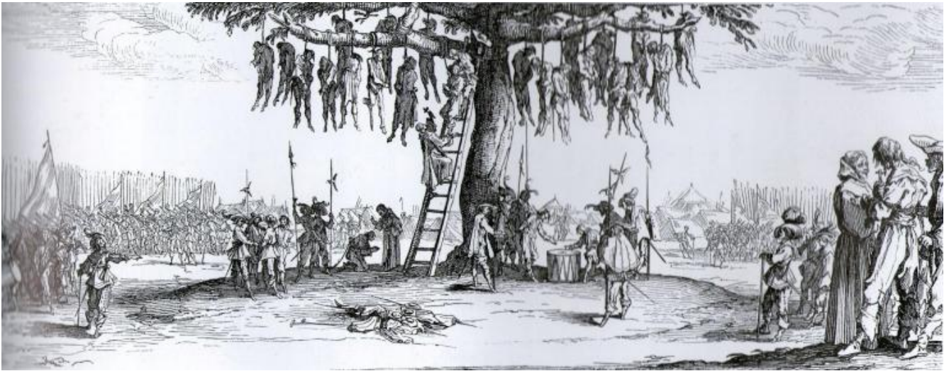
Jacques Callot "L'albero degli impiccati".