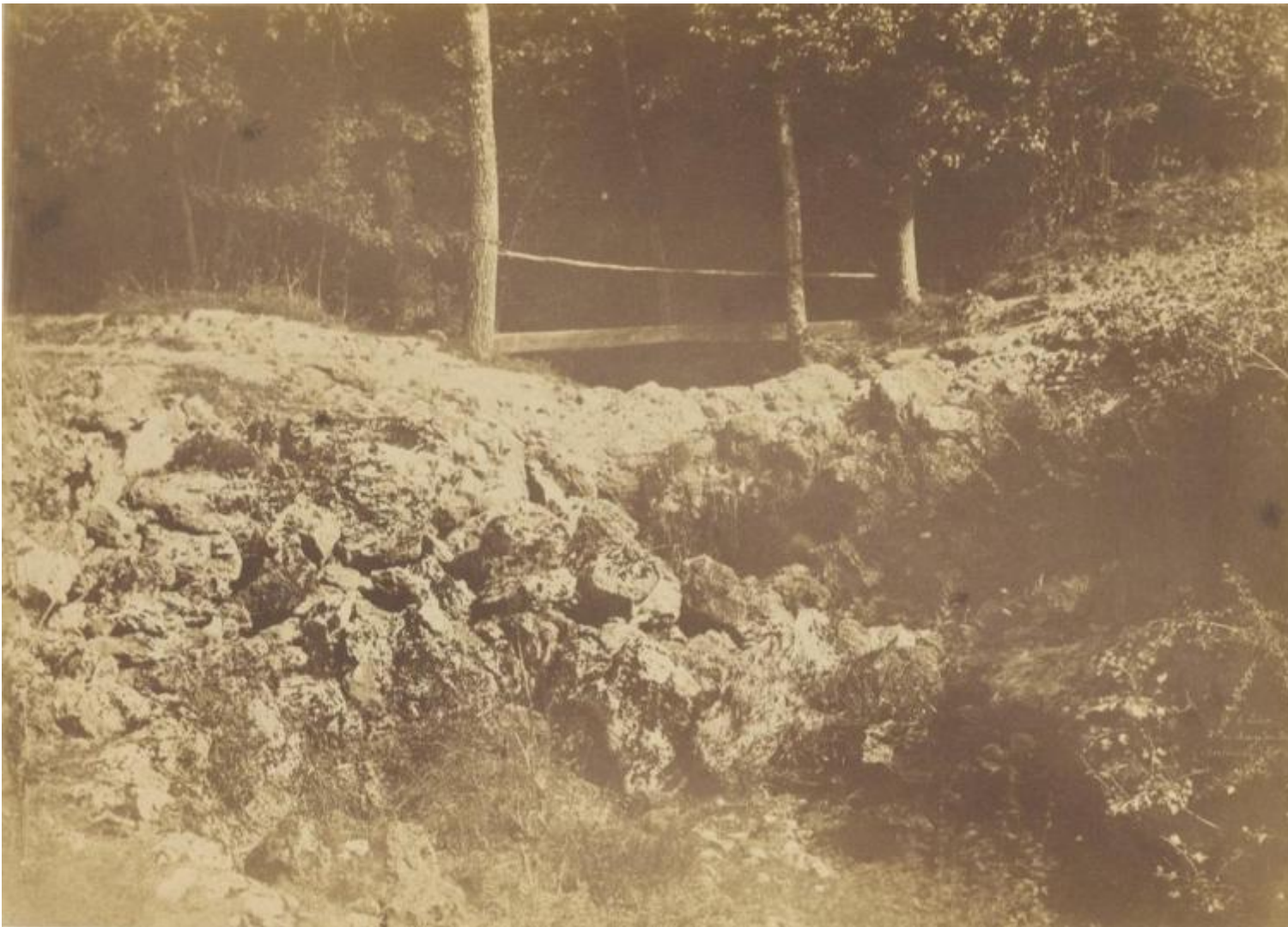
Henri Le Secq, Le Champ des Cosaques, Montmirail, 1852-1853

Sì, ed è una formula che mi ha permesso tra l'altro di concepire la mostra Une autre objectivité , dove erano presenti Jeff Wall e John Coplans, come pure Robert Adams e altri. L'idea di partenza era semplice: negli anni Settanta i fotografi erano contrapposti agli artisti che usavano la fotografia. Questa opposizione è durata a lungo, se pensi che quando ho curato Walker Evans & Dan Graham nel 1992 mi ci sono ancora scontrato: da un lato, mi si diceva, non si può accostare un artista concettuale a un maestro della storia della fotografia, e quest'ultima espressione era beninteso carica di una connotazione nettamente dispregiativa. Dall'altro, mi si ripeteva, non si può mettere un maestro così importante a fianco di un artista concettuale che fa immagini senza interesse. Ho fatto di tutto per superare questa separazione, cercando di mostrare che si poteva essere artisti, usare la fotografia e fare delle fotografie . La dimostrazione era evidente nel caso di due artisti a cui sono stato molto vicino come Coplans e Wall: facevano qualcosa di diverso dal fare fotografie? Allo stesso tempo, non erano dei fotografi, erano davvero artisti che usavano la fotografia. Dunque “artisti che usano la fotografia per fare delle fotografie” è veramente l'espressione-chiave. Se ci si aggiunge “contro i cattivi usi della fotografia” si ottiene la formula completa.