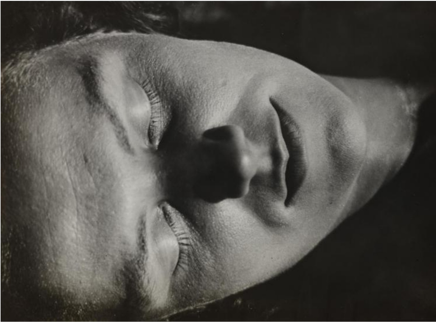
Raoul Hausmann, Senza titolo, 1931

Per tornare a Hausmann, non c'è anche nella sua posizione una critica implicita a una concezione della fotografia come strumento, diremmo oggi, della spettacolarizzazione del mondo?