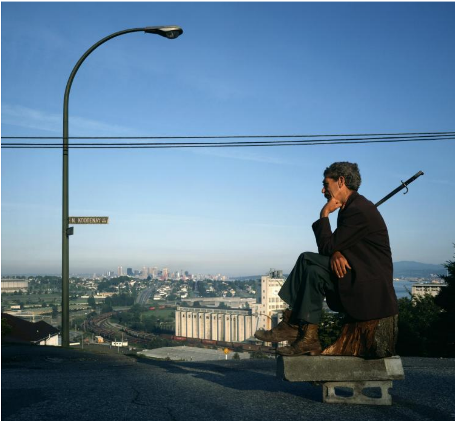
Jeff Wall, The Thinker , 1986

La cosa che mi colpisce di più in Wall è la tensione tra estetica dell'istantanea e ricreazione artificiale che esiste nei suoi lavori, in altre parole la tensione tra "effetto di realtà" e finzione nel medium fotografico. Qual è la tua idea in proposito?