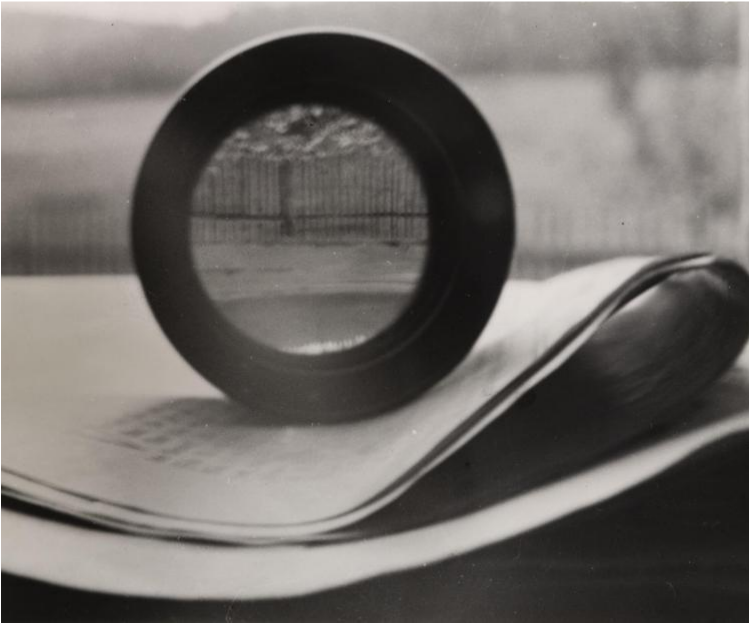
Raoul Hausmann, Senza titolo, 1930

Insieme a Hausmann, un altro grande artista-fotografo di cui ti sei occupato è Walker Evans. Cosa hanno in comune queste due figure?