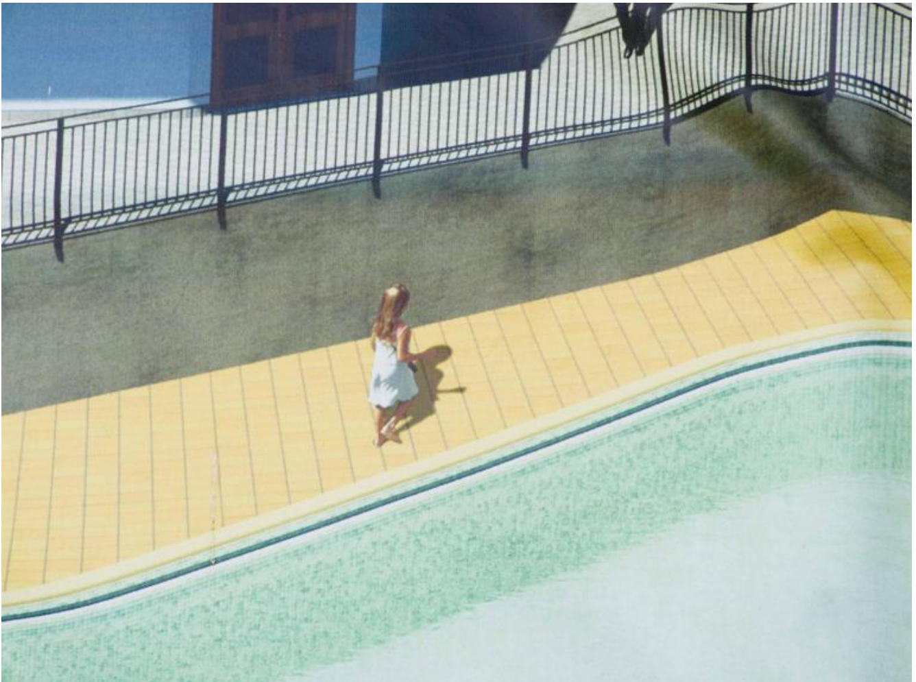
Enrico Bedolo, Life in File.

Nel rapporto inventario/invenzione si produce lo spazio di una nuova destabilizzazione topografica, da intendersi non soltanto come invenzione di mondi possibili, ma come interpretazione di possibilità. Le immagini "mostrano come verrà ciò che si sta costruendo all'interno, anticipano forse il futuro, ma la fotografia di quelle immagini le proietta nel passato dello scatto", racconta il fotografo. Lentamente lo spazio perde i suoi confini, diventa temporalità. Una linea che abbandona la propria direzione per arrendersi a uno spazio che riemerge dal passato e che a sua volta dilegua i confini del tempo. Un istante sognato, più vero di qualsiasi sensata realtà.