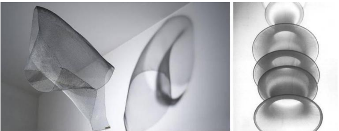
Bruno Munari, Concavo-Convesso; lampada Falkland.