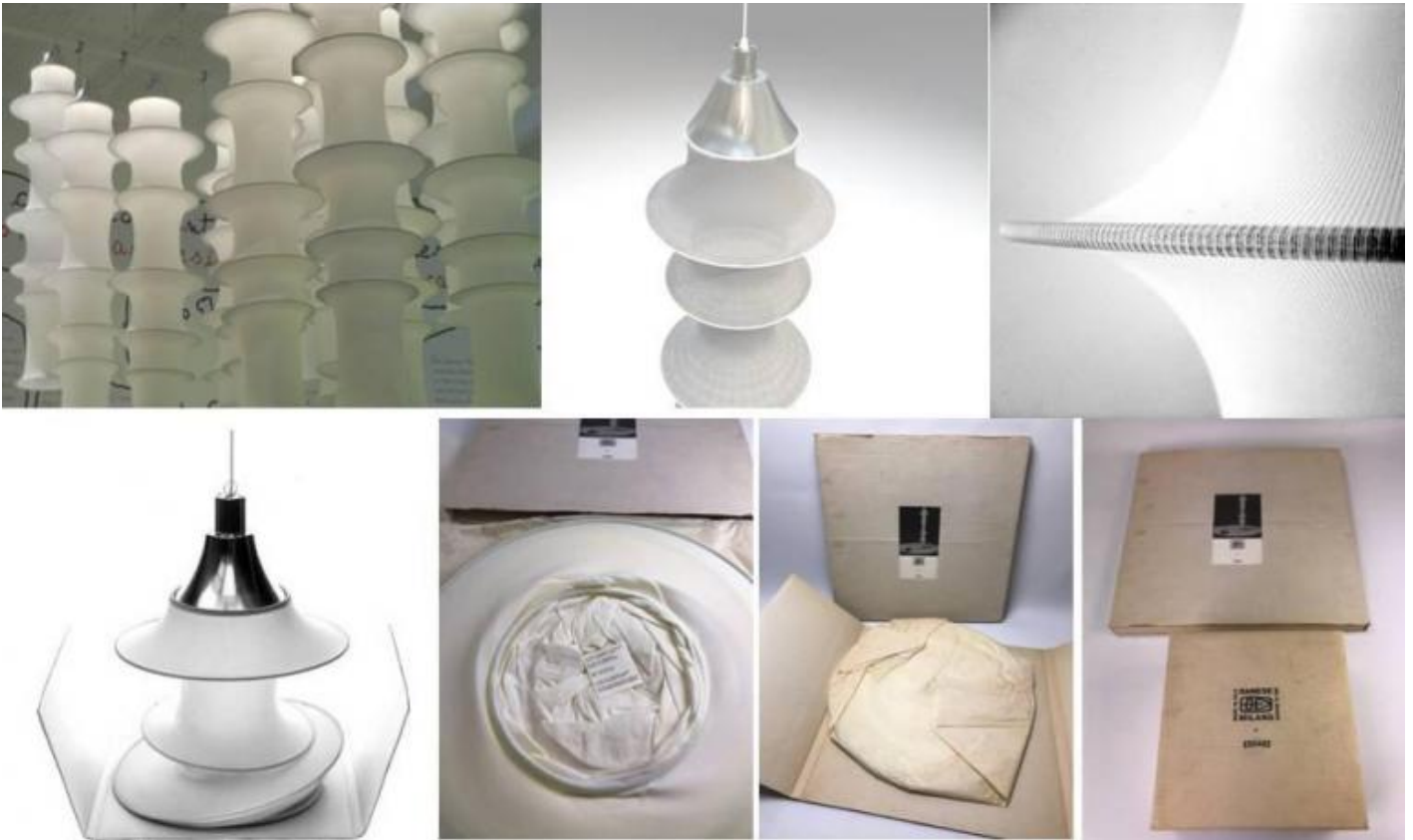
Bruno Munari, lampada Falkland. In alto: particolari costruttivi. In basso: varie fasi del ripiegamento e dell'imbballaggio, con fotografie originali del packaging.

Si tratta di una lampada a sospensione che, appesa, raggiunge un metro e sessanta centimetri di altezza, mentre richiusa ne occupa due o tre al massimo, così da poter essere riposta nella confezione (vedi foto), anch'essa un insuperato capolavoro di packaging. Il corpo della lampada è ottenuto da un tubolare di filanca per calze da donna di colore bianco, del diametro di tredici pollici (circa 33 cm.). A distanze prestabilite, il tubolare viene allargato tramite l'introduzione di cerchi in tondino di metallo (con una sezione di mm. 5) di diametri differenti. È grazie a questa operazione che trae origine, una volta che la lampada è appesa al soffitto, la sua tipica forma allungata analoga a quella delle canne di bambù. Nell'interspazio di tessuto teso tra un tondino e l'altro, infatti, si generano delle curve naturali che ricordano quelle presenti nei fusti di quella pianta esotica. Un'unica lampadina allocata in un riflettore di alluminio posto nella parte superiore della lampada emette una luce molto morbida e gradevole, perché diffusa dalla particolare texture del tessuto.