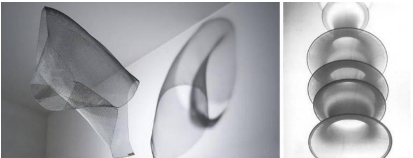
Bruno Munari, Concavo-Convesso; lampada Falkland.

Osservando la lampada Falkland poi, non si può fare a meno di notare come in essa le forme concave si alternino ad altre se pur brevemente convesse. Parrebbe che Munari abbia voluto riprendere in questo suo lavoro un tema su cui aveva lungamente meditato nella stagione del MAC (Movimento Arte Concreta), quando aveva dato vita ad un progetto intitolato proprio Concavo-Convesso . Vi attese dal 1937 fino al 1949, quando ne espose gli ultimi esiti a Milano, alla famosa Galleria Il Naviglio, dove, di lì a poco (1949/1951) sarebbe nato lo Spazialismo di Lucio Fontana. Si trattava di oggetti scultorei sospesi che ricordavano una nuvola, ottenuti da una rete metallica dalla texture sottile, acquistabile in ferramenta, e quindi tagliata in forma quadrata che, flessa e torta alla maniera del nastro di Moebius, permetteva alla superficie che prima era esterna, trasformata in volume, di divenire interna. Sospesi al soffitto, come i Mobiles di Calder, e illuminati da luci puntiformi, questi oggetti proiettavano sulle pareti della stanza ombre generatrici di trame astratte, in continua mutazione.