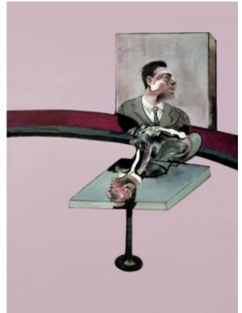
Francis Bacon, In Memory of George Dyer , 1971 Oil and dry transfer lettering on canvas je 198 x 147.5 cm Fondation Beyeler, Riehen/Basel, Sammlung Beyeler © The Estate of Francis Bacon. All rights reserved / 2018, ProLitteris, Zurich Photo: Robert Bayer.

Le vite degli artisti sono piene di contraddizioni e increspature, e le vite di Alberto Giacometti e Francis Bacon sono state colme di conflitti e dissipazione, tanto che le difficoltà delle loro reciproche esistenze interiori sono equiparabili solo all'importanza che la loro ricerca riveste nell'ambito dell'arte del '900. Questa smisurata grandezza non ha avuto luogo in virtù di una difficoltà che li accompagnati per tutto il loro cammino: l'idea dell'artista romantico, strapazzato dalla propria musa e la cui ispirazione è alimentata dal dolore è un cliché tanto pervicace quanto dannoso. Quello che invece possiamo rilevare è una comune, dolorosa attitudine alla vita, una tragicità che in modi differenti ma contigui, ha accompagnato passo dopo passo i due autori, accrescendone il mito e contribuendo ad alimentare quell'ossessione che li ha condotti, attraverso uno scavo implacabile, a toccare le più recondite profondità dell'essere umano.