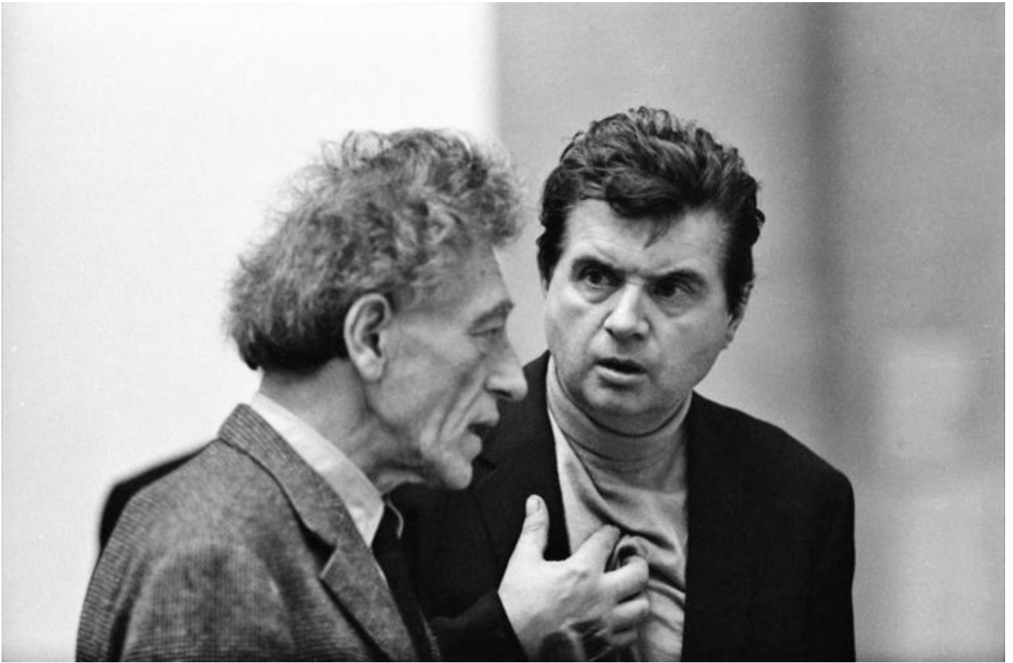
Alberto Giacometti e Francis Bacon, 1965 Gelatin silver print © Graham Keen.

Di fronte alle opere che costellano il percorso espositivo, difficilmente si coglierà quell'elemento comune che avvicinò i due artisti nella pratica quotidiana dell'arte e che fu il dubbio. Nella potenza espressiva delle tele di Bacon e nei corpi combusti di Giacometti non è immediato rinvenire il tratto che possiamo definire come il loro "minimo comun denominatore"; eppure, fu proprio una costante, ineffabile insoddisfazione ad alimentare la ricerca dei due, rinchiusi nei rispettivi studi, più simili a tane che a luoghi di sapere, sepolti da giornali e materiali di lavoro, disordine, fumo e alcool, l'uno immerso nelle fotografie che utilizzava come fonte d'ispirazione per le sue tele, l'altro in lotta con i modelli che obbligava a estenuanti sedute di posa, quasi costretti a non respirare per non "perdere la faccia", una condizione transitoria che cercava di fermare nella terra, incidendola nella materia attraverso le dita e le unghie.