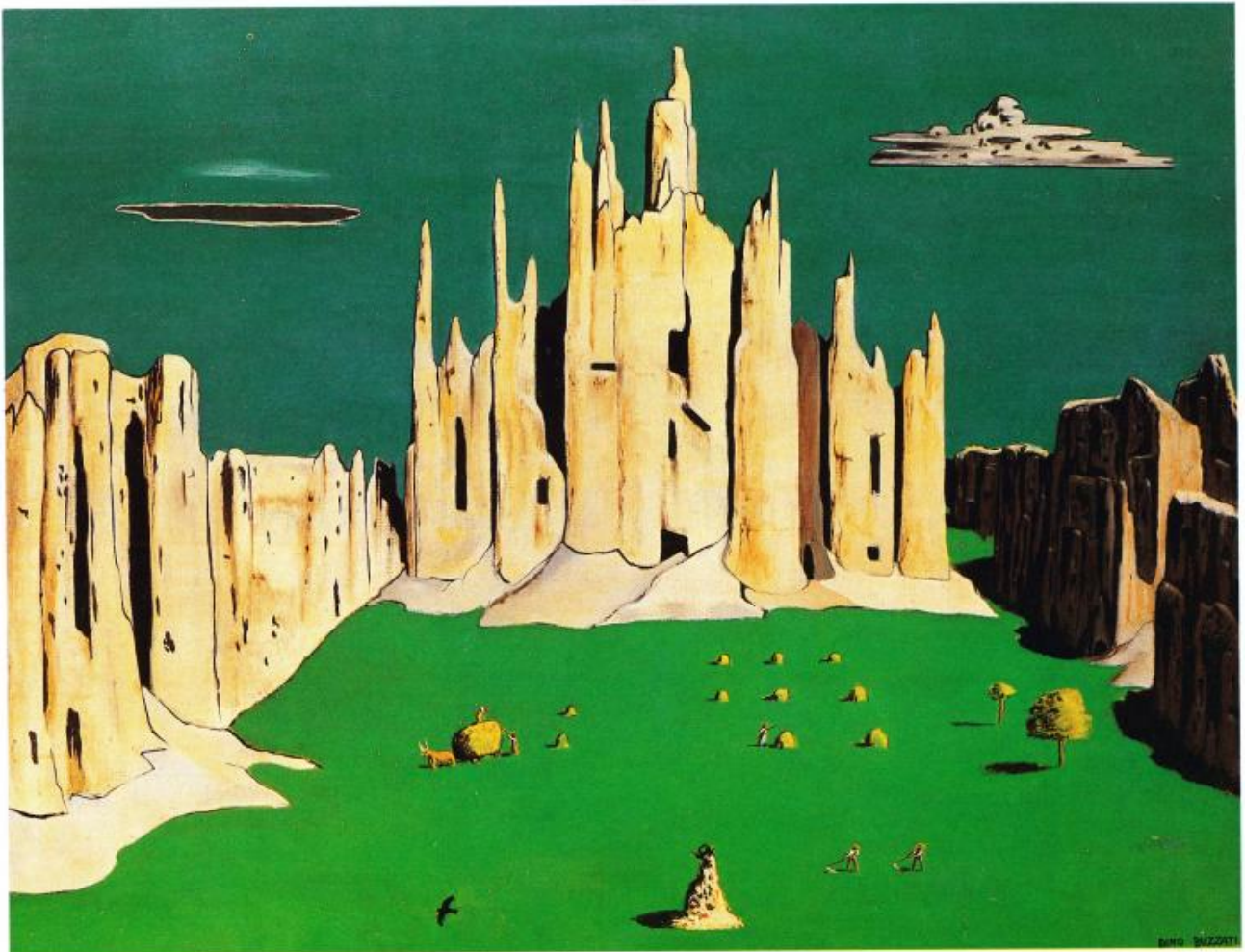
Il Duomo di Milano, 1958 tempera su tela, cm. 87x70