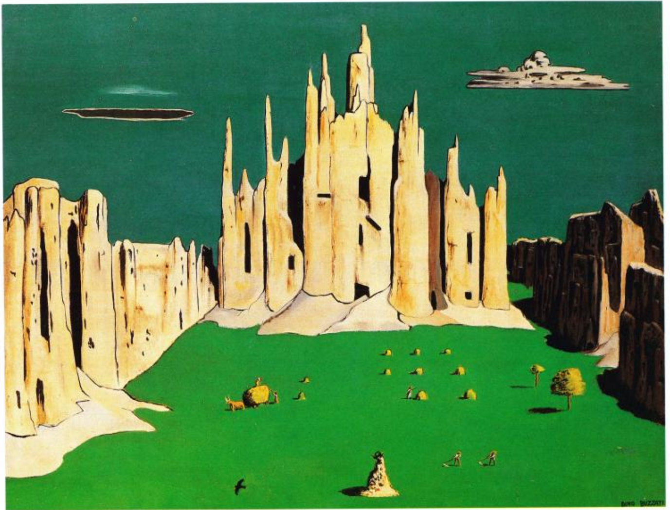
Il Duomo di Milano, 1958 tempera su tela, cm. 87×70