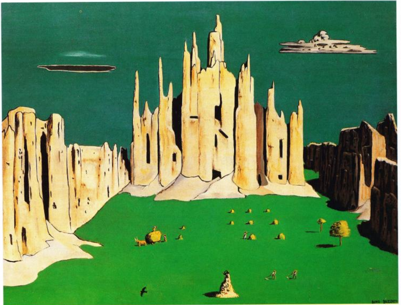
Il Duomo di Milano, 1958 tempera su tela, cm. 87×70