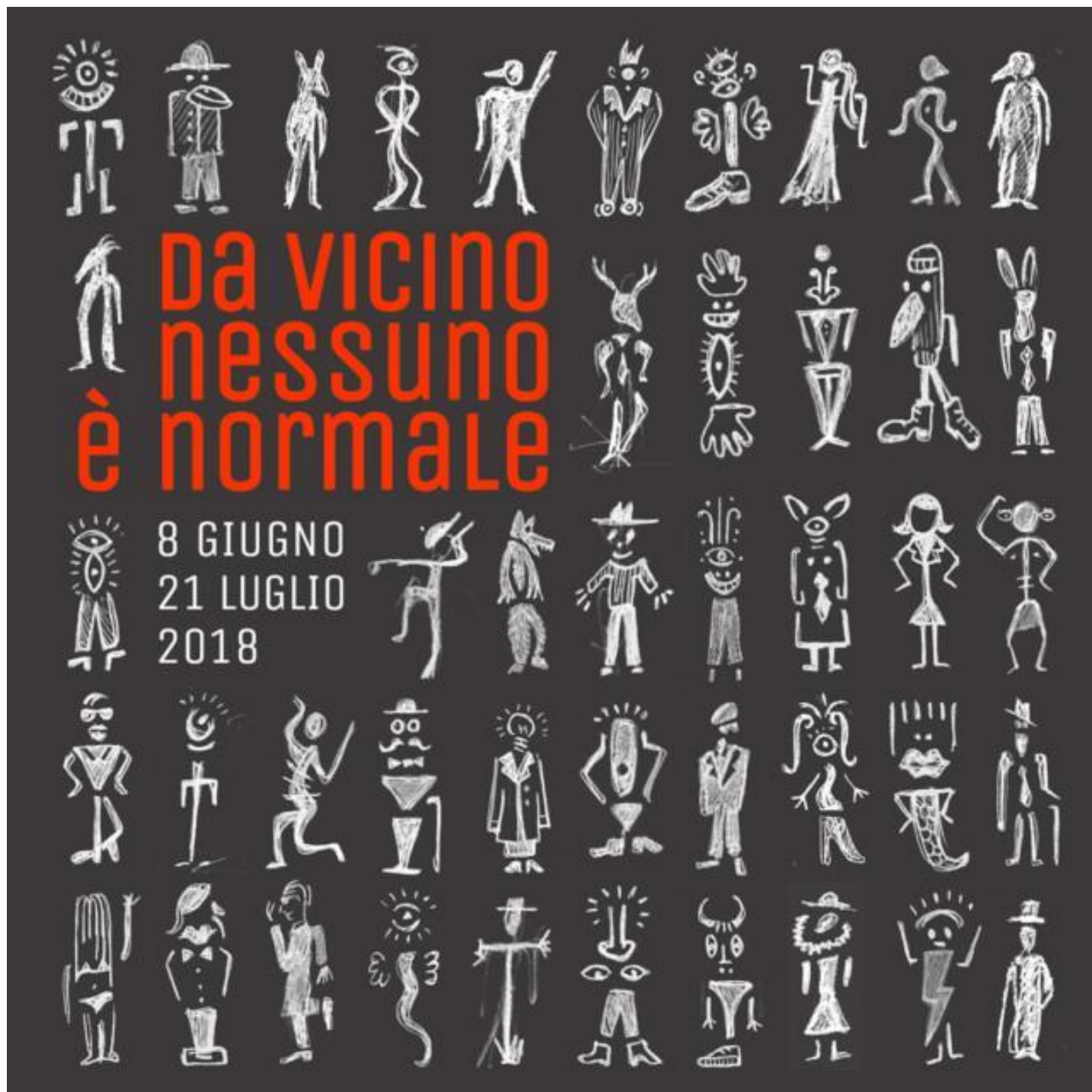
Da vicino nessuno è normale

Chiusi i manicomi, infatti, non sono crollati i muri e l'identità culturale continua a erigersi a difesa: bianco, normale, italiano, sano. Si tratta sempre di quel movimento che pretende di porre alla periferia della società – esattamente come l'individuo pone alla periferia di se stesso – quello che turba il regolare svolgersi del nostro esistere, quel germe di imprevisto e di inassimilabile.