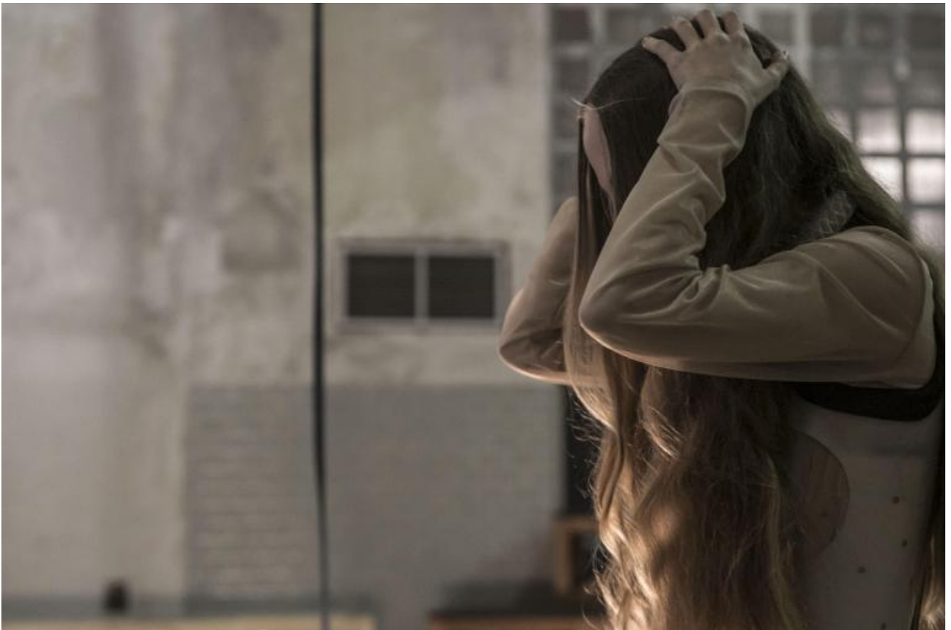
Prove Otello, maggio 2018, ph Vasco Dell'Oro.

Non si trattava, ci racconta Antonio a spettacolo finito, di restituire la trama e interpretare una sceneggiatura, ma di lasciar essere il modo in cui il corpo degli attori restituiva le passioni che dilanano i protagonisti.