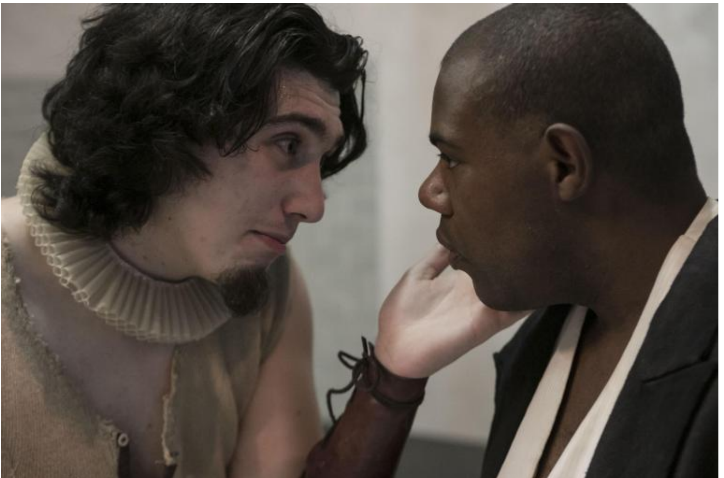
Prove Otello, maggio 2018.

Secondo movimento: portare la città in quei luoghi marginali, fare inclusione in periferia, connettere i luoghi dell'esclusione con i luoghi della vita, combinare luoghi e pratiche sanitarie e sociali con luoghi e pratiche culturali.