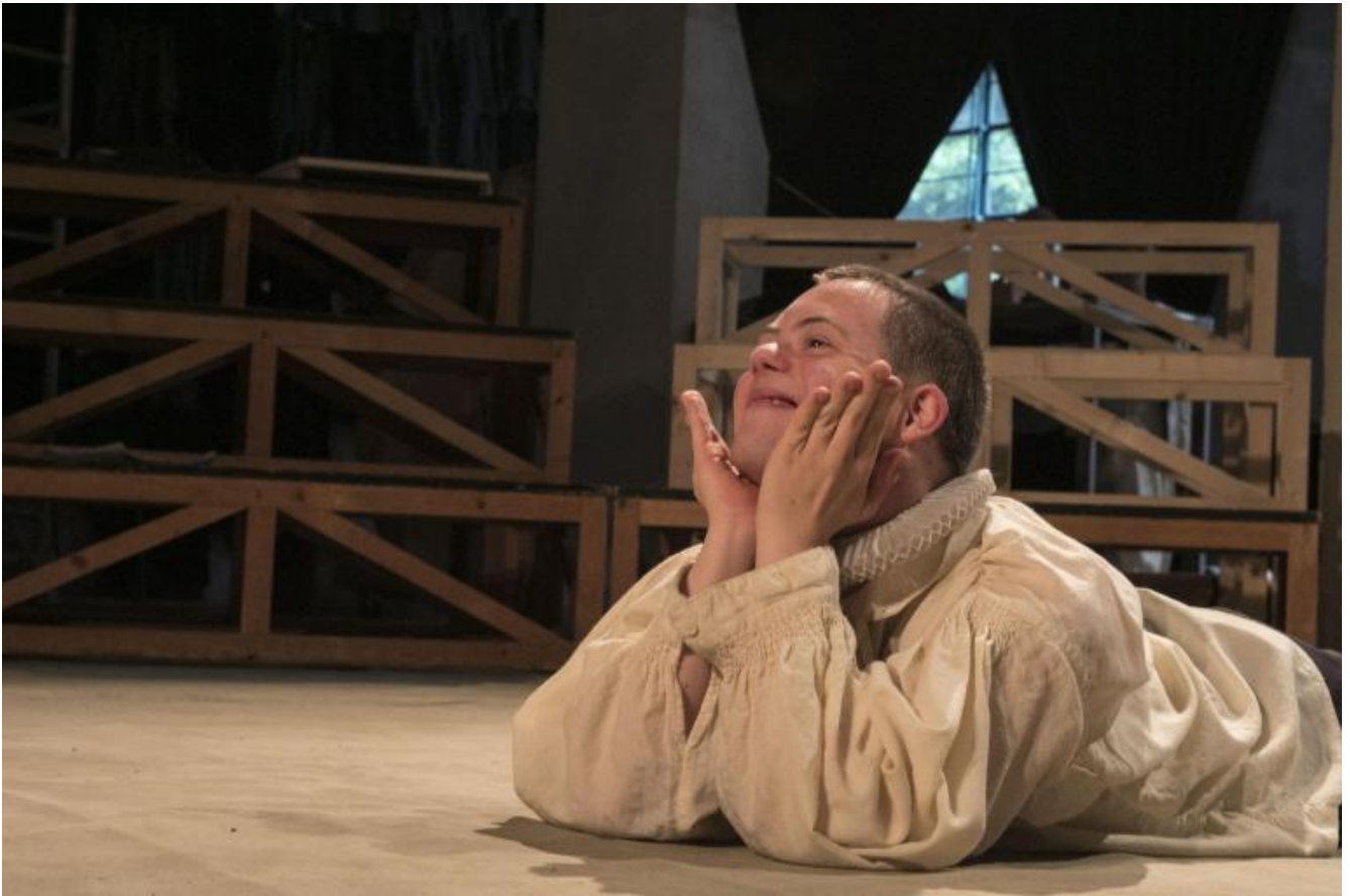
Prove Otello, maggio 2018, ph Vasco Dell'Oro.

Fare teatro, in questa prospettiva, significa non accettare di porsi sotto quel limite che configura spesso il teatro sociale come realtà ricreativa e terapeutica.