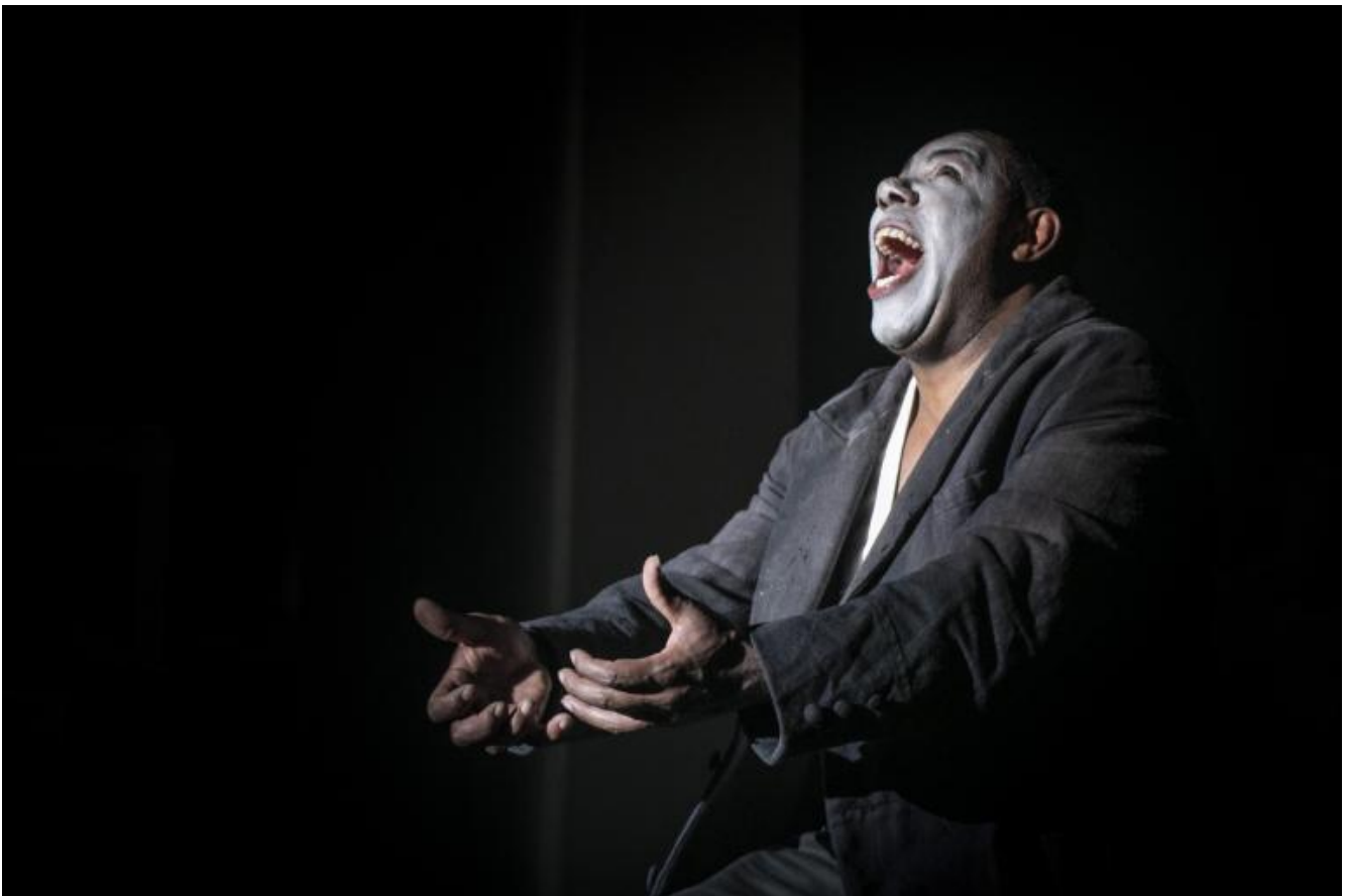
Teatro La Ribalta, Otello.

Desdemona percorre il filo tenendo le braccia aperte come ali, per non cadere, e con il viso del coraggio ingenuo di chi non si sente guardato: l'alterità può restituire, talvolta, una ingenuità dimenticata, una leggerezza che, per essere raggiunta da chi è imprigionato nell'"essere all'altezza" della normalità, costa troppo lavoro. La ricerca dell'innocenza e della verità può essere più faticosa in chi si è esercitato a presentarsi come tutto intero, in un tempo di rincorsa all'omologazione in nome di una presunta efficacia. Non è a caso che Celati diceva che per scrivere doveva prima camminare tantissimo, e stancarsi, stancarsi così tanto da poter riconquistare una libertà: quella del perdersi e del fuori controllo.