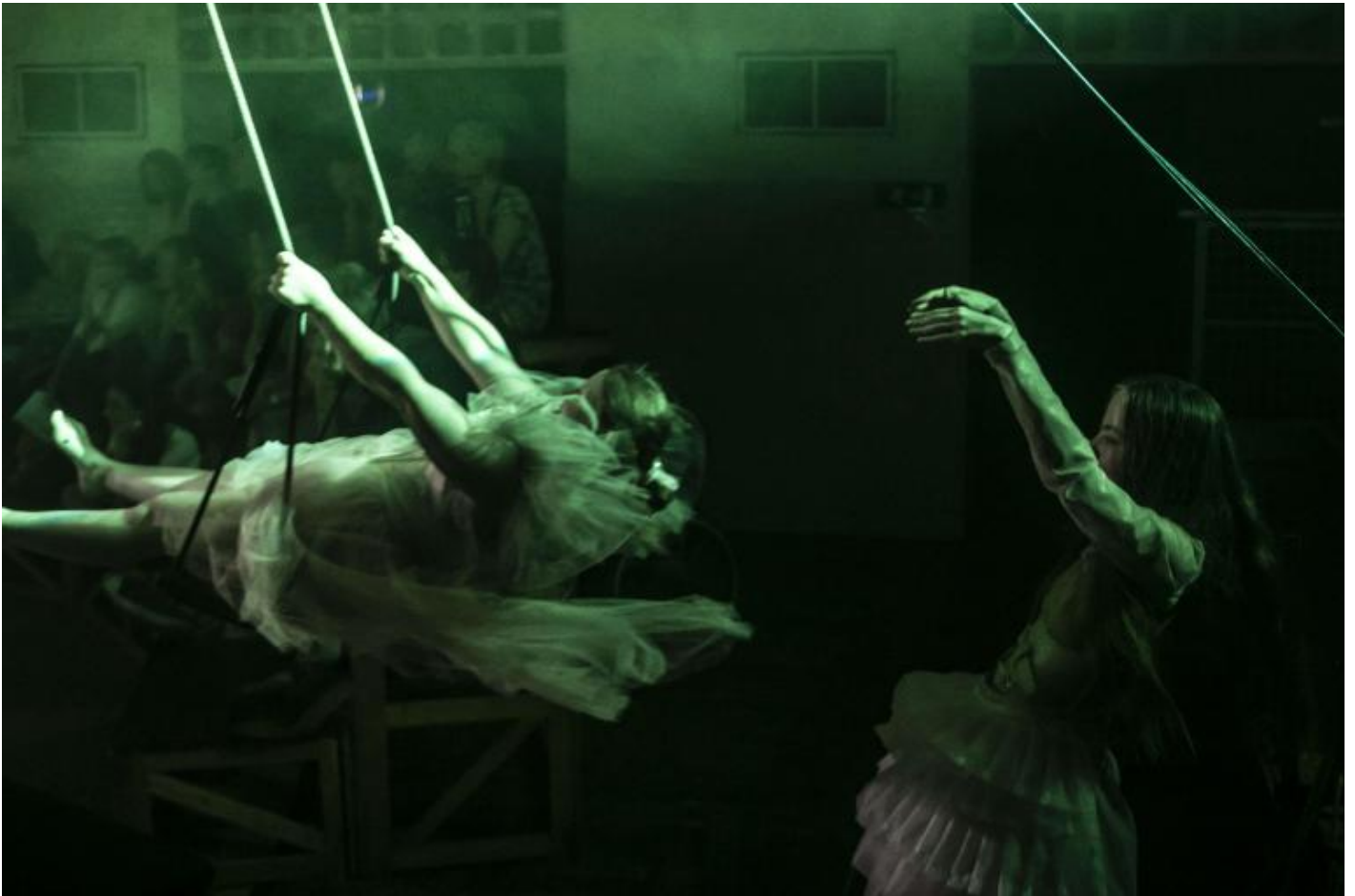
Otello, Allegro Moderato, ph Vasco Dell'Oro.

Antonio Viganò del Teatro alla Ribalta – prima Compagnia teatrale costituita da uomini e donne in situazione di “handicap” che, dopo dodici anni di attività di creazione e formazione, sono diventati attori e attrici professionisti – ha messo in scena un Otello rivisitato, in cui, come è lui stesso a dirci, non è Rodrigo, l'attore, che si è adattato a Otello, il personaggio, ma Otello che si è adattato a Rodrigo.