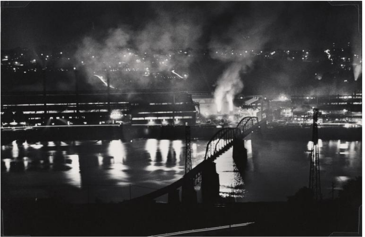
W. Eugene Smith, USA, 1918-1978 Stabilimento National Tube Company, U.S. Steel Corporation, McKeesport, e ponte ferroviario sul fiume Monongahela / National Tube Company works, U.S. Steel Corporation, McKeesport, and Union Railroad Bridge over the Monongahela River, 1955-1957 Stampa ai sali d'argento / gelatin silver print 22.86 x 34.29 cm Carnegie Museum of Art, Pittsburgh Gift of the Carnegie Library of Pittsburgh, Lorant Collection.