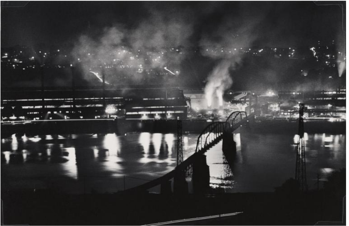
W. Eugene Smith, USA, 1918-1978 Stabilimento National Tube Company, U.S. Steel Corporation, McKeesport, e ponte ferroviario sul fiume Monongahela / National Tube Company works, U.S. Steel Corporation, McKeesport, and Union Railroad Bridge over the Monongahela River, 1955-1957 Stampa ai sali d'argento / gelatin silver print 22.86 x 34.29 cm Carnegie Museum of Art, Pittsburgh Gift of the Carnegie Library of Pittsburgh, Lorant Collection.