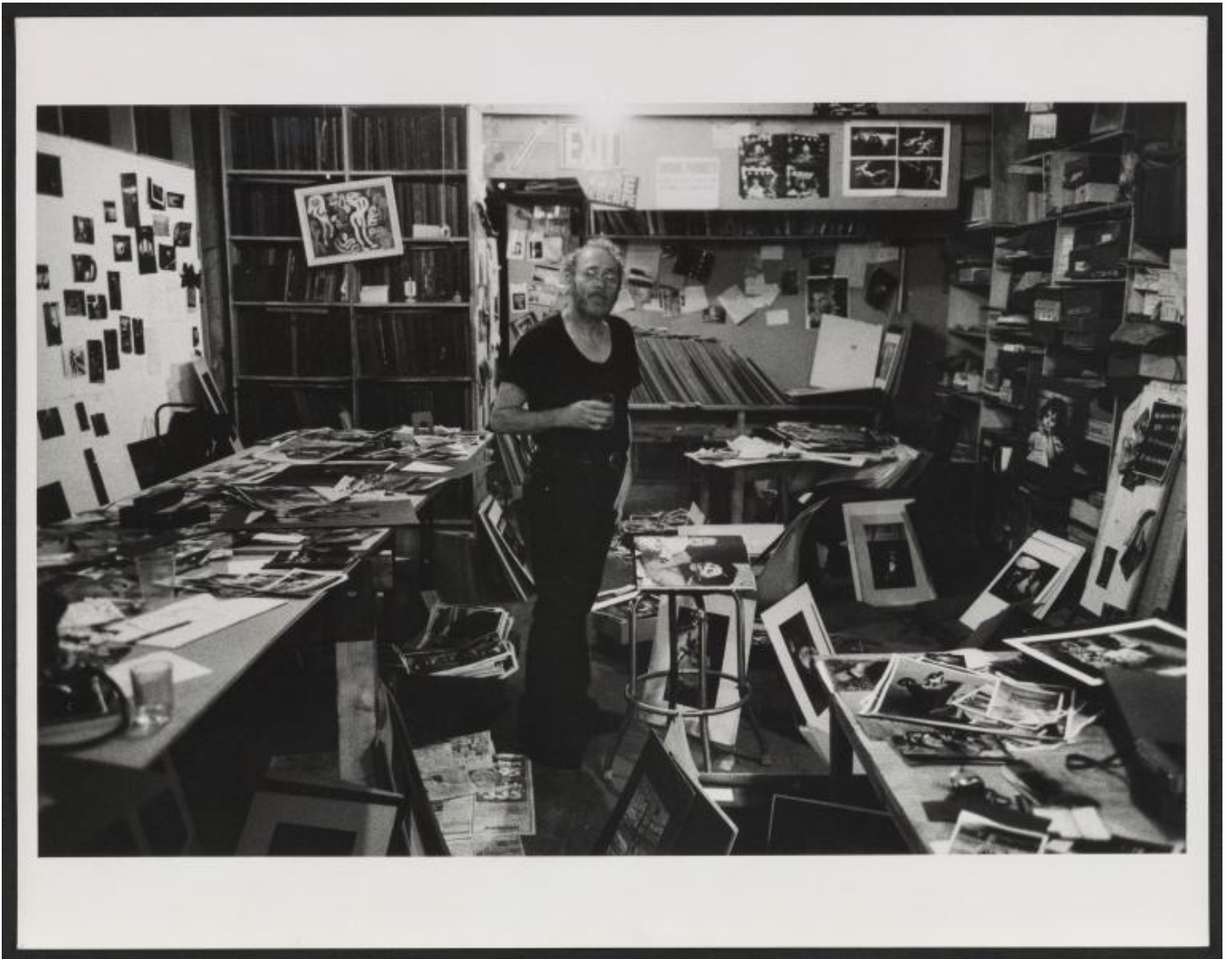
W. Eugene Smith in his workroom