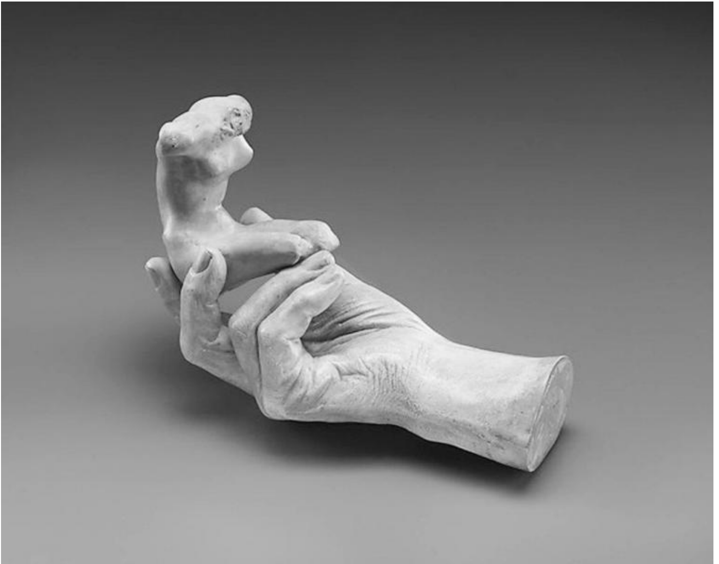
Auguste Rodin, Calco della mano di Auguste Rodin che tiene un torso , 1917. Gesso. Museo Rodin, Meudon.

Rodin non è il solo artista a concepire la scultura in rapporto alla manipolazione dell'immagine grafica e fotografica. Lo è stato anche Medardo Rosso che conosceva e frequentava Rodin. In tempi successivi anche Adolfo Wildt.