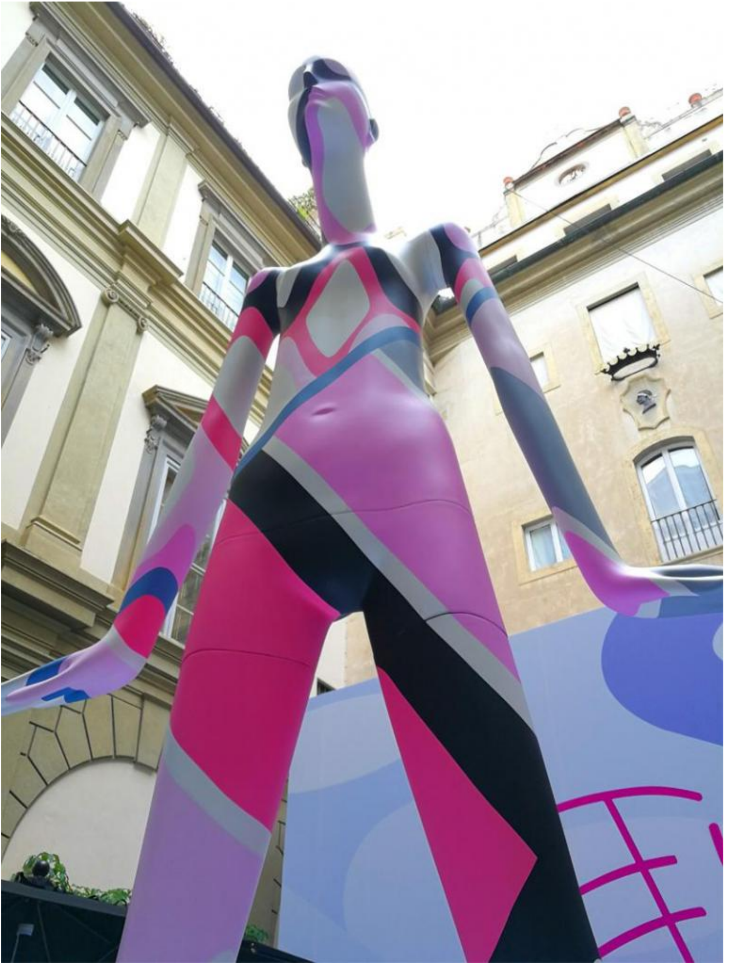
Bonaveri - A fan of Pucci, veduta dell'installazione nel cortile di Palazzo Pucci a Firenze.