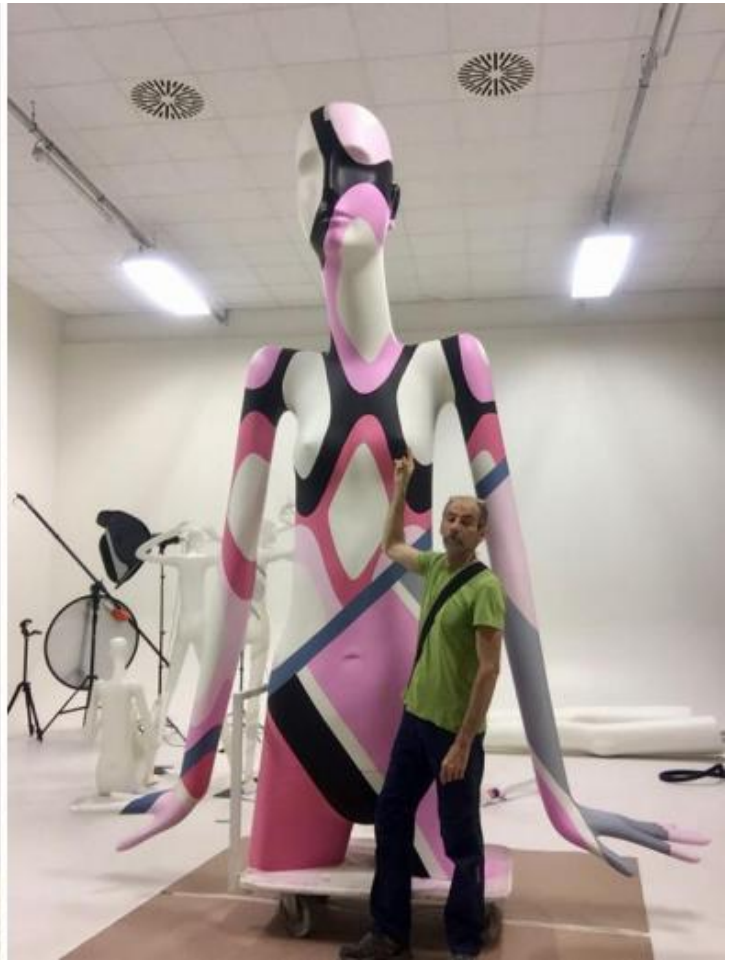
Fotografia ai Sali d'argento di Antonio Paoletti o di Giovanni Scheiwiller dell'opera Sant' Ambrogio di Adolfo Wildt in corso di lavorazione, 1925. Archivio privato - Fotografia del manichino Bonaveri in corso d'opera con l'artista che l'ha dipinto.

Alcune fotografie scattate da Antonio Paoletti o più probabilmente da Giovanni Scheiwiller nel 1925, mostrano il Sant' Ambrogio di Wildt in corso d'opera. Quando ho visto le fotografie del manichino Bonaveri in lavorazione, la mia mente non è andata direttamente ai salti di scala di Rodin ma alle fotografie di Paoletti/Scheiwiller. Da lì ai tagli e ai riposizionamenti di Wildt e poi, solo dopo, agli assemblaggi di Rodin. Il pensiero per immagini non è lineare, procede anch'esso per spostamenti e improvvisi salti di scala, che sono penetrati a fondo nella nostra cultura visiva e nell'arte contemporanea.