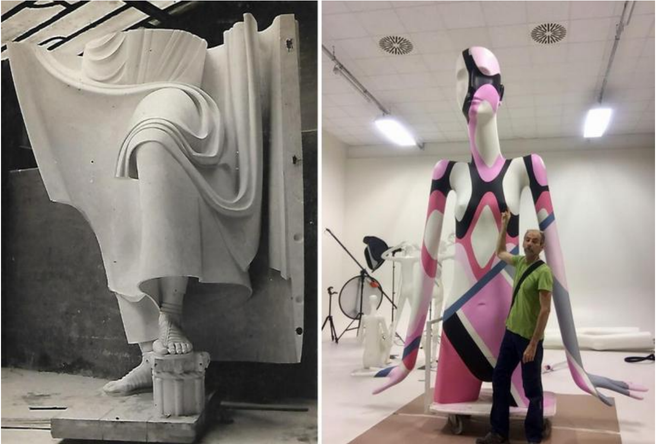
Fotografia ai Sali d'argento di Antonio Paoletti o di Giovanni Scheiwiller dell'opera Sant'Ambrogio di Adolfo Wildt in corso di lavorazione, 1925. Archivio privato - Fotografia del manichino Bonaveri in corso d'opera con l'artista che l'ha dipinto.

esaltava il frammento [...] nelle tavole sui libri, si trovavano giustapposti senza unità di proporzione, teste o mani isolate e figure intere, così che un senso di enorme e gigantesco usciva immaginoso nella pagina” (Wildt. L’anima e le forme , Silvana Editoriale, Cinisello Balsamo, Milano 2012, p. 22).