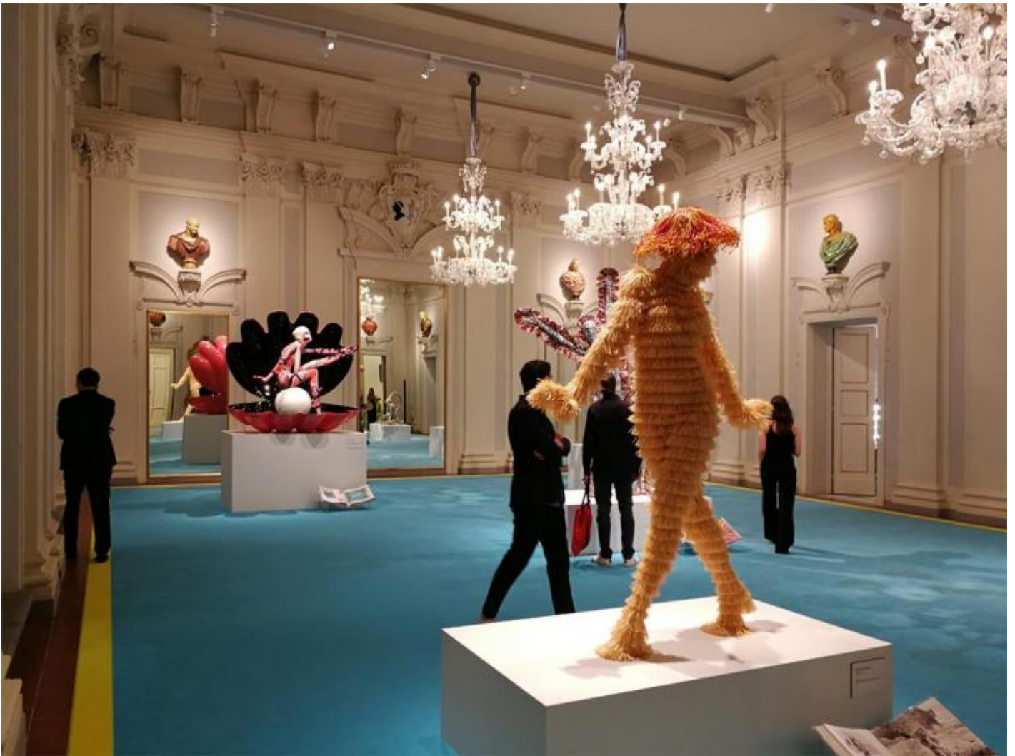
Bonaveri - A fan of Pucci, veduta dell'installazione nella sala grande al primo piano di Palazzo Pucci a Firenze.

Ho avuto modo di vedere le foto del manichino mentre l'artista Tiziano Colombo lo stava dipingendo aiutato da una proiezione dei motivi grafici sui volumi scomposti del colosso. Questi passaggi dal bidimensionale al tridimensionale e da un codice visivo all'altro, accompagnati da scomposizioni e ricomposizioni della forma, mi hanno ricordato la tecnica utilizzata da Auguste Rodin. Il celebre scultore trasferiva alle sue sculture le modifiche ottenute manipolando la loro riproduzione fotografica. I suoi assemblaggi in gesso realizzati attraverso sorprendenti salti di scala, sono un esempio del dialogo tra visione plastica e visione grafica, all'insegna delle tecniche di taglio, prelievo, riposizionamento e montaggio delle parti.