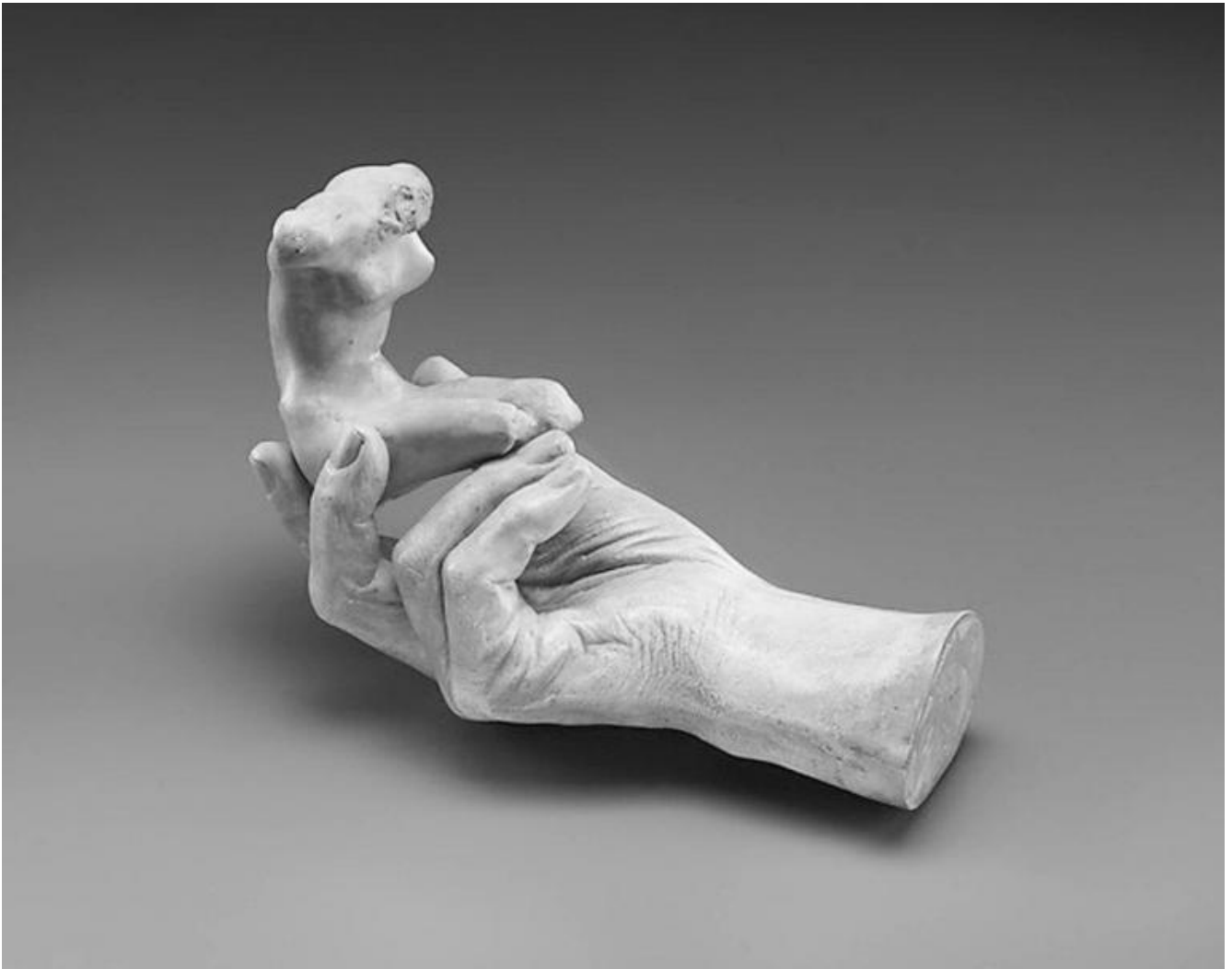
Auguste Rodin, Calco della mano di Auguste Rodin che tiene un torso, 1917. Gesso. Museo Rodin, Meudon.

Rodin non è il solo artista a concepire la scultura in rapporto alla manipolazione dell'immagine grafica e fotografica. Lo è stato anche Medardo Rosso che conosceva e frequentava Rodin. In tempi successivi anche Adolfo Wildt.