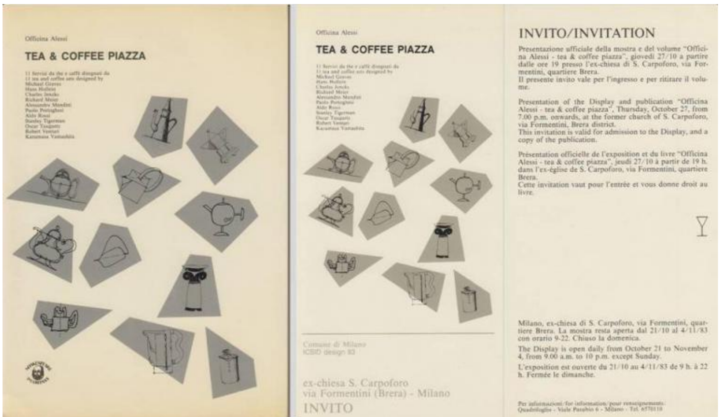
A sinistra: il catalogo della mostra Tea & Coffee Piazza , progettato da Bruno Munari con testi di Alessandro Mendini e foto di Aldo Ballo. La mostra si è tenuta a Milano presso la chiesa di San Carpoforo, nel 1983; a destra: il biglietto d'invito.