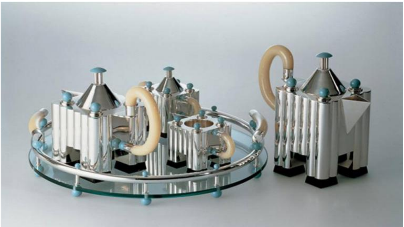
Michael Graves, Tea & Coffee Piazza per Alessi, 1979.

L'allestimento in Triennale venne di nuovo affidato ad Hans Hollein, che ripropose, ovviamente con le dovute modifiche per adattarlo alla sede diversa, quello storico del 1983: un lungo muro bianco con vetrine ad arco illuminate da neon azzurri. La curatela della mostra e il coordinamento del progetto furono ancora di Alessandro Mendini che ha dichiarato: "Il senso della costruzione e della composizione architettonica da un lato, e della simbologia e del rituale casalingo dall'altro, sono stati la base su cui sia gli 11 autori della prima edizione del Tea & Coffee Piazza , sia i 22 attuali hanno elaborato i loro progetti per Tea & Coffee Tower ".