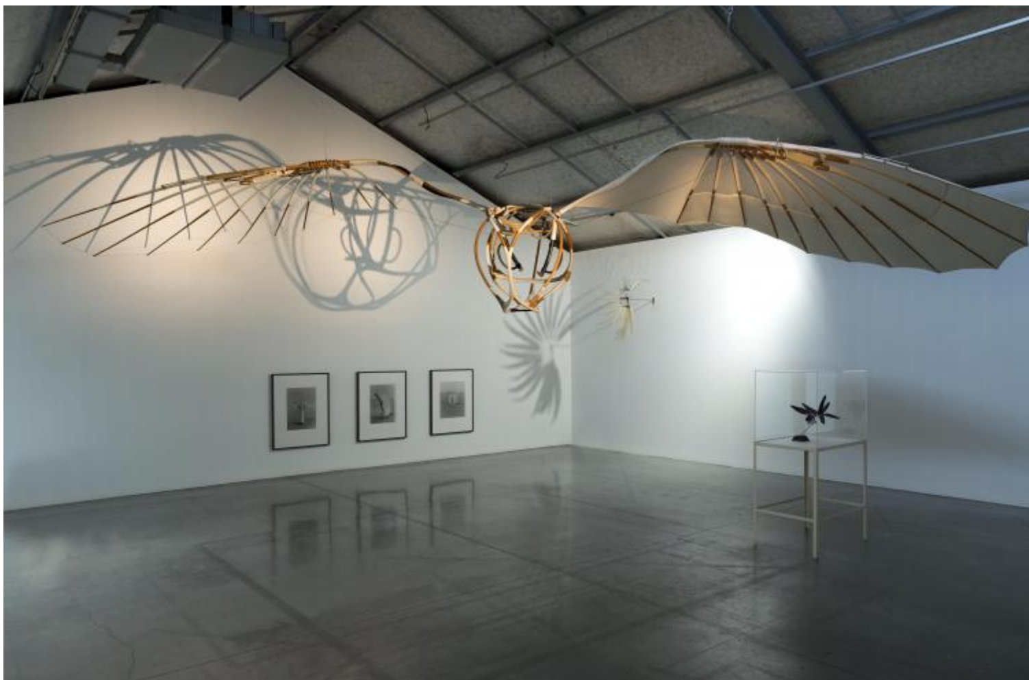
Vladimir Tatlin, Letatlin, 1929-32, ricostruito nel 1991

Quest'ultima opera, come le prime due, è visibile ora in L'Envol, ou le rêve de voler , l'esposizione in corso (fino al 28 settembre) alla Maison Rouge, che conclude, dopo quattordici anni, le attività dello spazio parigino. Compendio degli interessi e del gusto che hanno segnato tutto il programma precedente, la mostra si presenta come un assemblaggio tematico, una campionatura eclettica più che un percorso storico. Il volo , in questa prospettiva, è anzitutto una piega dell'immaginario, un atto metaforico, un "possibile" da esplorare col corpo, i sensi, la tecnica, l'utopia, il sogno. L'allestimento si sottrae dunque a qualsiasi linearità cronologica, preferendo accostamenti e contrapposizioni spesso studiate per generare il massimo effetto sorpresa. Luna (1968), un ambiente chiuso e in penombra, dal pavimento ricoperto con uno spesso strato di granuli bianchi di polistirolo, in cui Fabio Mauri prefigurava lo sbarco sul nostro satellite, corona così un percorso in cui si possono incontrare l'improbabile macchina per volare di Gustav Mesmer, inventore e paziente psichiatrico ossessionato dal sogno del volo, il prototipo Letatlin (1929-32, ricostruito nel 1991), a metà strada tra invenzione leonardesca ed exploit tecnologico, del costruttivista sovietico Vladimir Tatlin, le inquietanti appendici piumate di Rebecca Horn, o i modellini volanti di elicotteri che sciamano come insetti nel video di Roman Signer 56 kleine Helikopter (2008).