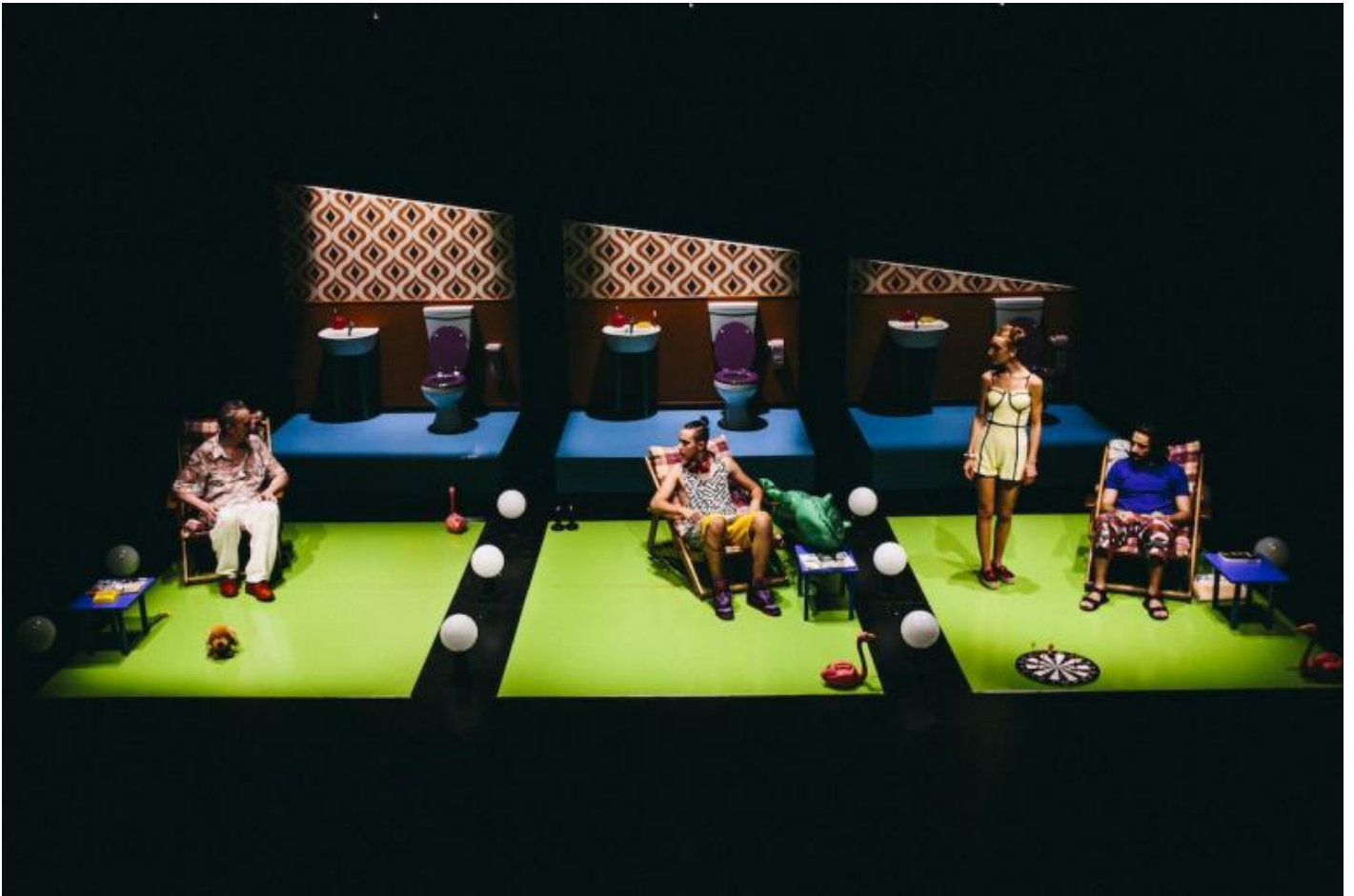
Kronoteatro, Educazione sentimentale, ph. Gabriele Lupo.

Nei giorni di fine luglio (non ho assistito al finale del festival) si è visto il franco-tedesco Clément Layes, impegnato in vari corpi a corpo con le cose, gli oggetti, o con le tracce di un passaggio umano. Il performer italiano Giuseppe Stellato ha interpretato l'ossessione delle cose e i deserti nascosti dietro una lavatrice o una macchinetta che distribuisce generi di conforto. L'olandese Davy Pieters ha dato corpo a iterative intrusioni dell'incubo nel reale quotidiano. Gisèle Vienne, il nome più conosciuto, ha portato le sue macchine della crudeltà con marionette o con figure umane trasformate in fantocci. È stata dedicata una piccola personale gli italiani Kronoteatro, con tre spettacoli, Cannibali , Educazione sentimentale , Cicatrici .