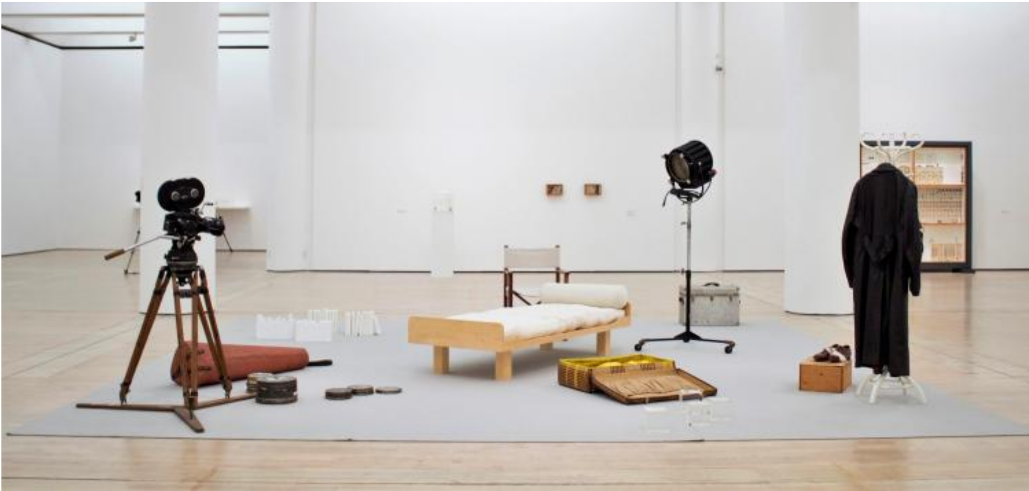
Gianfranco Baruchello, Le Moi fragile , 2018, vista dell'allestimento

Le Tre lettere a Raymond Roussel – con cui termina il percorso dell'esposizione e di cui ha parlato anche Tommaso Isabella qui su doppiozero – riassumono in forma sintetica ed eloquente i modi con cui il lavoro dell'artista, nato a Livorno nel 1924, si è misurato con queste domande, pretendendosi cioè verso le regioni dell'inconscio e simultaneamente verso il mondo degli oggetti quotidiani e verso la sfera mediale, ovvero quel tessuto connettivo di immagini, parole, comportamenti, che nella società contemporanea danno forma all'esperienza collettiva, ne sono per così dire insieme il basamento e il sintomo. Assemblage, ready-made e montaggio – metodologie moderniste, ormai ampiamente storicizzate, rivolte all'appropriazione diretta del "reale", o meglio alla creazione di un effetto di reale – definiscono così sin dagli inizi una vicenda creativa che dialoga con le correnti più innovative del proprio tempo, in primo luogo new dada e nouveau réalisme , e con personalità idiosincratiche e congeniali come Öyvind Fahlström (di cui Baruchello è per molti versi un corrispondente segreto), ma guarda simultaneamente all'indietro, con occhio prensile, alla cultura surrealista e alla fondamentale lezione di Marcel Duchamp, individuando una posizione molto personale in cui convivono, come ha scritto Carla Subrizi, movimento dinamico e azione sulle cose, coscienza e reazioni arcaiche, percezione e informazione.