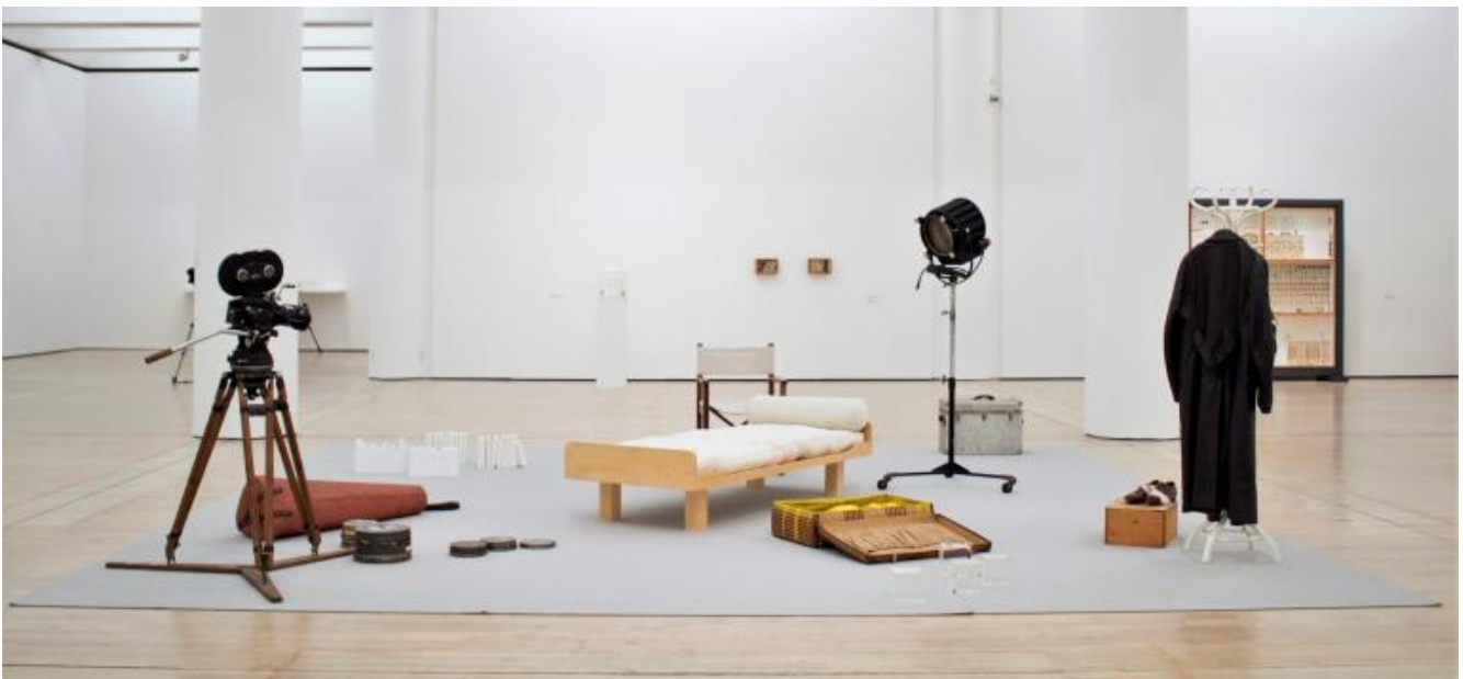
Gianfranco Baruchello, Le Moi fragile, 2018, vista dell'allestimento

Galleria Nazionale d'Arte Moderna di Roma. La mostra al Mart - non una tradizionale "retrospettiva" in senso stretto, piuttosto un'ipotesi di lettura e uno scavo stratigrafico all'interno di quell'immenso giacimento che è l'opera di Baruchello - sceglie, sotto l'attenta regia di Gianfranco Maraniello, di partire dal presente, in particolare da un gruppo di nuovi lavori, tra cui l'installazione Le moi fragile (2018), in cui si trovano imprevedibilmente fusi e ricombinati in forma suggestiva uno studio cinematografico e un setting psicoanalitico, per procedere all'indietro, ritrovando via via, sul filo di collegamenti e assonanze, alcuni degli interrogativi che Baruchello ha costantemente formulato nel suo lavoro: che ne è del soggetto, e del soggetto-artista in particolare, del suo spazio di immaginazione e autoinvenzione, nell'epoca della creatività generica, dell'arte di e per la massa? Che posto occupano, che rilevanza hanno, il desiderio, la memoria, l'esperienza individuale nell'eterno presente dei media e del consumo universale?