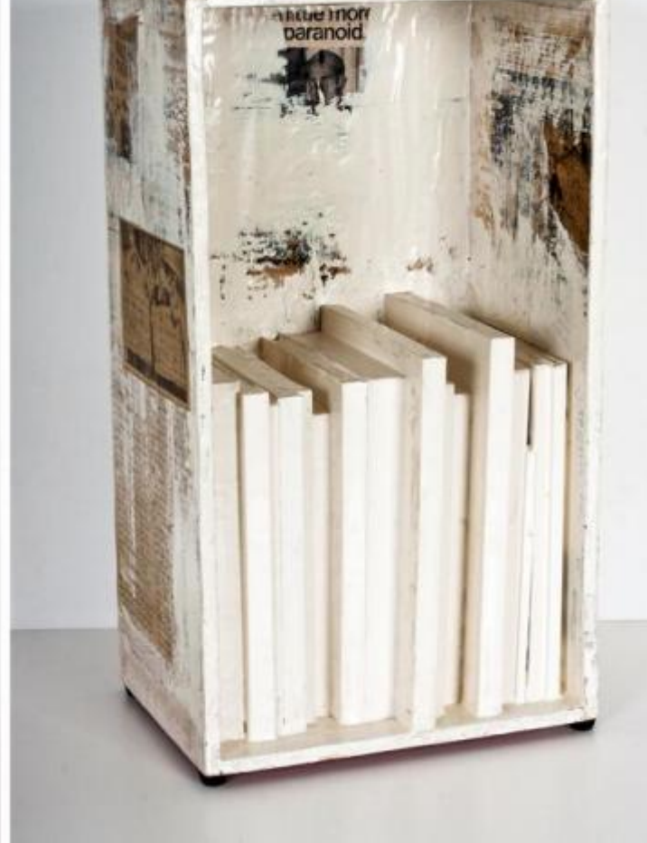
Gianfranco Baruchello, La prise de conscience II, 1962; a destra, A little more paranoid, 1962

Un assemblage del 1962, La prise de conscience II – presentato nello stesso anno alla storica mostra New Realists alla Sidney Janis Gallery di New York – condensa la visione dell’artista nel momento decisivo del suo ingresso sulla scena internazionale. La “presa di coscienza” del titolo allude alla possibilità di sottrarsi alla saturazione comunicativa – evocata dalla pila di quotidiani irrigiditi dal vinavil posta al centro del lavoro – e di stabilire una diversa relazione, critica, non scettica, col presente, di evadere dalla visione irrigidita, reificata, del tempo e della soggettività divenuta coesistente alla società di massa. La “coscienza” cui fa riferimento il titolo è dunque anche, in modo ancor più stringente, l’Io cosciente, lo “I” – nel senso del pronome inglese “io” – ridotto a una striscia rossa verticale, letteralmente occupata, riempita dalle copie dei quotidiani, un po’ come i corpi dei decrepiti archeologi di Giorgio de Chirico erano colmati, o invasi, dalle rovine classiche. L’“io”, sembra dire Baruchello, è non solo “un altro” nell’epoca dell’informazione, ma è parlato, agito in permanenza da forze che lo eclissano e lo dissolvono in forme potenti e nuove.