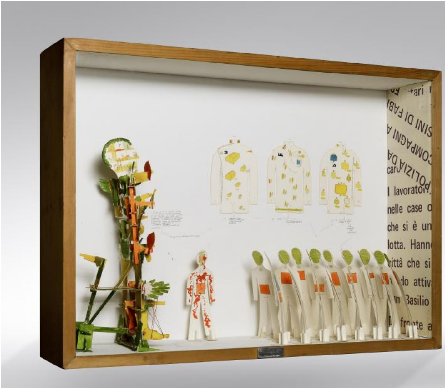
Gianfranco Baruchello, Autonomia della morte all'angolo di via Fiuminata il nove settembre 1974, 1974

assemblage , scrittura e bricolage (ancora qui da paragonare ai lavori tridimensionali di , compone brevi, ellittiche narrazioni sospese tra cronaca e immaginazione, in cui le allusioni al clima politico del tempo si trovano ancora una volta intrecciate a materiali onirici e libere associazioni.