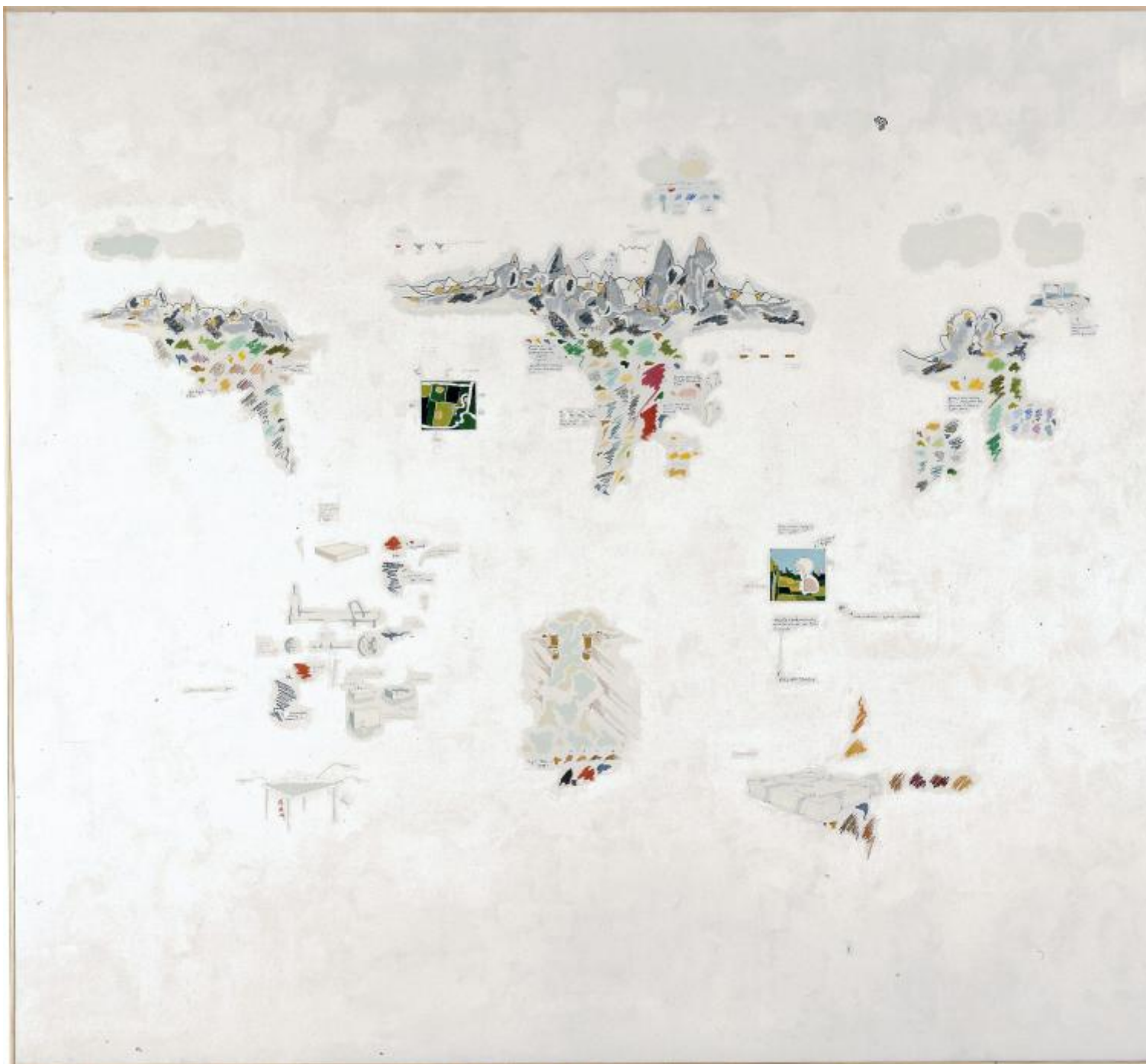
Gianfranco Baruchello, Nei giardini del dormiveglia, III , 1984

Le superfici bianche, mai uniformi, possono così accogliere umori, proiezioni, associazioni inconsce, schegge di quotidianità, dérives dell'immaginazione, fantasmi erotici, visioni grottesche o surreali, sino a comporre una sorta di cosmo senza centro: in un va-e-vieni obbligato, lo spettatore deve avvicinare l'occhio alla superficie per cogliere i dettagli e leggere i testi e allontanarsi per far emergere i percorsi labirintici che li connettono, come accade in mostra ad esempio nel ciclo Nei giardini del dormiveglia (1984). Ma la lettura non è mai conclusiva, ogni tentativo di decifrazione finisce per generare uno scacco e la necessità di reiniziare da capo. La narrazione, come nei più radicali romanzi sperimentali della neoavanguardia, resta, deve restare, indefinitamente aperta .