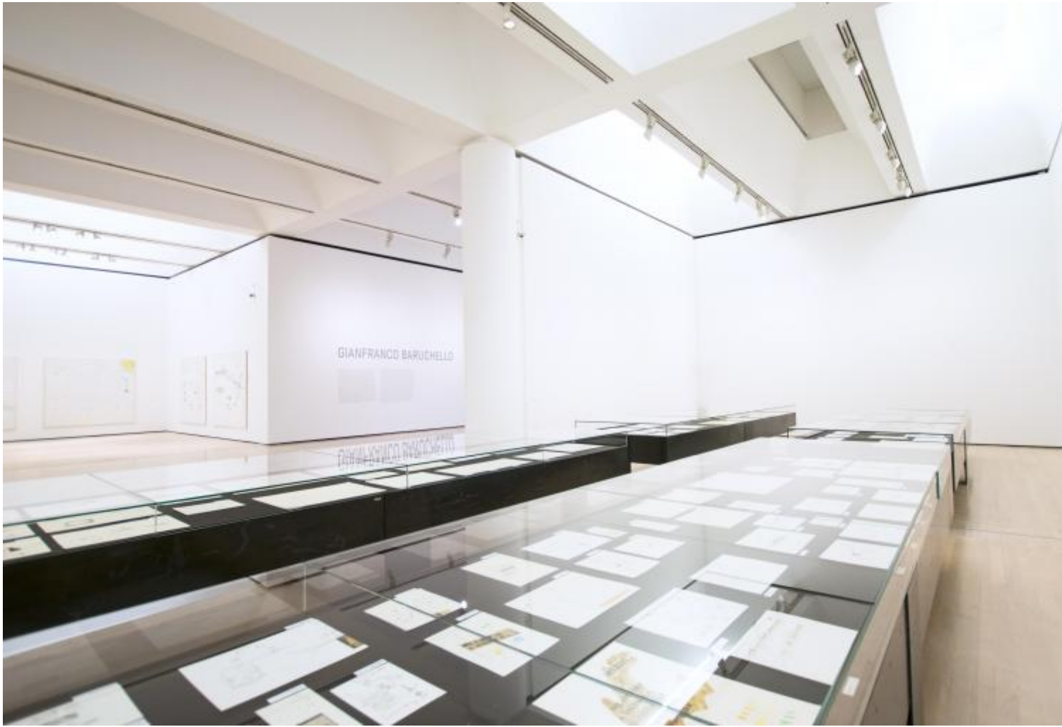
Gianfranco Baruchello, vista dell'allestimento, sala dei disegni

Un'attitudine testimoniata nella mostra a Rovereto anzitutto dalla serie di oltre duecento disegni datati dalla fine degli anni Cinquanta in avanti, in gran parte mai mostrati in precedenza, esposti in grandi teche orizzontali che permettono di coglierne a colpo d'occhio la qualità germinativa e sperimentale. In questo flusso di immagini intime e ininterrotte, un vero e proprio laboratorio in cui, foglio dopo foglio, è possibile scrutare sul nascere le invenzioni di Baruchello, l'affermarsi di una visione fuori dagli schemi, capace di combinare vena umoristica, intelligenza concettuale, con uno sguardo acuto e irriverente sulla realtà circostante, autobiografia poetica ed allusione erotica.