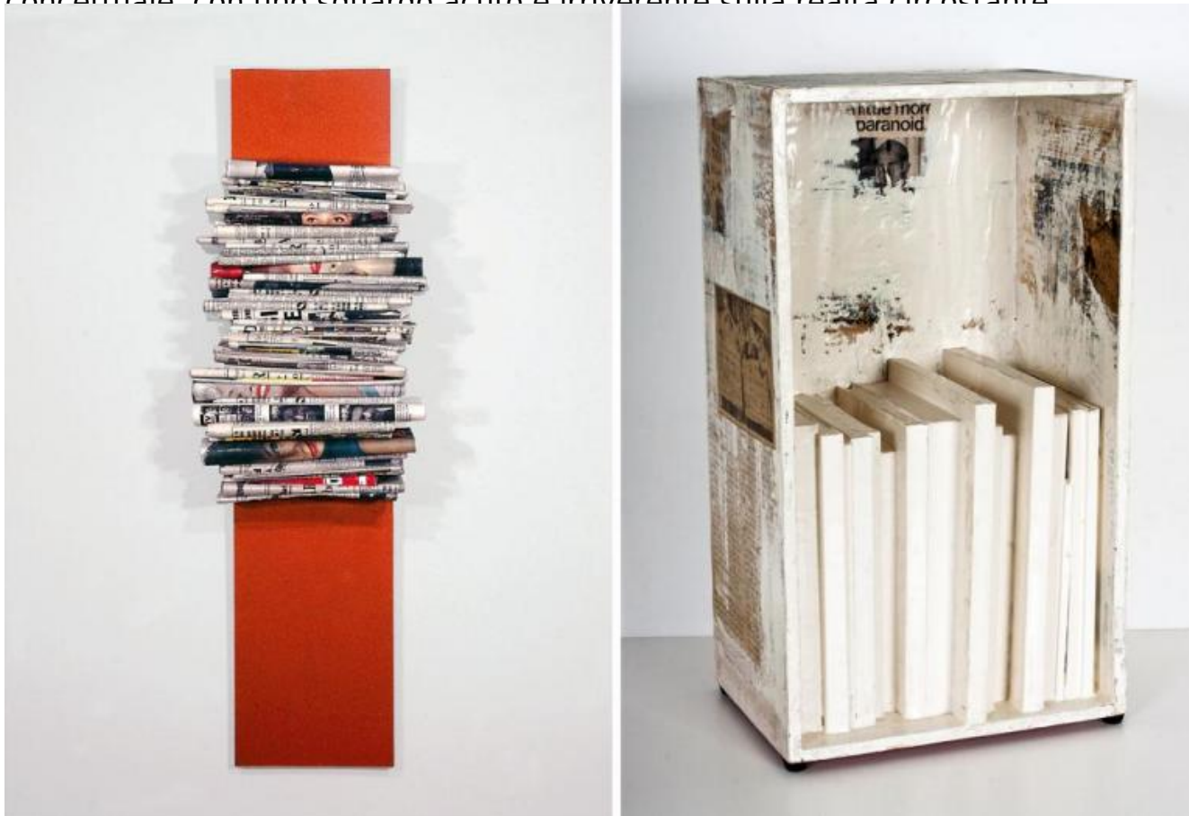
Gianfranco Baruchello, La prise de conscience II, 1962; a destra, A little more paranoid, 1962

foglio, è possibile scrutare sul nascere le invenzioni di Baruchello, l'affermarsi di una visione fuori dagli schemi, capace di combinare vena umoristica, intelligenza concettuale, con uno sguardo acuto e irriverente sulla realtà circostante