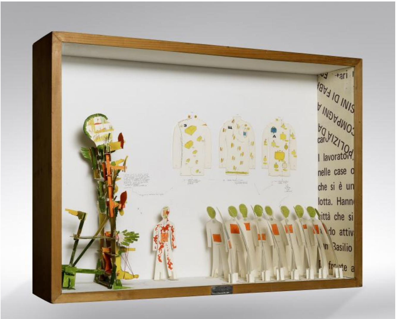
Gianfranco Baruchello, Autonomia della morte all'angolo di via Fiuminata il nove settembre 1974, 1974

Il bianco, come non-colore, come campo aperto di possibilità visivo-verbali è la base dell'ampia e più nota produzione di Baruchello, i quadri su cui si accumulano a partire dal 1962 disegni, parole, linee, diagrammi. La ridotta dimensione di segni e glifi - "microimmagini", le definì un critico al tempo - permette la loro dispersione anarchica, non predeterminata sulla superficie, un procedere secondo associazioni libere e impromptus iconici i cui riferimenti più immediati sono la pittura segnica di Cy Twombly e la multiforme produzione di Fahlström - in cui griffonages , cancellature, frammenti di scrittura, collage, compongono una sorta di magmatico e luminoso equivalente dell'ininterrotta, inestricabile pulsazione di processi mentali e moti corporei -, raffreddata e come oggettivata in una cifra nuova e personale, in cui si combinano scrittura, disegno tecnico, fumetto, grafica, linguaggi cioè non pittorici e anzi esplicitamente segnati da un'origine mediale, pop, tecnologica, di massa. In altre parole, risolutamente