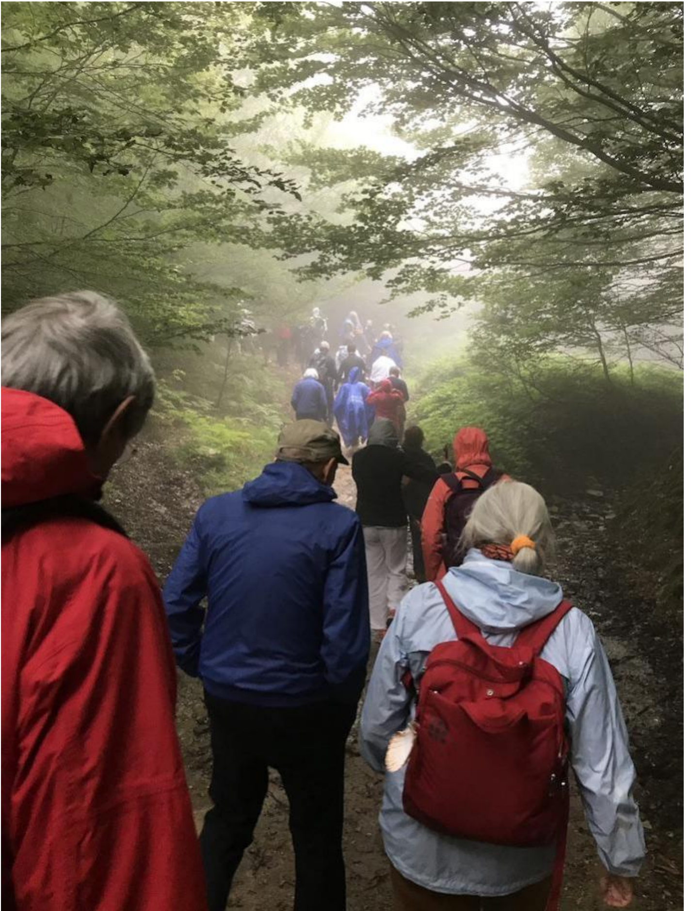
Sui sentieri di Roncisvalle.