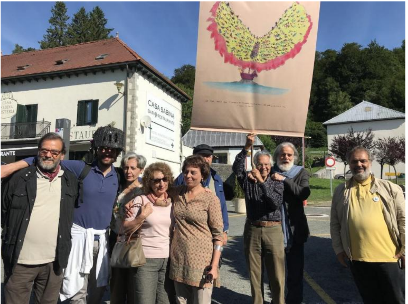
Il Teatro Vagante e la battaglia di Roncisvalle.

Passano le ore – viene pomeriggio – viene sera: ecco, stanno arrivando. Metto al vento il mio stendardo, la sorpresa (c'è il disegno del Teatro Vagante che sogna la battaglia di Roncisvalle), arrivano, eccoli: non se l'aspettavano, sento l'emozione, mia e di loro, gli occhi stupiti nel congiungimento. Di colpo capisco che il teatro è anche e forse soprattutto questo: un congiungimento di occhi e corpi in cammino sorpresi dall'apparizione.