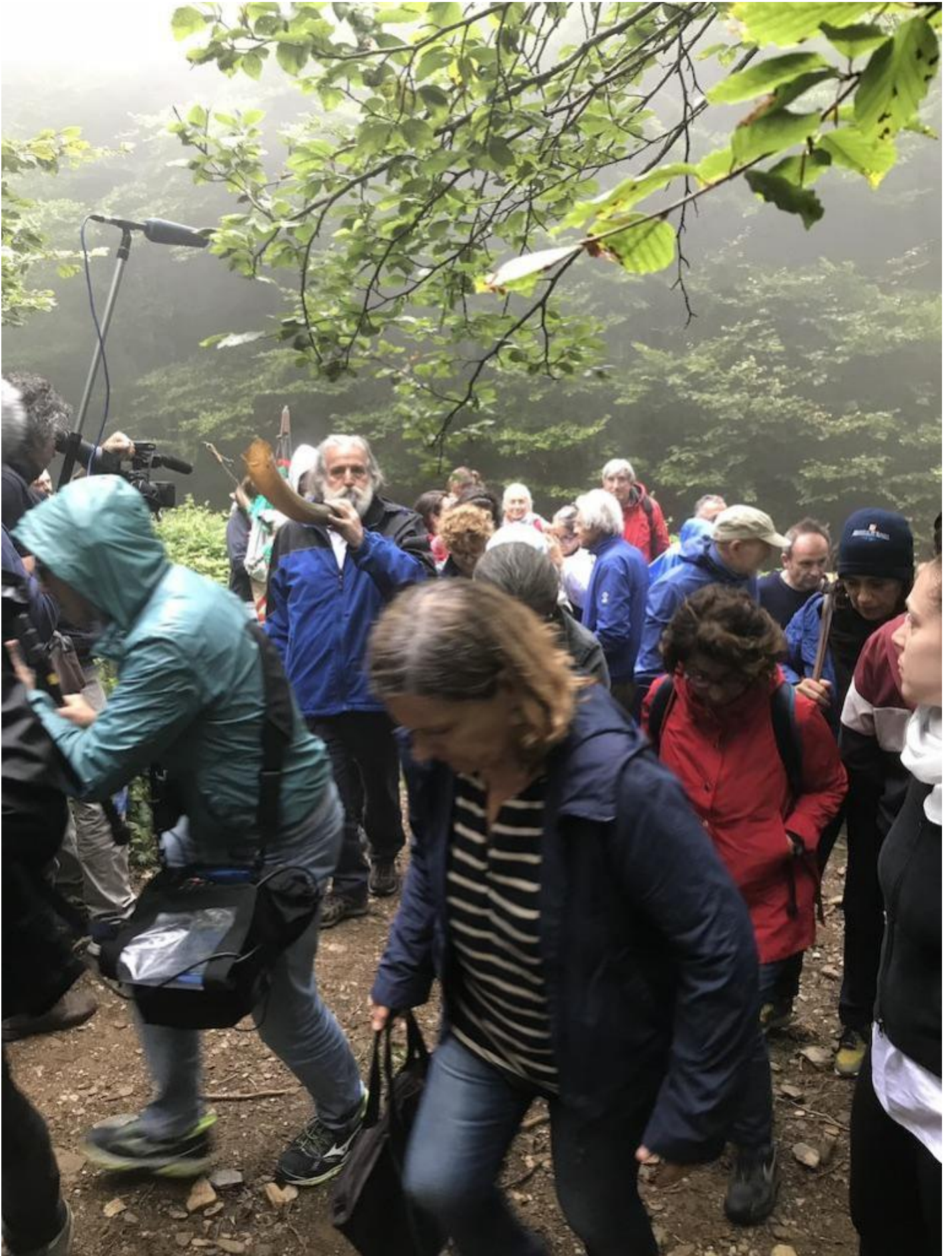
Il suono del corno.