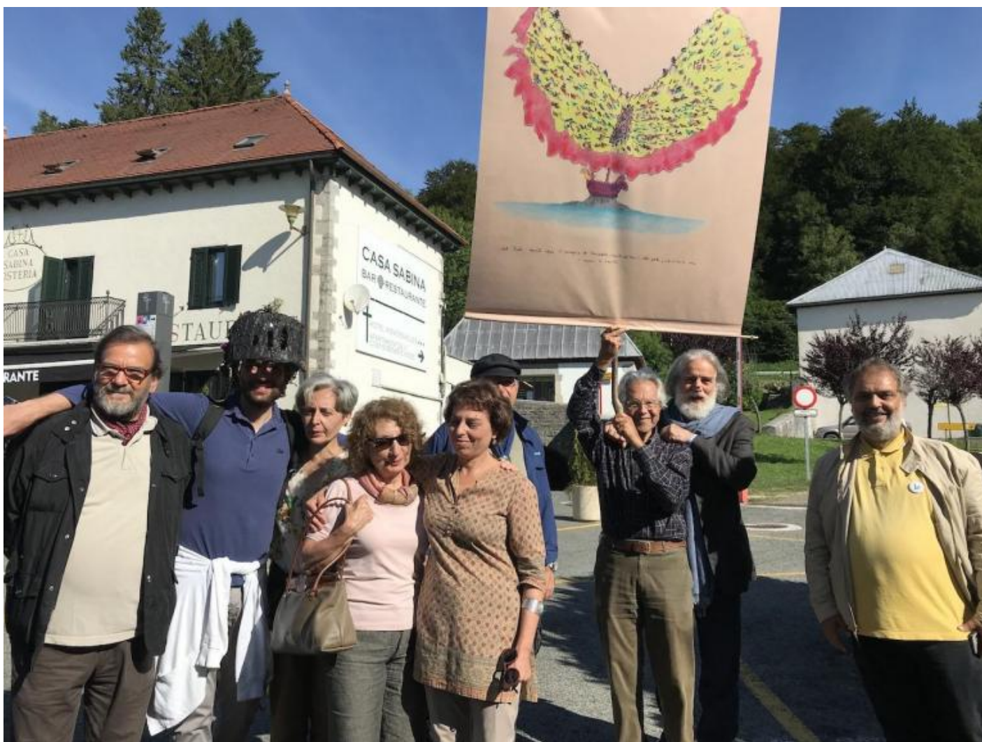
Il Teatro Vagante e la battaglia di Roncisvalle.

Passano le ore – viene pomeriggio – viene sera: ecco, stanno arrivando. Metto al vento il mio stendardo, la sorpresa (c'è il disegno del Teatro Vagante che sogna la battaglia di Roncisvalle), arrivano, eccoli: non se l'aspettavano, sento l'emozione, mia e di loro, gli occhi stupiti nel congiungimento. Di colpo capisco che il teatro è anche e forse soprattutto questo: un congiungimento di occhi e corpi in cammino sorpresi dall'apparizione.