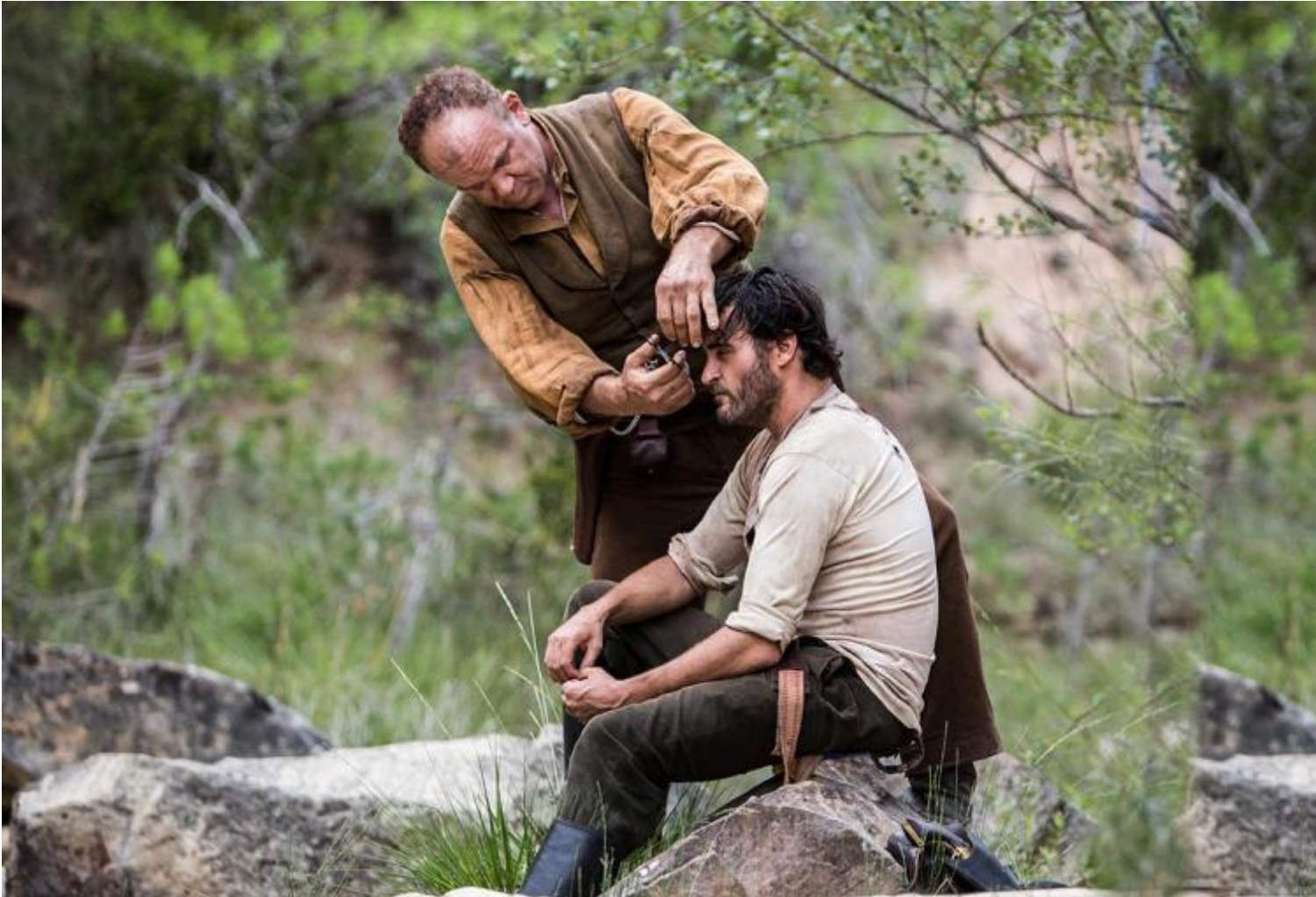
John C. Reilly e Joaquin Phoenix in The Sisters Brothers, di Jacques Audiard

Il film di Audiard, The Sisters Brothers , sfrutta proprio la libertà formale e narrativa che può sprigionarsi anche da uno sguardo mobile sulle identità di genere. E colpisce, anzi per certi aspetti può essere pure significativo, che quasi nessuno abbia notato finora che, come nel libro di Patrick deWitt (2011) da cui è tratto, i due fratelli protagonisti si chiamino “Sisters”, incarnando, anche nel nome, e in maniera umoristica, un destino narrativo di compresenza degli opposti: