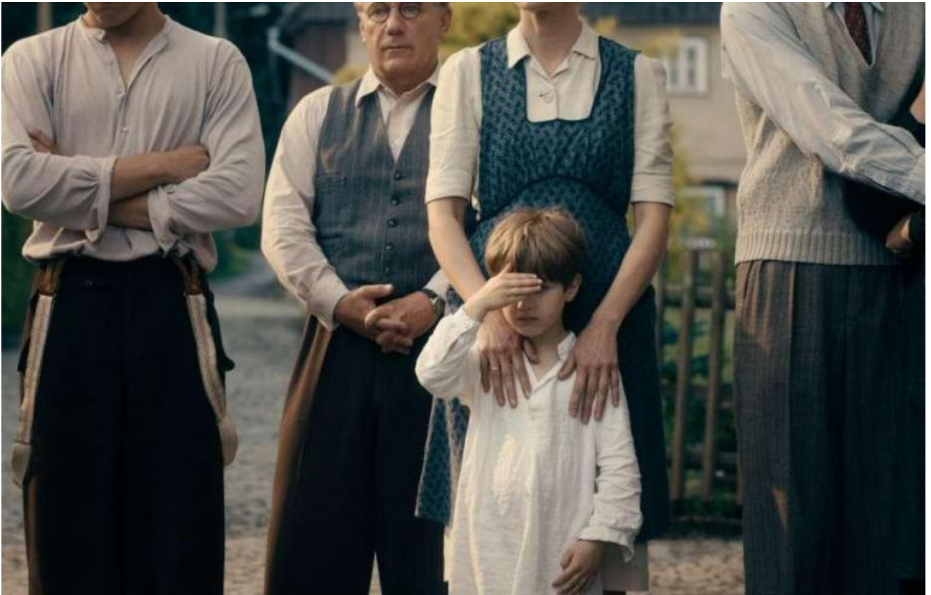
Opera senza autore (Werk ohne Autor), di Florian Henckel von Donnersmarck.

Il film di Audiard, The Sisters Brothers , sfrutta proprio la libertà formale e narrativa che può sprigionarsi anche da uno sguardo mobile sulle identità di genere. E colpisce, anzi per certi aspetti può essere pure significativo, che quasi nessuno abbia notato finora che, come nel libro di Patrick deWitt (2011) da cui è tratto, i due fratelli protagonisti si chiamino “Sisters”, incarnando, anche nel nome, e in maniera umoristica, un destino narrativo di compresenza degli opposti: