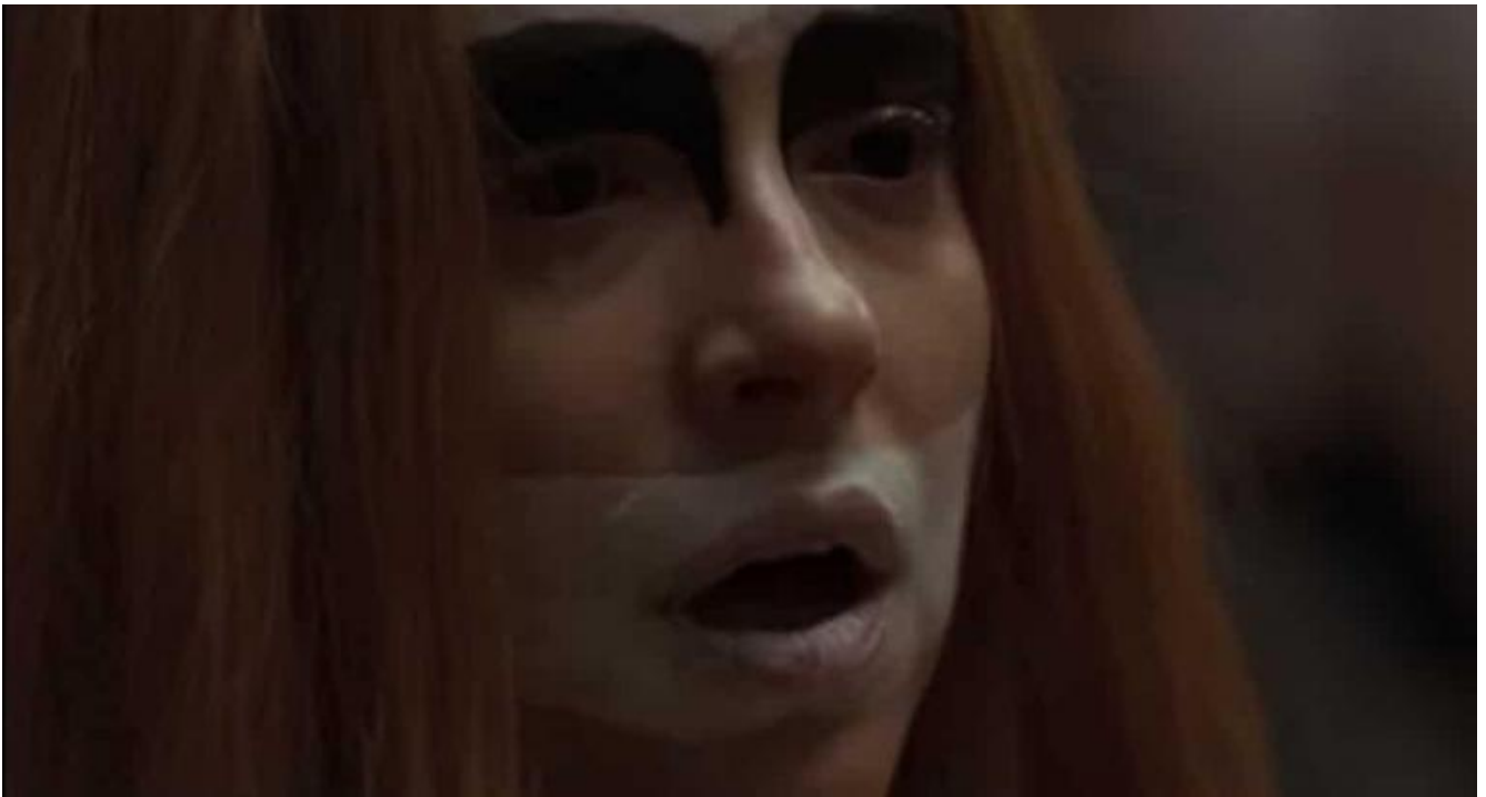
Dakota Johnson in Suspiria, di Luca Guadagnino

Melling), senza braccia e senza gambe, che un po' pare uscito da Freaks (1932), un po' sembra una surreale reinterpretazione della Venere di Milo, e con il volto coperto di biacca attacca a raccontare storie, sotto il cielo stellato. Quella è la culla del cinema: uno spazio da baraccone, dove un artista da strapazzo cerca di strabiliare un pubblico da fiera, stanco e bisognoso di sognare, di spaventarsi. Desiderio e paura sono la stoffa segreta del cinema: sono le emozioni più rudimentali, eppure quelle forse più indispensabili. Non possono essere completamente sostituite da sguardi di maniera sofisticati, eleganti, visivamente raffinati, ma incapaci di comunicare emozioni. Suspiria , di Guadagnino, procura un po' questo effetto di ipersaturazione formale spinta oltre sé stessa, fino alla combustione. Chiede ammirazione, non emozione; è un cinema intransitivo, e per un film horror questo è un limite di codice.