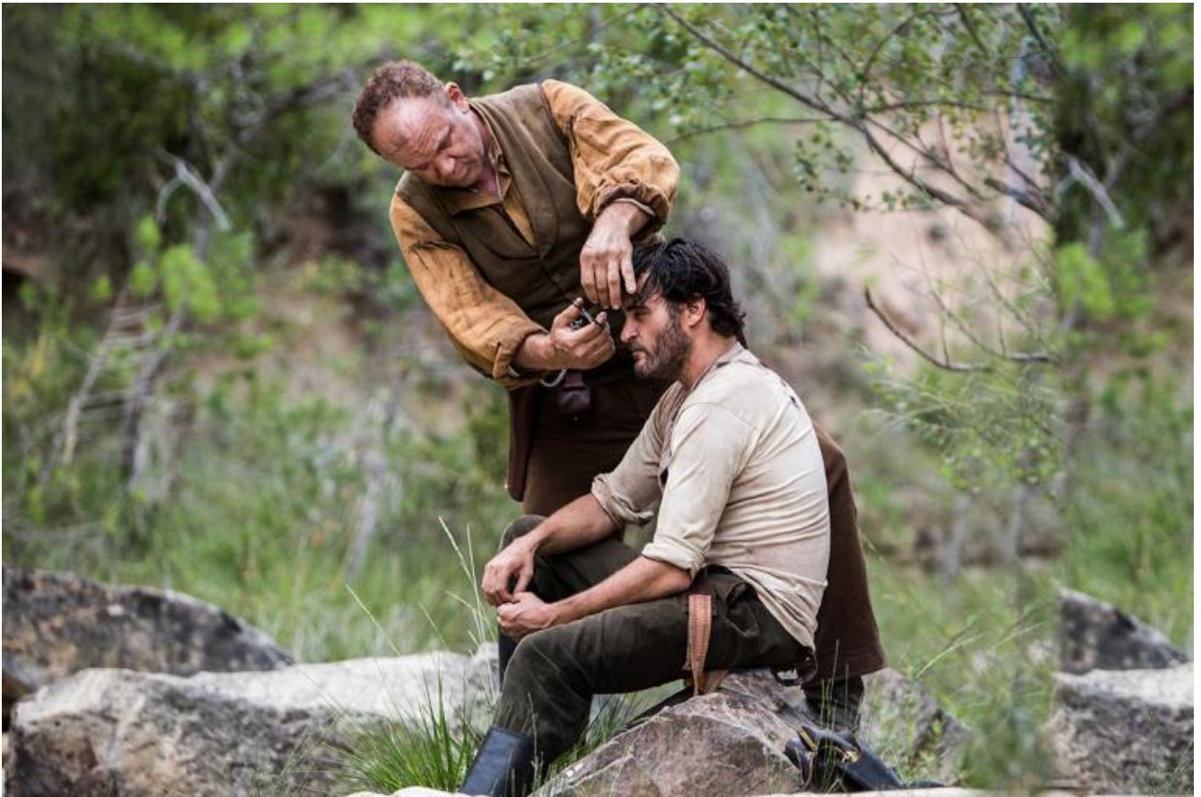
John C. Reilly e Joaquin Phoenix in The Sisters Brothers, di Jacques Audiard

Il punto è che la storia messa in scena dal film non è l'epopea di Eli e Charlie, due sicari assunti per uccidere il cercatore Hermann Warm, in Oregon, nel 1858; ma un romanzo picaresco, con tratti anche queer, che riprende, per rovesciarli, tutti gli stilemi della mitologia western. Pure il film dei fratelli Coen, The Ballad of Buster Scruggs , un'antologia in sei episodi, racconta, rovesciandola, la tradizione dei grandi eroi a cavallo, ma lo straniamento agisce a livello narrativo e stilistico, senza lavorare sulla possibilità di costruire un immaginario altro, nuovo, come fa Audiard, che sperimenta una forma diversa di fratellanza.