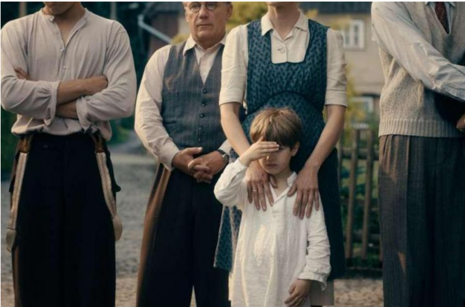
Opera senza autore (Werk ohne Autor), di Florian Henckel von Donnersmarck.

Tra l'altro, tutto questo accade in un momento in cui non solo il cinema d'autrice, ma d'autore mette continuamente in scena una domanda di narrazione e di sguardo rinnovati dal confronto con punti di vista altri, nuovi, occultati e restituiti alla luce. Di continuo i film di Venezia 75, per esempio, tornano sulle mappe dei grandi eventi della modernità (le guerre, il nazismo, il terrorismo) per riguardare la storia da prospettive differenti, trasformando questa urgenza in forma espressiva (attraverso usi sfocati dell'immagine, o dilatando i tempi di racconto, o usando piani sequenza rapidi continuamente attaccati a un unico personaggio). Vale per Peterloo , ma, sia pure assecondando progetti molto diversi, vale anche per i lavori in concorso Opera senza autore , di Florian Henckel von Donnersmarck (Oscar 2007 per Le vite degli altri ); e Napszállta (Tramonto) , di László Nemes, l'autore di Il figlio di Saul (vincitore, nel 2015, del Grand Prix del Festival di Cannes e premiato con l'Oscar al miglior film straniero):