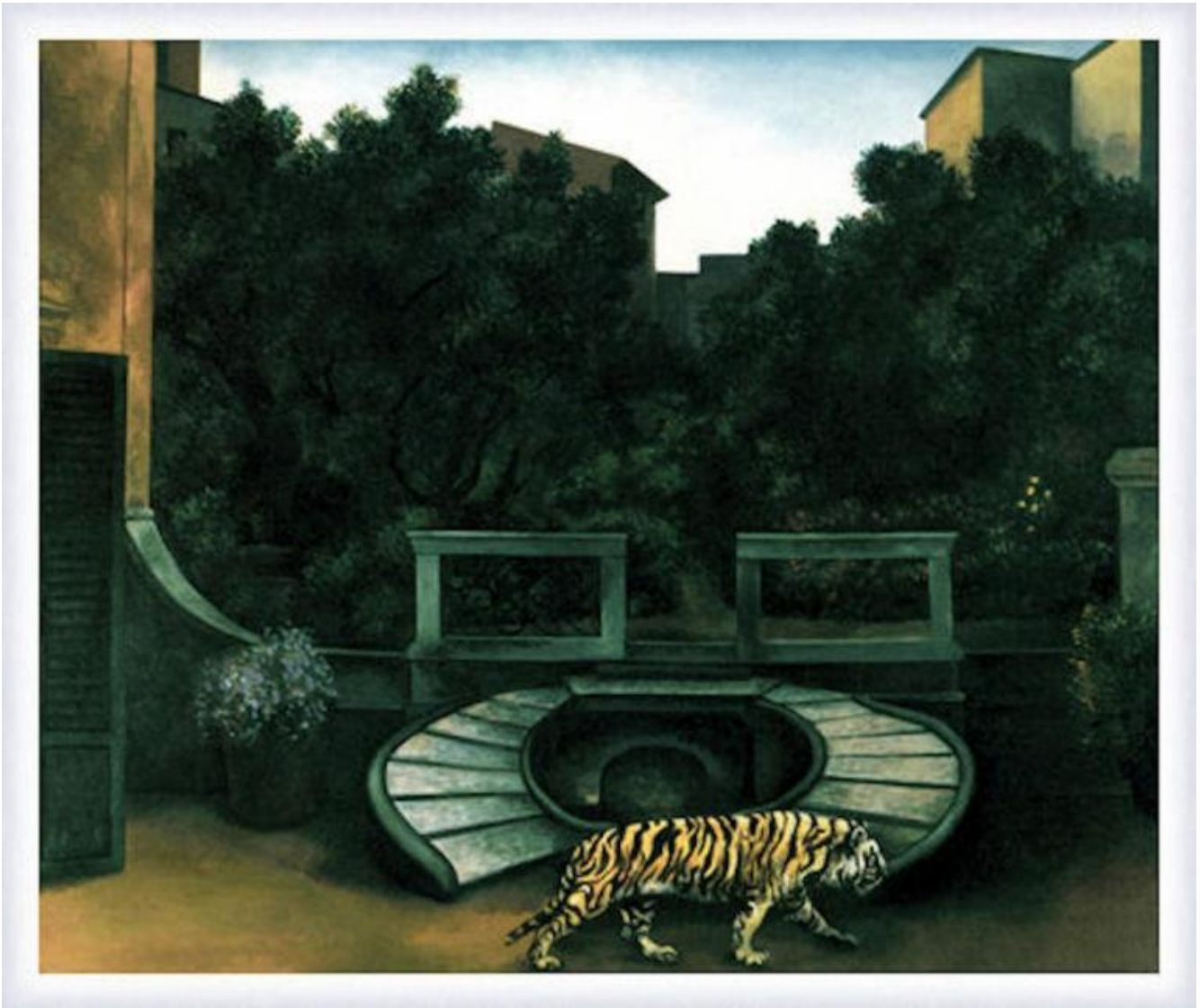
Renato Guttuso, “La visita della sera”.

Eppure, consideriamo tutti questi quattro spettacoli come esempio di teatro, quanto meno per semplice convenzione. Li abbiamo infatti trovati allestiti in un festival teatrale e le persone sono uscite da Crisalide convinte di aver avuto esperienze “teatriche”. La pluralità di proposte di così alto livello e qualità ci porta insomma a un’aporia. Se usciamo dalla confortevole ma problematica dimensione della convenzione che sia teatrale tutto ciò che è ospitato in un festival teatrale, non capiamo che cosa faccia sì che proposte così diverse siano tutte riconducibili alla categoria del “teatro”.