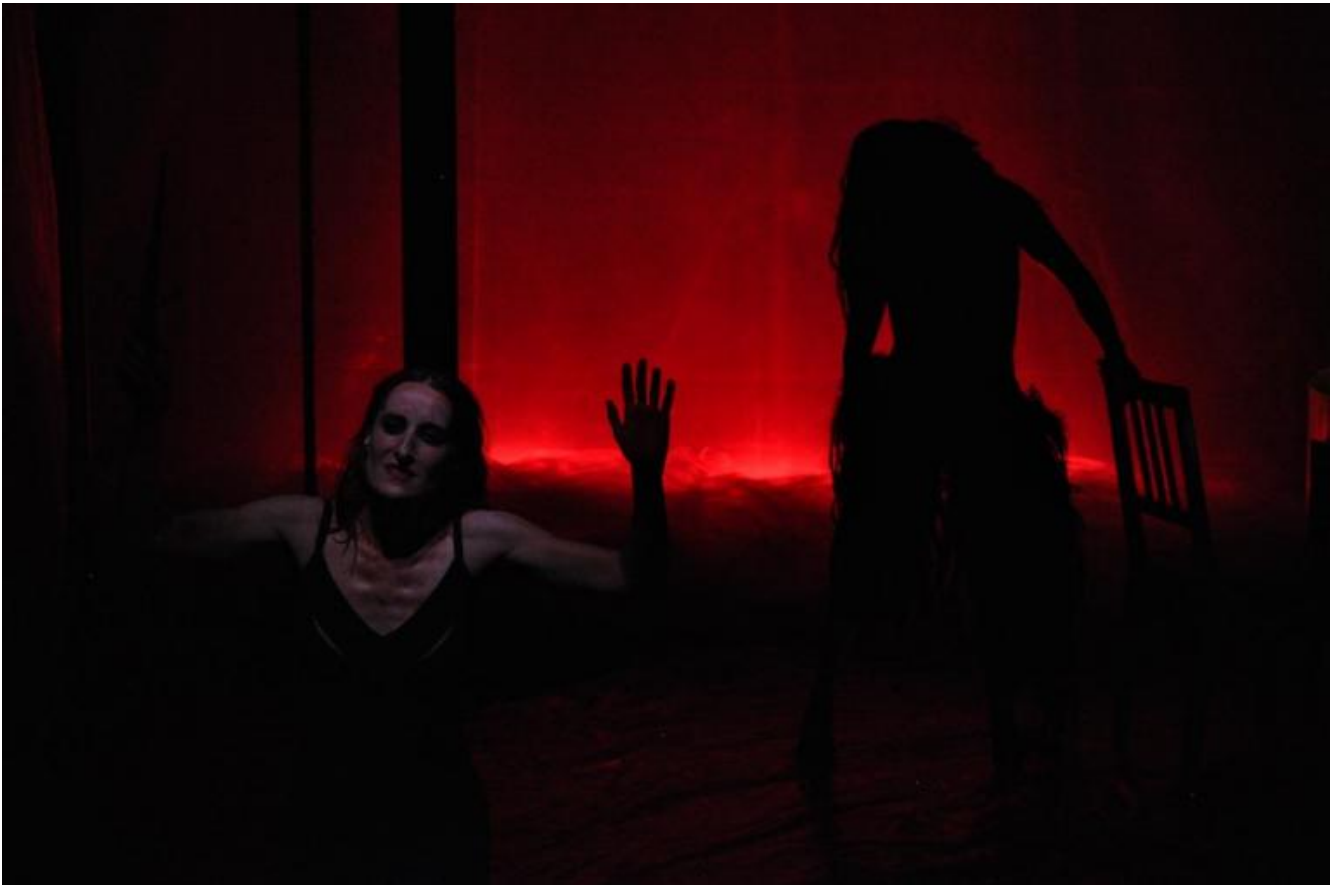
Albe/Masque/Menoventi, "Macbetto", ph. Lorenzo Bazzocchi.

Mi pare che questa domanda costituisca uno dei temi centrali che ispira sotterraneamente quattro degli spettacoli della 25.ima edizione del festival Crisalide , dal titolo L'esperienza selvaggia , andati in scena a Forlì il 14-15 settembre 2018. Mi riferisco a Macbetto, o la chimica della materia di Teatro delle Albe / Masque Teatro / Menoventi, a Luce di Masque Teatro, a Opsia di Paola Bianchi, a Studio sul mito di Demetra di Teatro Akropolis. Parlando in termini molto generali, infatti, ciascuno di questi spettacoli descrive una sorta di movimento "dal dentro al fuori". Essi presentano il teatro come un processo di liberazione di un qualcosa che è nascosto nella nostra interiorità, o nel nostro profondo. Il problema è capire che cosa sia questo "qualcosa". Lo scopo di questo breve intervento è esaminare in estrema sintesi questo problema e parlare al contempo delle quattro proposte artistiche viste/ascoltate a Crisalide .