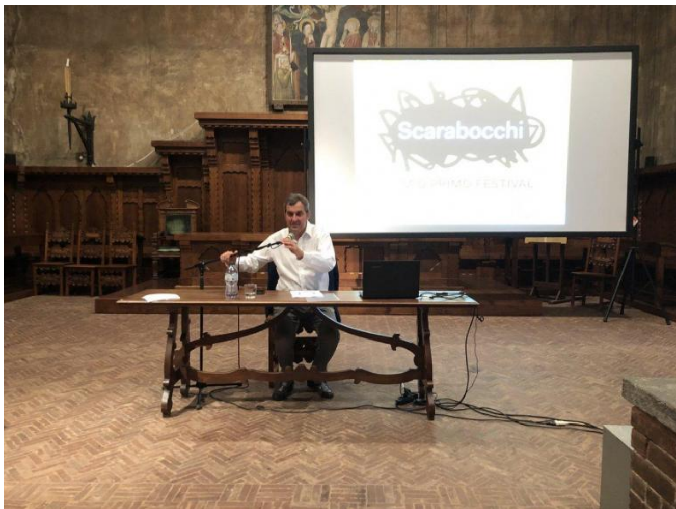
Mario Calabresi racconta Bruno Munari

In soli tre giorni a Novara si sono dati appuntamento per scarabocchiare insieme alcuni tra i più grandi illustratori e artisti italiani, i bambini hanno avuto accesso illimitato a colori, matite e tempere e si sono sbizzarriti in diversi laboratori, gli adulti hanno scoperto i significati degli scarabocchi o come gli scarabocchi nella sabbia possano dire qualcosa di noi, hanno guardato gli scarabocchi di famosi matematici e filosofi e interrogato questi gesti così semplici nel loro rapporto con il disegno.