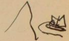
Uno scarabocchio di Albert Einstein

Abbiamo nuovi progetti in testa che cercheremo di realizzare nei prossimi mesi, e questa direzione - del cercare di creare dei momenti per stare insieme e di farlo