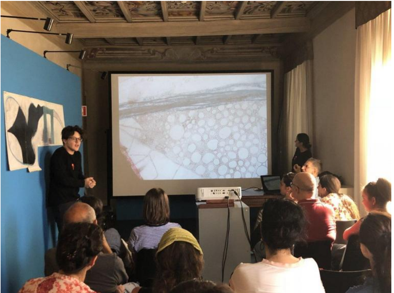
I ragazzi dell'Atelier dell'Errore danno vita agli scarabocchi