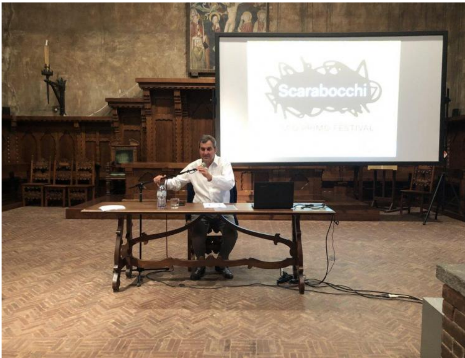
Mario Calabresi racconta Bruno Munari

In soli tre giorni a Novara si sono dati appuntamento per scarabocchiare insieme alcuni tra i più grandi illustratori e artisti italiani, i bambini hanno avuto accesso illimitato a colori, matite e tempere e si sono sbizzarriti in diversi laboratori, gli adulti hanno scoperto i significati degli scarabocchi o come gli scarabocchi nella sabbia possano dire qualcosa di noi, hanno guardato gli scarabocchi di famosi matematici e filosofi e interrogato questi gesti così semplici nel loro rapporto con il disegno.