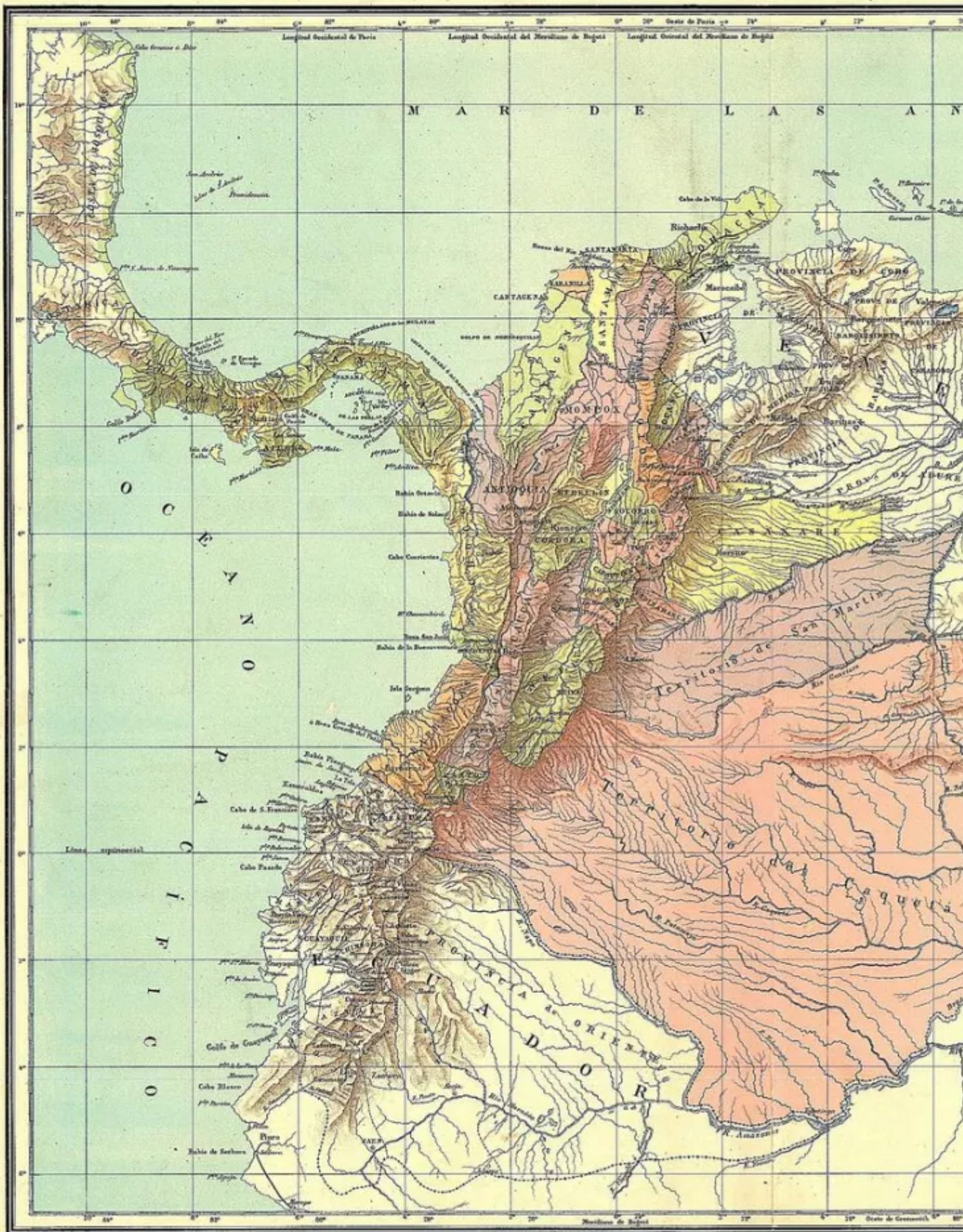
Gravado por Eduard Immanuel, 8 Calle Nueva, Bogotá.