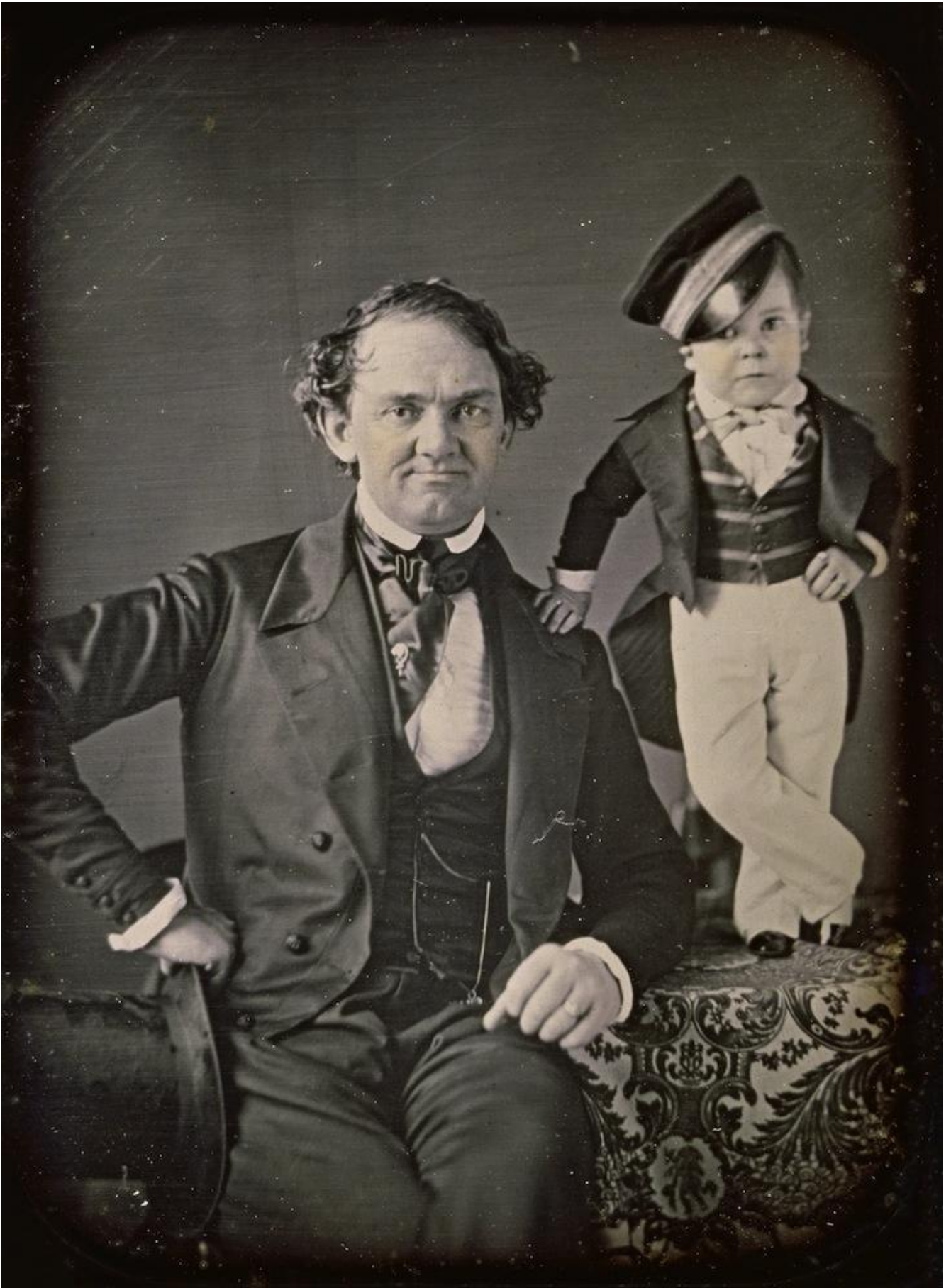
P.T. Barnum e Tom Thumb, 1850 ca.