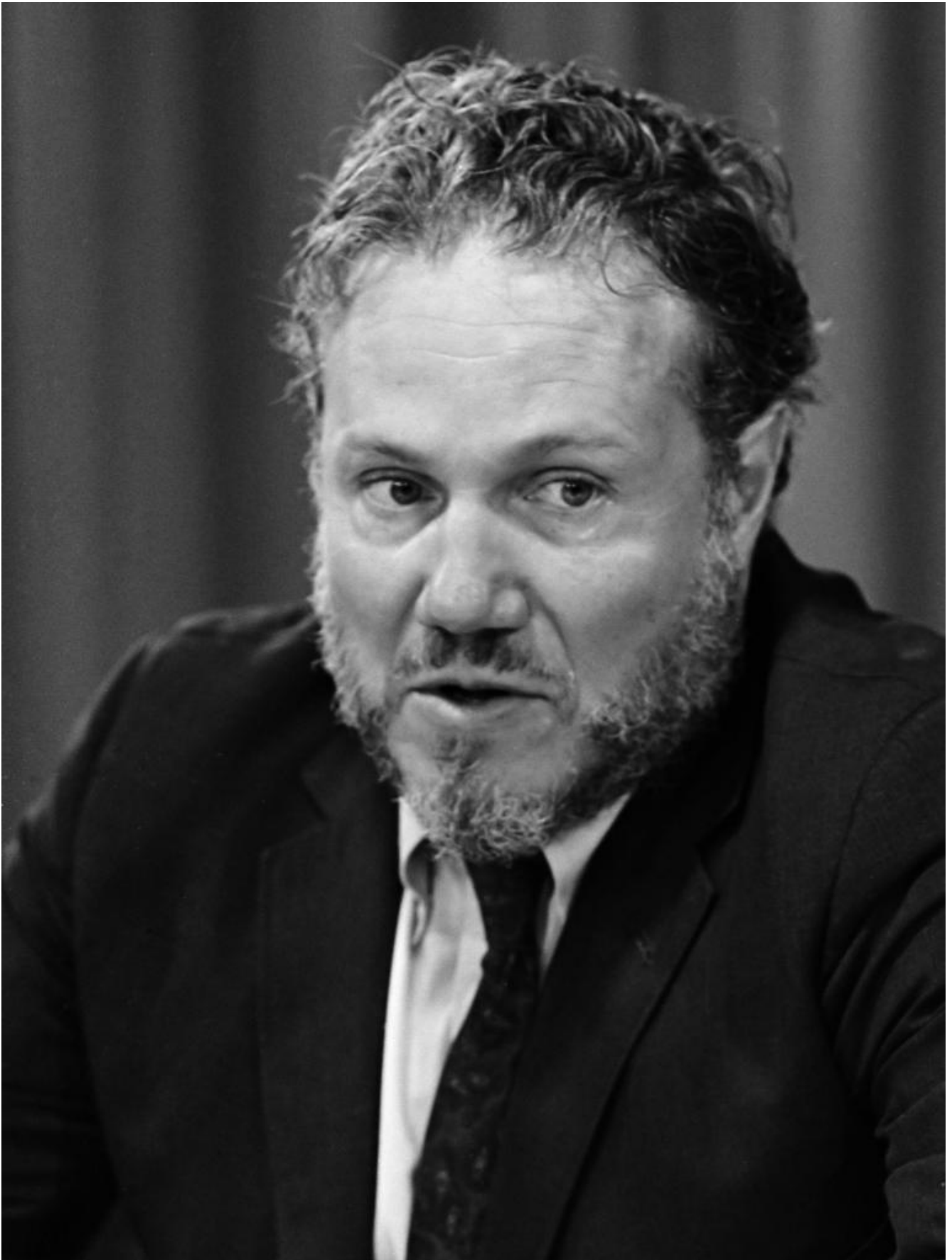
Leslie A. Fiedler nel 1967.