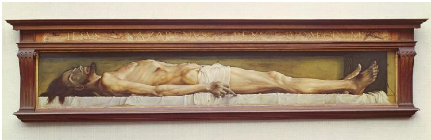
Hans Holbein il Giovane, "Il corpo di Cristo morto nella tomba", (1521). Kunstmuseum, Basilea.