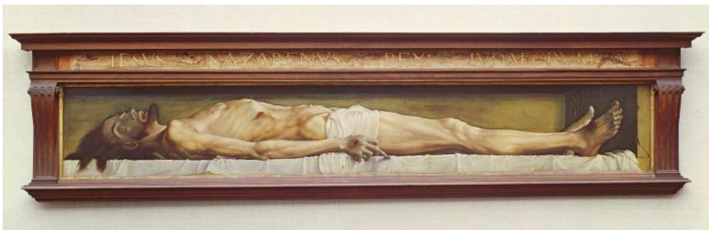
Hans Holbein il Giovane, "Il corpo di Cristo morto nella tomba", (1521). Kunstmuseum, Basilea.