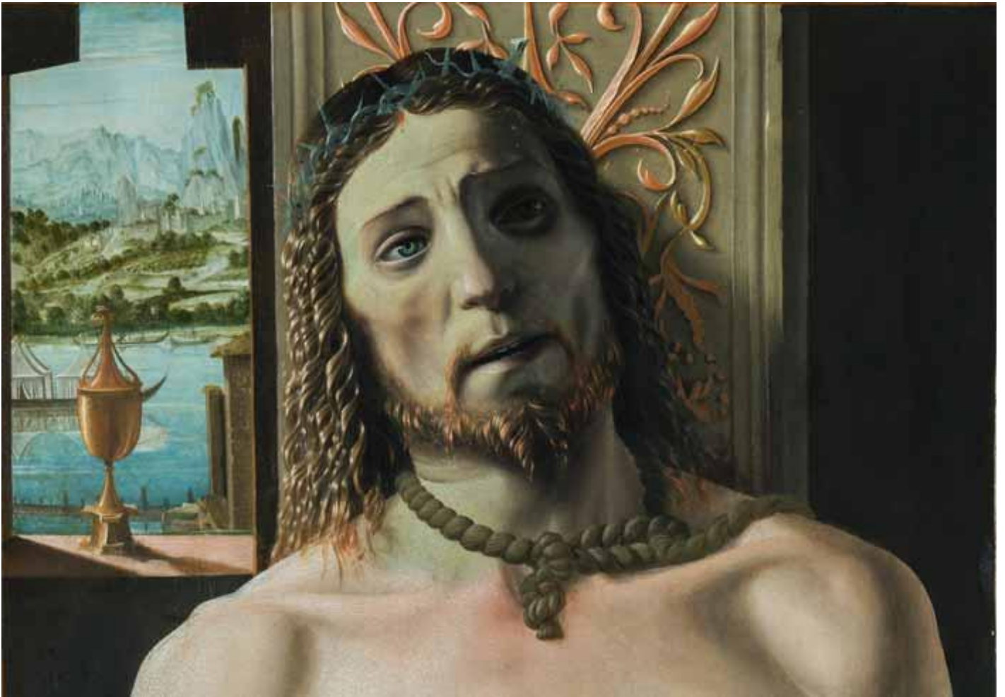
Donato Bramante, Cristo alla colonna (1480-90 ca.). Pinacoteca di Brera, Milano.