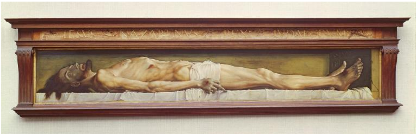
Hans Holbein il Giovane, "Il corpo di Cristo morto nella tomba", (1521). Kunstmuseum, Basilea.

Ma il corpo di Cucchi, testimoniato dalle fotografie che la sorella Ilaria ha fatto scattare all'obitorio e mostrato in nove anni di proteste, è un corpo che non conclude, ma squarcia, offende, disturba. Quel volto inteschiato dalla magrezza, sfigurato dagli ematomi e con gli occhi infossati non dà coerenza; è un corpo irredimibile, tanto che potrebbe far ripensare alle parole usate dal principe Myškin , nell' Idiota di Dostoevskij, davanti a una copia del Cristo morto nella tomba di Hans Holbein (1521): « Ma questo quadro può far perdere la fede! ».