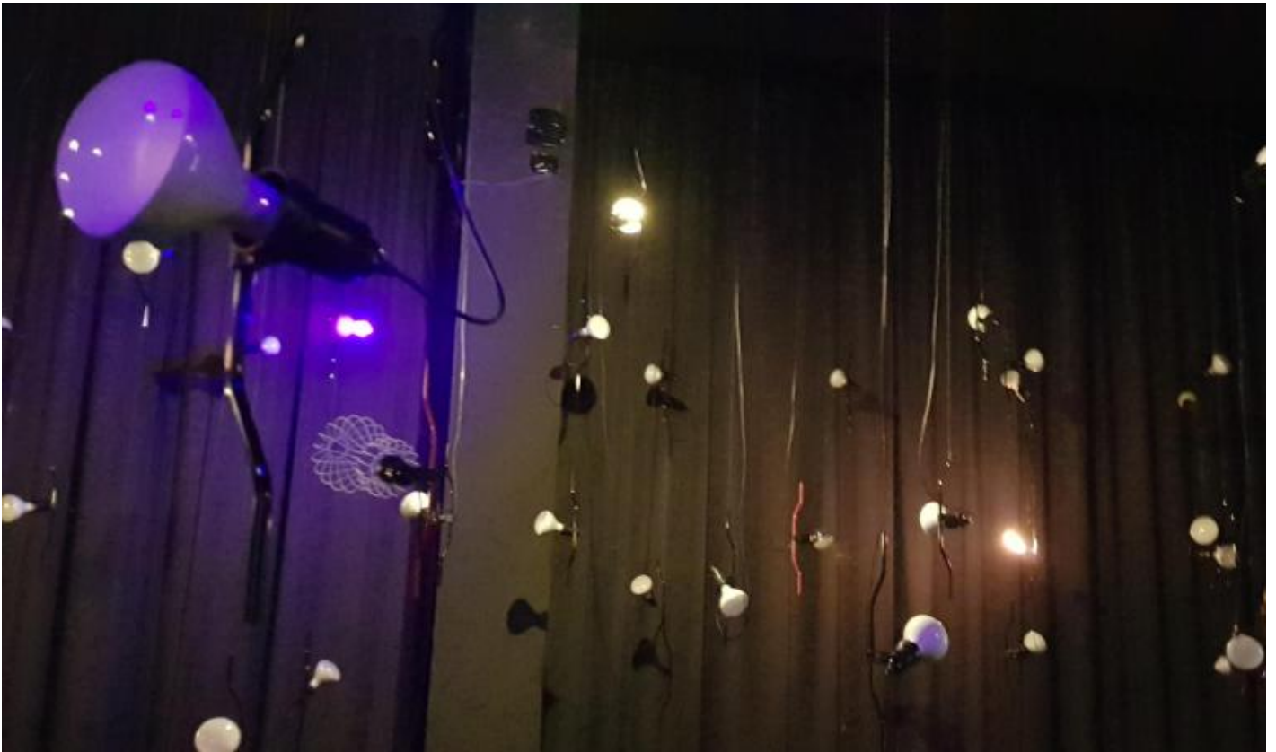
A Castiglioni, il cluster TraParentesi della mostra allestita in Triennale.