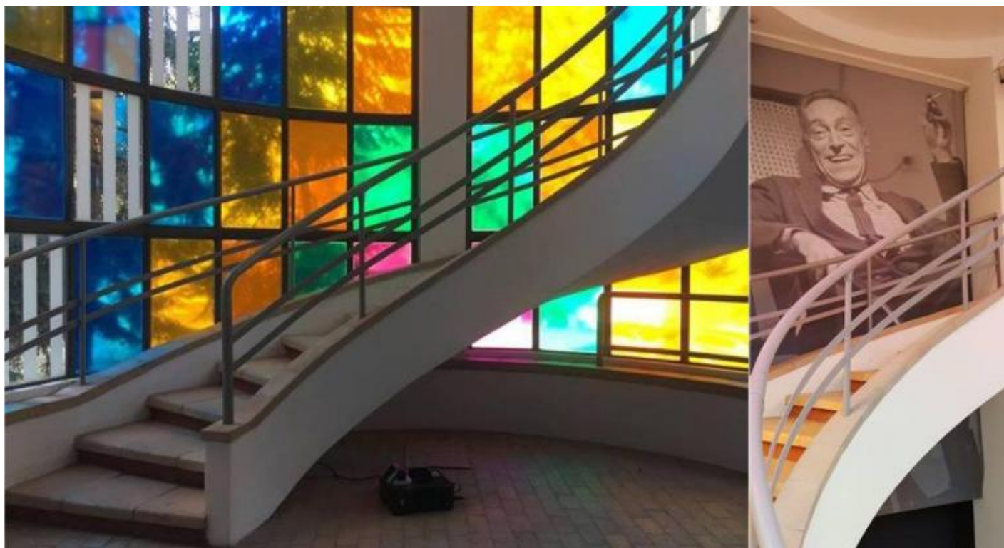
A Castiglioni, la scala di Giovanni Muzio in Triennale; gigantografia di Achille Castiglioni sulla scala che conduce al secondo piano dove prosegue la mostra.