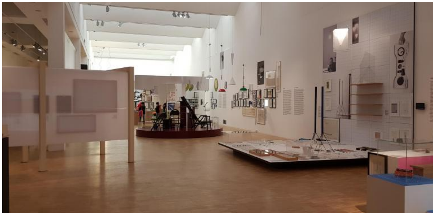
A Castiglioni, uno scorcio della mostra allestita in Triennale.

Il 16 febbraio di quest'anno, giorno del suo compleanno, Doppiozero aveva già trattato delle celebrazioni in onore del maestro, iniziate con la mostra 100 x 100 Achille , ( si legga qui ) organizzata dalla Fondazione che reca il suo nome e ci si era lasciati con la promessa di tornare ad occuparci di lui quando la preannunciata mostra presso la Triennale avesse aperto i battenti.