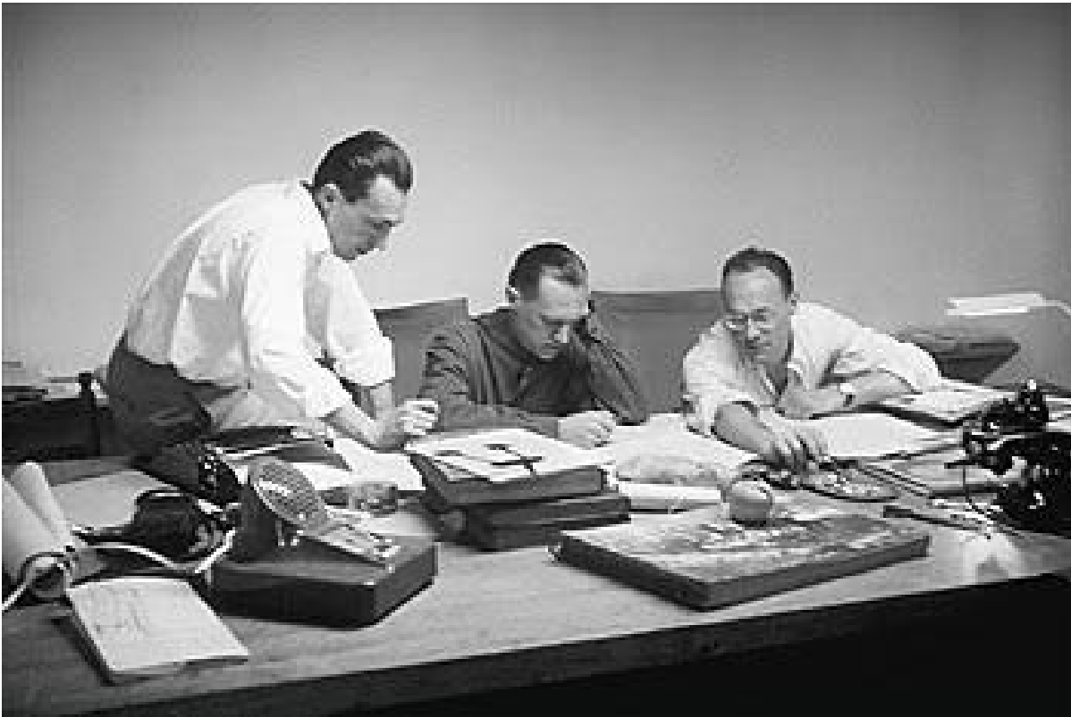
Achille, Pier Giacomo e Livio Castiglioni al lavoro nel loro studio (1952).