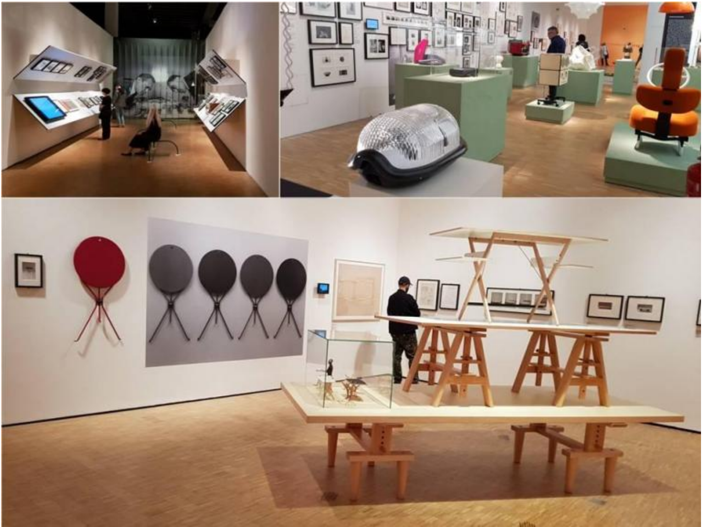
A Castiglioni, alcuni scorci della mostra allestita in Triennale (ph. MLG), sopra il cluster Geometrie, sotto Serviti e riveriti. (ph. MLG).

Achille Castiglioni e il suo studio, tra i più prestigiosi al mondo, hanno allestito più di 400 mostre temporanee e fiere e hanno progettato oggetti per importanti aziende di settore, tra cui Alessi, Brionvega, B&B Italia, BBB Bonacina, Cimbali, Danese, Driade, De Padova, Flos, Cassina, Moroso, Knoll International, Kartell, Zanotta.