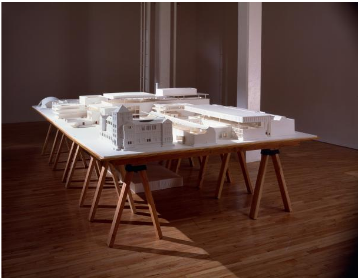
Architectural Site Drawing from Memory (1995)

nella forma di un'epica grottesca e non sublimata.