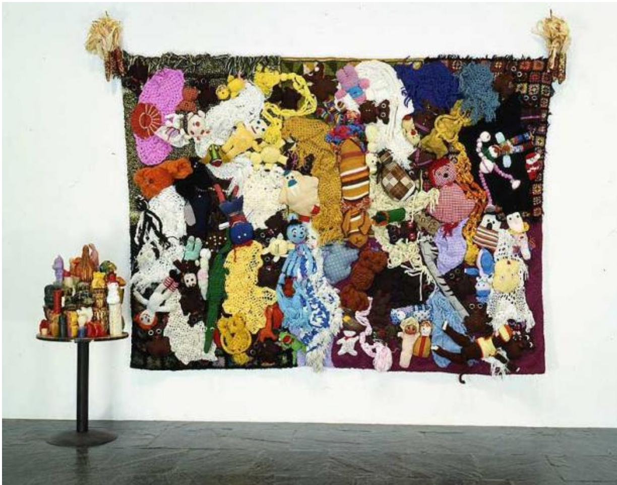
More Love Hours Than Can Ever Be Repaid (1987)

malinconicamente sconfitta in partenza eppure inevitabile, un'immersione volontaria nella vischiosità libidinale del quotidiano in cui i miti e le icone adolescenziali si tramutano in cicatrici traumatiche.