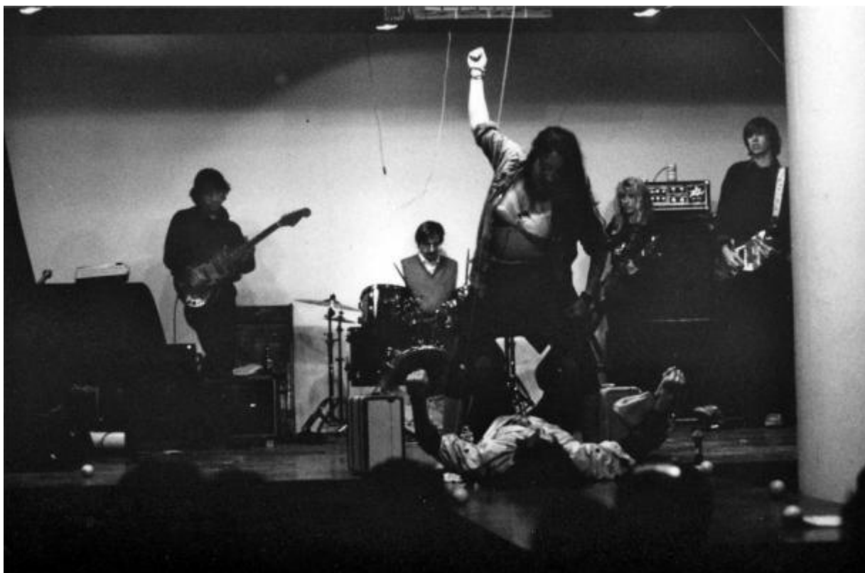
Plato's Cave, Rothko's Chapel, Lincoln's Profile (1985)

una delle matrici della sua opera così come di quella di altri compagni di strada della scena artistica di Los Angeles, da John Miller a Jim Shaw a Paul McCarthy, con i quali ha a lungo collaborato. A Los Angeles Kelley è presto diventato una delle figure di punta di un ambiente artistico molto diverso da quello rarefatto e ultrasofisticato di New York, imprimendovi il suo gusto per la mescolanza dei generi, per l'eccesso e l'accumulazione e anzi rendendo tale apparentemente inammissibile mescolanza una chiave di identificazione per quel variegato gruppo di artisti poi riuniti, a torto o a ragione, sotto l'etichetta post-human . Uno degli esempi più tipici della sua ricerca di una forma espressiva che ingloba, trasgredendoli, brani letterari, elementi visivi, musica e azione scenica è la performance del 1985 Plato's Cave, Rothko's Chapel, Lincoln's Profile , cui prendeva parte anche la band Sonic Youth, una complessa operazione allegorica in cui storie, personaggi, miti, si trovano collegati in forme apparentemente arbitrarie ma poeticamente suggestive all'interno di un environment sonoro.