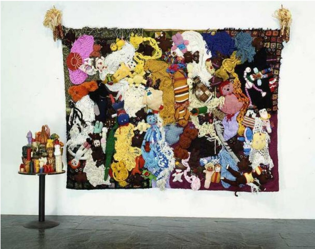
More Love Hours Than Can Ever Be Repaid (1987)