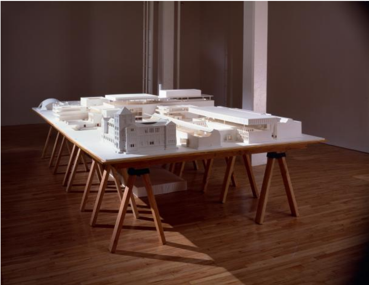
Architectural Site Drawing from Memory (1995)