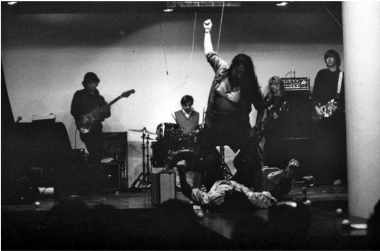
Plato's Cave, Rothko's Chapel, Lincoln's Profile (1985)