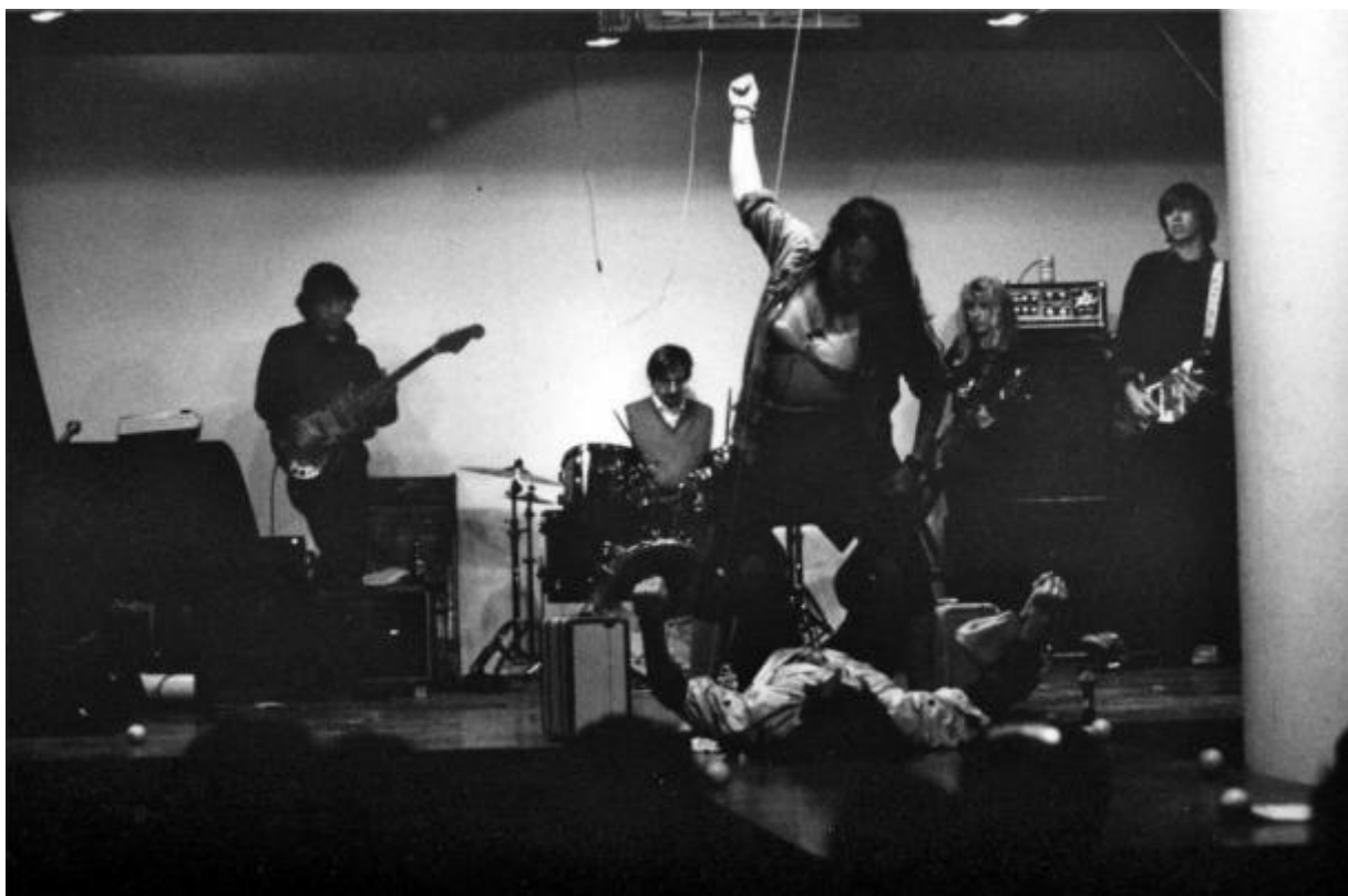
Plato's Cave, Rothko's Chapel, Lincoln's Profile (1985)

una delle matrici della sua opera così come di quella di altri compagni di strada della scena artistica di Los Angeles, da John Miller a Jim Shaw a Paul McCarthy, con i quali ha a lungo collaborato. A Los Angeles Kelley è presto diventato una delle figure di punta di un ambiente artistico molto diverso da quello rarefatto e ultrasofisticato di New York, imprimendovi il suo gusto per la mescolanza dei generi, per l'eccesso e l'accumulazione e anzi rendendo tale apparentemente inammissibile mescolanza una chiave di identificazione per quel variegato gruppo di artisti poi riuniti, a torto o a ragione, sotto l'etichetta post-human . Uno degli esempi più tipici della sua ricerca di una forma espressiva che ingloba, trasgredendoli, brani letterari, elementi visivi, musica e azione scenica è la performance del 1985 Plato's Cave, Rothko's Chapel, Lincoln's Profile , cui prendeva parte anche la band Sonic Youth, una complessa operazione allegorica in cui storie, personaggi, miti, si trovano collegati in forme apparentemente arbitrarie ma poeticamente suggestive all'interno di un environment sonoro.